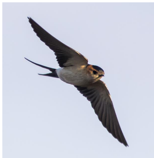
Rostgumpsvala

Ett par vid Dadia ett ex Avas och 2 ex Likofos och några till.