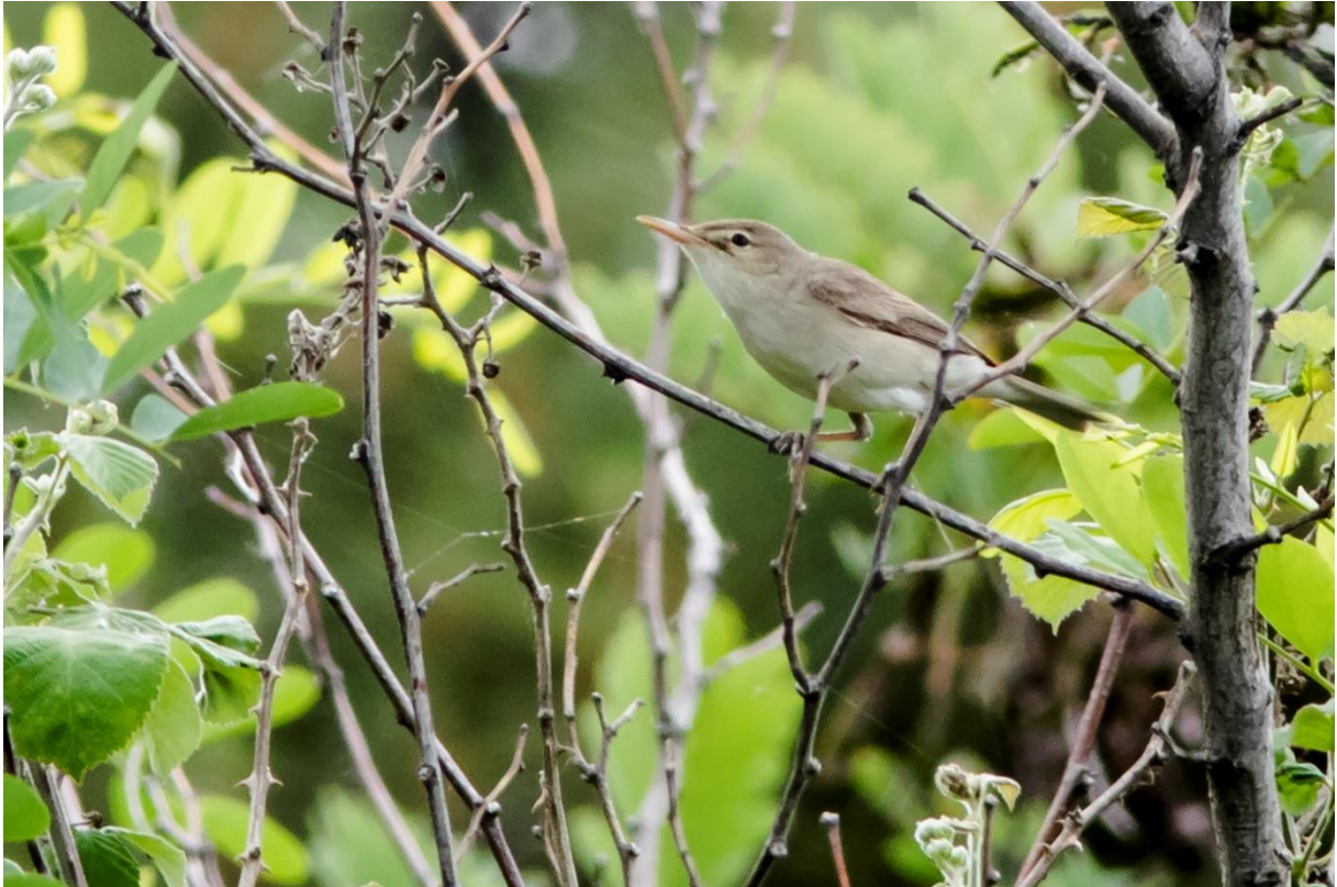
eksångare

hittade en eleonorafalk i skyn. Efter mat och prat åkte vi mot Porto Lagos området. Vi började vid småsumparna vid kusten nedanför Mandra, (väster om själva näset). God sångaktivitet på tättingarna, här finns svarthuvad sparv , kornsparv , fältpiplärka , feldegg-ärla , svartpannad törnska 2 , eksångare (foto ovan: Ingvar Jansson) mm. Över kullarna sågs 2 dvärgörnar , ormörn och örnvråk .