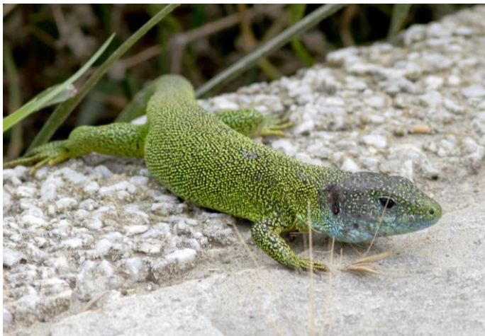
Pärlödla