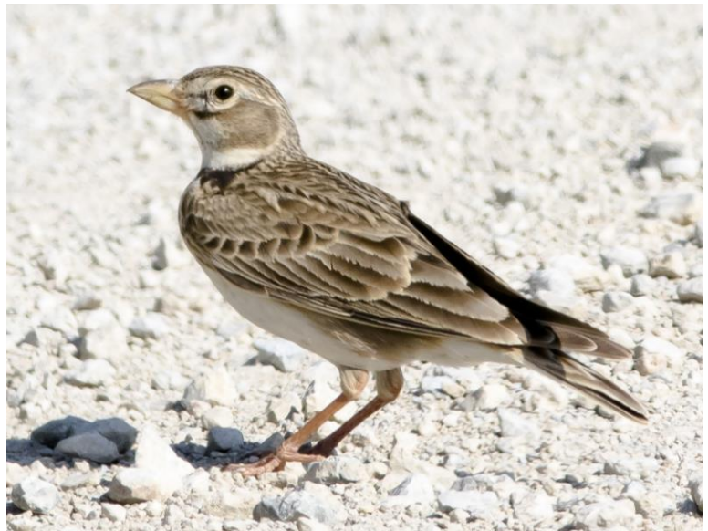
ovan Kalanderlärka, till vänster Korttälärka