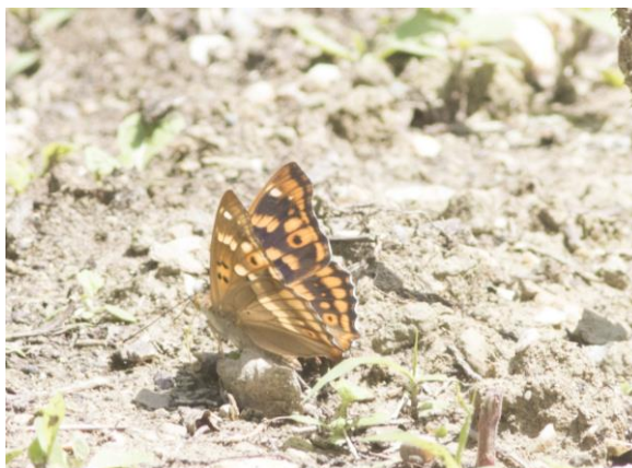
Aspskimmerfjäril