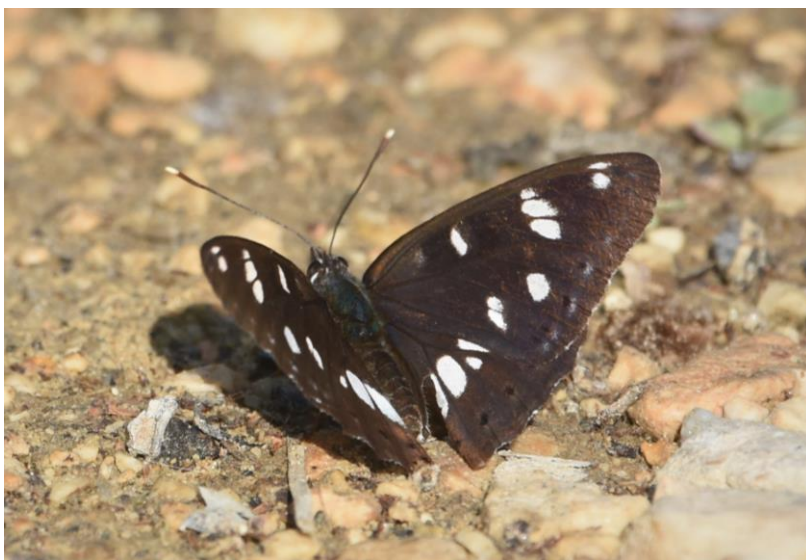
Sydlig tryfjäril