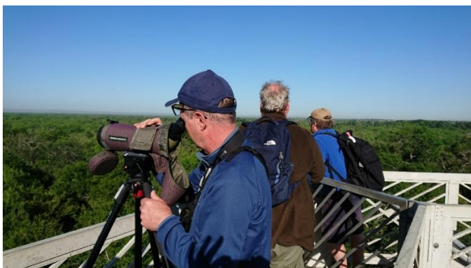
Santa Ana NWR

I skymningen körde vi till Bentsen för att lyssna efter nattskrärror. Vi hörde Chuck-will's-widow, Common Pauraque (5) och såg en Lesser Nighthawk . I ett hål i en telefonstolpe vid entrén såg vi även en Elf Owl som tittade ut vid skymningen.