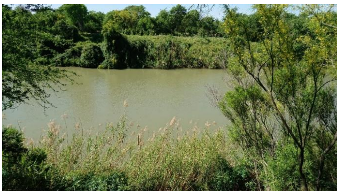
Rio Grande och Mexiko på andra sidan

Nöjda med SPI och Brownsville körde vi ca en timme till McAllen och Bentsen Rio Grande Valley State Park (se Arinder 2013). Det var uppenbarligen för tidigt för Mississippi Kite och vi såg inte heller den lokala specialiteten Hook-billed Kite. Överlag ganska magert med fågel i eftermiddagshettan men vi såg ändå bl.a. Roseate Spoonbill, Tropical Kingbird, Couch's Kingbird, Great Kiskadee, Altamira Oriole, Swainson's Hawk, Harris Hawk, Black Vulture, Crested Caracara, Lesser Nighthawk, Inca Dove, White-tipped Dove, White-winged Dove, White-eyed Vireo, Purple Martin, Golden-fronted Woodpecker, Scissor-tailed Flycatcher . Vi övernattade i McAllen.