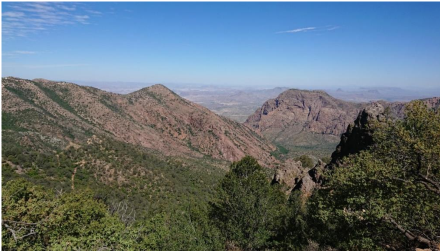
Big Bend NP

Vi körde vid fyratiden på morgonen mot Big Bend National Park (se Arinder 2013). Det var ca 2 timmars körning och vi ville vara på plats i gryningen för att inte missa den högre fågelaktiviteten på morgonen i Big Bend och för att hinna vandra en bit uppåt innan temperaturen steg på dagen. Vi körde till Chisos Mountain Lodge där vi parkerade och sedan började vi gå Pinnacles Trail upp till Pinnacles Pass. Det är här man har chans på den exklusiva Colima Warbler som finns på högre höjd. Vi såg och hörde flera individer av Colima Warbler , den första en bit innan passet och de övriga i ekskogen nedanför passet. Längs stigen och nere vid parkeringen samt på vägen in från Park Entrance hade vi även Say's Phoebe , Hepatic Tanager , Yellow-rumped Warbler (Audobon) , Acorn Woodpecker , Greater Roadrunner , Scott's Oriole , Rufous-crowned Sparrow , Blue-Gray Gnatcatcher , Bewick's Wren , Canyon Wren , Cactus Wren , Mexican Jay , Band-tailed Pigeon , White-winged Dove , White-throated Swift , Spotted Towhee , Pine Siskin , Chihuahuan Raven , Black-throated Sparrow , Curve-billed Thrasher , Northern Mockingbird , Ash-throated Flycatcher .