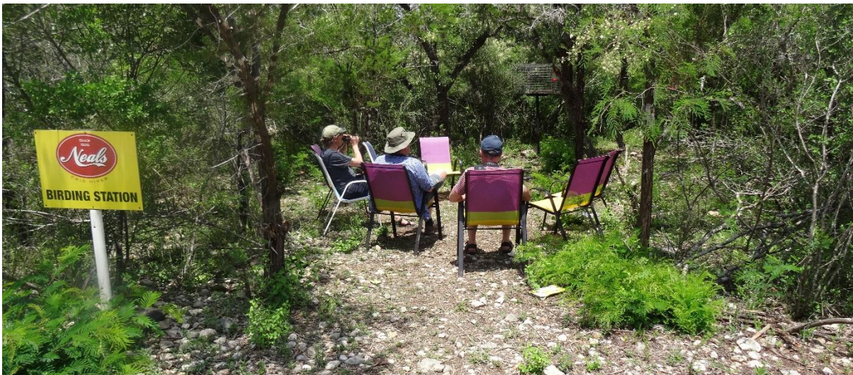
Härdskadning vid Neal's Lodges

Längs vägen såg vi även Wild Turkey . Övernattning i Conroe.