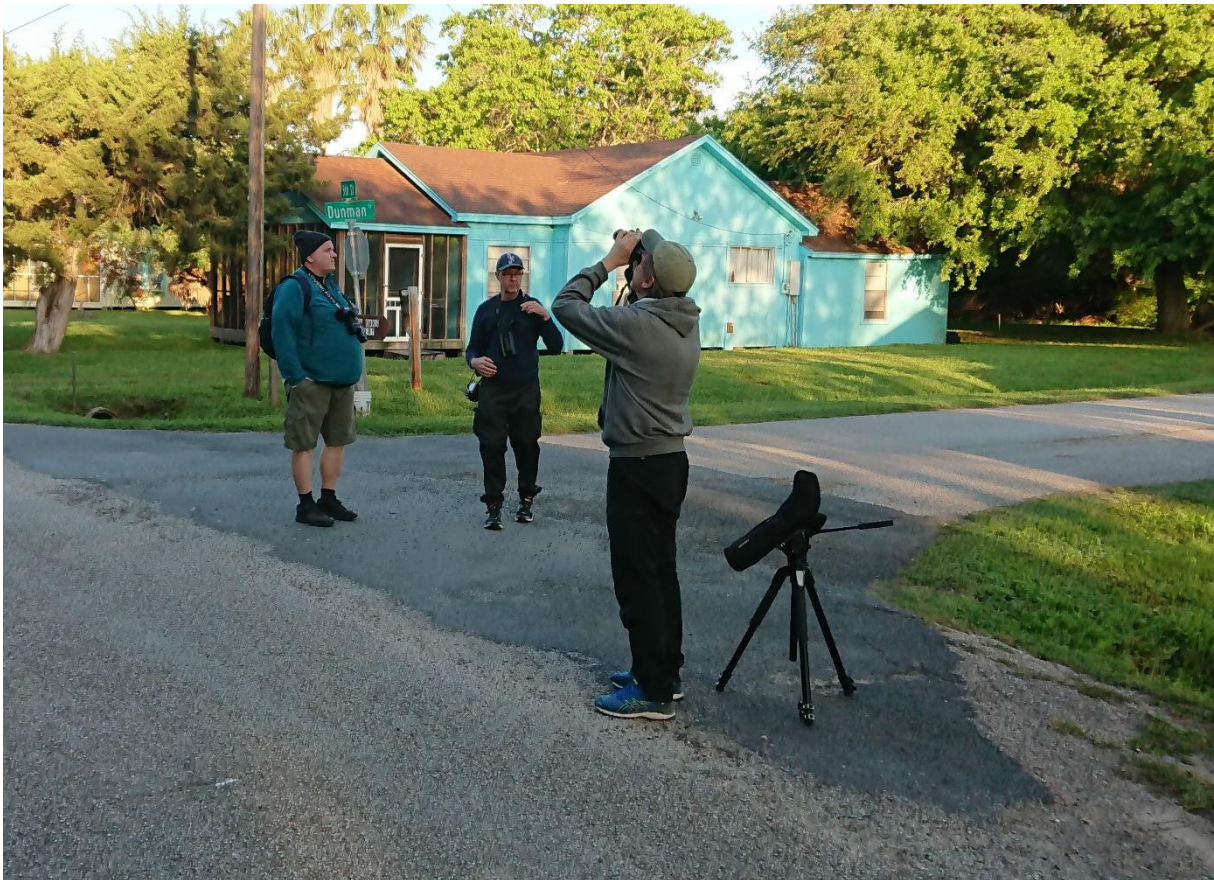
Skådning i High Island

American Coot, Anhinga, Boat-tailed Grackle, Yellow-rumped Warbler (Myrtle), Wood Thrush.