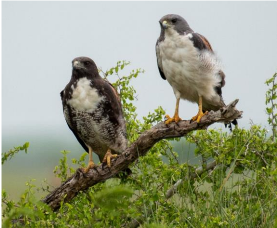
White-tailed Hawk (2K till vänster och ad till höger)

En kvällstur i Brownsville (Honeydale road/Central boulevard) gav dessutom Green Parakeet, Red-crowned Parrot, Curve-billed Thrasher, Cassin's Kingbird, Inca Dove.