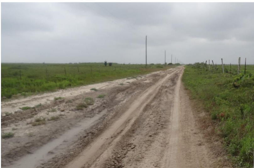
Old Port Isabel Road

På vägen tillbaka till Brownsville åkte vi via Old Port Isabel Road (se Arinder 2013) med förhoppningen om att få se Aplomado Falcon. Någon sådan såg vi dock inte vare sig längs vägen eller vid den uppsatta boplattformen. Vi såg däremot bl.a. Black-bellied Whistling-Duck, Mottled Duck, Ruddy Duck, Gadwall, American Coot, White-faced Ibis, Northern Harrier, Crested Caracara, White-tailed Kite, Swainson's Hawk, White-tailed Hawk (1 2K + 1 ad), Merlin, Chihuahuan Raven, Ladder-backed Woodpecker, Purple Martin, Chimney Swift, Loggerhead Shrike, Scissor-tailed Flycatcher, Savannah Sparrow, Cassin's Sparrow, Lark Bunting, Eastern Meadowlark, Couch's Kingbird.