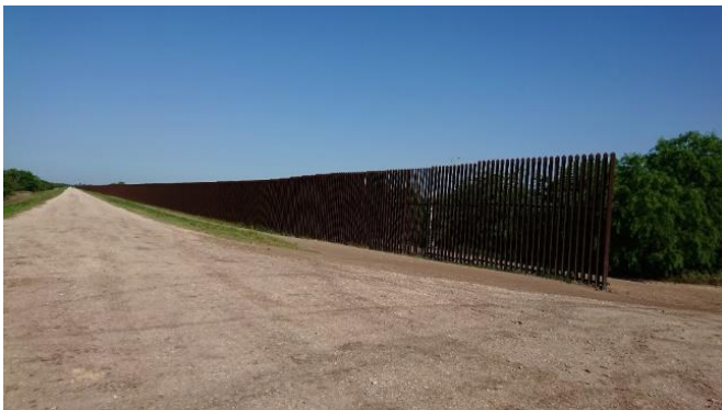
Gränsstaketet vid Sabal Palm

Tack vare ebird och samtal med andra skådare fick vi reda på en annan lokal för Aplomado Falcon vid Laguna Acosta . Det fanns en boplattform uppsatt nära en parkering längs med väg 100. Där såg vi också mycket riktigt två Aplomado Falcon vid plattformen.