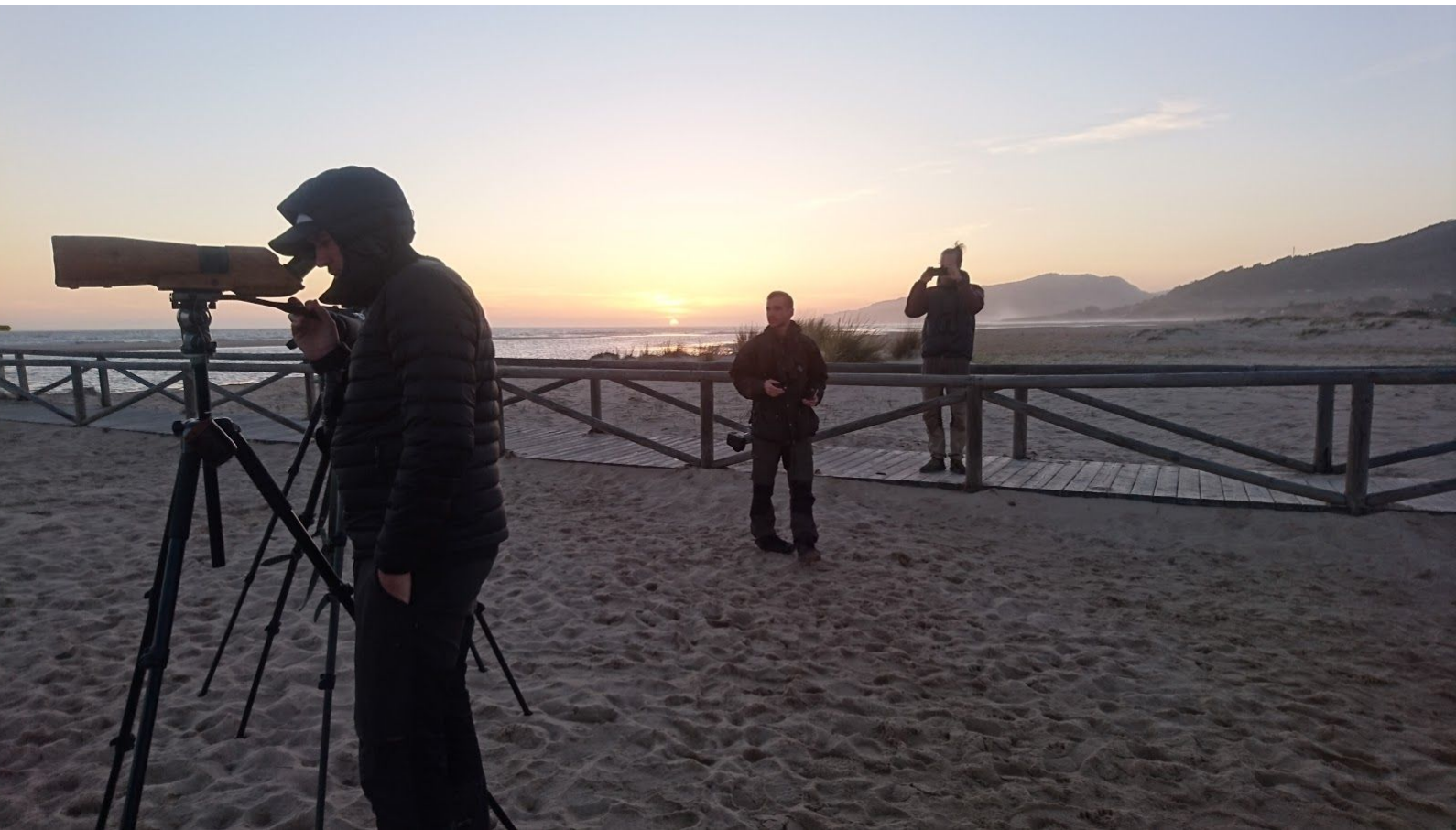
Kvällsspaning utanför campingen i Tarifa.

Vi åkte tillbaka till slätten vid Tahivilla för att fylla ut dagen och efter en stund hittade ett större gäng seglare som födosökte över fälten. En efter en fick vi in individer som såg bra ut för blek tornseglare och till slut kunde vi spika åtminstone en individ efter vissa svårigheter att bekräfta att vi alla följde samma individ. Ju mer vi tittade på seglarna desto enklare blev det att se skillnaden mellan arterna. Vi avslutade dagen med att spana ut över havet i närheten av vår strandnära camping, där sandlöpare sprang omkring på närhåll. Fem rödnäbbade trutar flög förbi och utgjorde nytt reskryss.