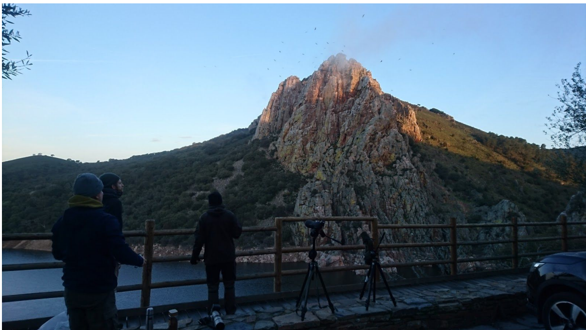
En lite mindre kall morgon vid gamklippan i Monfragüe.

Dagen spenderades i och kring nationalparken Monfragüe, där de huvudsakliga målarterna var spansk kejsarörn, hökörn, svart stenskvätta och Sylvia -sångare. Vi började i västra delen av nationalparken vid en gamklippa intill floden nedanför Castillo Monfragüe.