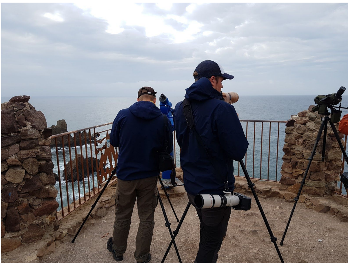
Havsskådning från fyren vid Cabo de Gata.

Resans sista heldag blev en lyckosam tillställning. Efter utebliven lycka nere på slätten begav vi oss mot fyren Cabo de Gata och längs den kuperade kustvägen fick vi syn på några ökentrumpetare som var relativt orädda kring bergssidorna på båda sidor vägen. Nöjda fortsatte vi till fyren och tog ett sista pass havsspaning, med nya arter i balearisk lira och tordmule , samt gamla bekantskaper i form av rödnäbbad trut , rödhöna , storlabb och svart stenksvätta . En spännande alka som mycket väl kunde varit en lunnefågel hann undan utan säker artbestämning. När första turistbussen kom kände vi oss nöjda och satte kurs tillbaka mot Madrid. Vi rekade intressanta herdesångar-lokaler på vägen dit, och var på väg upp på ett berg, men fick vända när vägen övergick till stig.