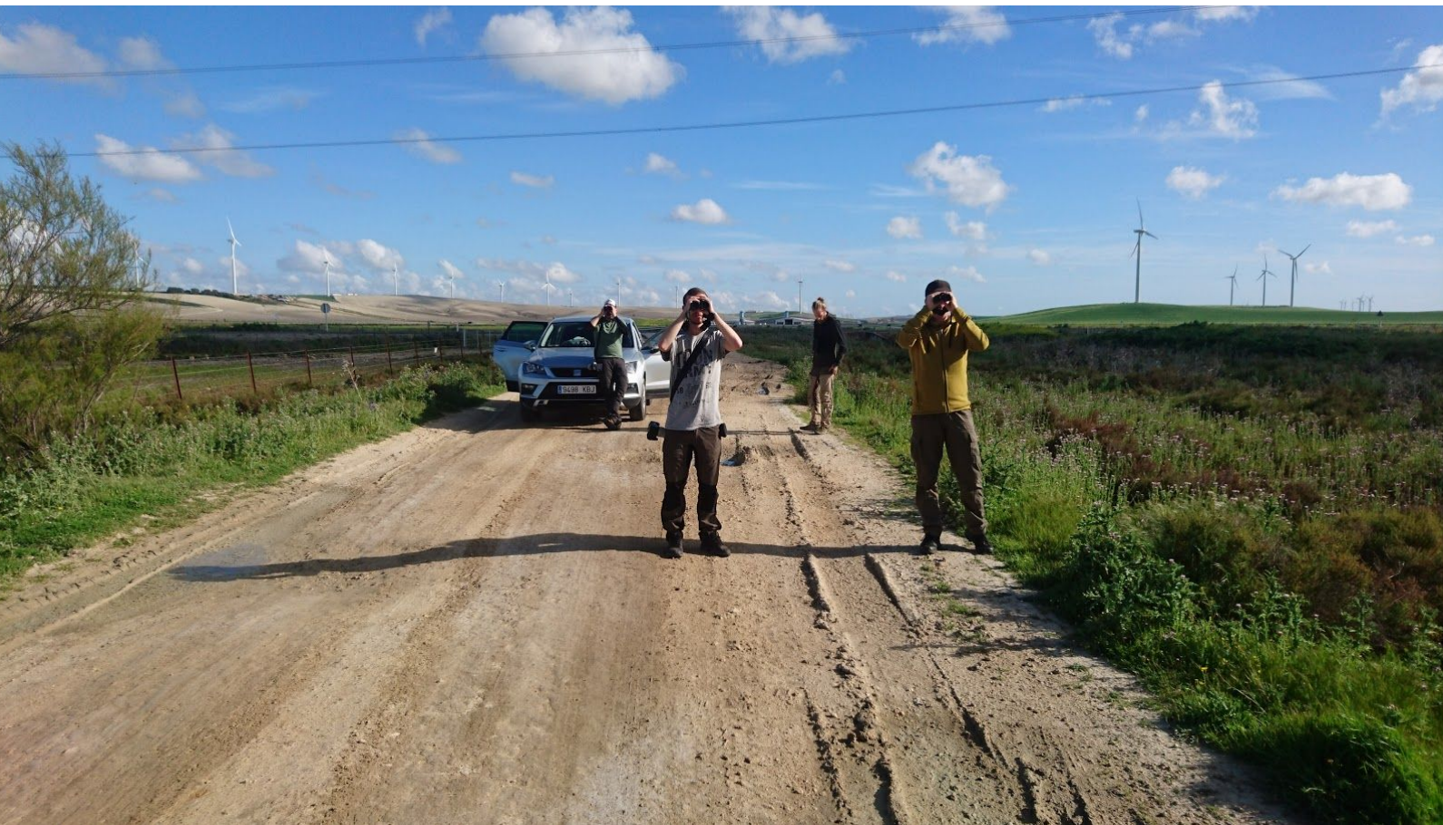
Glasögonsångare i kikarna utanför Trebujena.