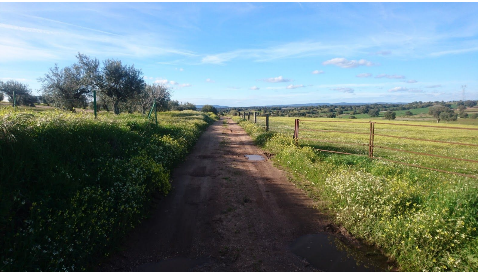
Beteslandskap vid Monroy.