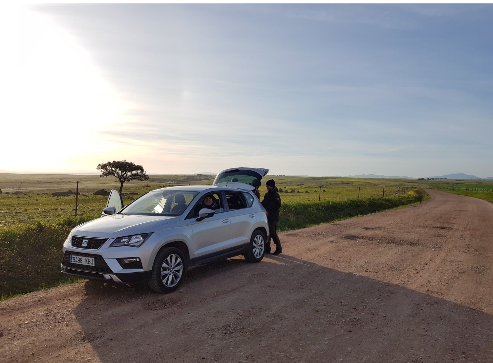
Vår eminenta Seat Ateca vid Extremaduras slätter.

Vi hade bokat en stor bilmodell från Avis och kunde välja mellan två olika bilar på plats. Vi valde en Seat Ateca, som hade hyfsad markfrigång och precis tillräckligt med utrymme för fem personer med packning inklusive full campingutrustning. Bilen fungerade perfekt men kunde gärna ha varit aningen större. Vi städade den inuti lite innan vi lämnade tillbaka den, men utanpå var den ganska skitig. Vi fick dock inte någon straffavgift, så allt löstes säkert med en vanlig biltvätt.