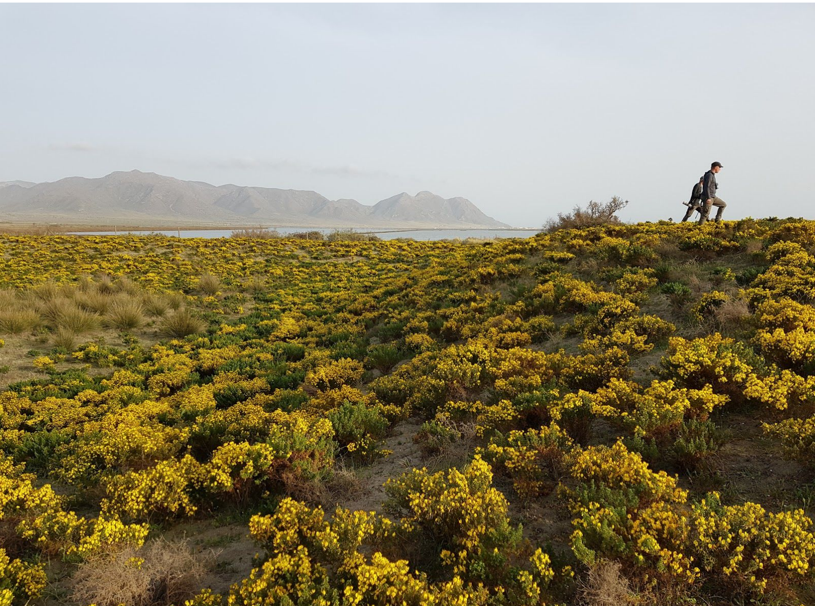
Gult ginst-hav utanför Cabo de Gata.

Medelhavet. Ganska omedelbart fick vi in ett gäng munkparakiter som ljudligt passerade över våra huvuden. Kort efter det fick en av oss in en flock röd tigerfink hastigt förbiflygande, men trots idogt eftersök kunde inte övriga deltagare få in arten. Vi tog en lunchpaus i den 22-gradiga värmen med en skaldjurspaella på stranden (resans enda restauranglunch) innan vi gick in i parken för ett andra försök på tigerfinkarna. Eftersöket blev tyvärr fruktlöst, men andra arter vi såg i parken inkluderade kopparand, kungfiskare och rostsångare .