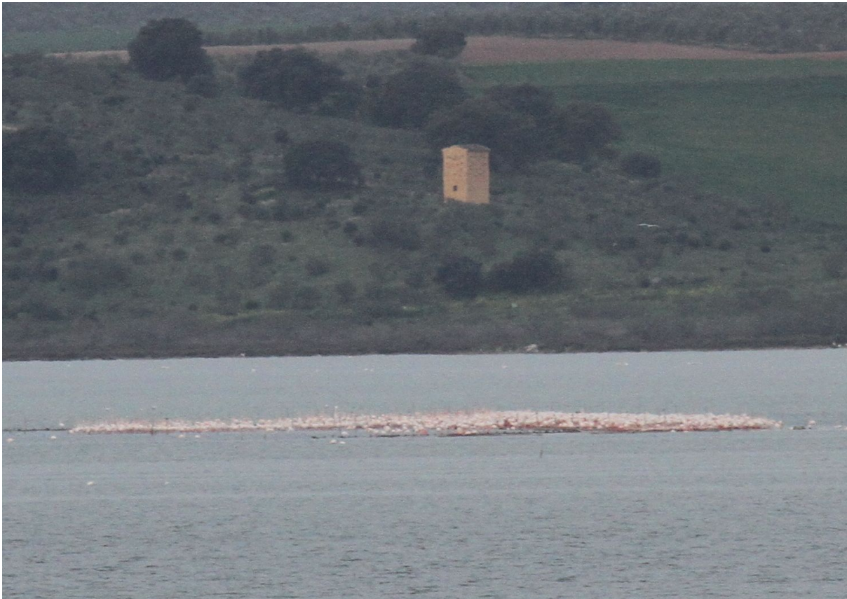
I framkant av den stora flamingo-klumpen skymtades två mindre flamingo.

Morgonen började vid Laguna de Fuente de Piedra Visitor centre, som blickade ut över våtmarken där två mindre flamingos befunnit sig ett tag. Långt bort i lagunen stod en stor klump med flamingos, och en viss känsla av hopplöshet spred sig, med vetskapen att de kunde vara helt omöjliga att få syn på i klumpen. Trots avståndet så kunde vi dock urskilja ett par mindre, betydligt mer djuprosa individer och succén var ett faktum. Bättre obs än så fick vi inte men ett kryss är ett kryss och mindre flamingo var nog det tyngsta på hela resan. Efter en tids spanande över närliggande fruktodlingar fick vi även in resans enda skatgök , en efterlängtd art som vi fick arbeta en hel del för.