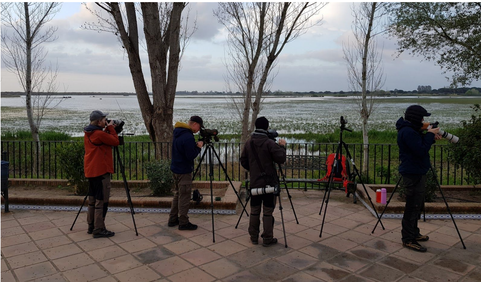
Våtmarksspaning i El Rocio.

Denna dag var helt ägnad åt nationalparken Doñana. Vi började i Marismas del Rocio, en våtmark i sandstaden El Rocio där vi hade tältat. Här fick vi in ett antal förväntade våtmarksarter, såsom bronsibis , skedstork , rallhäger , större flamingo och rödvingad vadarsvala , men blev även positivt överraskade av både sandtärna och skäggtärna . Härifrån försökte vi gena via småvägar över nationalparken, men körde först fast i sanden och upptäckte sedan att våra tilltänkta genväg var avstängd. Denna återvändsgränd gav dock resans första sydnäktergal och helenaastrild .