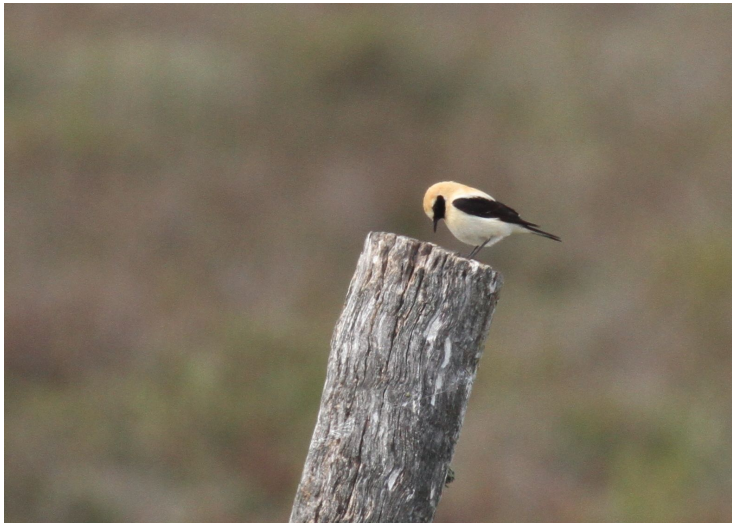
187 Svart stenskvätta / Black Wheatear Oenanthe leucura

2 ex Presa de Alange, 4 ex Montejaque, 1 ex Cabo de Gata