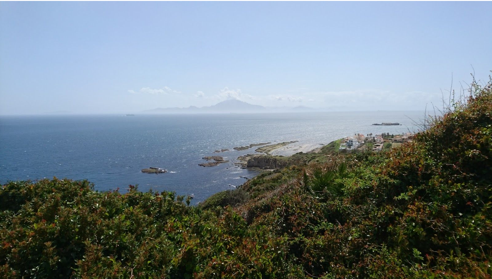
Marockos klippiga kust bortom Gibraltar sund.

Britterna sa att bulbylen höll till vid “parkeringen” i Tarifa, något vi då tyckte var lite vagt men väl där var det uppenbart vad som avsågs, nämligen en stor inhägnad betalparkering. I borte änden av parkeringsområdet fanns en lummig parkmiljö som vi spanade av ett tag men som endast belönade oss med en minervauggla. Snart hörde vi dock misstänkta ljud och lyckades lokalisera trädgårdsbulbylen rörlig bland några palmer i gatumiljön. Fågelguiden anger att denna art närmast finns över sundet i Marocko, men på e-bird kan man se att det finns obsar av arten i Tarifa från 2013 och framåt. Kanske är en permanent etablering på gång?