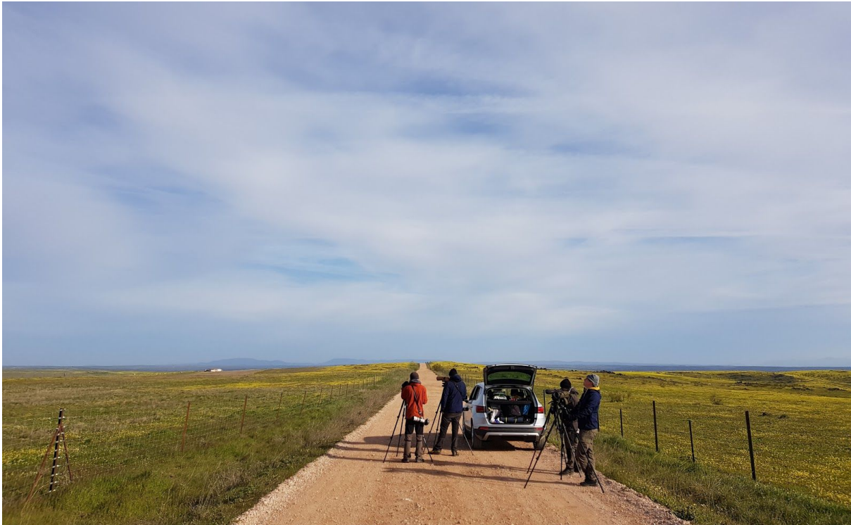
Extremaduras vidsträckta stäpper.

Vi stannade regelbundet för att spana av slätterna och fick fantastiska obsar av spelande småtrapp . Efter några stopp hörde vi bubblande läten från luften och efter en kort tids febrilt spanande fick vi till slut in flocken med vitbukiga flyghöns , den av flyghönsarterna som vi trodde skulle bli svårast! Det var först senare under eftermiddagen som vi fick in vår första flock svartbukiga flyghöns och allt som allt hade vi betydligt fler obsar av den vitbukiga arten. Vi vände vid en gård och begav oss tillbaka mot stora vägen, såg våra första rödfalkar , och precis innan vi kom ut på denna flög fyra stortrappar rätt över bilen och landade på betydligt behagligare avstånd än tidigare. Efter en snabb justering av vår position fick vi finfina obsar där de ståtligt spatserade på heden. Helt klart en av resans höjdpunkter!