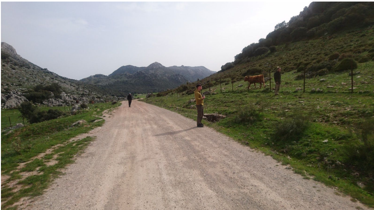
Fruktlös jakt på herdesångare i Montejaque.

Lagom urblåsta lämnade vi kusten och åkte inåt i landet mot bergen kring Montajaque, ett område där det mellan varven ses Rüppelgam. Efter att ha irrat omkring med bilen på byns smala gator med nästintill kirurgiska manövrar hittade vi rätt väg upp mot bergen. Vi fick snart syn på kretsande gamar och hittade en som vi hetsade ganska länge på, men som efter bildstudier visade sig vara en gåsgam. Det var dock tur att vi stod där och hetsade på gamar, för under tiden kom ett par efterlängtade hökörnar och kretsade på väldigt behagliga avstånd innan de drog över byn och vidare. Under eftermiddagen fortsatte vi på bergsvägen med regelbundna stopp och hade arter som svart stenskvätta , blåtrast , ringtrast , alpråka och klippsparv . Vi hörde också en hoande Minervauggla , vilket var ett trevligt inslag. Det var även här vi gjorde våra sista riktiga försök på herdesångare, antagligen den art vi slet mest för, men vi var lite väl tidiga på året och fick aldrig någon utdelning.