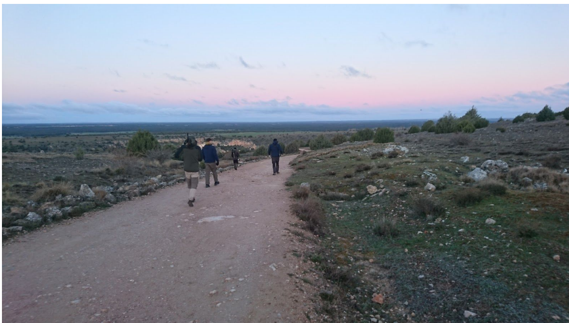
En kall morgon vid Parque Natural Hoces del Río Duratón.

Vi lämnade campingen strax innan gryning och körde mot nationalparken Hoces del Río Duratón. Den huvudsakliga målarten var dupontlärka och den bästa chansen att få in arten i området är längs den sista biten av grusvägen som leder fram till parkeringen ovanför kapellet Ermita de San Frutos. Vi åkte sträckan under gryningen med nervevade bilrutor och många stopp, med arter såsom rödhöna och svartkråka , men dupontlärkan uteblev. Vi promenerade ner till kapellet och fick fina obsar av blåtrast , lagerlärka , alpkråka , iberisk varfågel och uppemot 100 gåsgamar när temperaturen stigit lite. Längs grusvägen tillbaka gjorde vi ytterligare försök på dupontlärka men utan framgång. Vi var medvetna om att datumet var ganska tidigt för dupontlärka, men de borde kunnat vara på plats. Den sena våren i allmänhet och den kalla morgonen i synnerhet gjorde det nog extra svårt.