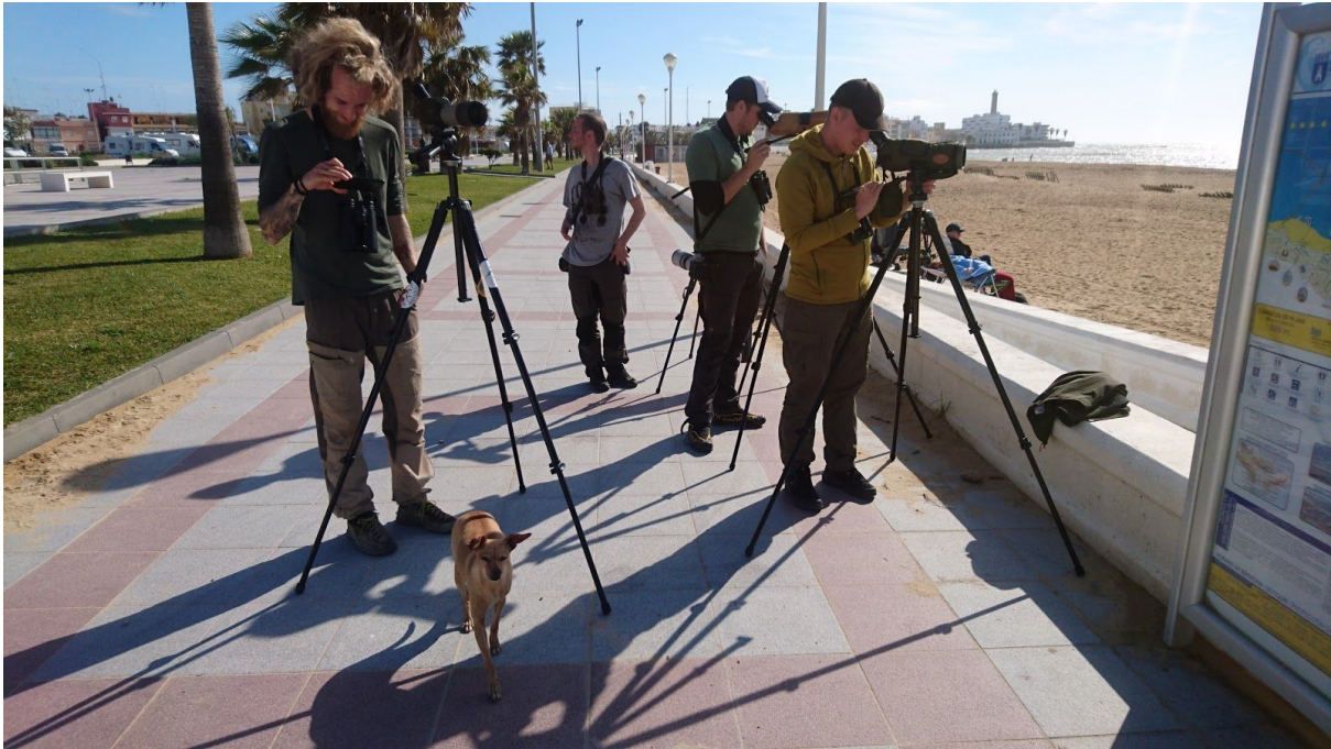
Typiskt habitat för stubbstjærtseglare i Chipiona.

Mätta på våtmarker för dagen gav vi oss av mot en annan lokal och sällsynt art nämligen stubbstjærtseglare. Vi hade en koordinat vid hamnen i Chipiona som vi körde till, och kände oss lite malplacerade när vi anlände till en central strandboulevard. Vi hann precis börja undra om detta verkligen var rätt plats innan vi såg en stubbstjærtseglare förbiflygande över palmerna. Tre stubbstjærtseglare såg vi totalt, mellan varven flygande in under taket på en större hamnbyggnad.