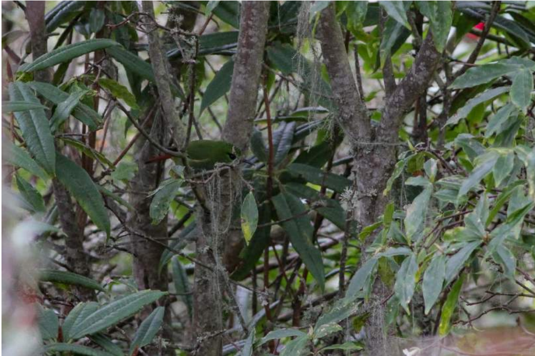
Bild 9. Fire-tailed Myzornis var snabb och svårfotoferad.

Uppe på krönet nådde vi den ytterst märkliga byn Mandala som såg ut som någon slags sjaskig gruvby från guldruschen med baracker till hus byggda av trälådor. Idag var Mandala helt övergiven och spöklik eftersom precis alla invånare hade gett sig iväg för att försöka få en skynt av Dalai Lama i dalen nedanför.