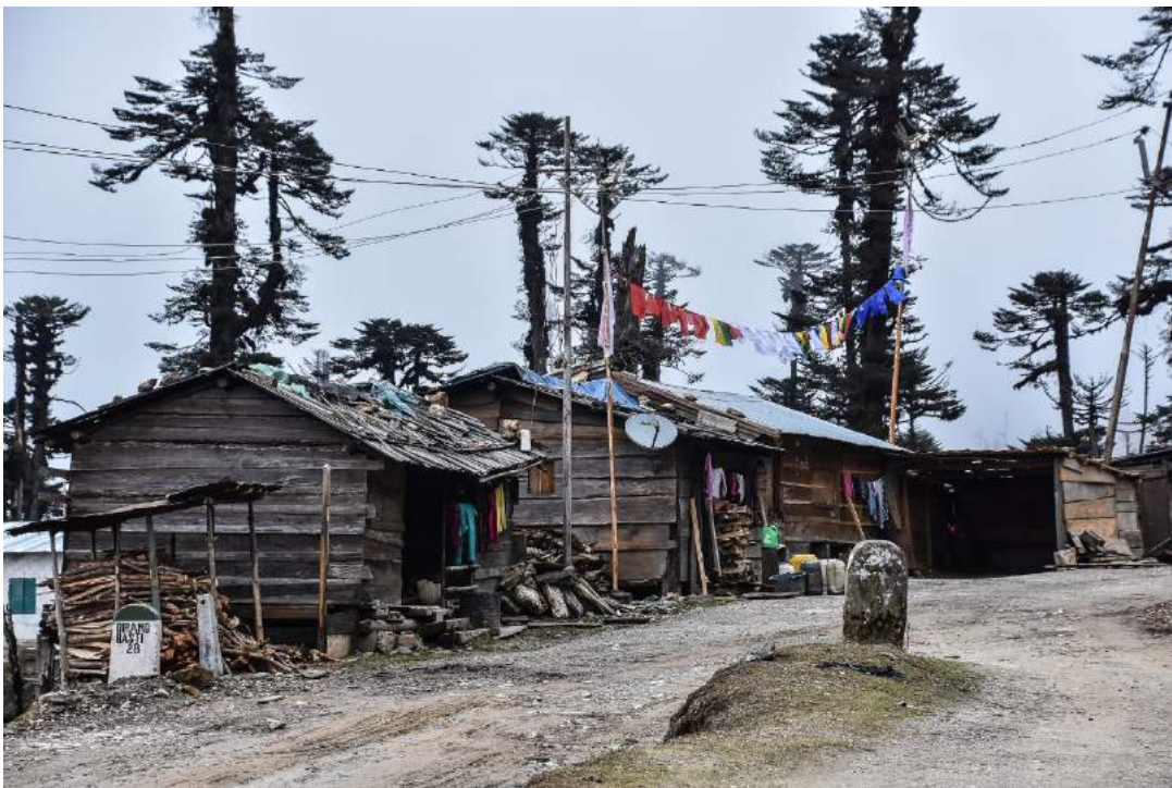
Bild 10. Mandala där vi skulle ätit lunch om inte alla var iväg för att kolla in Dalai Lama. Undrar om vi missade livets bästa lunch?

Uppe på krönet nådde vi den ytterst märkliga byn Mandala som såg ut som någon slags sjaskig gruvby från guldruschen med baracker till hus byggda av trälådor. Idag var Mandala helt övergiven och spöklik eftersom precis alla invånare hade gett sig iväg för att försöka få en skynt av Dalai Lama i dalen nedanför.