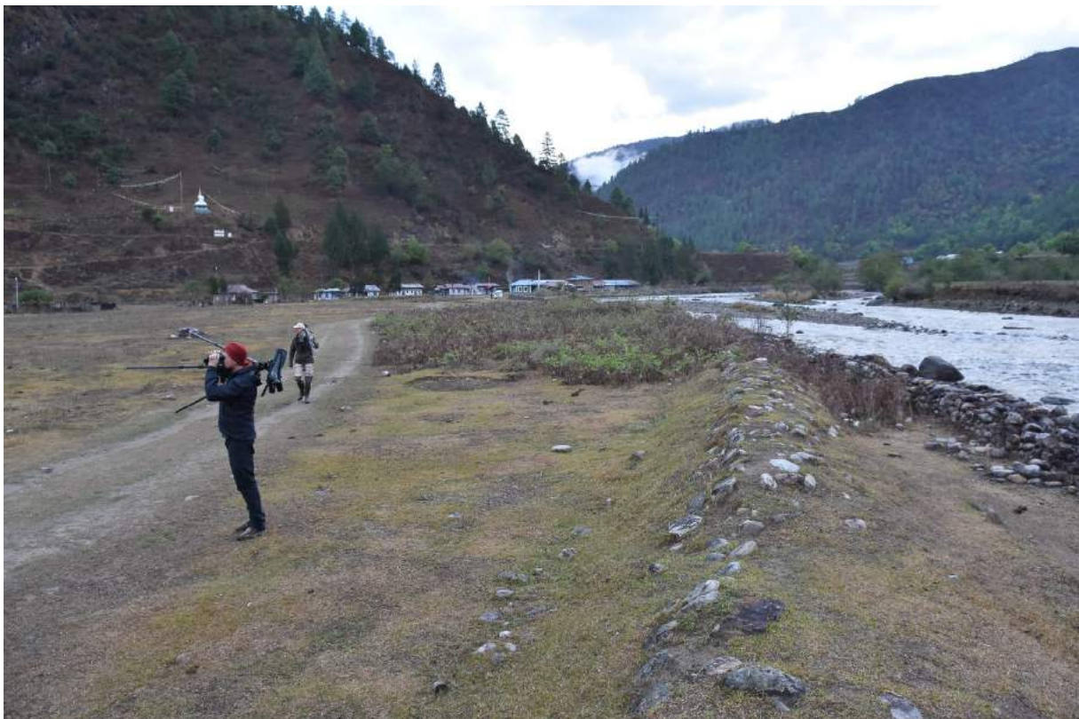
Bild 5. Sangti Valley gav Long-billed Plover i skymningen.