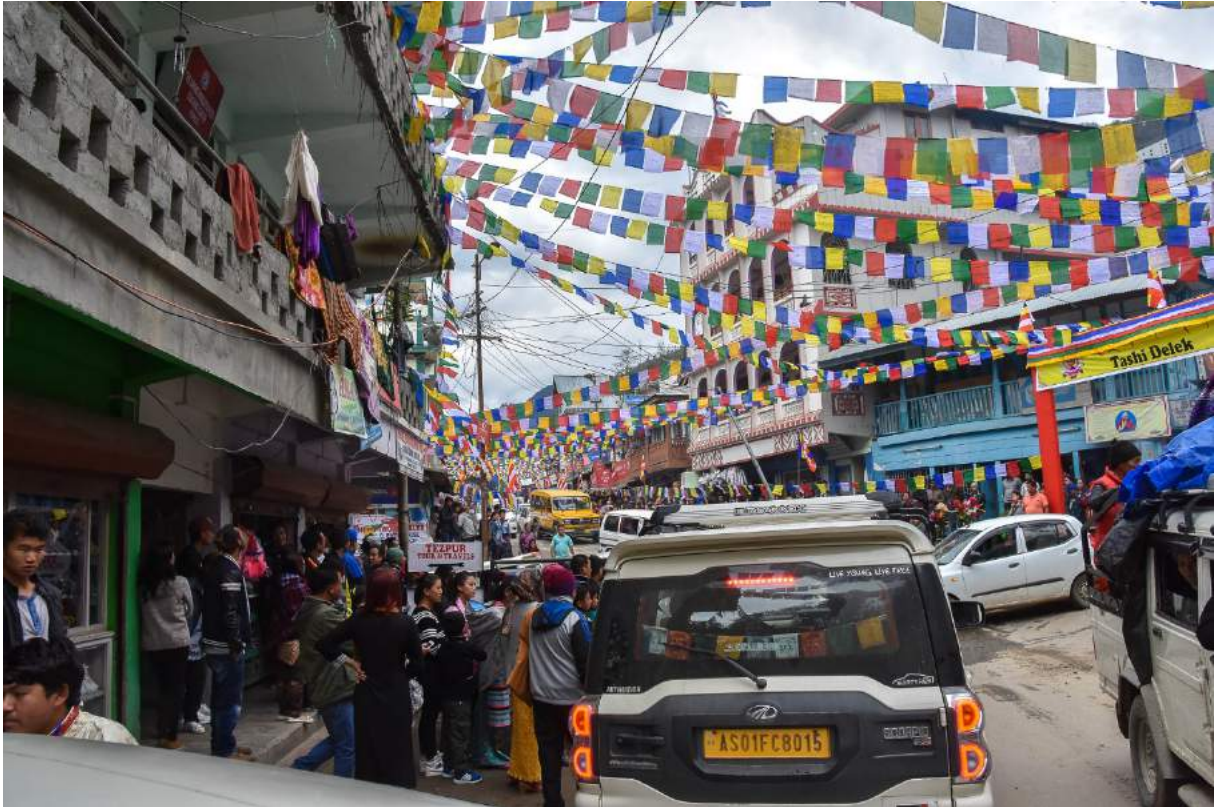
Bild 8. Fullt pådrag i Dirang eftersom Dalai Lama var på intågande.

Vi hann dock inte se huvudpersonen innan vi vek av upp mot Mandala Road där det som kontrast rådde ett stort lugn, inte minst beroende på att alla bybor var nere i dalen för att försöka se Dalai Lama. Mandala Road gav trevlig skådning i ett jordbrukslandskap där vi snabbt kunde hänga in Darjeeling Woodpecker, Scaly-breasted Wren-babbler och målarten Black-tailed Crake.