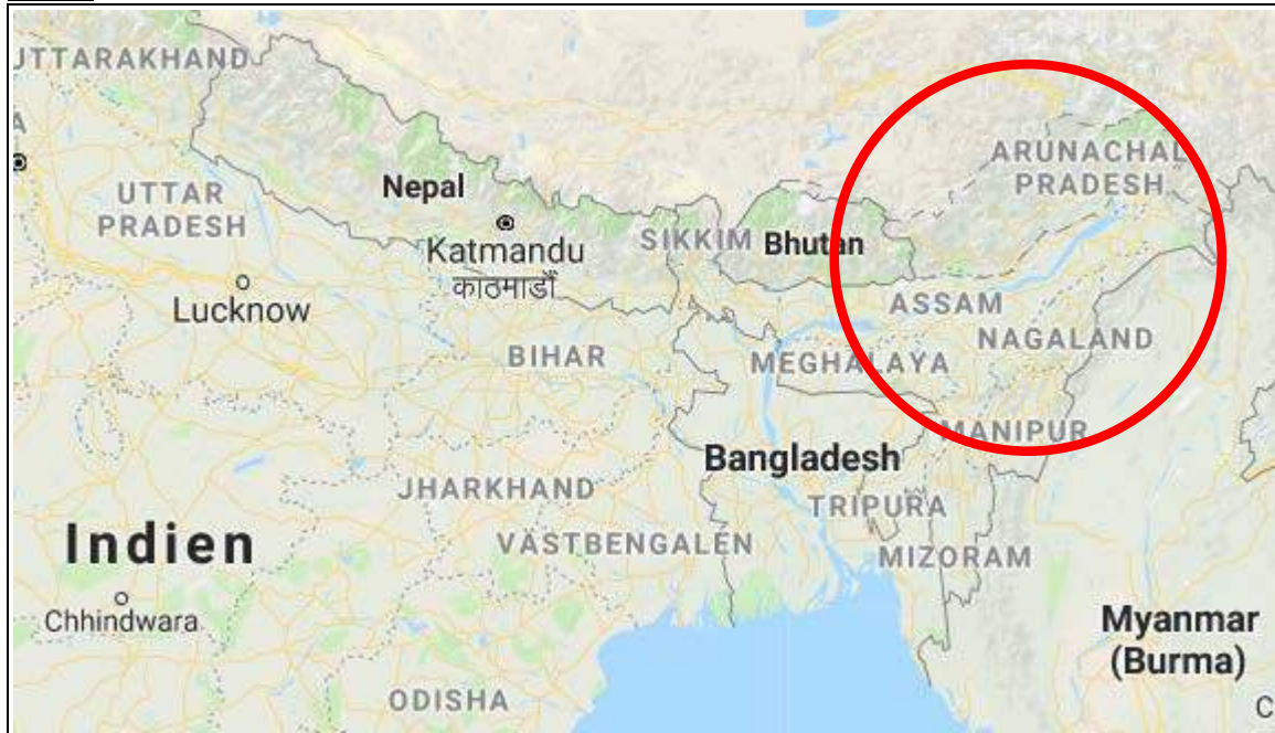
Karta 1. Delstaterna Assam och Aranuchal Pradesh ligger i östra Indien. Tack Google för kartan.