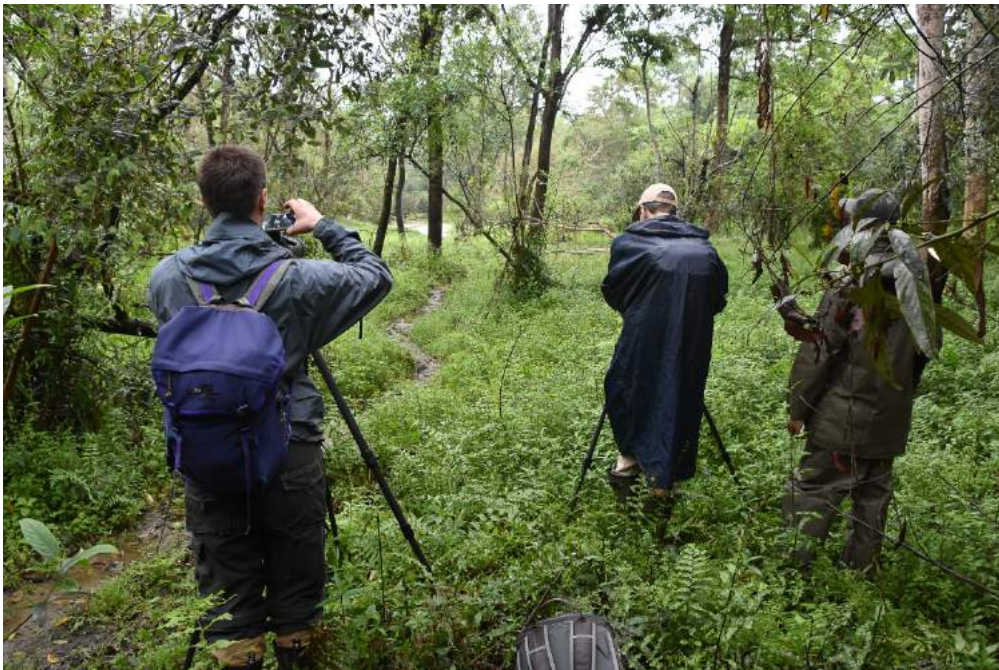
Bild 3. Platsen för White-winged Duck som låg längst borta i gölen.

Vi rörde oss uppströms nära floden längs en stig tills en av skogsvaktarnas halvtama elefanter inte ville låta oss passera. Elefantskötaren påkallades som fick säga till djuret på skarpen så vi till slut kunde passera medan elefanten tittade surt efter oss. Den stora målarten i Nameri är White-winged Duck, en rätt ful and som lever diskret i små gölar i tät skog och som i Nameri kan ses lättare än någon annanstans. Vi hade tur med anden för i borte kanten av den första gölen vi besökte simmade en White-winged Duck. En riktigt bra start på resan! För att inte störa den vaksamma och skygga anden tubade vi den på håll innan vi nöjda gick tillbaka.