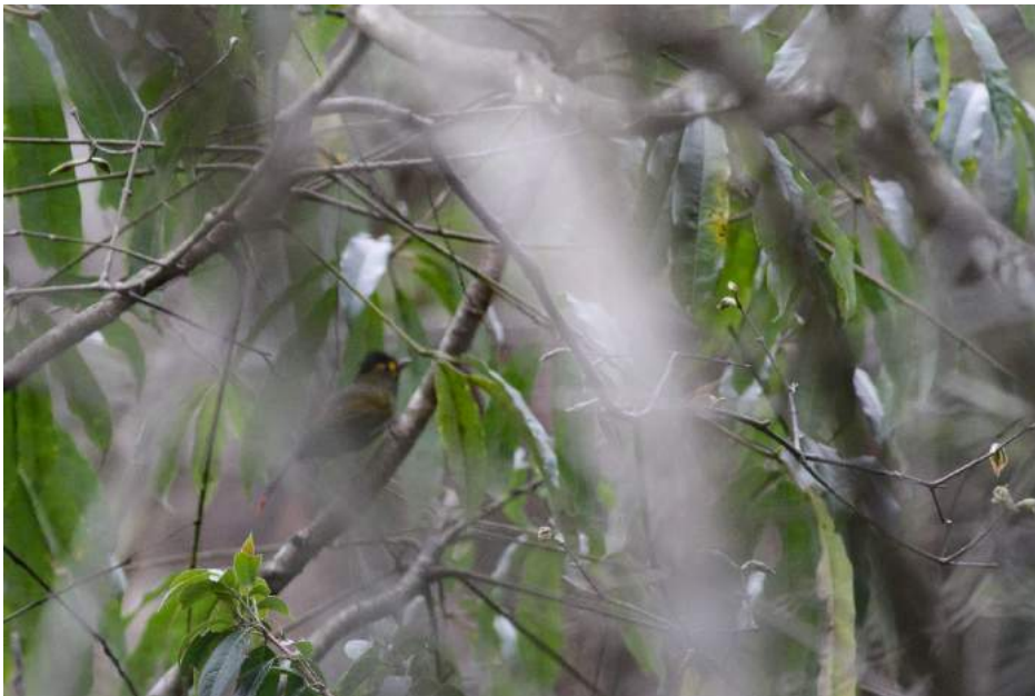
Bild 13. Två stycken Bugun Liocichla kom fram till oss i den täta vegetationen.

Direkt efter väckning halv fem drack vi kaffe i campen innan vi åkte ner några hundra meter längs vägen för att försöka på mållarten Bugun Liocichla, en fågel som enbart finns precis just här. Den färggranna fågeln sågs märkligt nog första gången så sent som 1995, sedan dröjde det 10 år innan den sågs igen och kunde beskrivas för vetenskapen först 2006. Liocichlan är stationär i skogen här men den är ofta rätt svår att få syn på. Vi spred ut oss längs vägen och höll kontakt med walkie-talkies. Det var relativt gott om fågel men någon Liocichla syntes inte till. Efter ett par timmar kom chaufförerna ner med bilarna och dukade upp frukost på motorhuvorna så vi kunde ta en paus.