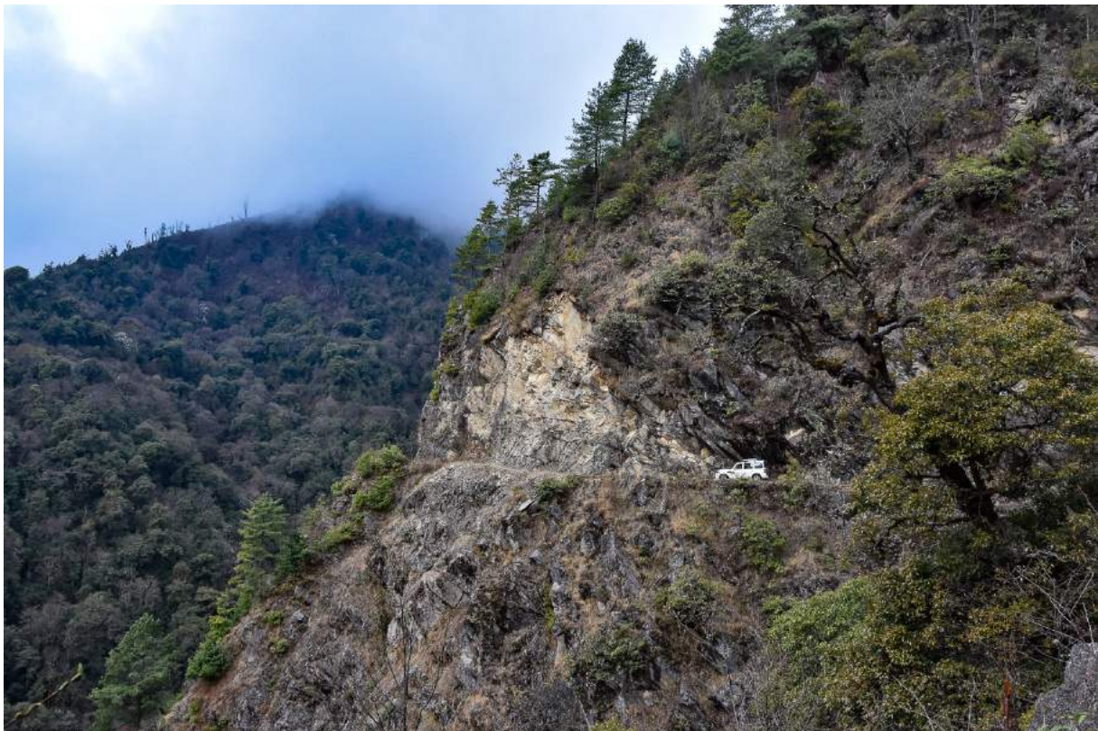
Bild 11. Rena rama Janne-Långben-vägar upp mot Eaglenest.