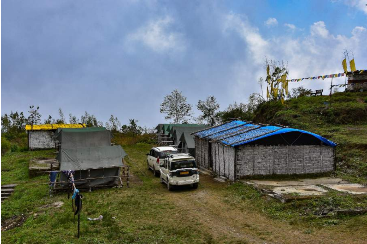
Bild 17. Bompu Camp där vi bodde fyra nätter.