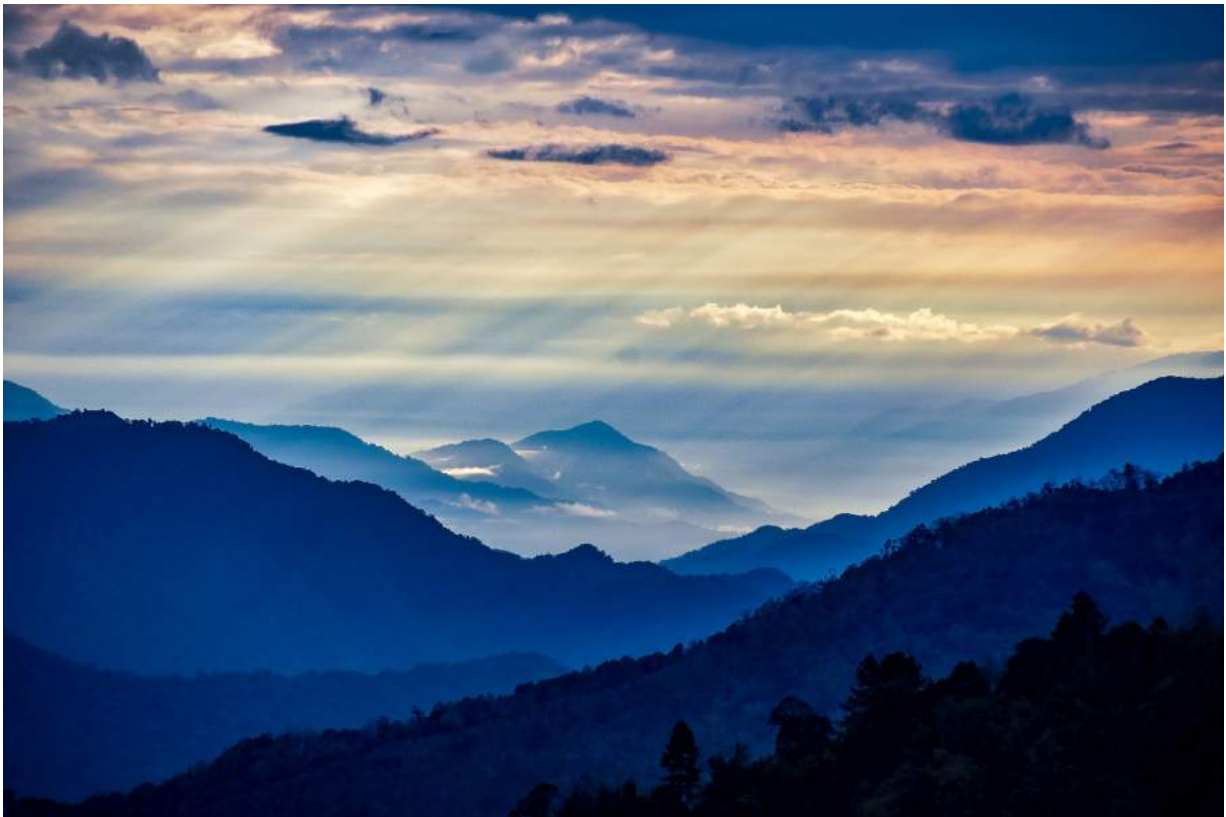
Bild 14. Gryning över Eaglenest Wildlife Sanctuary.

efter en stund kom två stycken Liocichlor förbi och vi fick kanonobsar på ett par meters håll. Skönt att denna superendem var säkrad!