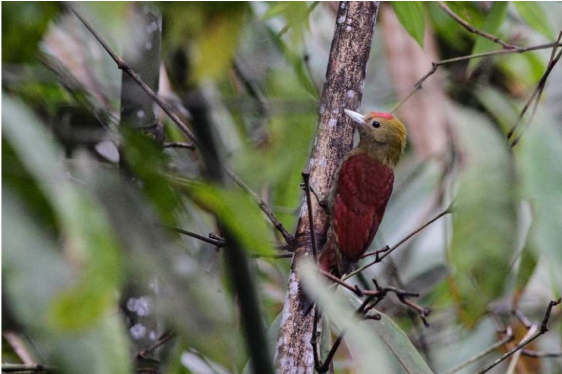
Bild 19. Pale-headed Woodpecker.