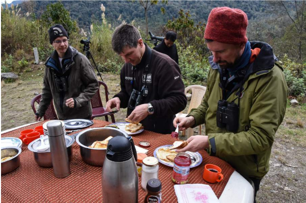
Bild 20. Flertalet av resans frukostar dukades upp på motorhuven av våra utmärkta chaufförer.

Vi åkte upp mot passet en sista gång och stannade vid ett område med mycket bambu och hörde Slender-billed Scimitar-Babbler bra. Vi skyttade även fågeln, eller rättare sagt rörelserna av fågeln, men fick tyvärr inte se den. Blue-fronted FC såg vi i alla fall. Vår vana trogen försökte vi sedan länge på Temminck's Tragopan på flera ställen men återigen utan framgång.