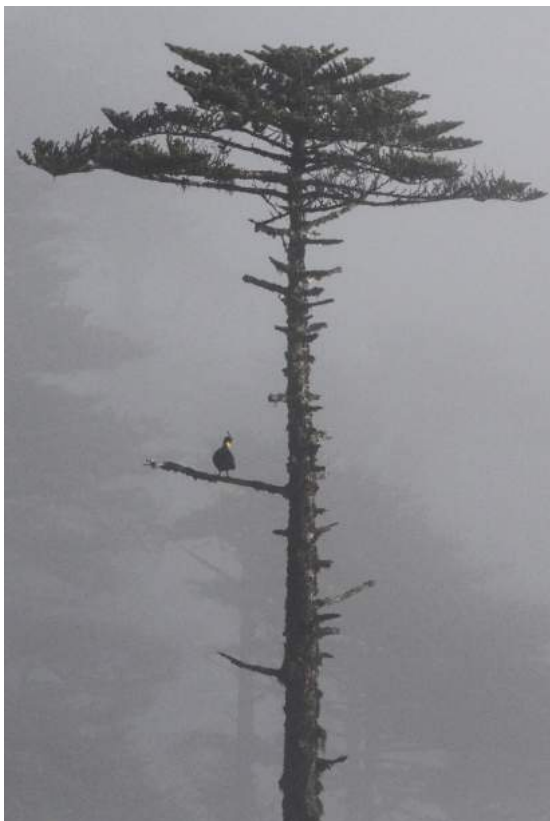
Bild 26. Himalayan Monal just när dimman börjar dra in.

2 Mandala Road 5.4 and 1 Eaglenest WS 7.4