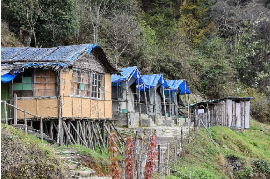
Bild 12. Lama Camp med sina mysiga tält där vi bodde.