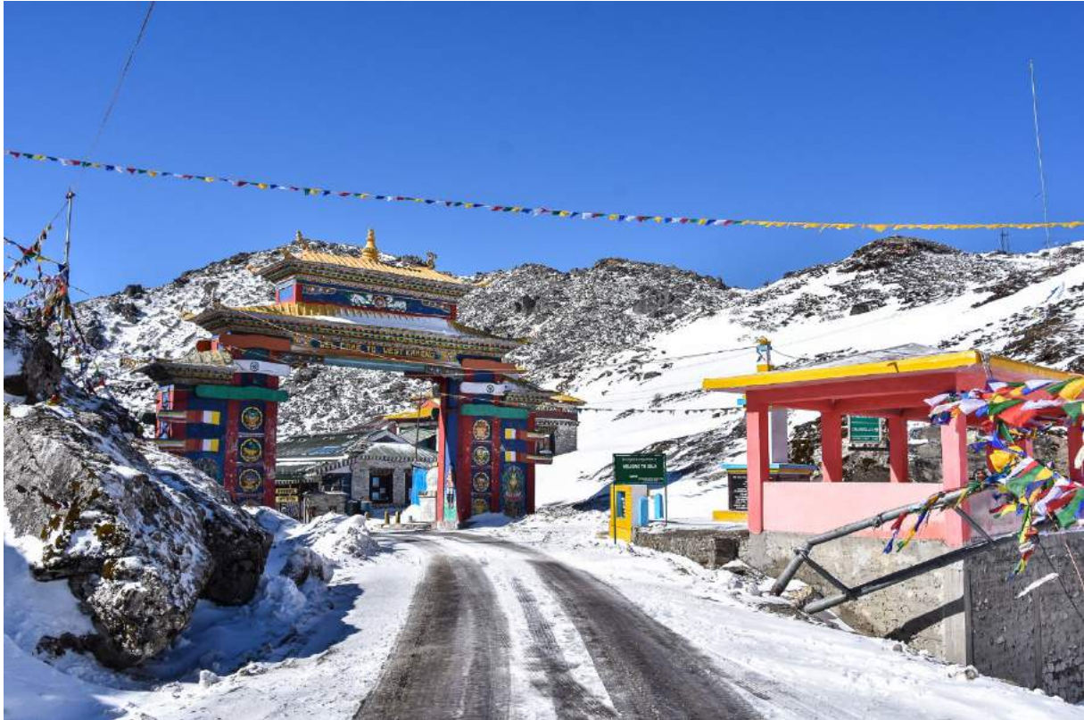
Bild 7. Sela pass, 4200 möh.

Målarter här uppe var bl.a. Grandala, Snow Partridge och Solitary Snipe. Först hittade vi en Steppe Eagle högt uppe över en bergsrygg, och sedan kom en välbekant och mäktig siluett glidande längs bergssidan; Bearded Vulture! Det visade sig vara två lammgamar som vi kunde se patrullera bergssidan till och från under en timme. Vi hittade även Long-legged Buzzard, fina obsar på Blood Pheasant, Tibetan Blackbird, Rosy Pipit och sedan stötte vi en Solitary Snipe.