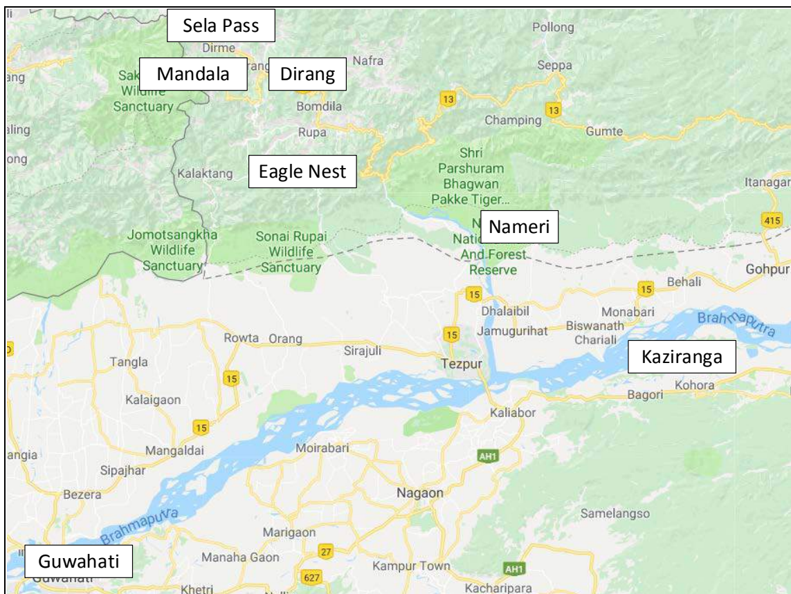
Karta 2. Besökta lokaler under resan. Vi flög till och från Guwahati. Tack Google för kartan.