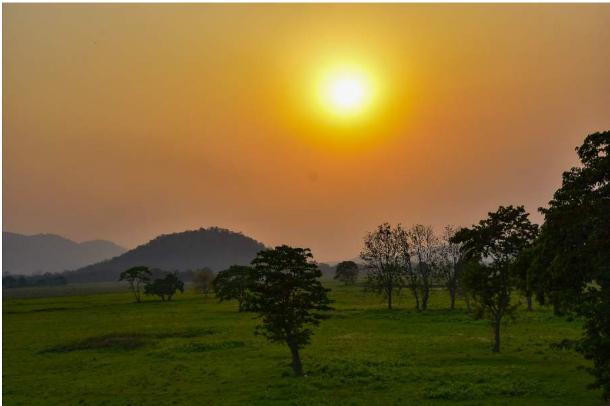
Bild 22. Solnedgång över Kaziranga NP.

Eftermiddagen satsade vi på Bengal Florican och körde nästan en timme längs stora vägen mot Western Range där det fanns stora gräsytor. Här var vi skönt nog helt själva, men någon florican såg vi inte till trots hårt jobb. På vägen hem var trafiken ovanligt galen och det kändes inte helt bra att sitta i en liten öppen jeep bland all tung trafik och omdömeslösa omkörningar.