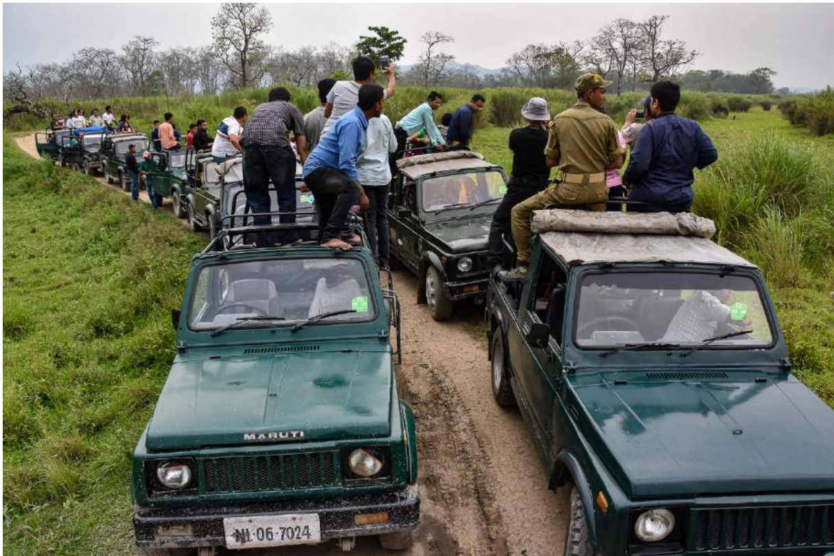
Bild 25. Smått kaos uppstod på platsen för tigerobsen.

Vi kände oss emellertid väldigt nöjda nu, finalen på resan med floricanen, pittan och nu slutligen tigern hade varit helt fantastisk och mer än vi kunnat önska oss. Vi rullade ur parken, dricksade vår initiativrike chaufför med 600 Rupies och vakt med 500 Rupies, och åt sedan middag på hotellet och njöt av vårt lyckosamma avslut.