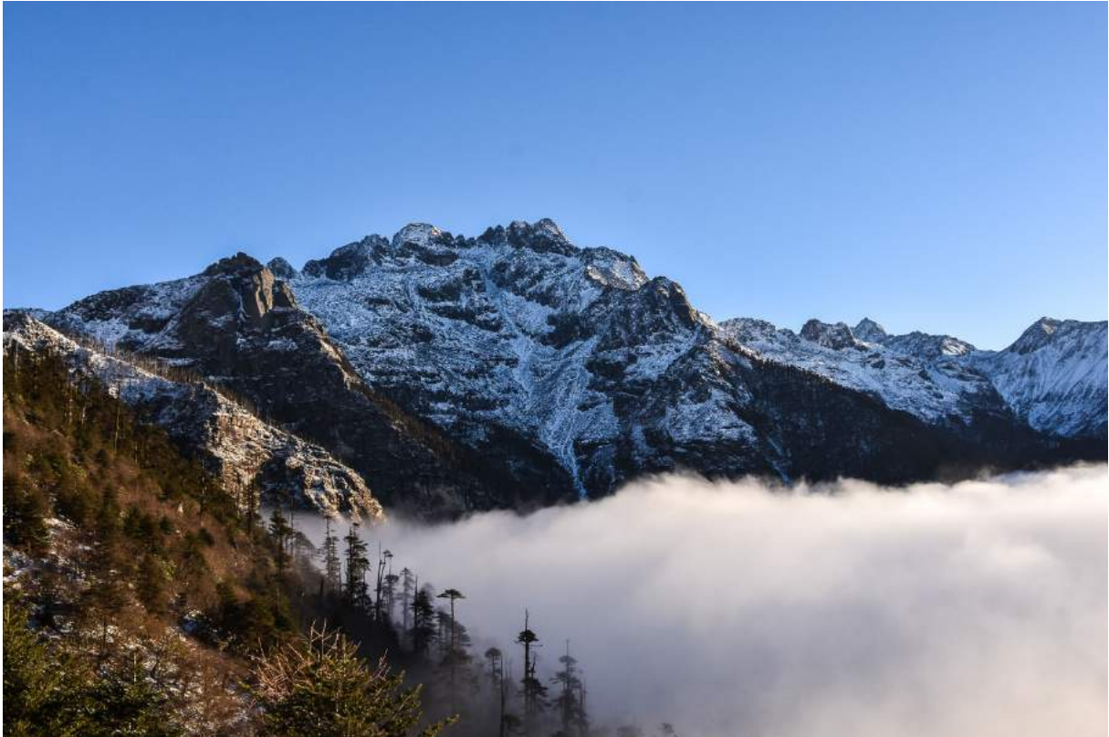
Bild 6. Solen går upp och lyser på bergen omkring Sela Pass.

Strax under 4000 möh stannade vi i en av serpentinsvängarna och lyssnade efter framförallt Himalayan Monal i en sluttning på höger sida vägen. Inget hördes till en början, men efter en stund ropade en Blood Pheasant från nära håll. Monalen visslade sedan till ett par gånger mycket svagt från sluttningen nedan men så pass svagt att det var svårt att veta om vi verkligen hade hört rätt. Blood Pheasant fick vi dock syn på och när vi skulle försöka tuba den kom en hane Himalayan Monal plötsligt flygande nära och landade i torrt träd alldeles nedanför! Nästan omedelbart svepte dock ett moln in och skymde Monalen men vi var ändå mycket glada över en sådan fin obs. På samma plats fanns även Snow Pigeon, Alpine Accentor och Eye-browed Rosefinch.