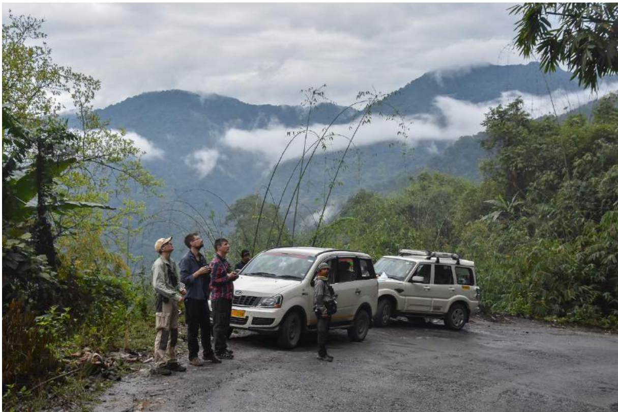
Bild 4. Skådarstopp längs vägen.