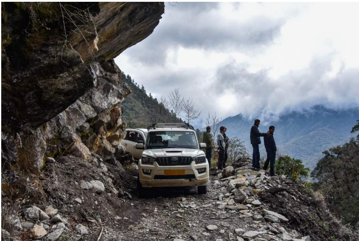
Bild 21. Smal passage med några decimetrar till godo till stupet.