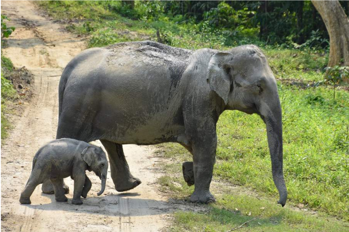
Bild 23. Indian Elephant med nyfödd kalv.

Istället åkte vi iväg mot Western range och in i Kaziranga NP genom gaten K2. Vi fick höra att tiger hade setts här under morgonen och det höjde spänningen och förväntningarna ännu mer. Vi höll vänster och åkte bort mot ett utkikstorn där vi åt medhavd frukost. Sedan åkte vi vidare och fick se en enorm pythonorm som låg alldeles invid vägen och vi uppskattade ormens längd till mellan 6 och 7 meter. Ormen var ordentligt tjock och ringlade efter en stund in i ett av flera hål i slänten bredvid vägen.