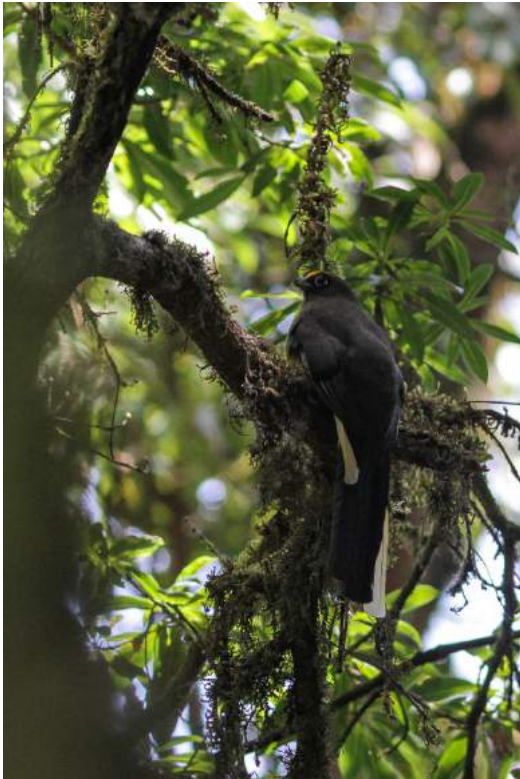
Bild 16. Ward's Trogon visade sig fint till slut.

lyssna efter Temminck's Tragopan i slutningen på höger sida vägen men tyvärr utan att vi hörde något. Istället gick vi över passet och fick in Hume's Bush-warbler, och sedan bra obsar på en skulkande Brown Parrotbill innan vi åt frukost. Därefter gick vi tillbaka och försökte på Tragopanen och hade då åtminstone turen att få se Black-headed Shrike-Babbler.