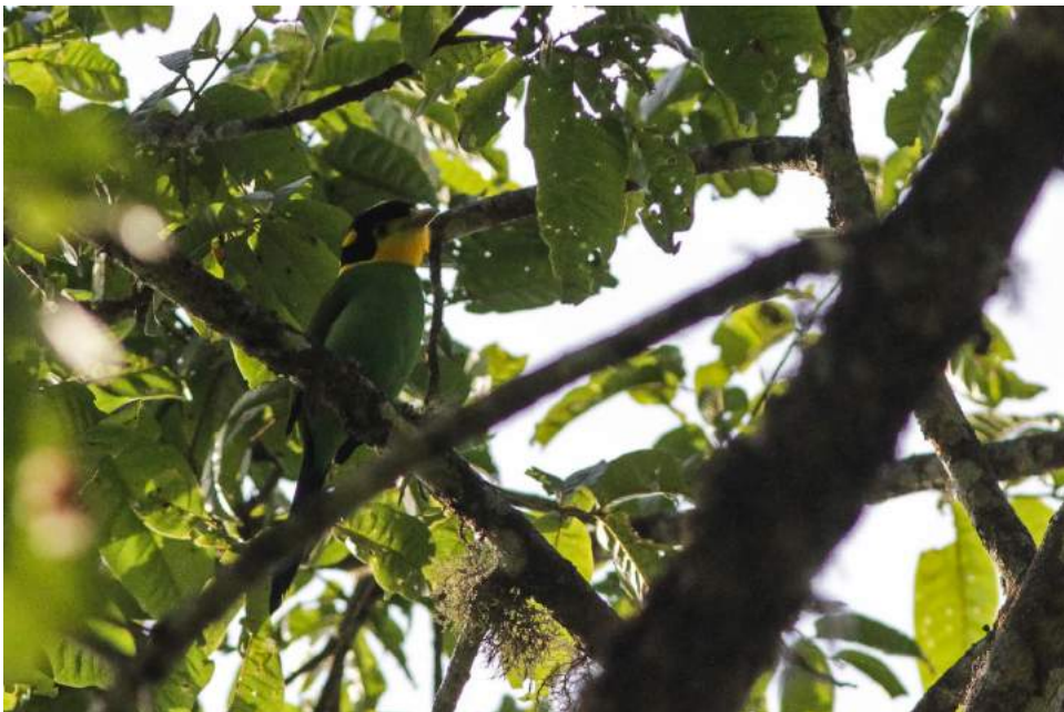
Bild 18. Long-tailed Broadbill

Klockan fyra steg vi upp för att lyssna efter ugglor runt campen, men vi hörde bara Mountain Scops Owl. Efter kaffe begav vi oss nedåt och fick nu äntligen höra och faktiskt även se Sikkim Wedge-billed Babbler. Det var en riktig häftig fågel som satt i den ravin som vi försökt i flera gånger tidigare utan resultat. Dessutom fick vi äntligen också se Sultan Tit bra.