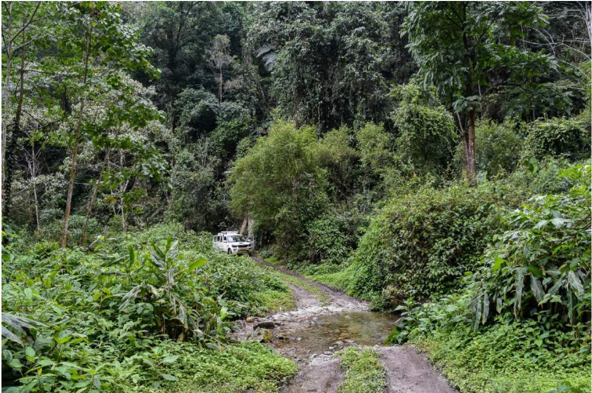
Bild 15. Skogen inom Eaglenest är helt fantastisk.