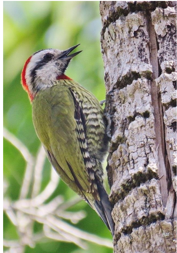
Cuban Green Woodpecker.