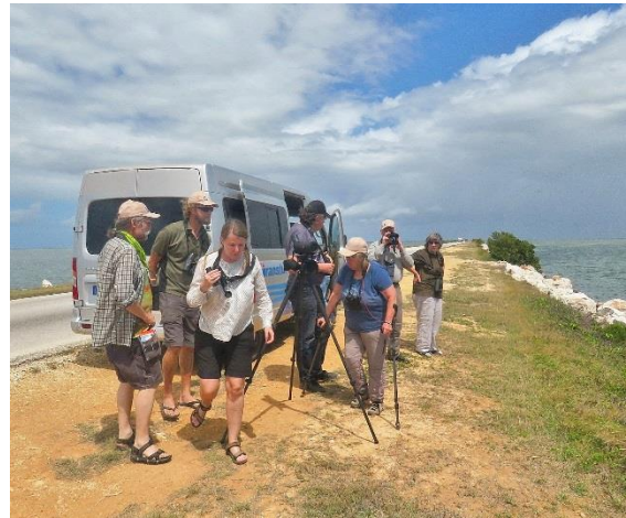
Skådarstopp på vägbanken ut till Cayo Coco.

vägen ut. Vi gjorde några stopp längs banken och hittade tex småskrake och amerikansk silltrut. På långt håll sågs ett par tusen flamingos, som en rosa rand mot land.