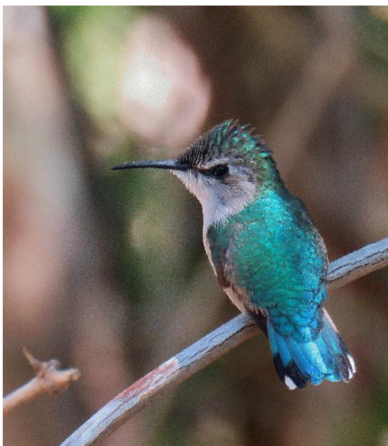
Bee Hummingbird, världens minsta fågel!

Lunchen äts lite längre öster om vårt hotell på en annan restaurang vid Caleta Buena. Där var det också "All inclusive", men framför allt var det den godaste maten vi hittills ätit på Kuba. Värmen gjorde att vi tog ett par timmars siesta. Vinden hade också mojnät, vilket förstärkte värmen. Stranden var fantastisk och det gick att hyra snorklingsutrustning. Här var det nästan rekord av vår sällskapsfågel nummer ett, Greater Antillean Grackle. Den är och hörs nästan överallt.