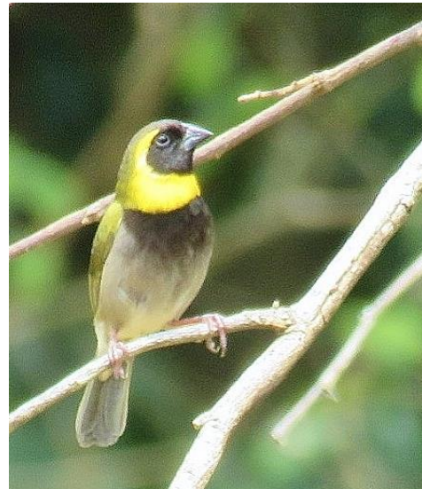
Cuban Grassquit, resans sista endem!

Tillbaks mot bussen stannade vi vid en konstnärs lilla ateljé och drack kaffe. Delar av gruppen bevakade himlen utanför och rätt som det var gick larmet att Gundlach's Hawk syntes på himlen. Det blev lite olika kvalitet på obsarna (från tub till blotta ögat), men alla fick se den efterlängttade höken! Konstnären hade gjort en fin träskulptur på den utrotade Ivory-billed Woodpecker och satt upp den på en palm.