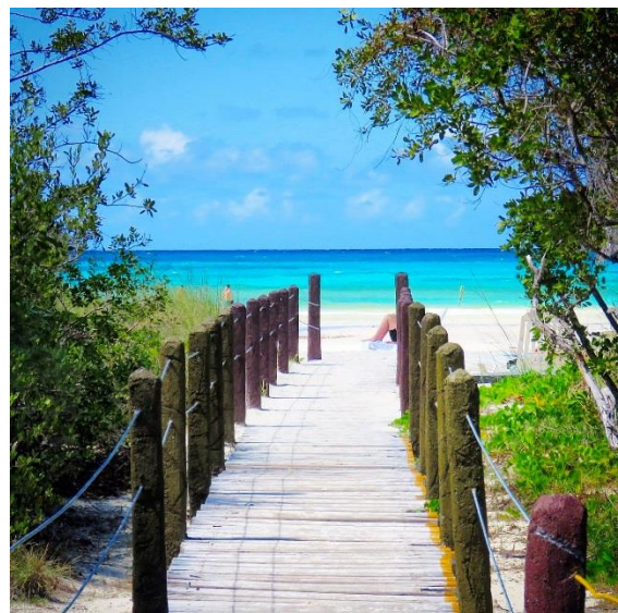
Vårt All-inclusivehotell bjöd på goda möjligheter till havsbad.

Vårt Hotel Sol Cayo Coco visade sig också vara ett ”All inclusive”-hotell. Medan vi väntade på rumsnycklarna skådade vi lite i omgivningarna. Northern Flicker, West Indian Whistling Duck, Green Heron, Great Blue Heron, Tricolored Heron, Cuban Emerald och en American Kestrel hittades. Före maten togs en promenad