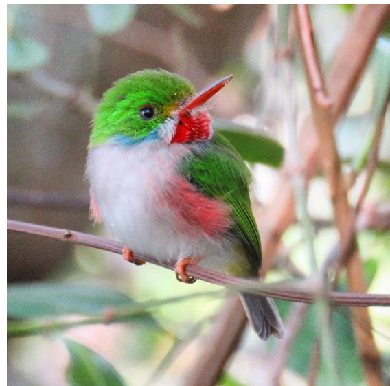
Cuban Tody, ett efterlängtat fotoobjekt för oss alla!

12 mars: Ytterligare en förvirrad morgon. Kuba hade gått över till sommartid och ingen visste någonting, utom vissas smarta telefoner, som hade ställt om sig själva. Det blev lite förvirring innan alla hade kommit till frukost ca en timme för sent och alla klockor blivit omställda en gång till. Så småningom kom vi iväg, nu med vår buss igen, och gjorde ett nytt misslyckat försök på mangrovegöken.