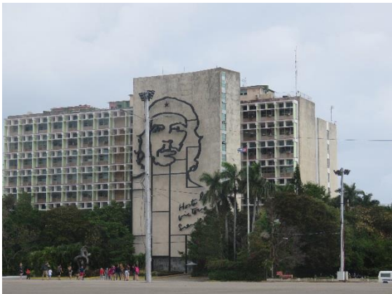
Revolutionstorget i Havanna övervakat av Che Guevara.

Där åkte vi en guidad tur med traktor och engelsktalande guide, och vår fågelskådning kunde börja lite i förväg. 19 arter fick vi in under dagen.