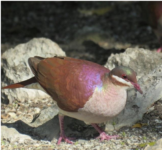
Key West Quail-Dove.

Zapata Sparrow. Men vi hittade ingen Mangrove Cuckoo.