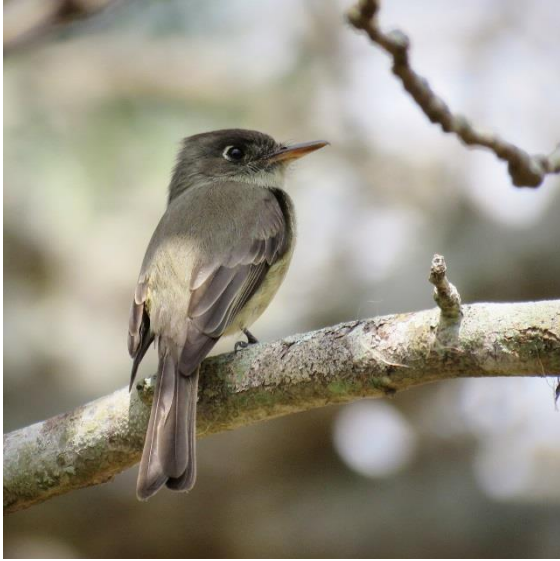
Cuban Pewee i Lenin Park

Där åkte vi en guidad tur med traktor och engelsktalande guide, och vår fågelskådning kunde börja lite i förväg. 19 arter fick vi in under dagen.