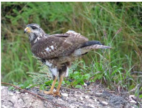
Juvenil Cuban Black-Hawk .

stämmer dock perfekt. Vi testar även på stället där britterna sett sin Bahamas men det enda som ses är en bortflygande mockingbird av okänd art.