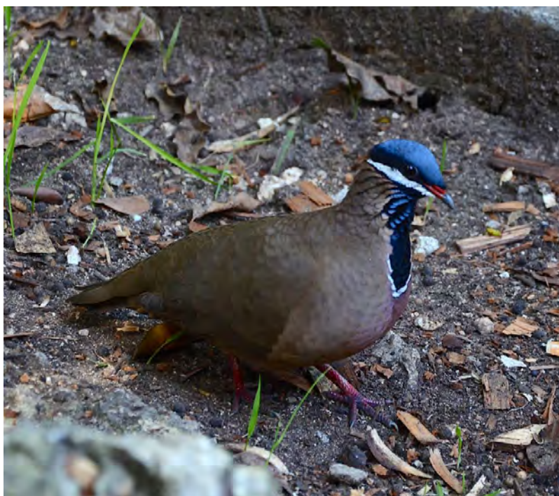
Two of Cuba's verligas star birds: Bee Hummingbird and Blue-headed Quail-Dove!