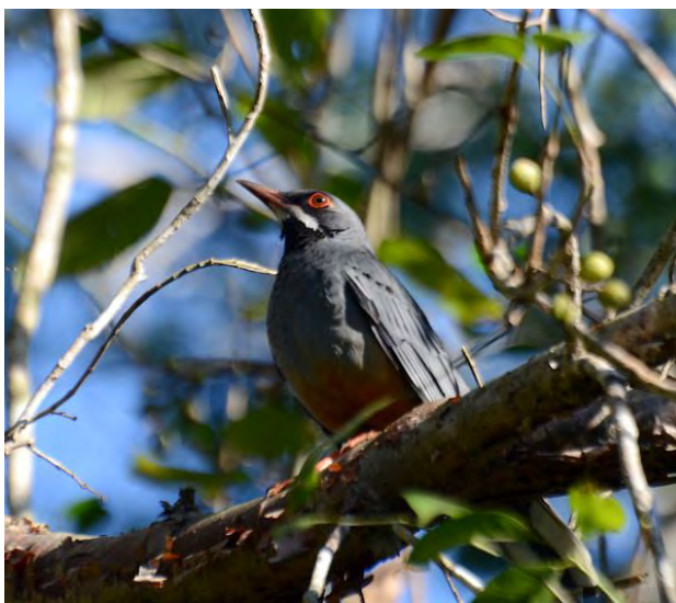
Red-legged Thrush.