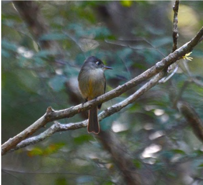
Cuban Pewee . Foto: Erling Jirle.

är uppehåll i regnandet och vi hittar en Cuban Solitaire som visar sig osedvanligt fint, en riktig bonusobs. Ser två arter fladdermöss och gamla bon av Cave Swallow inne i grottan och när vi sedan återvänder till dagsljuset utanför hörs en Giant Kingbird. Snart hittar Sofia en Kingbird ovanför grottan som ser stornäbbad ut och efter att spelat dess läte har vi den snart i palmerna runt oss, i släptåg har den också en Loggerhead vilket ger bra möjligheter till jämförelse. De flesta är överens om att den är grövre men inte direkt någon jätte som namnet anger. Precis när vi ska hoppa in i bussen för att åka vidare kommer en Gundlach's Hawk flygande, ytterligare en tung art att lägga till listan. Che Guevara grottan har verkligen levererat idag.