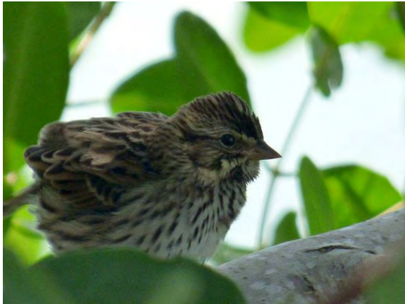
Savannah Sparrow .

vägen dit ser vi flera Cuban Black Hawk och American Flamingo, några av oss även Roseate Spoonbill inne i mangroveskogarna längs vägen. Väl ute på Cayo Guillermo börjar lokalguiden tråla efter Bahamas Mockingbird medan lastbil efter lastbil kör förbi med konstruktionsmaterial till de nya hotellkomplexen som är under uppbyggnad. En veritabel arbetsplats och svårt att få gehör för våra uppspelningar men efter ett tag kommer ett par engelsmän gående och berättar att de sett mockingbirden en km tillbaka längs vägen. Trevliga nyheter samtidigt som Nisse påkallar uppmärksamhet över en misstänkt fågel i en busktopp. Vi hämtar tuben och mycket riktigt är det en Bahamas! Den ser lite ovanlig ut men eventuellt är det en juv.