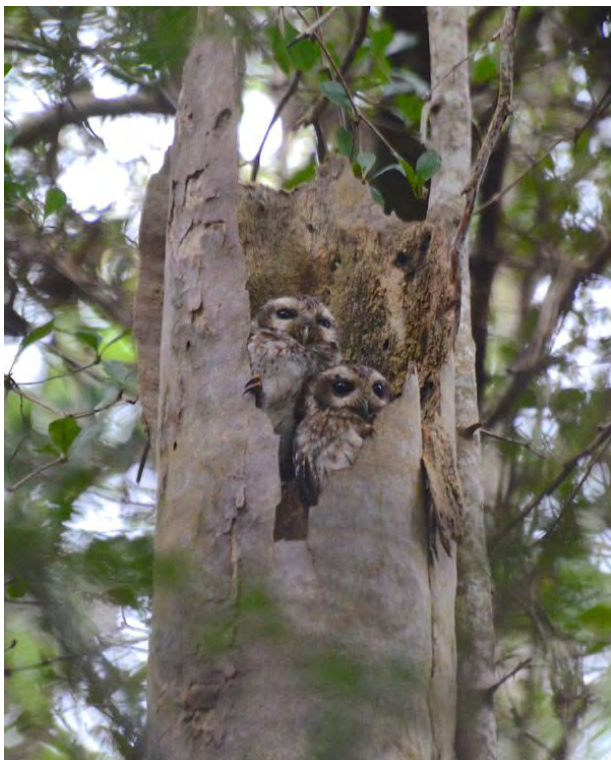
Bare-legged Owls.

risfälten mellan Aguada de Pasajeros och Yaguaramas, kör in till ett hus varifrån man får närobsar på vadarna i risfälten. Vårdarna är mycket trevliga, bjuder på kaffe och lovar att vi alltid är välkomna att titta in om vi så känner för. Tyvärr går de flesta vadarna i motljus men vi kan ändå räkna in flera hundra beckasinsnäppor, ett femtiotal styltsnäppor mm. Nästa stopp blir också vid vatten, i de första sumphålen i östra ytterkanten av Zapatasumpen. Vi hör någon Red-shouldered Blackbird men inte mycket mer, innan en boskapsfösare rider genom agmarkerna vilket floggar upp ett antal Purple Gallinules. Strax efter skymning passerar vi Bermejas, perfekt tid för att leta Cuban Nightjar. Jag hinner knappt sätta på spelaren förrän en individ flyger förbi oss och den återkommer flera gånger till den öppna platsen utmed vägen, den sätter sig t.o.m. som hastigast på elledningen vid några tillfällen. Vi bunkrar med öl på macken i Playa Giron och kör den sista halvtimmen fram till Hotel Playa Larga i utkanten av samhället med samma namn.