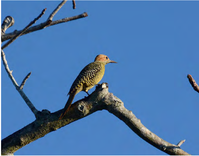
Fernandina's Flicker .

Warbler nästan tillsammans, dessutom en hona Bee Hummingbird och flera Grey-fronted Quail Doves. På em åkte vi till La Boca utan större framgångar fågelmässigt men i alla fall en hel del skogssångare inkl. Cape May Warbler och några Antillean Palm Swifts som tydligen är ovanliga i området för det var en ny art för lokalguiden. Vi spanade också in kvällens middag: kubansk krokodil, som de föder upp här.. Middagen på Paladar i Palpite innehöll krokodil, langust, krabba och hjort + en dryck till det oansen-liga priset av 7