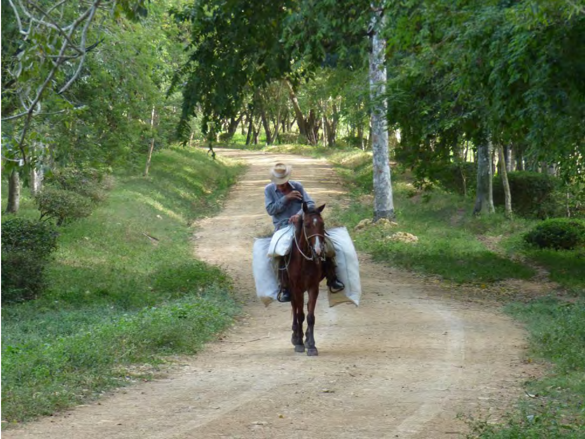
Bonde vid Finca La Belen.