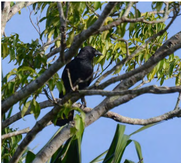
Cuban Palm Crow.

inte var framme vid Finca La Belen utanför Najasa i provinsen Camaguey förrän nästan kl 20. Dessförinnan hade vi sett en ad hane blå kärnhök som hastigast jaga förbi över fälten strax O om Ciego de Avila och en tornuggla som flög framför bilen ett stycke V om Camagüey. Finca La Belen ligger något avlägset, har bristande vattentillförsel, dålig telekommunikation och ibland endast spartansk mat men denna natt var en natt att minnas med en bländande stjärnhimmel och konstanta blixtrar från molnen vid horisonten.