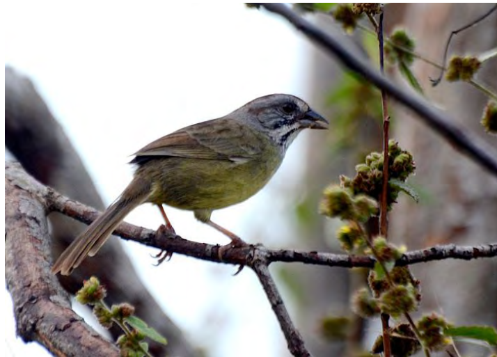
Zapata Sparrow .

stannar vi igen och genast hittar vi ett par Cuban Gnatcatcher i buskarna, vi promenerar 50 m till en liten lagun där vi efter att ha tittat på blåvingade årtor och skedänder även hittar några West Indian Whistling-Ducks som står och kurar under några mangrovebuskar. Det börjar likna "full hand" redan innan frukost! Eftersom vi inte såg Zapata Sparrow särskilt bra innan fortsätter vi till en liten skogsväg som brukar vara pålitlig för denna art men utan lycka, däremot bra obsar på Mangrove Cuckoo och Cuban Green Woodpecker. Myggorna är riktigt jobbiga nu, vi hoppar in i minibussen och åker tillbaka till hotellet för frukost. Efter frukosten kör vi ut till Cayo Guillermo, på