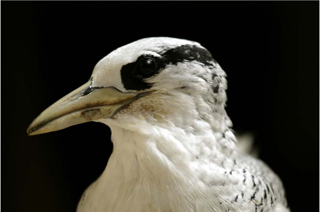
ung rödnäbbad tropikfågel på rehabilitering

6 Praia 24/2, 4 Curral Velho 27/2, 4 Tarrafal – Razo 1/3, 5 Razo 1/3, 1 Razo – Branco 1/3, 16 Branco – Tarrafal 2/3, 3 Ponto dos Barril 3/3, 3 Mindelo – Porto Novo 4/3