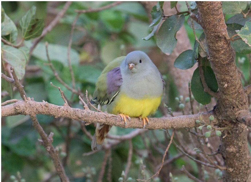
Bruce's Green Pigeon – en av flera afrikanska arter. (Peter)

Dagen avslutades vid Wadi Derbat. Medan det var ljusst hittade vi bl.a. fem Bruce's Green Pigeons , en svart stork , flera forsärlor samt en ormörn och två hökörn ar. När vi stod och lyssnade efter Spotted Eagle Owl bröt plötsligt ett antal vargar ut i ett kraftfullt ylande som varade i flera minuter! Vi lyssnade länge efter uven, men först då jag sökte härma den kom den igång. Samtidigt hördes minst fyra Arabian Scops Owls . En fantastisk avslutning på en fantastisk dag!