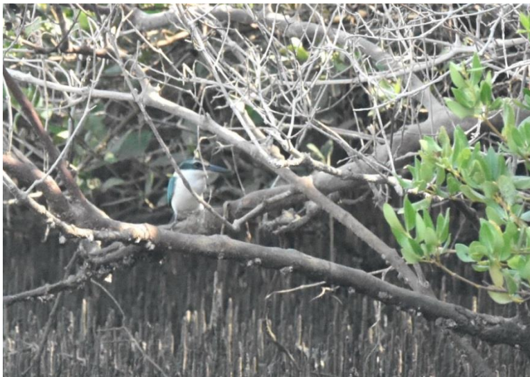
Collared Kingfisher – den fanns kvar vid Shinas i alla fall! (Jörgen)

Efter denna fina start drog vi söderut igen för att skåda vid mangroven och sandstränderna vid Shinas. Här hade vi åter extrem tur – den första fågel vi såg här var målarten Collared Kingfisher av den hotade (vulnerable) rasen kalbaensis . Här såg vi också bl.a. mangrovehäger , mongolpipare , sandlöpare , kejsarörn , kungsfiskare samt hörde saxaulsångare på två ställen. På en fotbollsplan i en by i närheten fanns bl.a. flera vattenpiplärkor .