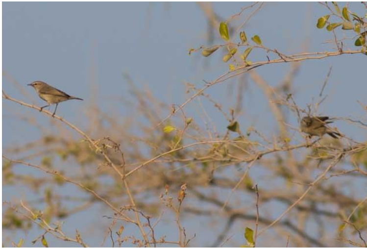
Dvärgsångare – världens minsta Phylloscopus (Roger)

Måndagen den 9 november. Vi startade tidigt för att komma till vårt mål, Khatmat Milaha, i soluppgången. Det är ett ökenartat område med glesa träd, som mest känt för att hysa övervintrande dvärgsångare och orientstenskvättor. Vi hann knappt komma ur bilarna förrän vi fick kontakt med de första dvärgsångarna som var mycket lättfunna genom sina sparvliknande locklåten. Så småningom kunde vi räkna till minst 12 individer. Vi hittade också snart tre orientstenskvättor och därtill en hona av munkstenskvätta samt ett flertal öken- och isabellastenskvättor . En annan specialitet för området är arabskriktrast och vi hittade två mindre flockar av denna art. Övrigt intressant var två svarta (rödmagade) och en vanlig rödstjärt , ökensångare samt Small (Desert) Whitethroat .