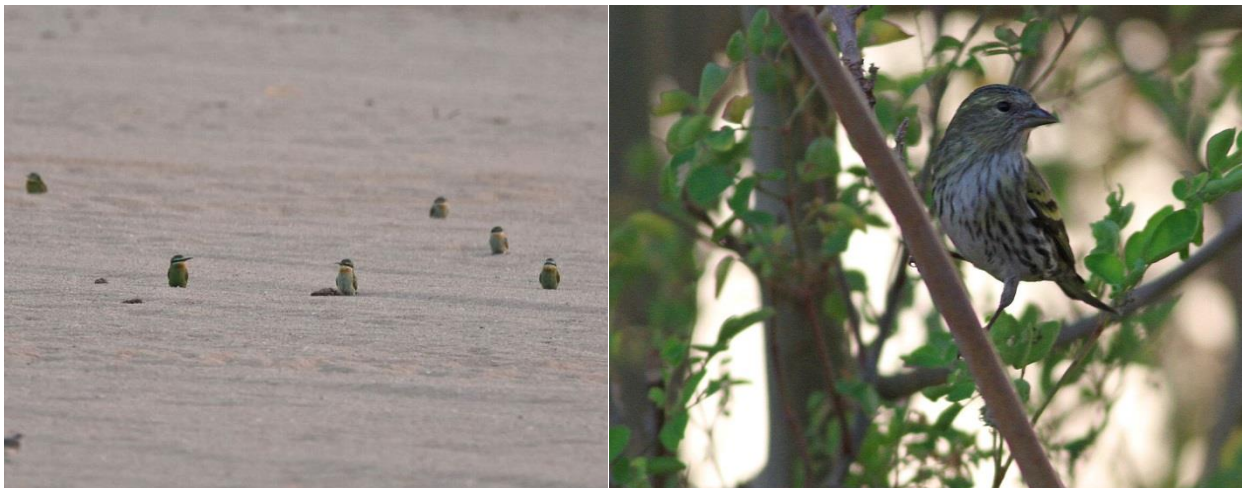
Gröna biätare på sanden vid Dawkah Farm (Jörgen), Grönsiska – hur hade den hittat hit? (Jan B)

Därefter fortsatte vi till Dawkah Farm. Främsta arten här blev tre Afrikanska turkdovor som satt på en tråd tillsammans med ett antal europeiska släktingar. Andra arter var en Western Koel , en gök , en blåhök , två stäpphökar , 50 gröna biätare , en europeisk dito , en mindre och en grå flugsnappare , 14 rosenstarar samt en grönsiska ! Den sistnämnda är den nionde i landet. I nattmörkret försökte vi att spela fram någon ökennattskärra , men såg bara två Rüppel's rävar .