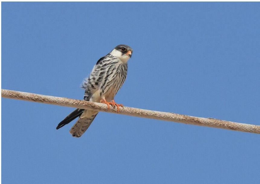
Amurfalk – på väg från Sibirien till Sydafrika? (Jörgen)

Vi tog nu den långa grusvägen mot söder och kusten. Den gick genom ett ödsligt och ställvis mycket dramatiskt landskap med bl.a. djupa raviner. I början av denna väg upptäckte vi en 1k amurfalk på en telefontråd, en för många efterlängtd art. Därefter blev det mycket fågelfattigt resten av sträckan mot kusten. Väl nedkomna dit tog vi av mot öster och Al Mughsayl. Längs vägen sågs bl.a. en hane av munkstenskvätta och en hökörn .