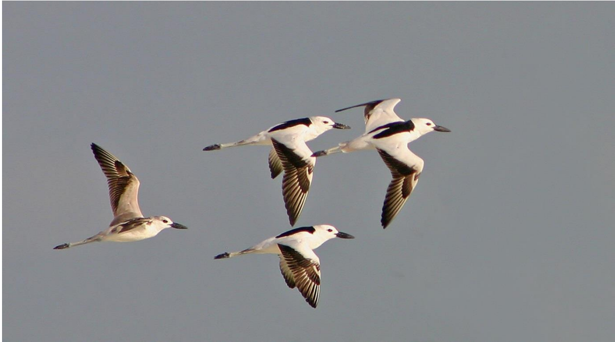
Hägerpipare – en av världens märkligaste vadare.(Christer)

På kvällen åt vi en god indisk kyckling på den lilla restaurangen vägg i vägg med vårt hotell i Al Hijj.