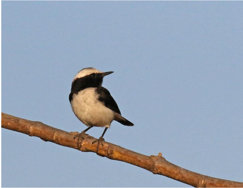
South Arabian Wheatear (Christer)

Vi fortsatte vidare mot Jabal Samhan varifrån man hade en enorm utsikt över kustslätten. Berget stupade här brant ned med närmare tusen meter. Omgående upptäckte vi målarten klippörn , en adult fågel. Den satt på en avsats, avtecknad mot himlen, innan den började flyga runt nedanför oss.