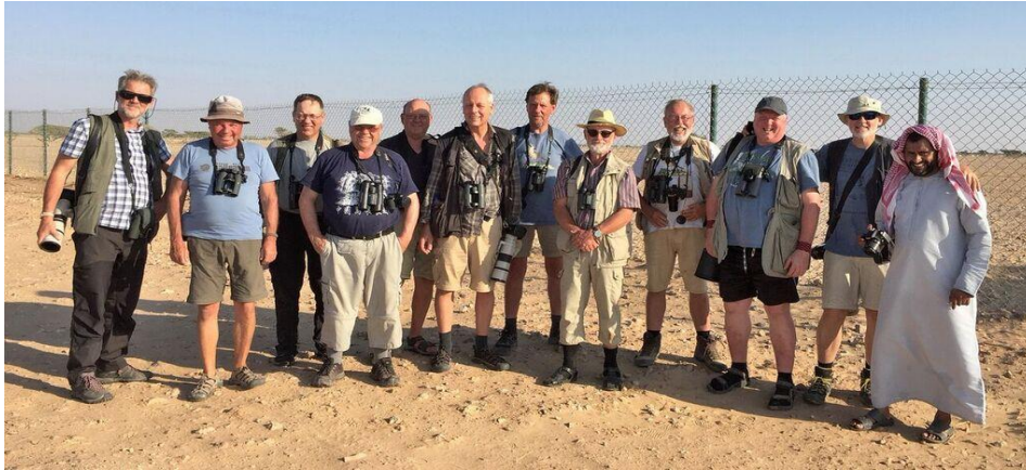
Hela gänget i Al Wusha Nature Reserve (Jörgen)