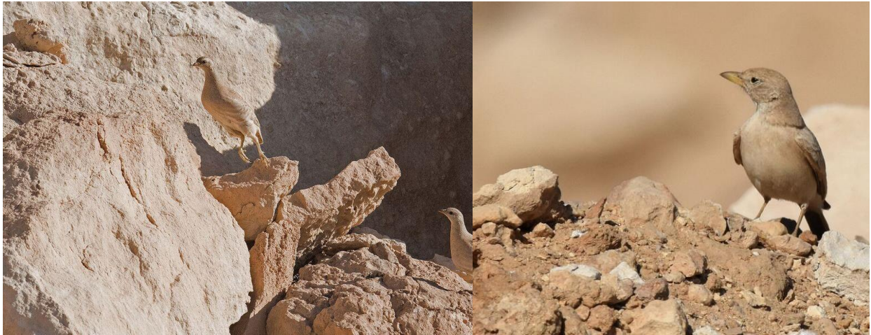
Ökenhönor på språng. (Peter), Stenökenlärka – märk den grova näbben! (Jörgen)

Vi tog nu den långa grusvägen mot söder och kusten. Den gick genom ett ödsligt och ställvis mycket dramatiskt landskap med bl.a. djupa raviner. I början av denna väg upptäckte vi en 1k amurfalk på en telefontråd, en för många efterlängtd art. Därefter blev det mycket fågelfattigt resten av sträckan mot kusten. Väl nedkomna dit tog vi av mot öster och Al Mughsayl. Längs vägen sågs bl.a. en hane av munkstenskvätta och en hökörn .