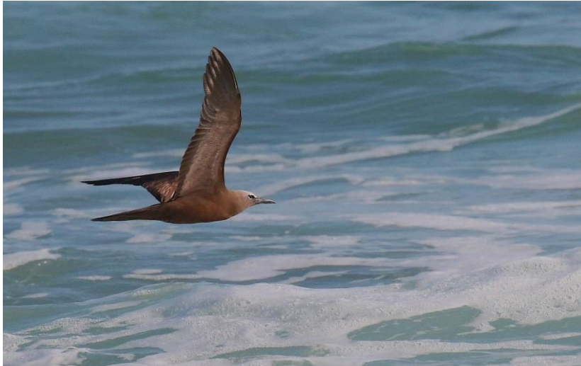
Brun noddy (Christer)

Efter ett besök vid den i princip tomma Khawr Mughsayl körde vi in i dalen. Vid ett av vattenhålerna skulle det finnas en brunsångare , den tredje för Oman, och den skymtade och hörde några av oss. I samma damm upptäcktes även en White-breasted Waterhen samt en mindre sumphöna . Kvällen avslutades med lyssning efter Hume's Owl långt inne i Wadin, men de två par som skall finnas här var tyvärr helt tysta.