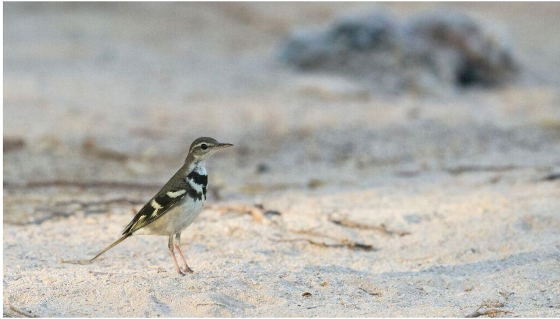
Forest Wagtail – nionde fyndet i Oman! (Peter)

Hypocolius. Tre östliga sammetshattor var länge det bästa innan Peter upptäckte en Forest Wagtail . Fullkomligt oväntat här (landets nionde fynd) och en art jag sökt förgäves vid två resor till Indien och två till Thailand-Kambodja!