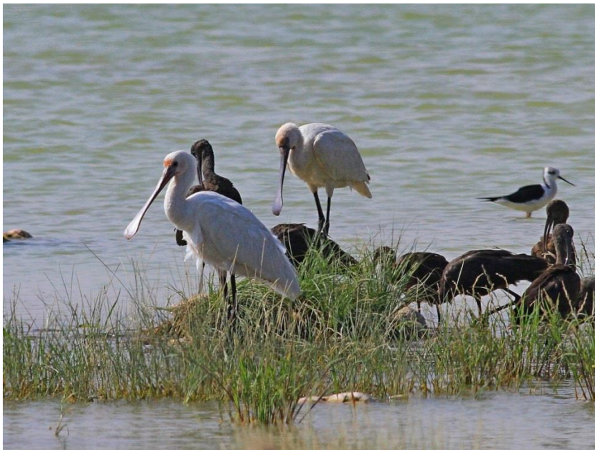
Skumma skedstorkar i Raysut (Jan B)

Vi hade fått reda på det fanns tre roständer i en Khawr närmare hamnen och dessa såg vi flygande. Här fanns också tre skedstorkar och när Blomma granskade sina bilder upptäckte han att två av dem var röda i ansiktet. Vår första tanke var att de var African Spoonbills, men efter tankens kranka blekhet infann sig så småningom då vi kunde konstatera att de inte hade röd vaxhud utan bara röda fjädrar kring näbben. Detta var nog något de fått i samband med födosök.