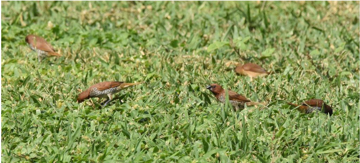
Scaly-breasted Munias – ej spontana, men trevliga ändå. (Jörgen)

Några av dem som inte följde med på båtturen eller som på eftermiddagen åkte tillbaka till Salalah skådade en del där och såg bl.a. 70 bronsibisar , fyra skedstorkar och två Pheasant-tailed Jacanas i East Khawr, 200+ sibiriska tundrapipare samt en bivråk bortanför Crown Plaza Hotel, 13 ökenlöpare , två stäpphökar och två rödstrupiga piplärkor vid Sawnawt Farm samt 75 Scaly-breasted Munias i East Khawr Park.