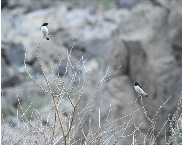
Hume's Wheatears (Jörgen)

Tisdagen den 10 november. På morgonen sågs bl.a. Red-vented Bulbul i det vidsträckta hotellområdet. Hela denna dag tillbringade vi sedan i Al Gubrah Bowl i Jabal al Hajar, en skålförmad dal som nås via passet Wadi Sabt. Här adderade vi till artlistan ökenhöna, gåsgam, örongam, göktyta, stenökenlärka, blåtrast, målarten Hume's Wheatear, snårsångare, Southern Grey Shrike, ökenkorp och bergsparv . På kvällen lyssnade vi igen efter Omani Owl, nu på en annan lokal, men hörde bara en ropande ökenuv , i och för sig inte så dåligt det heller.