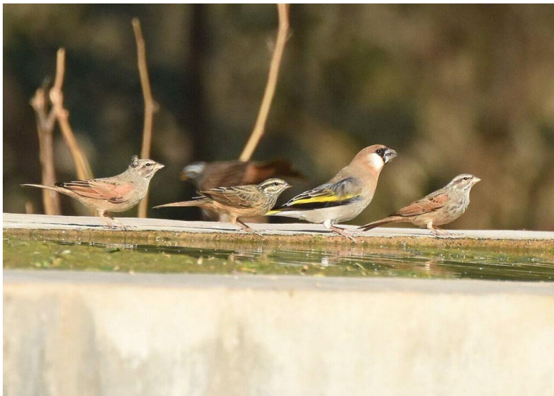
Arabian Golden-winged Grosbeak med Cinnamon-breasted Buntings vid vattenränna för törstiga kameler! ( Jörgen)

Måndagen den 16 november. Jag hade fått inte mindre än två olika lokaler för Arabian Golden-winged Grosbeak , denna tidigare så svårfunna art. Tyvärr var det inte så lätt att med vägbeskrivningarna hitta vare sig den ena eller den andra, men så småningom listade vi oss i alla fall fram till en av dem, en vattningsränna för kameler i en grönskande wadi. Redan vid vår ankomst såg några av oss två fåglar, som dock snabbt flög iväg. Kvar var minst ett 20-tal Cinnamon-breasted Buntings . Efter en stunds väntan kom dock till slut minst tre stenknäckar fram och de återkom sedan gång på gång. Även i övrigt var det gott om fågel kring rännan – vi noterade bl.a. svartstjärtar , African Paradise Flycatchers , Shining Sunbirds , en svartkronad tschagra , African Silverbills , Rüppel's Weavers och sinaiglansstarar . En hökörn och en dvärgörn samt 10+ Forbes-Watson's Swifts flög förbi.