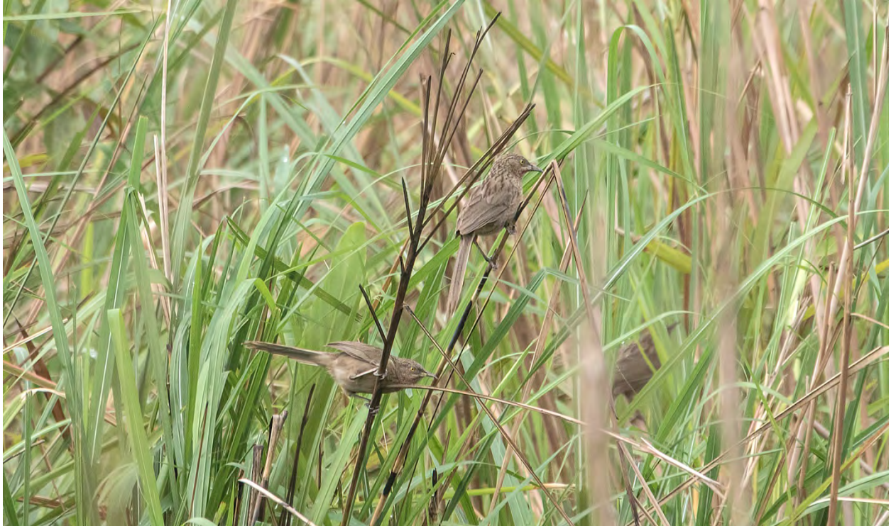
Striated Babbler.

Jungle Babbler Turdoides striata 10 Sultanpur 23/4, and common in Bandhavgarh 24-27/4. (nominate)