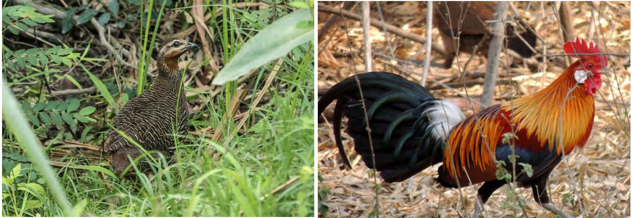
Swamp Francolin and Red Junglefowl.

Blyth's Tragopan Tragopan blythii 1 male heard and 1 male and female seen running across the road near Bompou camp 15/4. ( molesworthi )