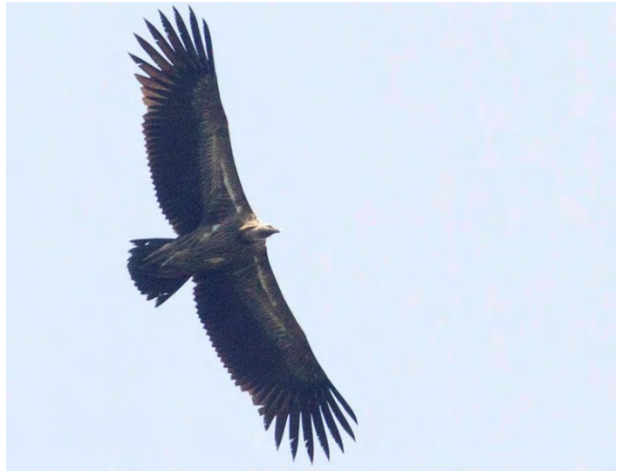
Himalayan Griffons in Kaziranga.

White-rumped Vulture Gyps bengalensis 1 in Kaziranga 19/4.