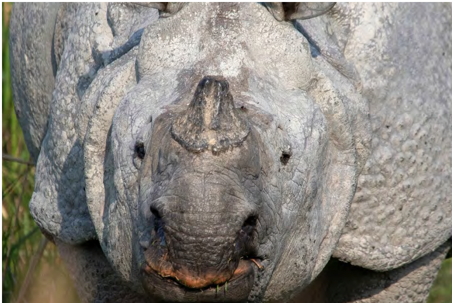
Greater One-horned Rhinoceros.

Assam Macaque Macaca assamensis 15+8 in Kaziranga 19/4 and 21/4.