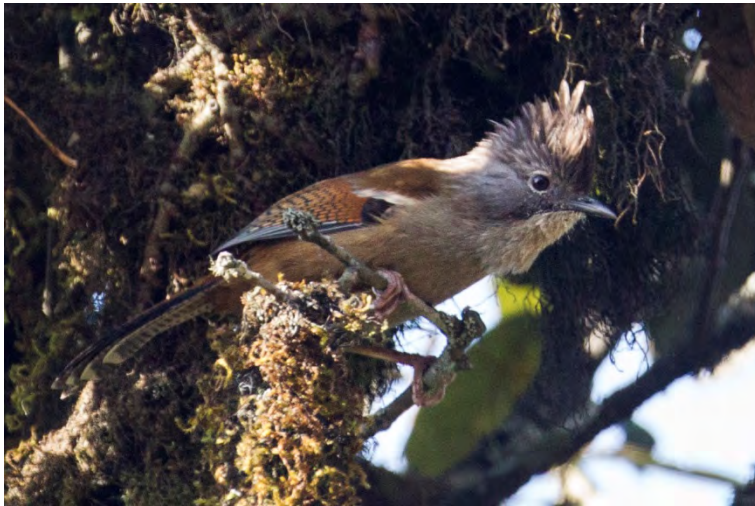
Hoary-throated Barwing.

Hoary-throated Barwing Actinodura nipalensis 1 Eaglenest Pass 15/4.