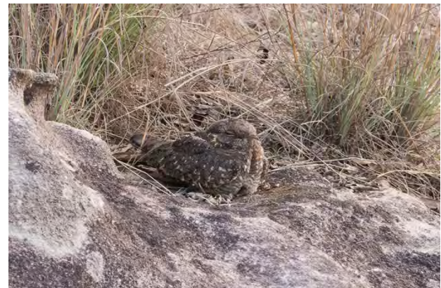
Wedge-tailed Green-pigeon, White-throated Needletail, Asian Openbill and Savanna Nightjar.

Silver-backed Needletail Hirundapus cochinchinensis 2 near Bompu camp 16/4.