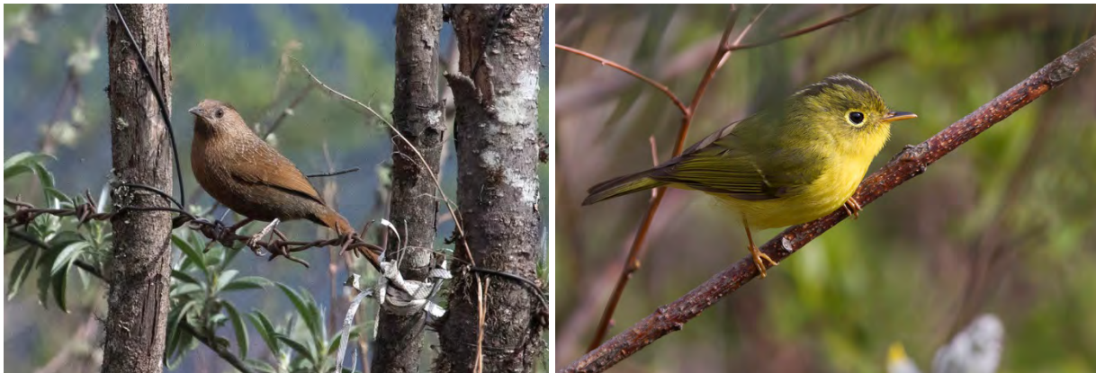
Bhutan Laughingthrush och Whistler's Warbler.

På tillbakavägen mot Dirang sågs bl.a Streak-breasted Scimitar-babbler , Bhutan Laughingthrush samt en mycket lättprovocerad Whistler's Warbler .