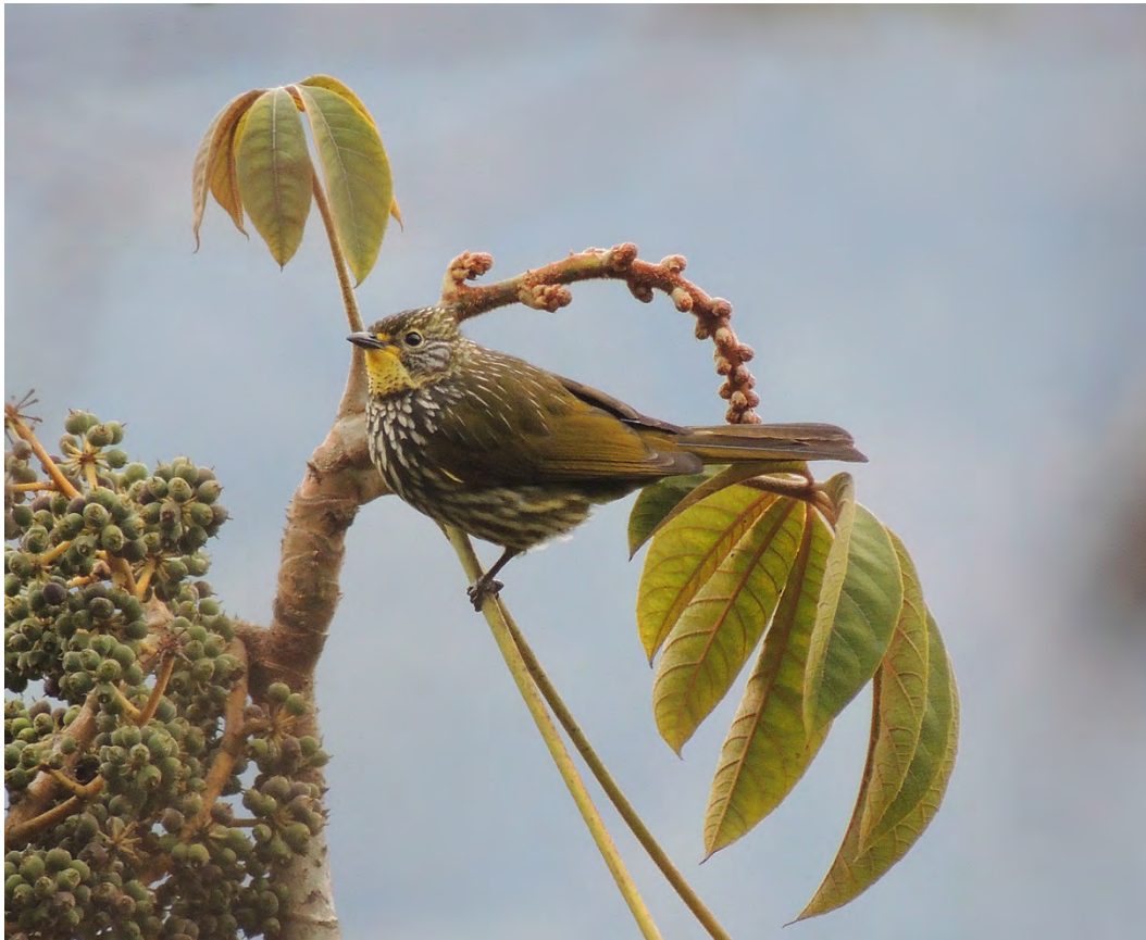
Striated Bulbul.

Striated Bulbul Pycnonotus striatus 1 Mandala road 12/4, 2 13/4, and 2 to 10 daily in Eaglenest area 14-18/4. (nominate)