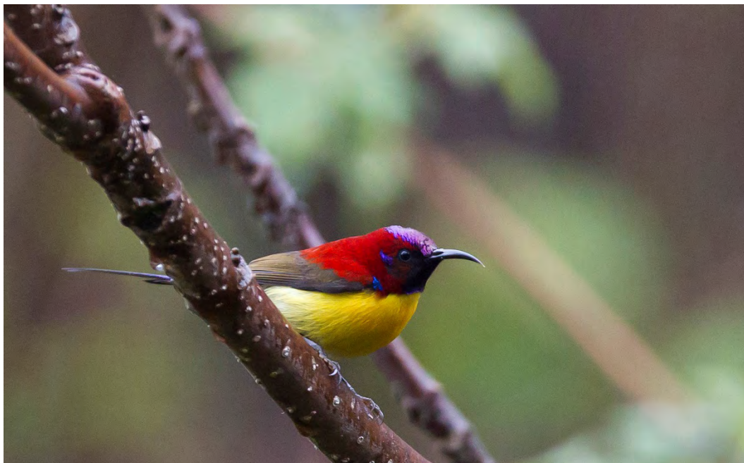
Gould's Sunbird.