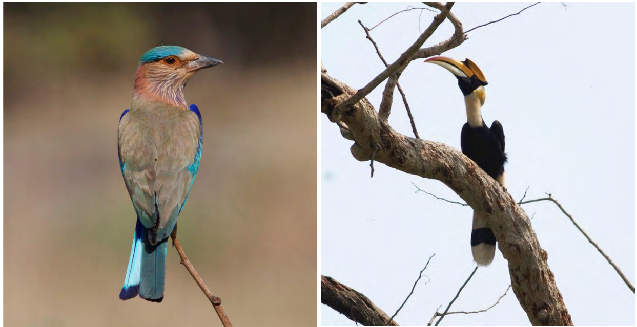
Indian Roller and Great Hornbill.

Great Hornbill Buceros bicornis 15+3 Nameri 8-9/4, and 2+1 Kaziranga 19-20/4.