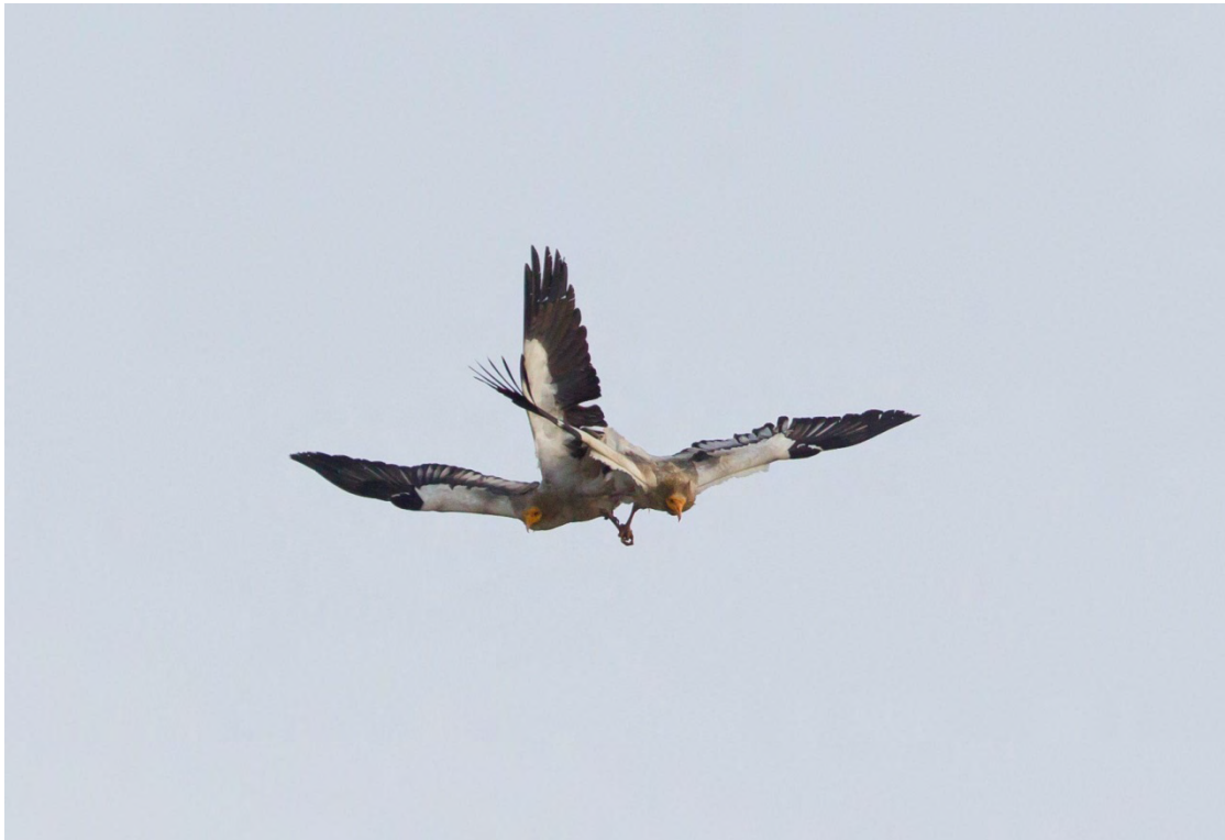
This pair of Egyptian Vultures was seen in Bandhavgarh when they mated high up in the air and tumbled around and fell to the ground.

Egyptian Vulture Neophron percnopterus 1+2+5 in Bandhavgarh 24-26/4. ( ginginianus )