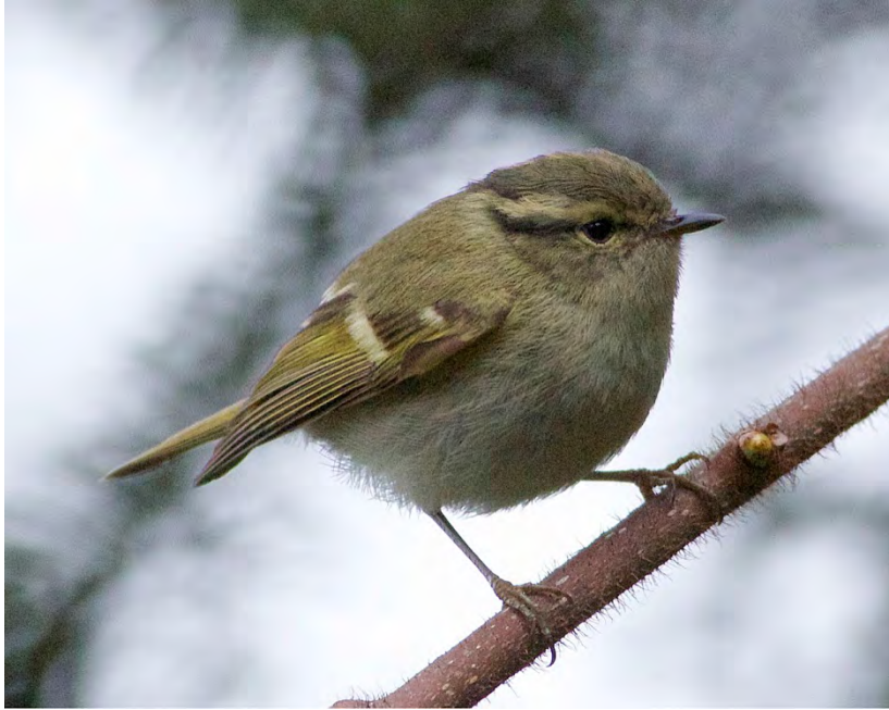
Lemon-rumped Warbler.

White-spectacled Warbler Seicercus affinis 1 Mandala road 12/4, 1 Lama camp 14/4, and 2 Eaglenest 15/4. (nominate)