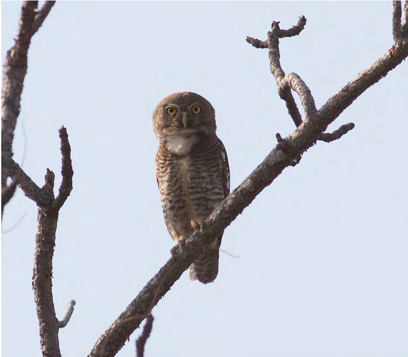
Jungle Owlet.

Jungle Owlet Glaucidium radiatum In Bandhavgarh 3 heard (and 1 seen) 25/4, and 6+ 26/4 (at least 3 seen). (nominata)