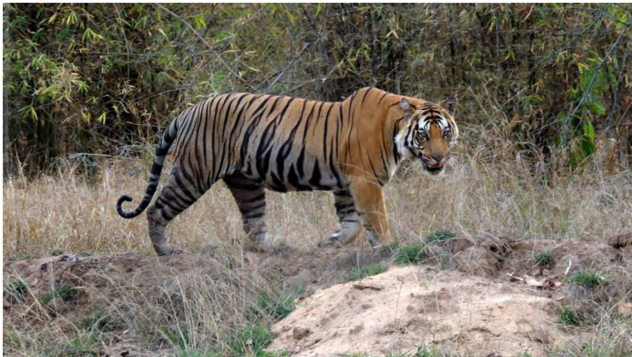
En av resans höjdpunkter: tiger.

I samband med lunchpausen var det flera av oss som kände av en jordbävning igen (förra gången var det fjorton dagar tidigare i Dirang). Och nu var det den stora jordbävningen som drabbade främst Nepal, men som ändå gjorde många av våra anhöriga hemma lite oroliga.