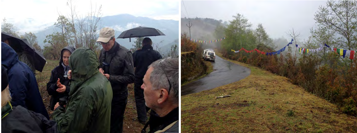
Heldagsskådning längs Mandala road började i lätt regn.

Trush, Grey-winged Blackbird, Stripe-throated Yuhina, Bar-throated Minla samt en Fire-tailed och ett flertal Gould's Sunbirds . Tre Common Cuckoos samt ett flertal Great Barbets sågs eller hördes också.