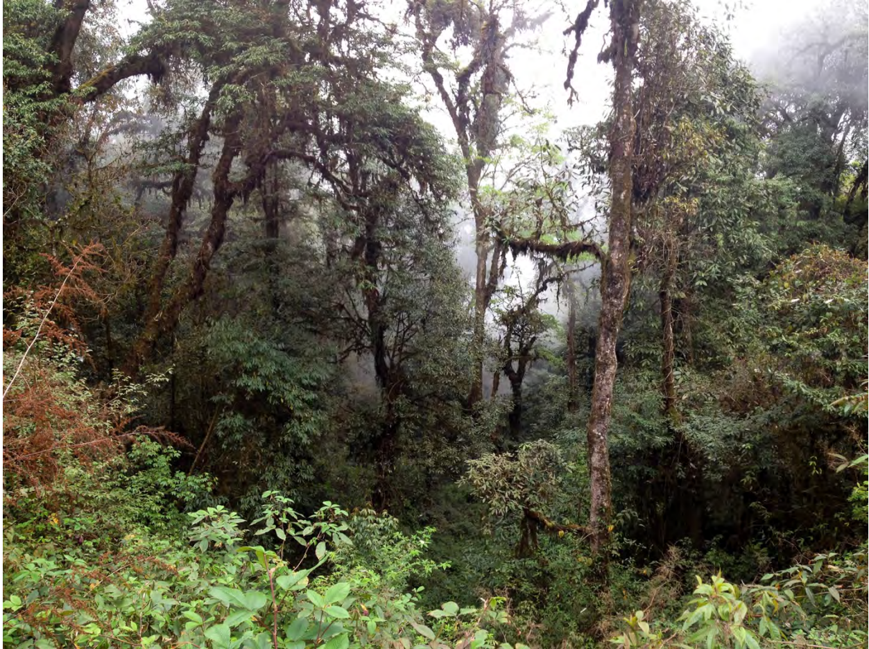
Vacker och artrik regnskog i Eaglenest Sanctuary.

15/4. Nu var det dags för förflyttning till det andra lägret i Eaglenest Sanctuary, det f.d. militärlägret Bompu camp. Vägen dit gick via Eaglenest Pass, på en smal och hissade bergshylla (2,20 m bred...) med ett flera hundra meter högt stup nedanför. Värst var det för dem, bl.a. mig, som satt på vänster sida i bilarna... Men vi kom oskadda fram till mindre otrevliga vägar på andra sidan passet. Vid ett av de första stoppen upptäcktes på halvlångt håll några finkar som vi efter en stund kunde bestämma till ett par av Crimson-browed Finch , nr 2 och 3 på resan av denna svårfunna art. En kortare vandring i fin skog lämplig för bl.a. Ward's Trogon, gav tyvärr ingen sådan, men däremot bl.a. White-browed Bush-robin , bra obsar på skulkaren Chestnut-headed Tesia samt en hörd Blyth's Tragopan .