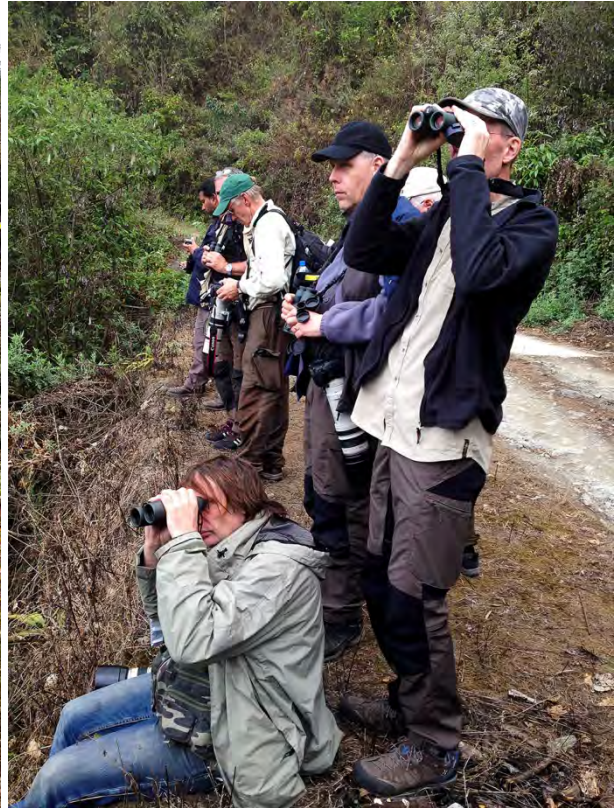
Fältlunch, vila, Lama camp och vägsådning i Eglenest Sanctuary.