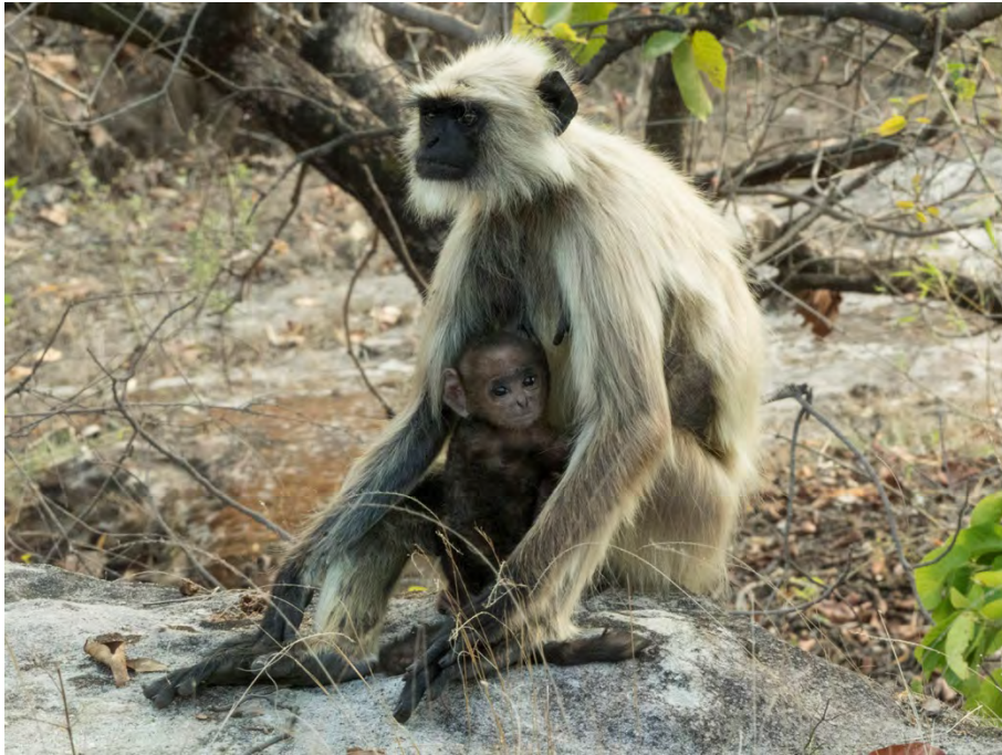
Banded Sacred Langur with juvenile.

Northern Plains Gray Langur Semnopithecus entellus Common in Bandhavgarh 24-26/4. HMW: Banded Sacred Langur