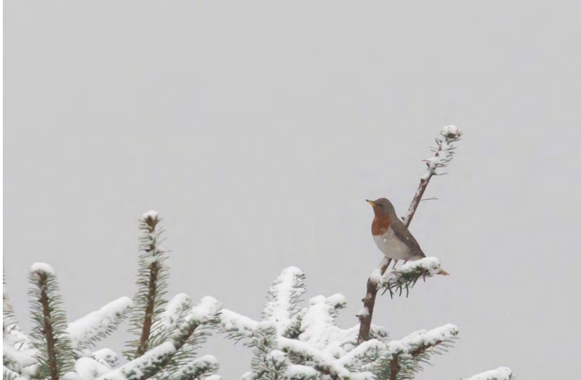
Rufous-throated Thrush.

Black-throated Thrush Turdus atrogularis 1 male Mandala road 12/4.