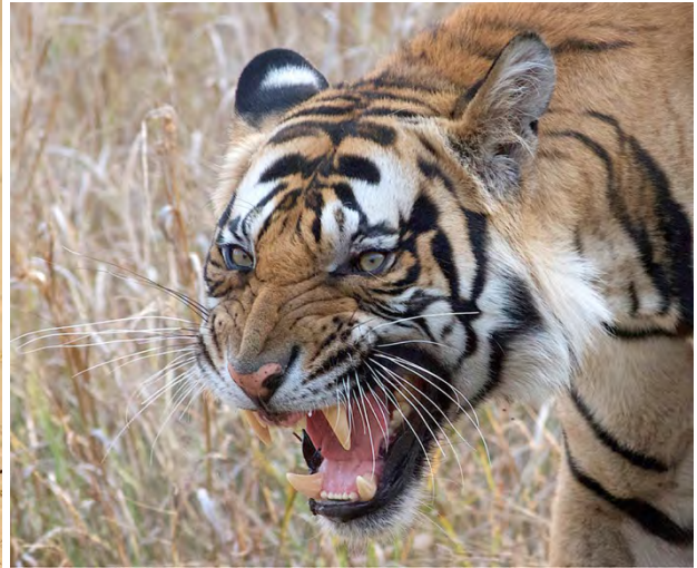
Golden Jackal and Tiger.

Tiger Panthera tigris 1 younger male seen at close distance in the afternoon in Bandhavgarh 24/4, 2 younger ones were seen fairly well 25/4, and one was heard 26/4. ( tigris )