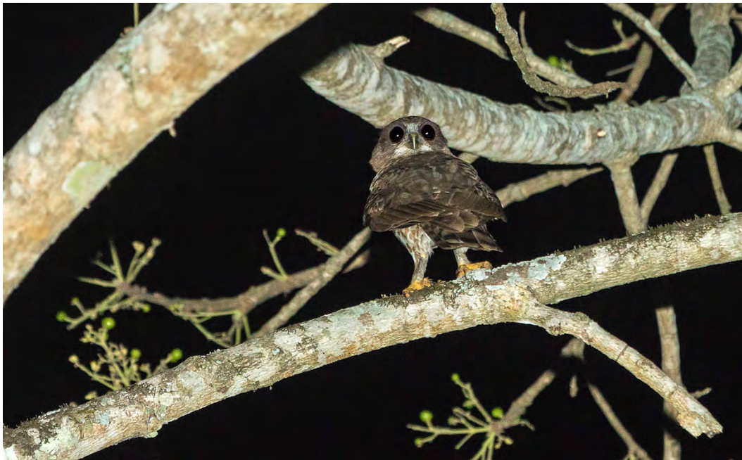
Brown Hawk-Owl.

Collared Owlet Glaucidium brodiei 1 heard (h) from our hotel in Dirang 12/4, 1 h 13/4, 2 h Lama camp, Eaglenest 14/4 and 1 h 15/4, 2 h around Bompu camp 16/4 and in the same area 1 seen and 4 h 17/4, 1 h 18/4, and 1 seen and photographed in Bandhavgarh 26/4. (nominate)