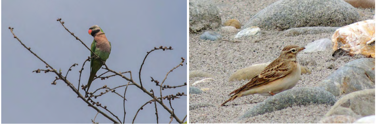
Red-breasted Parakeet and Greater Short-toed Lark.

Long-tailed Broadbill Psarisomus dalhousiae 2 seen en route to Dirang 10/4 and 1 in the Eaglenest area 16/4. (nominate)