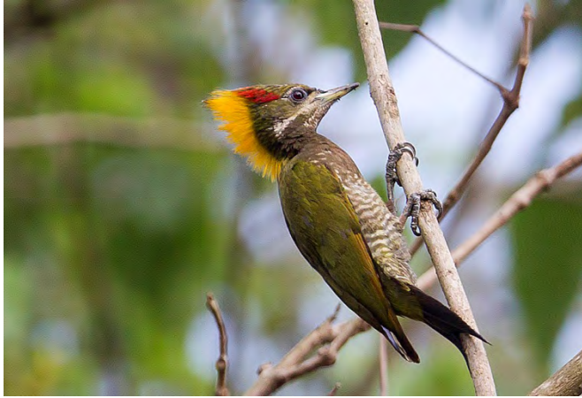
Lesse Yellowname, female.

Scarlet-breasted Woodpecker Dryobates cathpharius 2 near Lama camp 14/4. (nominate) IOC: Crimson-breasted Woodpecker Dendrocopos cathpharius