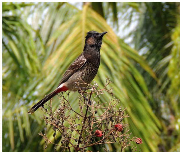
Lesser Adjutant och Red-vented Bulbul.

8/4. Denna dag ägnades helt Nameri National Park, ett stort skogsområde som från campen sett ligger på andra sidan Jia Bhorelli River. Över denna flod skeppas man i långsmala båtar som tar ca sex passagerare åt gången. Tekniken vid överskeppningen var mycket intressant. Båtarna stakades först snett uppströms varefter de fick driva med vattnet till landstigningsplatsen på andra sidan. Väl uppe på land väntade ett ca 500 meter brett rullstensfält som man fick korsa för att komma fram till parkens administrationsbyggnad i skogskanten. Fältet saknade dock inte sina speciella fåglar – River Lapwing , Little Pratincole och Greater Short-toed Lark . Längs floden drog River Terns .