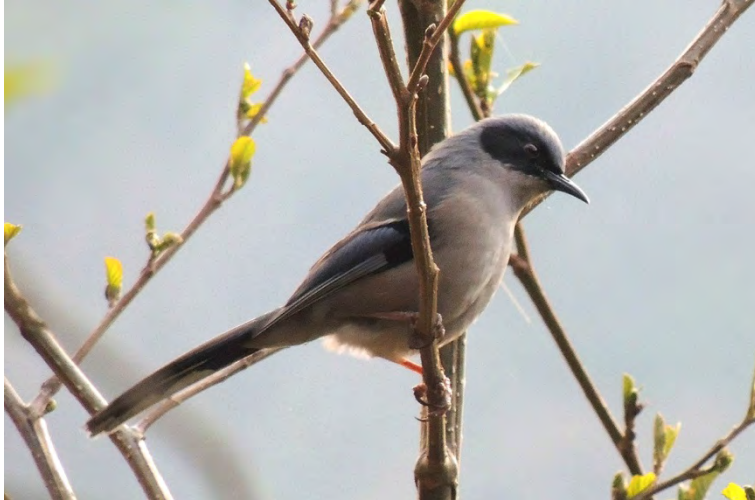
Beautiful Sibia.

Streak-throated Barwing Actinodura waldeni 14 in the Eaglenest area 15/4. ( daflaensis )