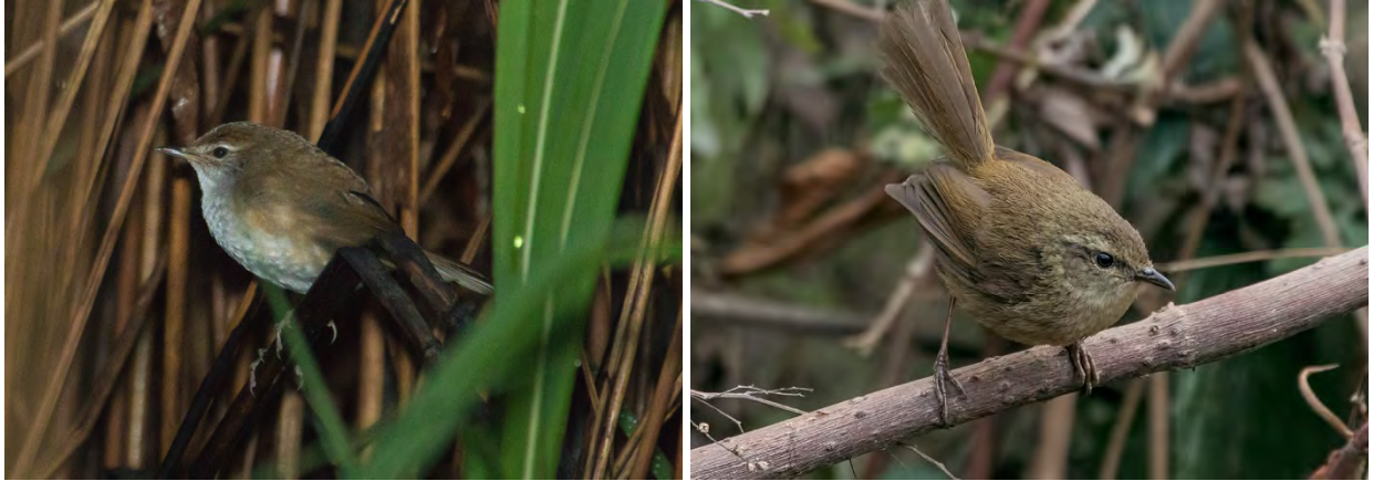
Spotted Bush-warbler and Brownish-flanked Bush-warbler.

Clamorous Reed-warbler Acrocephalus stentoreus 4 seen and heard at Basai wetlands 23/4. ( brunnescens )