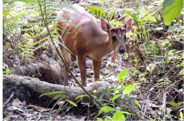
Hog Deer and Red Muntjac.

Wild Boar Sus scrofa 10 to 25+ daily in Kaziranga 19-21/4, and 4+30+20 in Bandhavgarh 24-26/4.