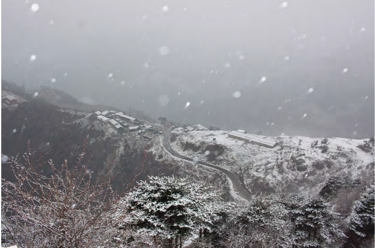
Snö och dimma kring bergspasset Se La på över 4 000 m höjd.

På tillbakavägen mot Dirang sågs bl.a Streak-breasted Scimitar-babbler , Bhutan Laughingthrush samt en mycket lättprovocerad Whistler's Warbler .