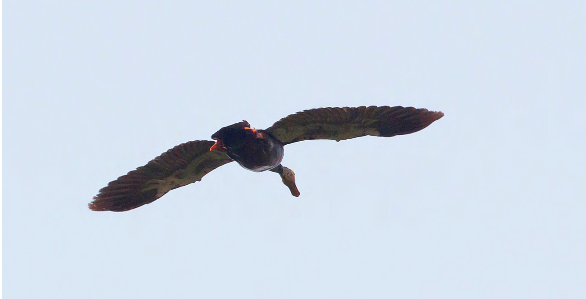
Vår eftersökta White-winged Duck.

Andra fina arter under dagen var bl.a. Brown-backed Needletail , Black Stork , Indian och Great Thick-knee , Oriental Honey-buzzard , Pallas's Fish-eagle , Blue-bearded Bee-eater , Greater Flameback , Lesser Yellownape , Black-necked , Grey-capped och Fulvous-breasted Woodpecker , Peregrine Falcon , White-browed Wagtail , Orange-headed Thrush , Rusty-tailed och Pale-cheeked Flycatcher , Tickell's- och Hume's Leaf-warbler , Sultan Tit , Chestnut-breasted och Velvet-fronted Nuthatch , Black-throated och Crimson Sunbird samt Yellow-vented Flowerpecker .