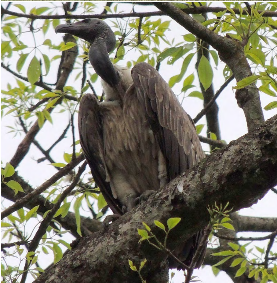
Indian Vultures in Bandhavgarh and Slender-billed Vulture in Kaziranga.