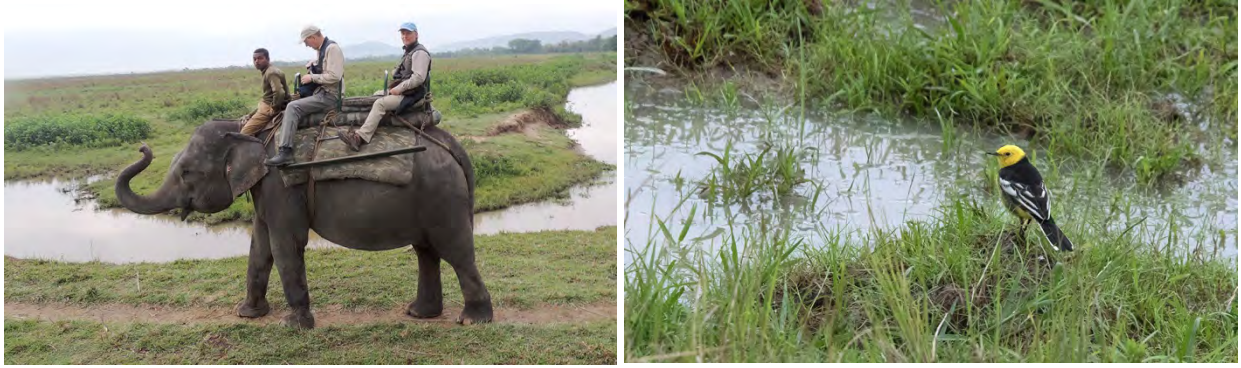
Givande elefantritt i Kaziranga och citronärsla.

Dels kom vi mycket närmare de stora djuren, särskilt noshörningarna och Barasingha , och dels stötte vi eller kom nära en del fåglar ute i elefantgräset som vi annars antagligen inte skulle ha fått se. Det gäller Asian Blue Quail , Yellow-legged Buttonquail , Bengal Bushlark , Striated Babbler , Golden-headed Cisticola och Chestnut-capped Babbler .