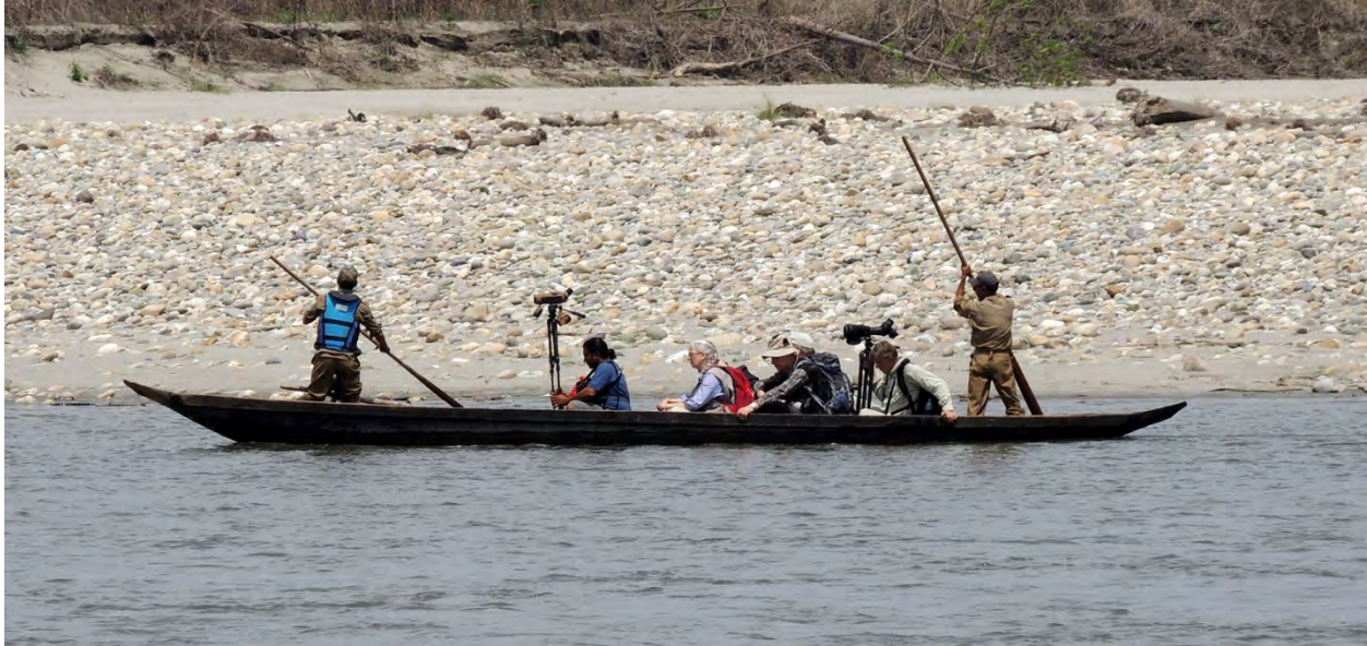
Flodfärd i Nameri National Park.

Vi gjorde två överfärder till parken denna dag – på morgonen respektive eftermiddagen – och företog båda gångerna tämligen omfattande vandringar. Vi åtföljdes av en liten skarpögad vakt med hagelgevär, som han skulle skjuta i luften med om något farligt djur hotade. Det finns både tiger, elefant, vattenbuffel och gaur här – den svenska grupp vi mött på flygplatsen i Guwahati hade attackerats av en tjur av sistnämnda art några veckor tidigare. När vi gick iland på morgonen stod fyra vattenbufflar och blängde i vegetationsbrynet och på den stig vi sedan följde nära stranden mot norr fanns det färskas tigerspår... I hela området var det gott om elefantspillning, men närmare än så kom vi inga farliga djur. Fåglar av varjehanda slag trillade dock in hela tiden – parken är oerhört rik på både arter och individer. Den viktigaste målarten var White-winged Duck som vi först letade efter i en mindre damm i skogen där ett par varit regelbundna tidigare på vintern. Här fanns de dock inte nu och inte heller i flera andra småvatten som vi senare besökte. Sent på eftermiddagen stod vi vid en liten våtmark i skogen där de också kunde finnas. Plötsligt hördes ett lockrop som sedan kom allt närmare tills en stor and kom fram över trädtopparna rakt mot oss på ca 25 meters höjd för att sedan ändra kurs 90 grader och försvinna lågt över våtmarksstråket. Därvid kunde vi mycket tydligt se de stora vita vingfläckarna – detta var vår eftersökta White-winged Duck!