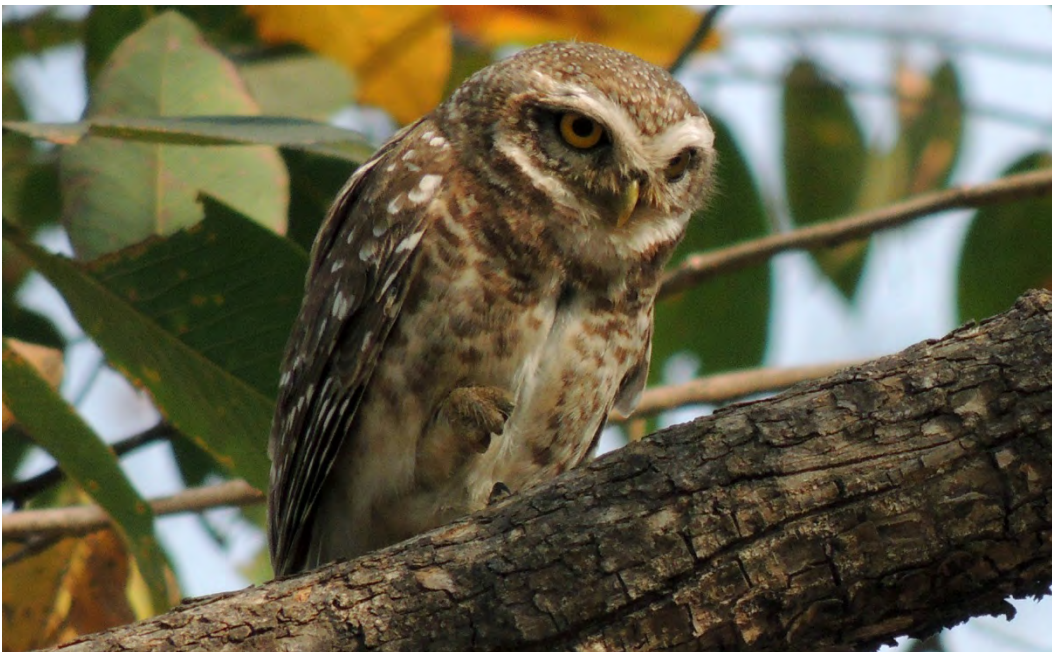
Spotted Owlet.

Spotted Owlet Athene brama 1 seen in Nameri 8/4, 3 seen in one tree in Nameri 9/4, 1 seen daily in Kaziranga 19-21/4, and 1 seen in Bandhavgarh 26/4. ( indica )