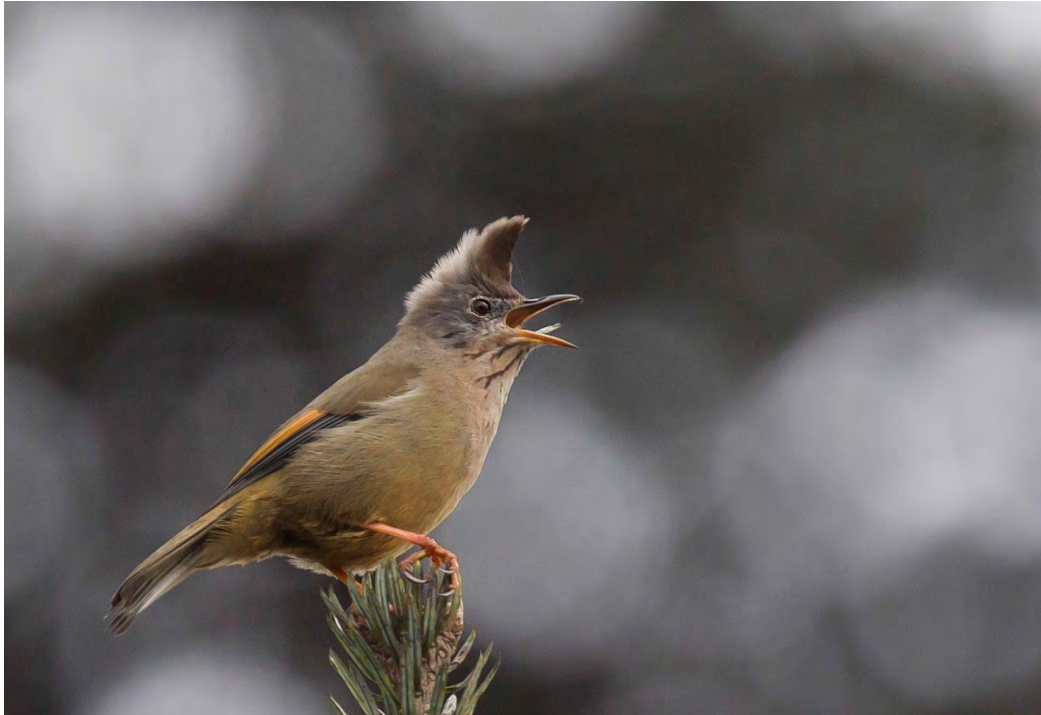
Stripe-throated Yuhina.

Stripe-throated Yuhina Yuhina gularis 15+ Mandala road 12/4, and 5-15 seen daily in the Eaglenest area 15-18/4. (nominate)