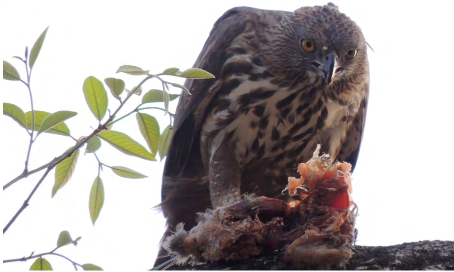
Changeable (Crested) Hawk-eagle in Bandhavgarh.

Greater Spotted Eagle Clanga clanga 1+1 in Kaziranga 19-20/4.