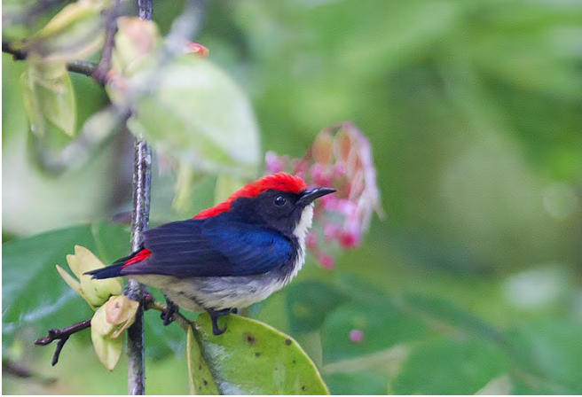
Scarlet-backed Flowerpecker.

Black-hooded Oriole Oriolus xanthornus 10+2 Nameri 8-9/4, 1 to 2 seen and heard daily in Kaziranga 19-21/4, and 1-2 daily in Bandhavgarh 25-27/4. (nominate)