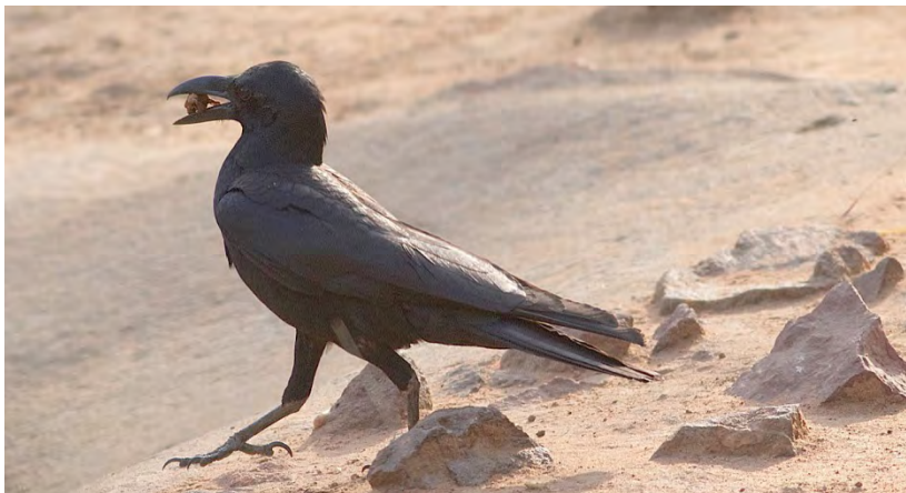
Large-billed Crown (or Indian Jungle Crow) in Bandhavgarh.

Note: HBW Alive: "Taxonomy confusing owing to large number of races covering wide geographical area. Races probably represent several different species."