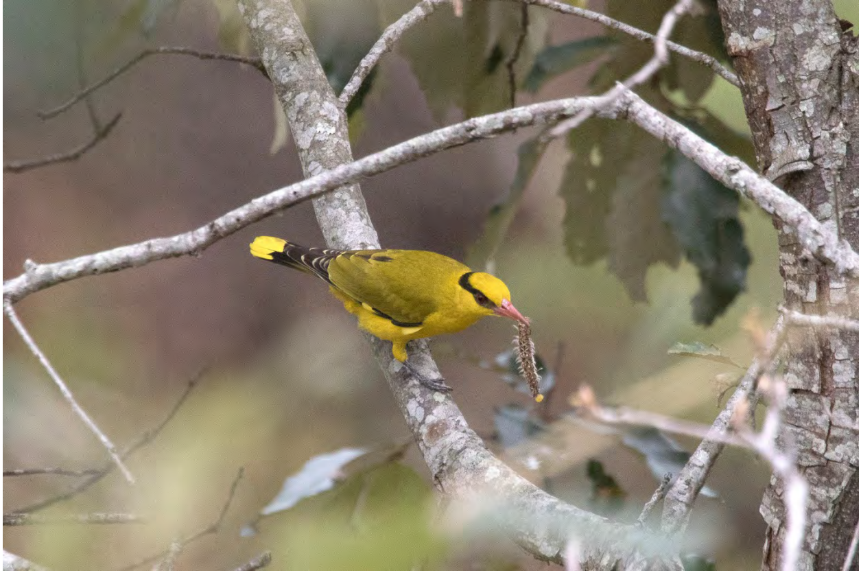
Slender-billed Oriole.

Lama camp är ett tältläger som ligger precis på gränsen till det berömda Eaglenest Sanctuary, ett stort reservat med i första hand bergsregnskog. Efter att ha installerat oss här gjorde vi en eftermiddagstur nedför den väg som vi kommit hit på. Den främsta målarten var Bugun Liocichla, en art som upptäckts här som ny för världen för bara några år sedan. Den brukar följa flockar av Barwings, och av sådana såg vi sex Rusty-fronted , dock tyvärr utan någon Liocichla i släptåg. Vi fick nöja oss med Rufous-bellied Woodpecker (hade bo nära campen), Maroon-backed Accentor (sågs dock bara av Leio och mig), Ashy-throated och Chestnut-crowned Warbler , Golden Babbler , Long-billed Wren-babbler , Greater Rufous-headed Parrotbill och Golden-naped Finch .