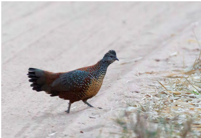
Painted Spurfowl (endemic).

Painted Spurfowl Galloperdix lunulata Seen in Bandhavgarh: 3 25/4 and 1 pair + 2 females 26/4. Endemic.