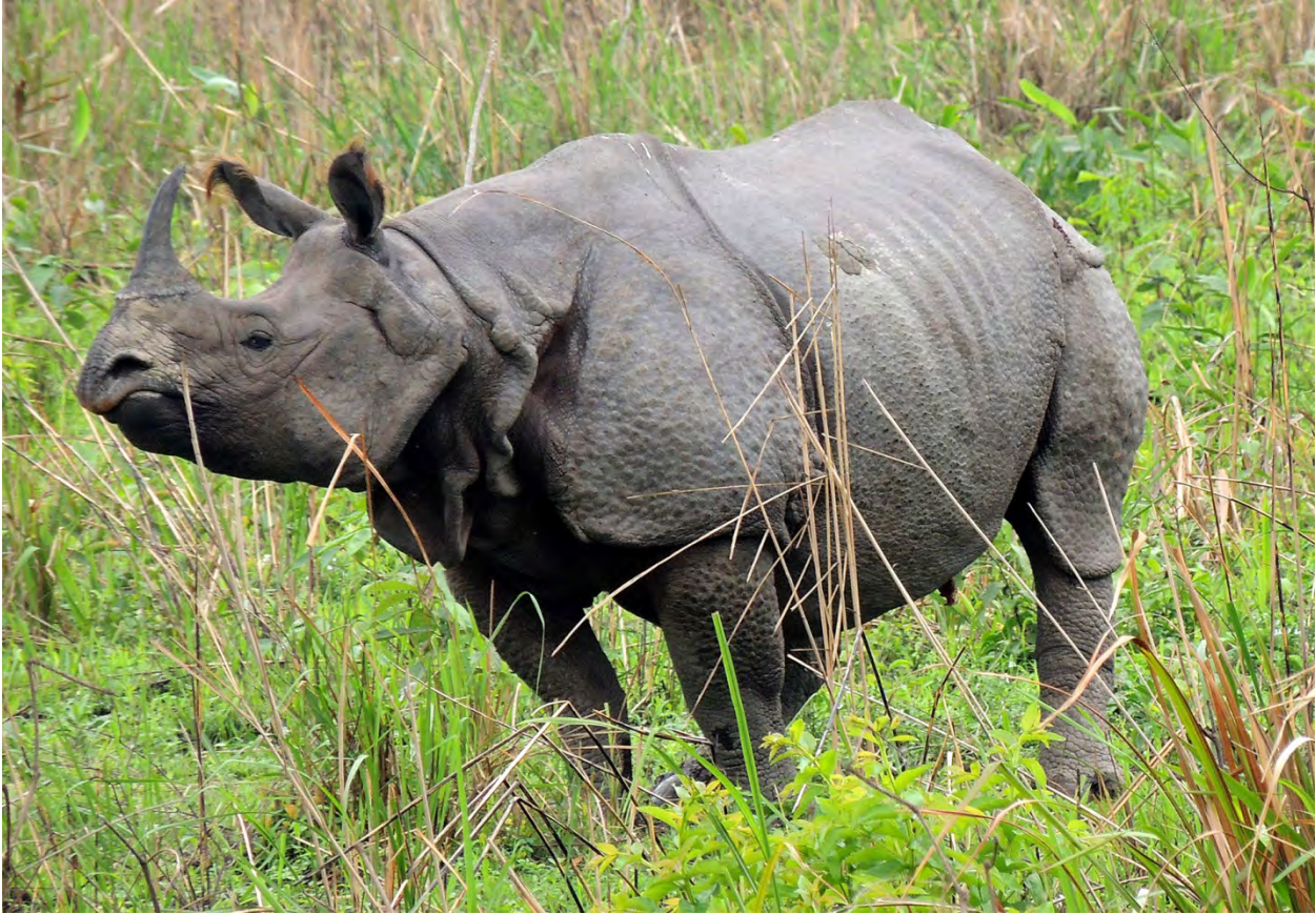
Den indiska pansarnoshörningen är lätt att se i Kaziranga.

Eftersom vi nu helt bytt miljö såg vi många nya fåglar, särskilt vattenbundna arter och rovfåglar. Storkar var särskilt iögonfallande med 15+ Greater Adjutants samt 10+ Asian Woollynecks och 15+ Black-necked Storks . Vi räknade också över 50 Spot-billed Pelicans . De flesta övervintrande änder och vadare hade nog lämnat området, men vi såg i alla fall bl.a. två Lesser Whistling Ducks , tre Grey-headed Lapwings , två Marsh Sandpipers samt – lite oväntat – två Asian Dowitchers .