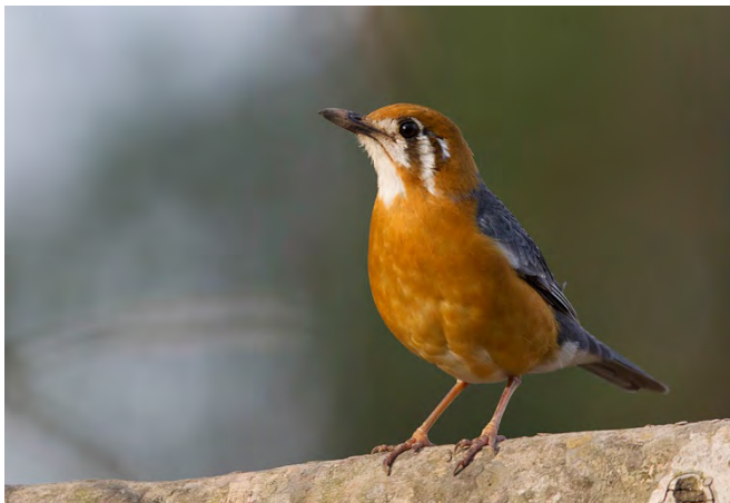
Orange-headed Thrush in Bandhavgarh.

Orange-headed Thrush Zoothera citrina 1 Nameri 8/4, and 3+1+1 in Bandhavgarh 25-27/4. (nominate in Nameri, and cyanota in Bandhavgarh) IOC: Geokichla citrina