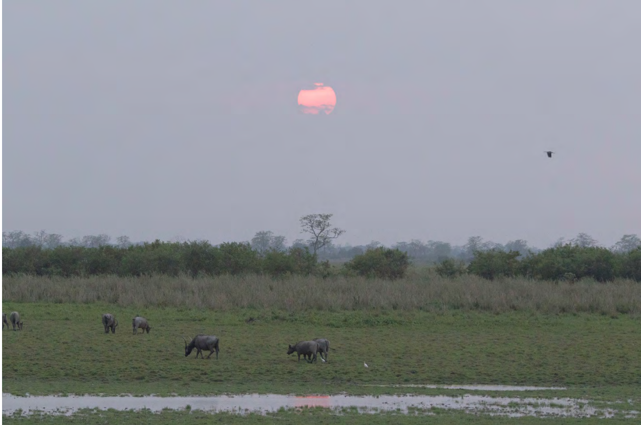
Asian Wild Buffaloes in Kaziranga.

Asian Buffalo Bubalus arnee 4+1 in Nameri 8-9/4 and common in Kaziranga 18-21/4. ( fulvus ) HMW: Asian Wild Buffalo