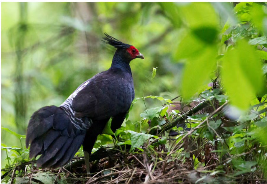
Kalij Pheasant.

Kalij Pheasant Lophura leucomelanos 2 males seen near Bompou camp 16/4, in Kaziranga 1 pair + male 20/4 and 1 pair + female 21/4. ( lathamii )