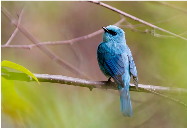
Asian Verditer-flycatcher.

Asian Verditer-flycatcher Eumyias thalassinus 4 en route to Dirang 11/4, 2 Mandala road 12/4, and 5-10 daily in the Eaglenest area 14-18/4. (nominate) IOC: Verditer Flycatcher