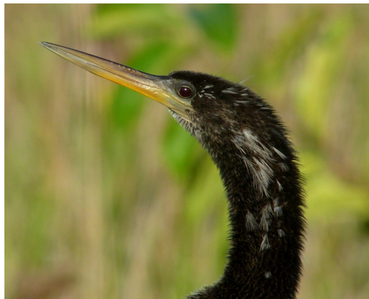
Amerikansk ormhalsfågel, hane.

Här intogs mat av de som inte åt picknick tidigare (hamburgare), och vi gick runt en liten stund i området utan att egentligen se något märkvärdigt. Vid parkeringen fick vi dock syn på tre små fåglar som flög upp i ett träd, och en av dem kunde tubas