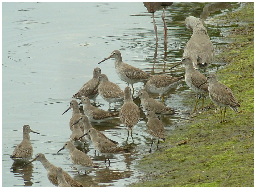
Mindre beckasinsnäppor, kärrensäppor och en willet.

Reservatet upptar en stor del av ytan på Sanibel Island, och det finns en bilväg (Wildlife Drive) genom det samt några kortare vandringsleder. Vi betalade avgiften och körde in på Wildlife Drive. Redan på första stoppet drog vi in ett lass nya resarter i form av sotvingad mås, fläckdrillsnäppa, grönryggig häger och gulkronad natthäger. Vi körde sakta runt slingan och stannade till där vi kunde se ut över vatten. Hornpelikaner stod ute på revlarna och bredvid dem såg rosenskedstorkarna minimala ut. Beckasinsnäppor är inte det lättaste att artbestämna, men här är de flesta mindre beckasinsnäppor, och alla som vi lyckades se bra nog att