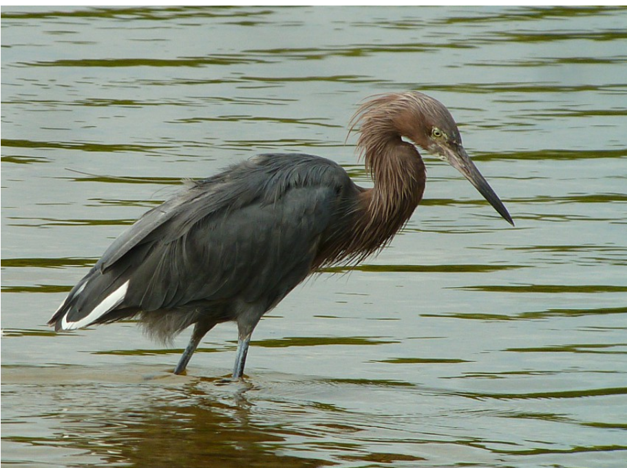
Den sändarmärkta rosthägern "Ding". Antennen sticker upp på ryggen men är lite svår att se på just denna bild.

http://www.seaturtle.org/tracking/index.shtml?tag_id=80262