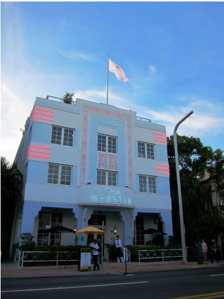
Ett av många Art Deco-hotell, Miami South Beach.

Därefter for vi söderut i regn och tog in på La Quinta Inn i Tamarac, i närheten av Fort Lauderdale.