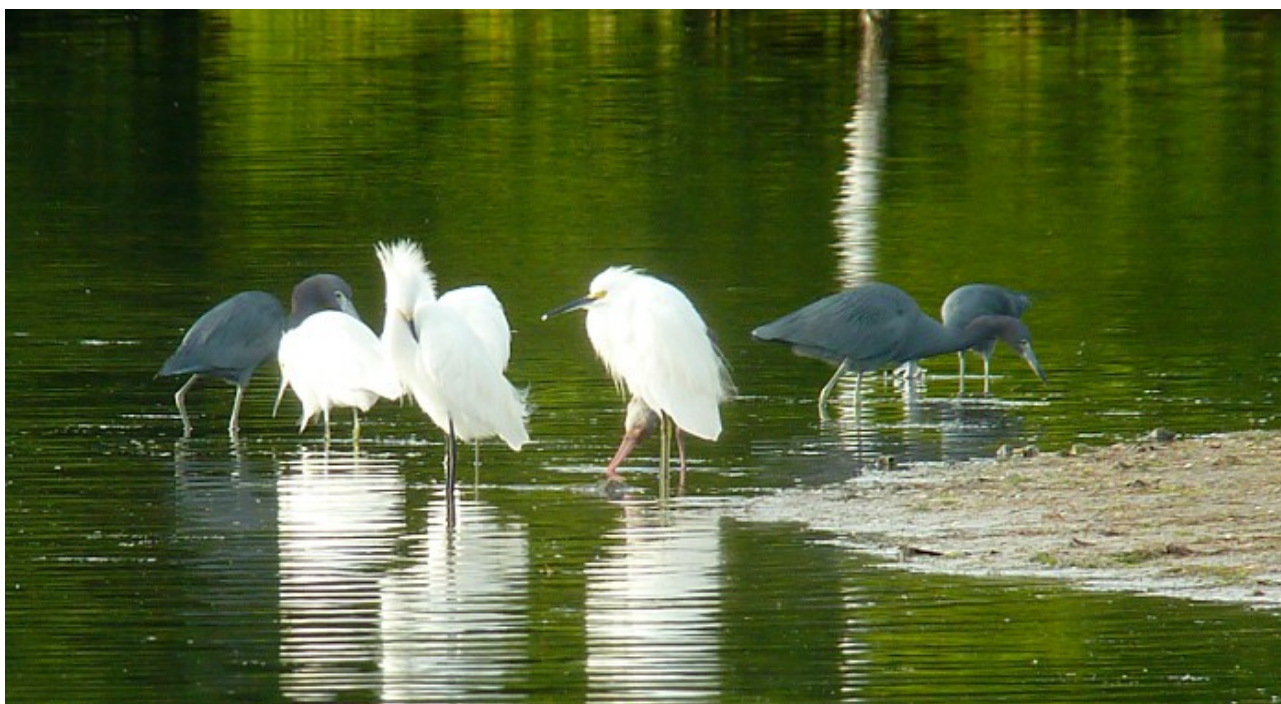
Snöhägrar och blåhägrar i "Ding" Darling.

Därefter tog vi oss en titt på stranden nära resorten, precis intill låg stor tjugusiga hus med ”private property”-skyltar. Vi kunde också studera en av de två amerikanska spillkråkorna som höll till precis utanför resorten. De hade gjort imponerande hål i en elstolpe längs vägen! Efter lite allmän eftermiddagsvila blev det så en tredje tur till ”Ding” Darling. Vi såg inget nytt denna gång, men hade fantastiskt vackert kvällsljus på fåglarna och fina obsar på nära håll. Vi ökade också på antalet fregattfåglar då vi nu såg åtta stycken långt borta. Vi tog en liten promenad på trailen precis vid utfarten till Wildlife Drive, Shell Mound Trail. Vi såg inga fåglar (de hade kanske redan uppsökt nattkvist) men fick lära oss lite om Calusa-indianerna som levde här förr i tiden. Denna kväll åt vi middag på öns kanske kitschigaste restaurang, Lazy Flamingo. Utanför den rosa byggnaden var det fullt med uppblåsbara tomtar och renar och snögubbar och annat juligt som både lyste och rörde på sig. Maten var dock väldigt god!