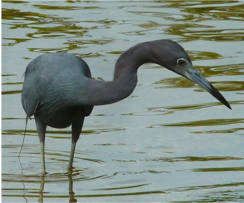
Blåhäger, "Ding" Darling NWR 1/1.