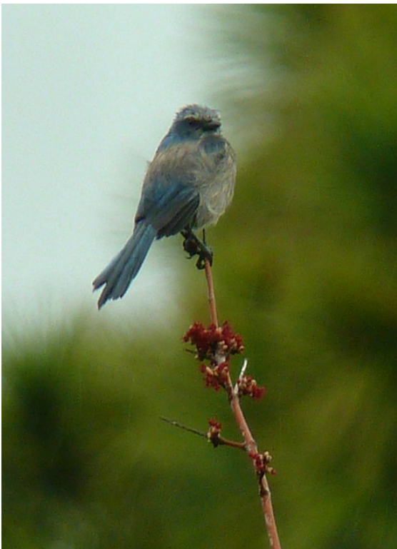
Lite blöt floridasnårskrika

Efter denna introduktion till den floridienska avifaunan styrde vi raskt mot besökscentret. Vid parkeringen hördes ett lite stenknäckslikt läte vilket visade sig tillhöra en röd kardinal, och hundratals rödvingetrupialer for runt. Ännu bättre blev det när vi kikade på centrets lilla fågelmatning. Efter att ha sett inte mindre än tre honor av påvefink så satt plötligt hannen där, en uppenbarelse i gulgrönt, blått och rött. Han såg nästan löjligt färggrann ut, och det engelska namnet Painted Bunting beskriver mycket väl vad det handlar om. Här intogs också den inköpta maten vid ett av picknickborden utanför centret.