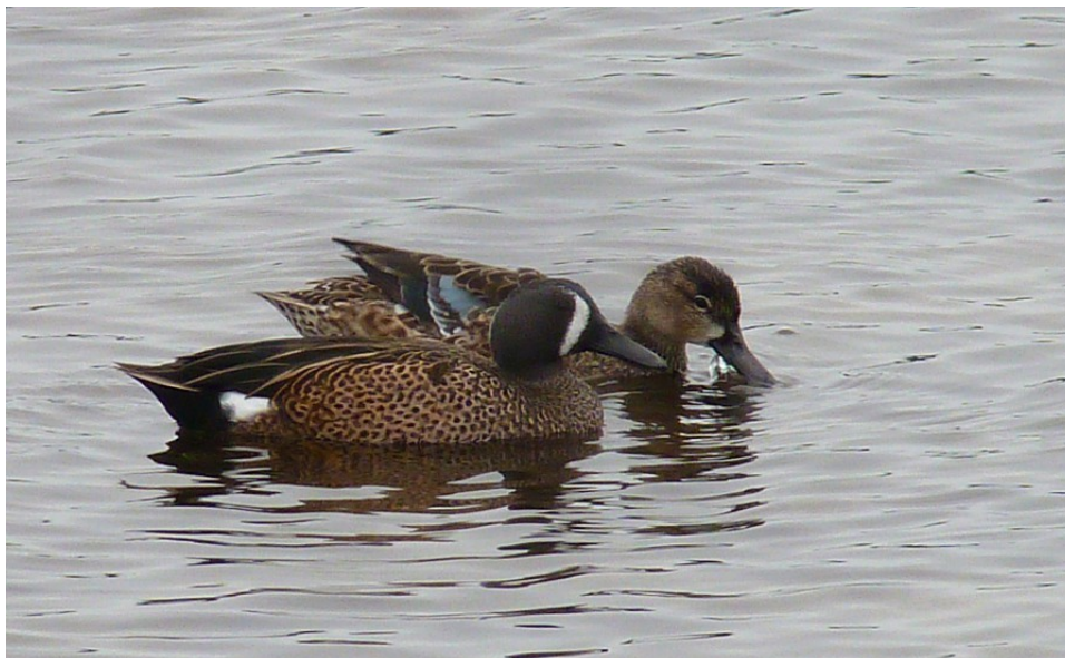
Blåvingad ärta, "Ding" Darling NWR 1/1.