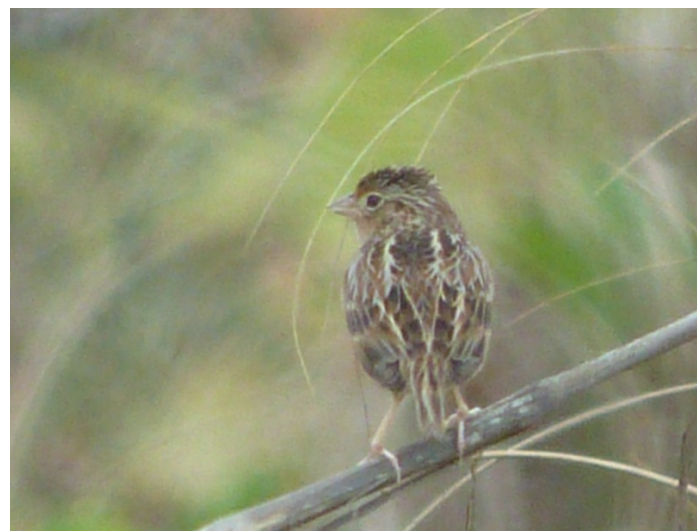
Gräshoppsparv, Bowman's Beach 1/1