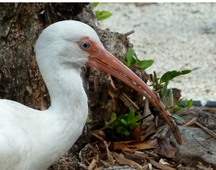
Porträtt av vit ibis

Vårt sista mål för dagen var att försöka få se saxstjärtsstyrann, vilken enligt alla böcker och rapporter skulle vara rätt säker vid Marathons flygplats. Det fanns nu inga precis där, men en kort bit efter flygplatsen fick vi faktiskt syn på tre stycken på en ledning. Det gick dessutom bra att ställa bilen en bit bort och promenera tillbaka på cykelvägen så vi kunde se dem fint. Mycket läckra tyranner med långa stjärtar.