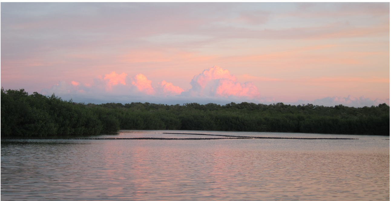
Mängder med amerikanska sothöror på väg in i mangroven. På detta foto uppskattningsvis minst 2000 ex...

Sen kom vi till West Lake och hade väl inte förväntat oss något speciellt. Men när vi gick ner till vattnet hördes ett rejält kackel, och ute i vattnet låg som långa svarta band... det var alla tusentals amerikanska sothöror som spenderat dagen ute i sjön som nu var på väg in att ta nattkvist i mangroven! De simmade in i långa rader, ett enormt skådespel! Att räkna dem var närmast omöjligt, men vi tror att vi måste sett minst 10000 sothöror under den stund vi stod där. Och då hade nog en del redan försvunnit in i mangroven, och det fortsatte att komma fler när vi gick... kombinerat med en vacker solnedgång var vi nog alla rörande överens om att spektakulära hägrar och pelikaner till trots, det här var nog resans stora fågelupplevelse.