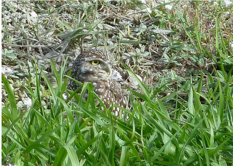
Prärieuggla, Marco Island 3/1.