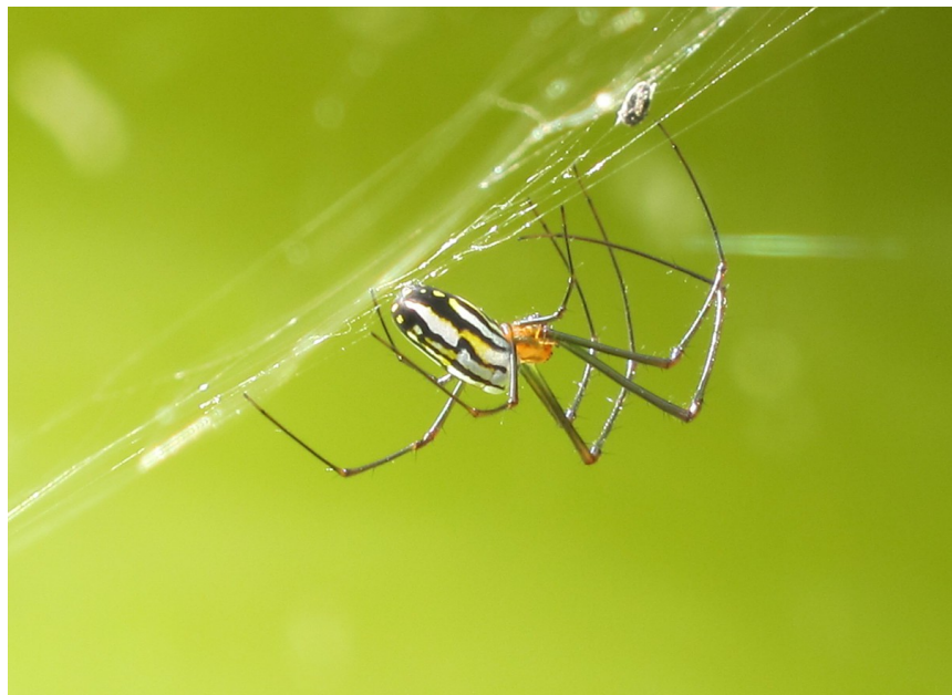
Argyra Orchard Spider, Everglades 7/1