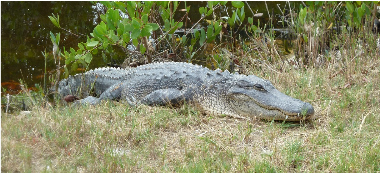
Mississippialligator, "Ding" Darling NWR 1/1