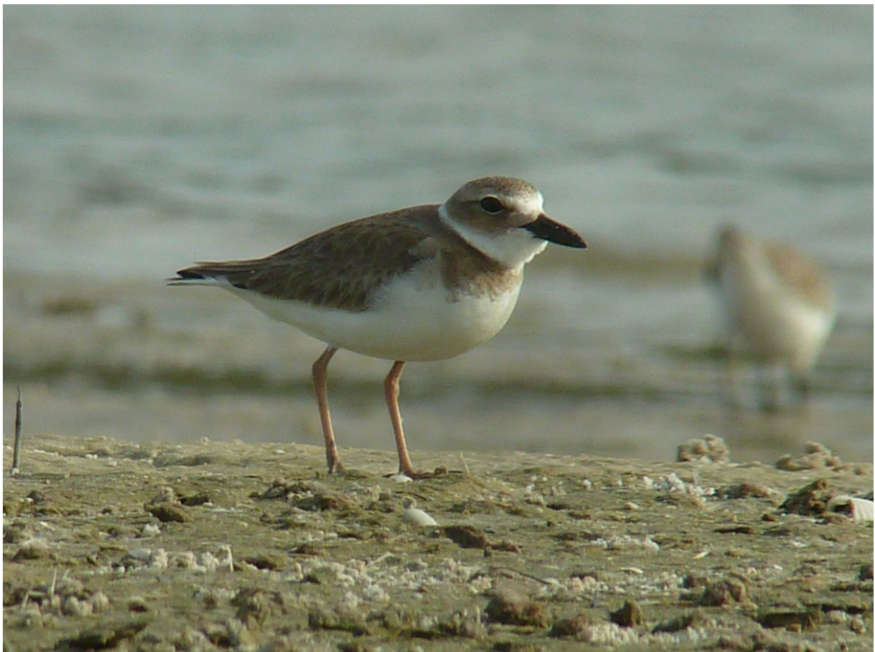
Wilsonstrandpipare, Tigertail Beach 3/1.