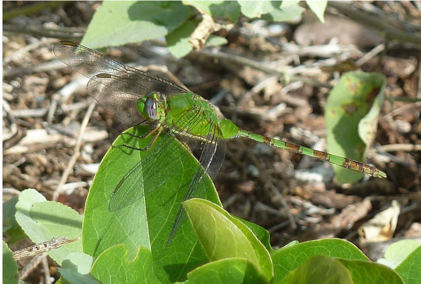
Eastern Pondhawk, Long Key State Park 6/1