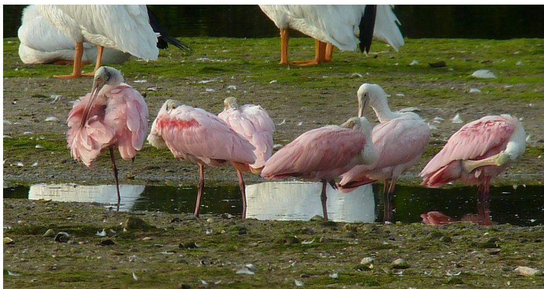
Rosenskedstorkar, "Ding" Darling NWR 1/1.