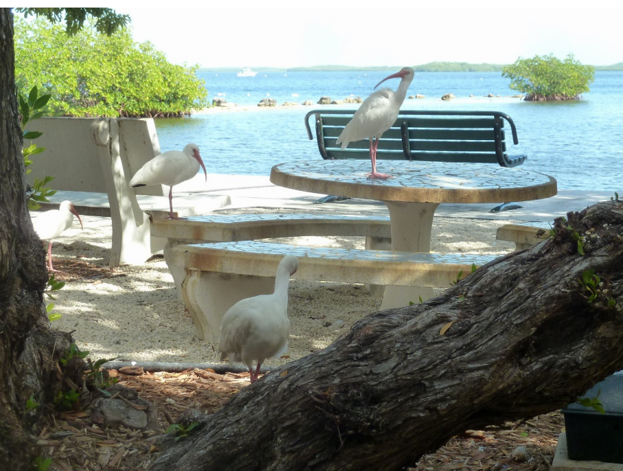
Vita ibisar runt picknickborden.

Vi åt lunch på besökscentret, de hade lite enklare mat såsom sallad och soppa. Vid borden gick vita ibisar runt nästan som gråsparvar hemma. Därefter gick vi Wild Tamarind Trail där vi nästan inte såg några fåglar alls, men då istället kunde studera de olika västindiska trädarterna som växer här på Keys. Roliga namn har de också, torchwood, gumbo limbo och blolly var några. Och så poisonwood som man ska se upp med, saven är giftig och orsakar klåda. Den är såpass stark att även regnvatten som droppar från trädet kan orsaka irritation på huden! Mot slutet av rundan såg vi i alla fall en svartvit skogssångare och två större topptyranner. Tillbaka vid besökscentret gjorde jag