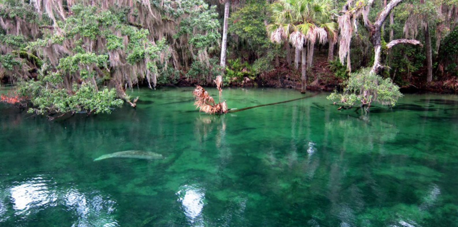
Lamantin i Blue Spring.