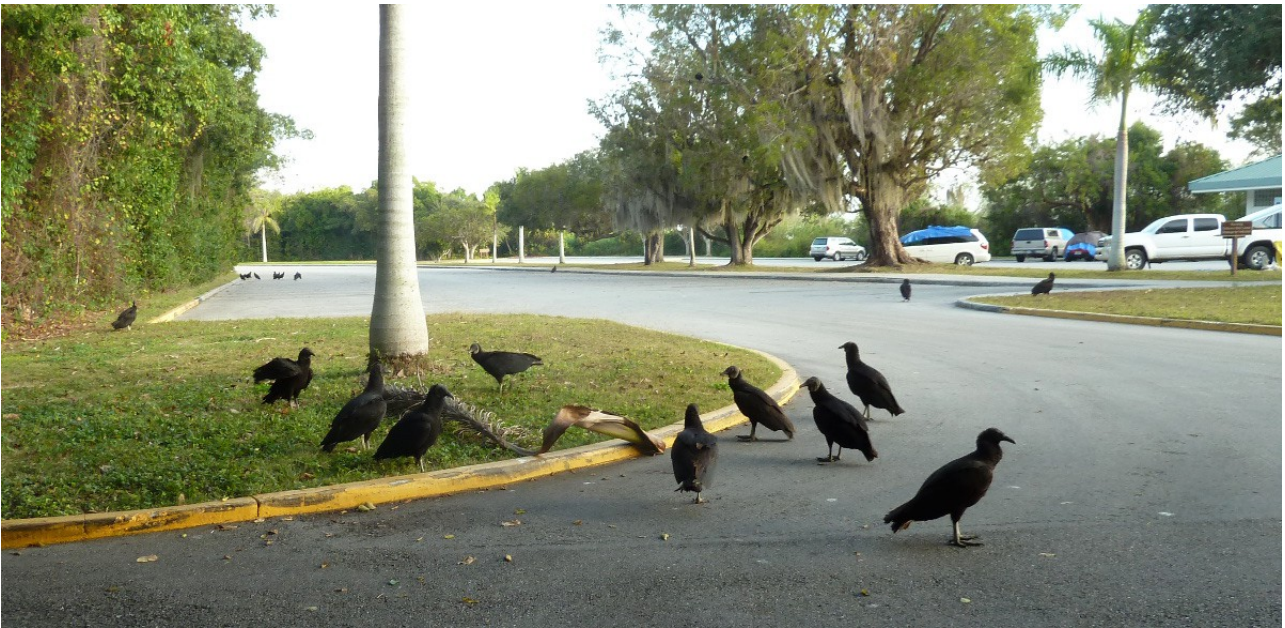
Korpgamarna på parkeringen vid Anhinga Trail.

roliga arter. Precis när vi lämnade Mahogany Hammock fick vi syn på en ljus kortstjärtad vråk och stannade för att se på den. De andra skådarna stannade också och fick se den fint, det är kul när man kan dela med sig! När vi nu körde vidare kom vi in i ett mer trädrikt område med några mindre dammar/sjöar här och var. Den första vi stannade till, Paurotis Pond, gav inte mycket mer än en rosenskedstork och ett par hägrar, men en ung gulbröstad savspett var ju kul att få se. West Lake var en rätt stor sjö, och en boardwalk ledde genom mangroven ut till sjön. Långt långt ute i värmedallret låg tusentals amerikanska sothönor. Här blev det lite picknick för halva gänget, och jag gick till bilen för att hämta en karta. Bra val, då några locklåten gjorde mig uppmärksam på en flock skogssångare. De var otroligt svårjobbade då flocken rörde sig snabbt inne i täta buskar, men jag lyckades få syn på åtminstone två prärieskogssångare, en messångare, en palmskogssångare, en glasögonvireo och bäst av allt, en snabb obs av en hane rödstjörtsskogssångare! Otroligt snygg fågel i svart och orangerött. Tyvärr försvann flocken alltför snart in bland buskarna. Man kan undra vad mer som fanns där, det var betydligt fler fåglar i flocken är jag lyckades få syn på.