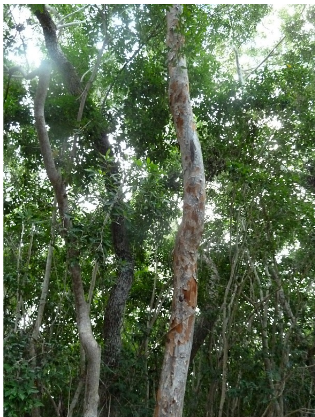
Poisonwood på Key Largo. Se men inte röra, trädet utsöndrar en giftig sav!

Vi körde ut på Key Largo igen, och stannade till vid Key Largo Hammock State Park. Här kan det vara på plats att nämna att ”hammock” i Florida inte syftar på en gungande utemöbel, utan ungefär en plats med mark där större träd kan växa (till skillnad från den vattensanka mark som finns i stora delar här), och i realiteten alltså en trädunge eller mindre skog. Nåväl, i denna park fanns en väg att gå runt, samt en del fallfärdiga byggnader. Tydligt skulle det bli nåt resort-aktigt men projektet övergavs och de byggnader och vägar som hann byggas har sedan fått förfalla. Men