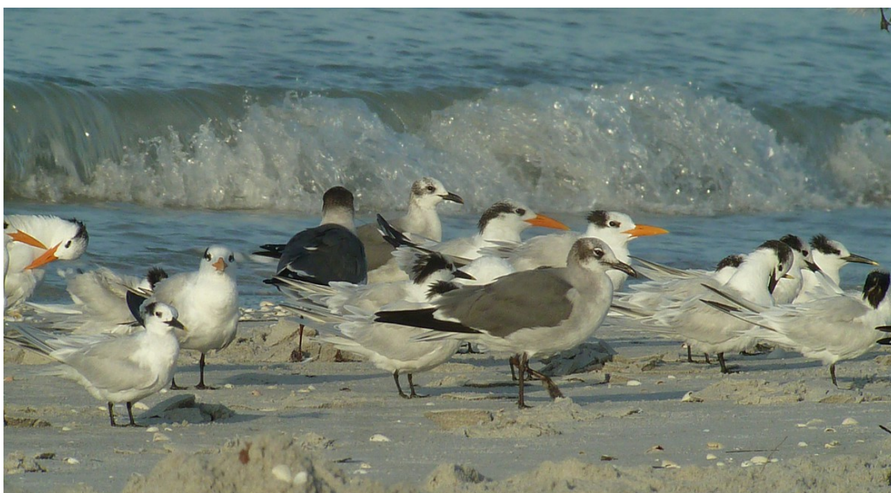
Kungstärnor, kentska tärnor och sotvingade måsar, Bowman's Beach 2/1.