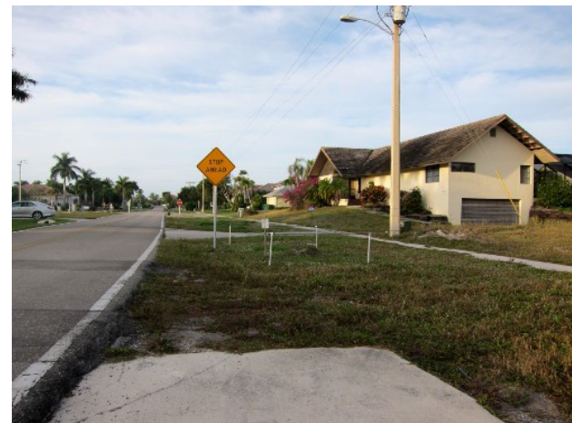
Typisk prärieugglebiotop i Florida

Det finns en bra anledning till detta, och det dröjde inte länge innan vi fick syn på en avspärning som avgränsade ett litet område på en sådan tomt. Såna här avspärningar är till för att skydda djuren som bor där, så vi körde in på en annan gata för att vända och kolla av den bättre. Men inne på den nya gatan fanns en annan avspärning, och där satt djuren vi sökte, två söta prärieugglor utanför sina hålor! Det känns rätt lustigt att se dessa ugglor på så nära håll, mitt i ett villaområde. De rörde inte ens en min när en joggare sprang förbi bara några meter från dem. Prärieugglor är släkt med minervaugglan som finns i Europa, men de häckar på marken, i hålor som grävts antingen av ugglorna själva eller till exempel präriehundar. Ugglorna i Florida tillhör en egen ras, skild från den som finns i övriga USA. Tyvärr minskar de då bebyggelsen ökar i Florida. Man försöker skydda dem genom att spärra av deras bohålor och sätta upp skyltar om att de inte får störas, men pressen på att bebygga dessa områden är förstås stor. Nåväl, vi kunde studera ugglorna