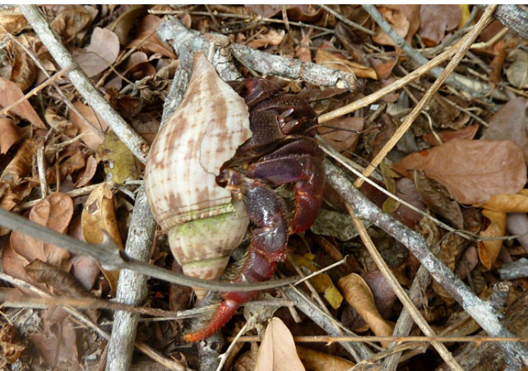
Eremitkräfta i Long Key State Park.

hade setts på Keys, men hade inte lagt på minnet exakt var eftersom de tydligen skulle vara extremt skulkgiga och vi antagligen inte hade nån som helst chans att se dem. Nåväl, nu var vi ju ändå längs stigen där dessa rariteter hade setts, så det är klart vi kikade lite efter dem. Trots ivrigt spanande såg vi inte särskilt mycket alls annat än lite andra skådare, bland annat några som var där för sjätte gången och ännu inte fått se nån vaktelduva.