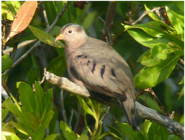
Nordlig markduva, Bowman's Beach 2/1.

3 ex Merritt Island 30/12, >5 ex Tamiami Trail 3/1, 1 ex Castellow Hammock Park 6/1. Dessutom ett inte obetydligt antal här och där på ledningar längs vägarna.