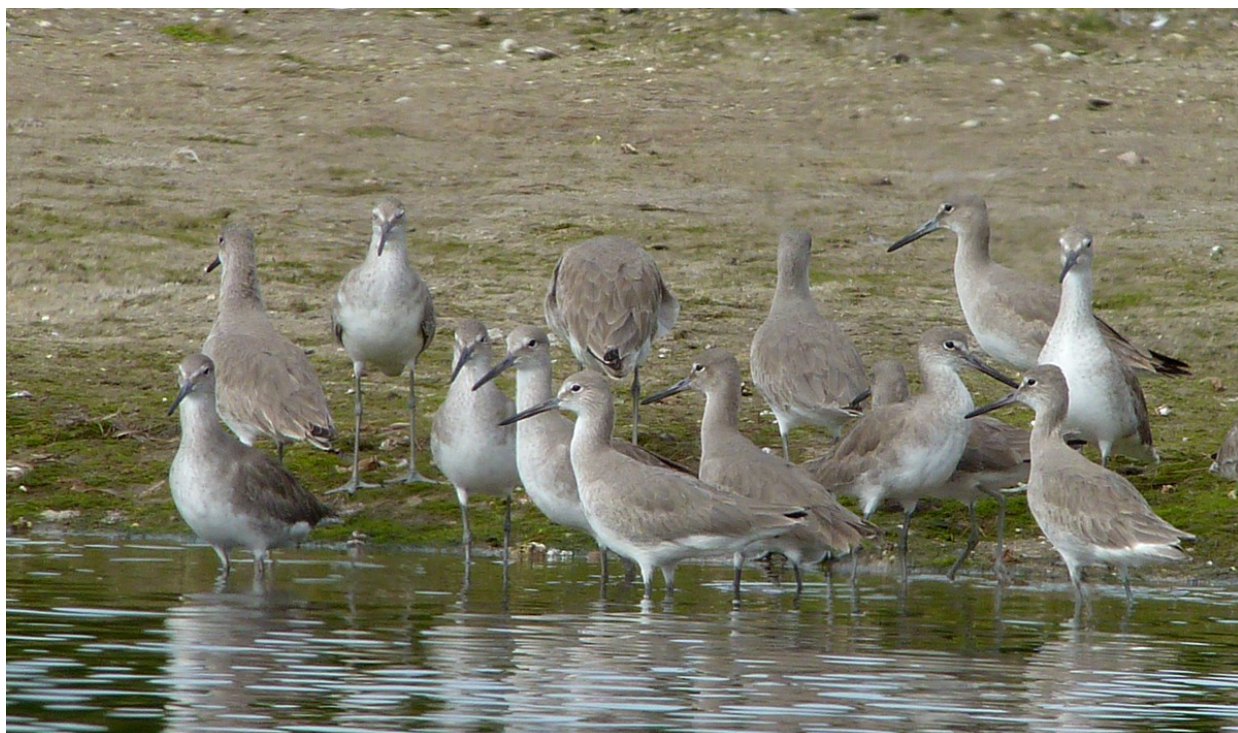
Willet, "Ding" Darling NWR 1/1.