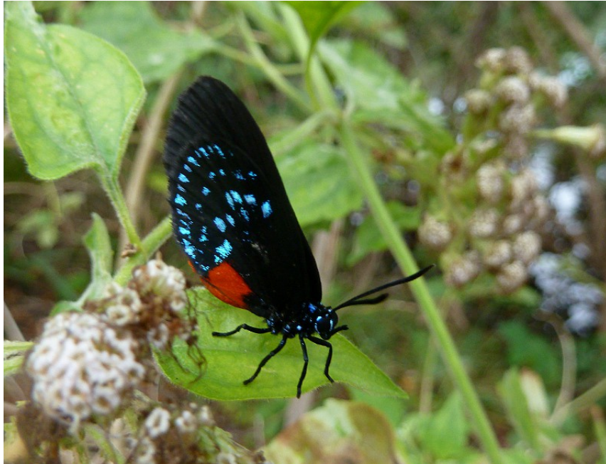
Atala, West Lake & Anne Kolb Nature Center 9/1