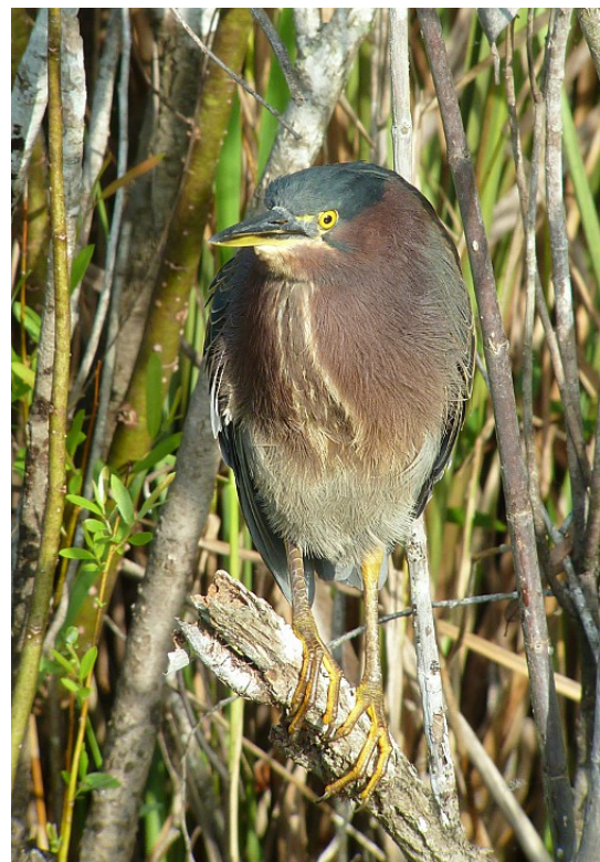
Grönryggig häger, Everglades 7/1.