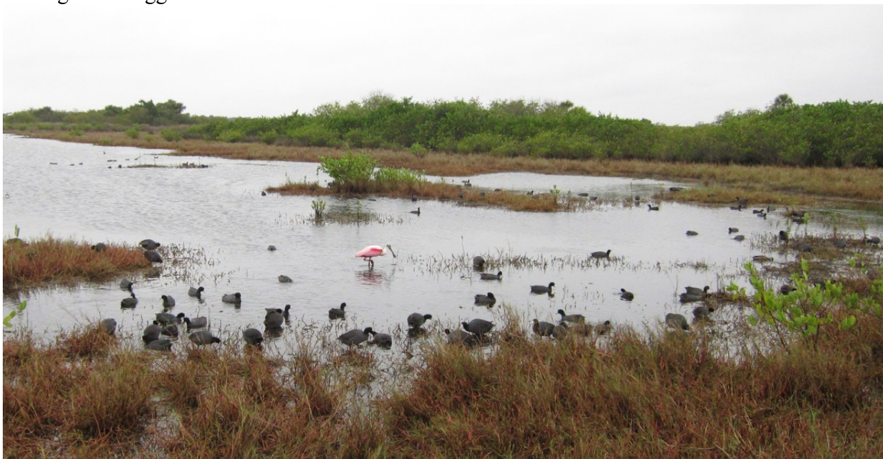
Amerikanska sothönor och en rosenskedstork på Blackpoint Drive.

Nå, hursomhelst kunde vi inte motstå att stanna till en gång till bland våra vänner saxnäbbarna, och nu hade de dessutom blivit lite fler, minst 80 stycken stod på stranden. Det var dock ingen som låg utsträckt och vilade såsom de ibland kan göra, vilket fått mer än en skådare att undra om det är en död fågel som ligger där.