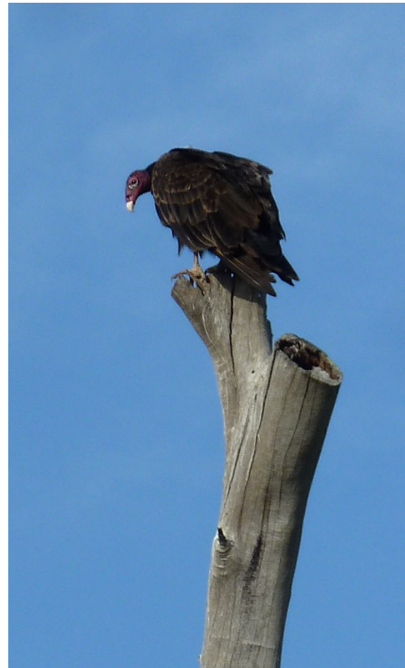
Kalkongam, Hugh Taylor Birch State Park 8/1

Alla dessa böcker köptes innan avresa på Naturbokhandeln.