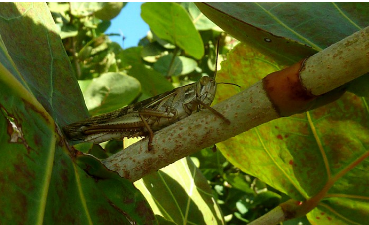
Schistocerca americana , en stor gräshoppa på ungefär 5 cm.