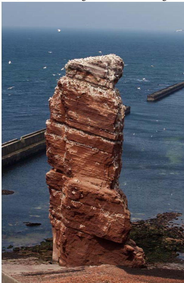
Klippan Lange Anna.

Helgoland består av två öar. Dels den befolkade huvudön, Hauptinsel, med en yta på 1,0 km 2 och öster om denna Düne som är 0,7 km 2 , som inte har någon bofast befolkning.