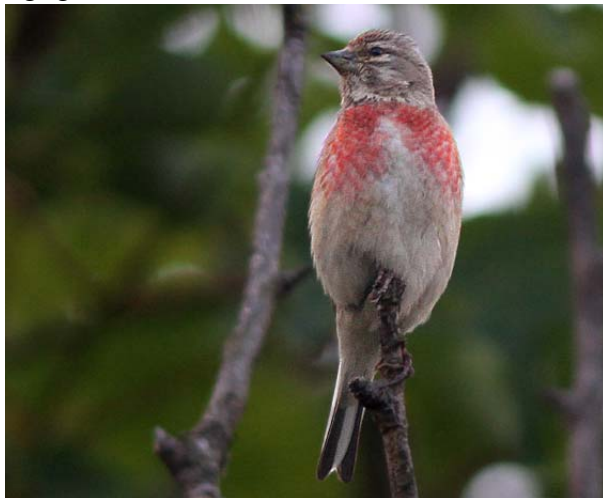
Slutligen visade rosenfinken upp sig vid Grosse Treppe.

En kompakt grå himmel och hård vind mötte oss på lördagsmorgonen. Vi började med en runda i Kurpark, men vinden gjorde att alla småfåglar satt långt in i buskarna. Vi hörde dock rosenfink och fick några korta skymtar av den. Lite uppgivet tog vi en paus med en riktigt god frukost.