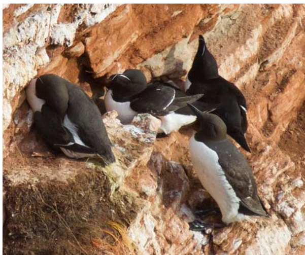
Med väldigt god uppmärksamhet lyckades Anders hitta två tordmular på klipporna bland mängder av sillgrisslor.

Efter frukosten gick vi till Mittelland, men hörde bara en gransångare. Sedan tog vi åter oss upp på Oberland och koncentrerade oss på fåglarna på klipporna, så där spenderade vi de sista timmarna. Bland annat fick vi bevittna ett spektakulärt bråk mellan två tretåiga måsar. Därefter fick vi börja tänka på hemresan. Vi avslutade med lunch innan vi tog oss till hamnen. På båten passade vi på att vila upp oss inför bilfärden hem.