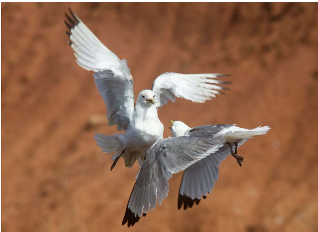
Två tretåiga måsar hamnade i ett våldsamt bråk i flera minuter.