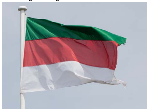
Helgolands flagga.

Helgoland har en egen flagga. Den vita färgen symboliserar stränderna, den röda klipporna och den gröna ängsmarkerna.