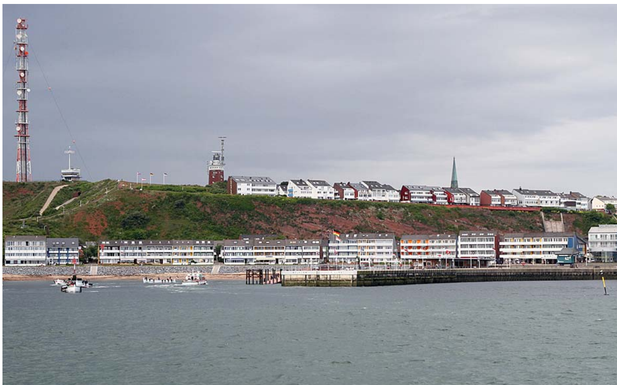
På väg in mot hamnen på Helgoland. De mindre båtarna i hamnen är på väg ut för att hämta upp passagerarna för ta dem den sista biten in till hamnen.