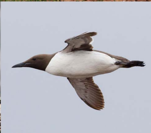
Tretåig mås, stormfågel, havssula och sillgrissla är karaktärarterna på Helgoland.