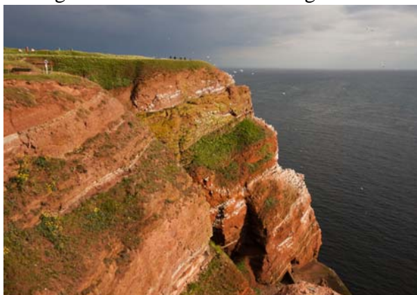
De röda klipporna hyser mängder av havsfåglar.

Under vissa delar av året passerar många sträckande fåglar ön och de rastar gärna där. Då kan en hel del rariteter hittas på ön och det har registrerats över 400 arter här genom åren.