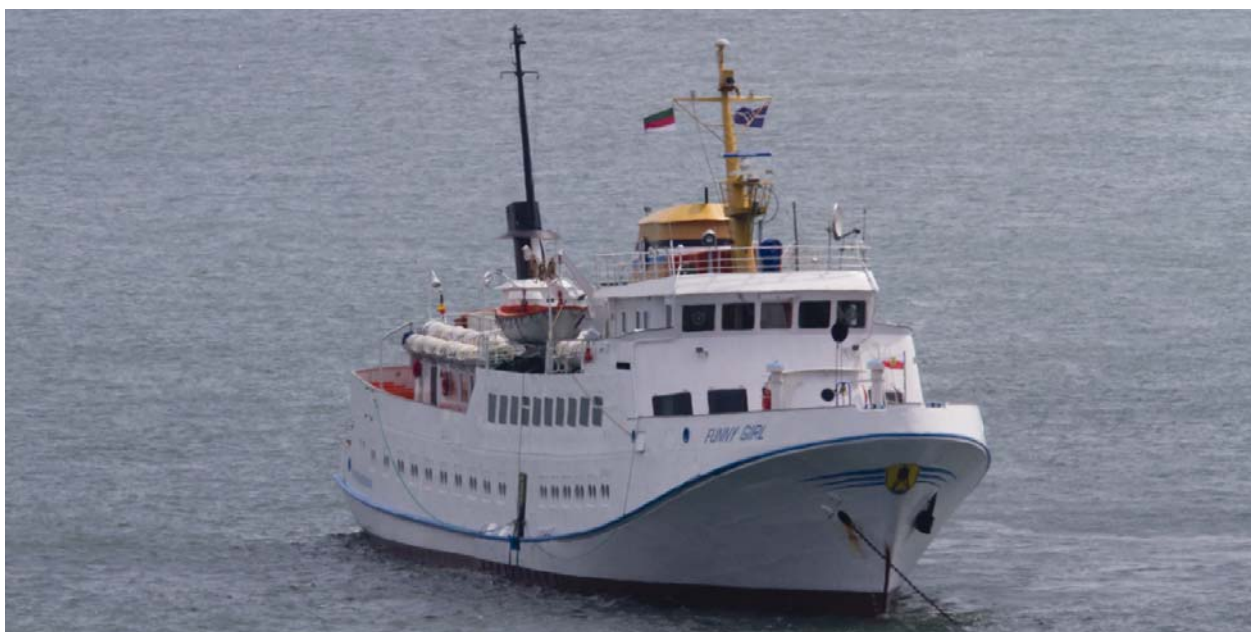
Båten Funny Girl som tog oss ut till Helgoland från Büsum.

Vi bokade boende genom turistsidan www.helgoland.de , där vi hittade ett billigt boende med ett lägenhetsrum med toalett och dusch i korridoren. Eftersom ön drar till sig mycket turister för bad och taxfree-shopping finns det många olika alternativ att välja på, allt från billigare enklare boende till högklassiga hotell.