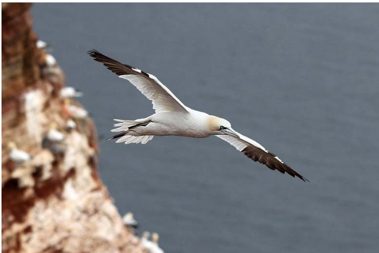
Mängder med havssulor fanns på och runt klipporna, speciellt vid Lummenfelsen.

En timme senare var det uppehåll igen och det blev en fantastiskt fin kväll. Vi tog oss upp på Oberland igen och denna gång kom vi fram till den mest kända utsiktspunkten, Lummenfelsen. Här stannade vi resten av kvällen och utnyttjade möjligheterna till fina flygbilder och närbilder på i första hand havssulorna. Bland alla sillgrisslorna lyckades Anders även få syn på ett par tordmular.