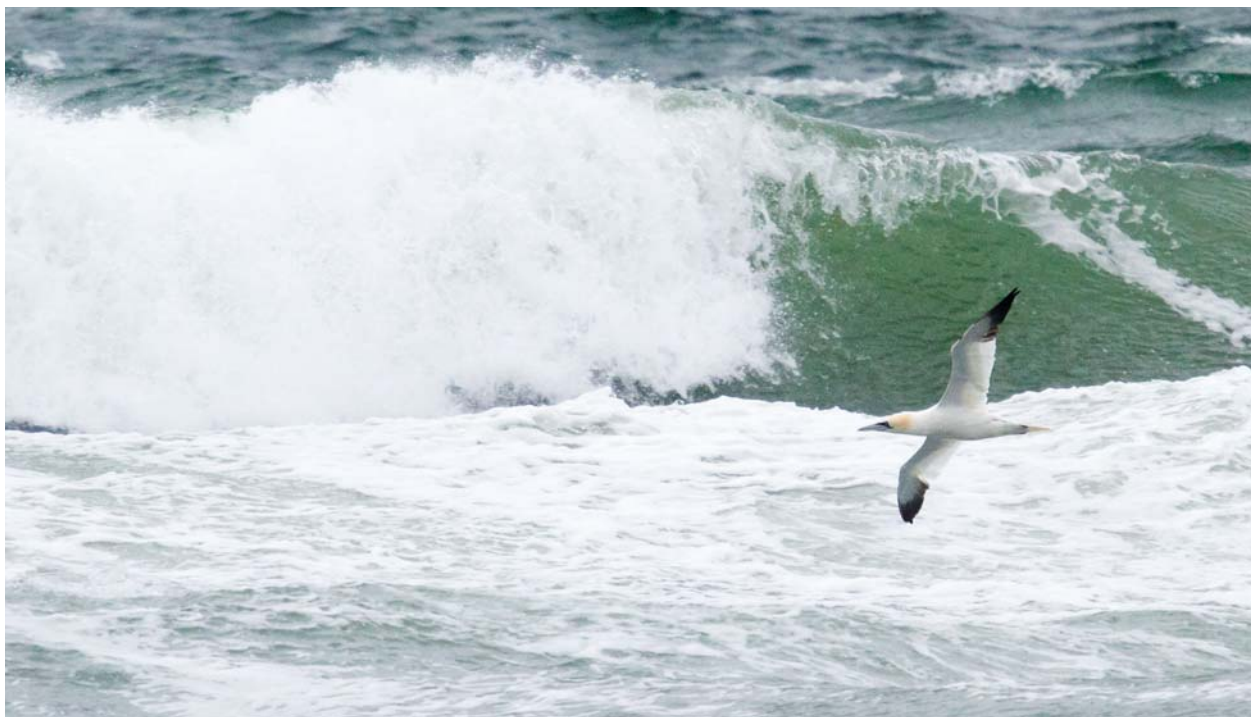
I den kraftiga stormen flög havssulorna förbi över det höga vågorna i hög hastighet.

Eftermiddagen började vi med att ta oss upp för Grosse Treppe, där vi kunde höra rosenfinken igen. Efter en stunds sökande fick vi syn på den. Samtidigt började en lundsångare höras och vi hade den i närheten av oss under en lång stund, men fick till slut ge upp. Efter en runda i Kurpark avslutade vi dagen uppe på Oberland runt Lummenfelsen. Där vi åter såg de dominerande arterna havssula, sillgrissla, tretåig mås och stormfågel.