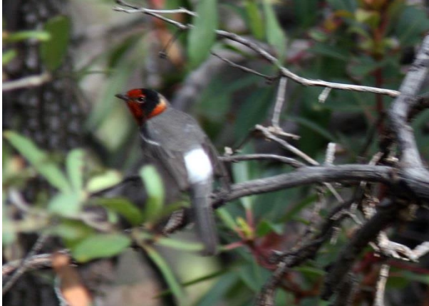
Redfaced Warbler, skogssångare som trivs på hög höjd, Madera Canyon