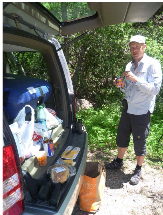
Snabb lunch, Patagonia reststop

Åter till det fina hotellet i Rio Rico och nu finns också tid för ett bad i poolen! Vi drar sen vidare mot Patagonia Reststop, via Nogales och gränsen mot Mexiko, och målarten Thickbilled Kingbird .