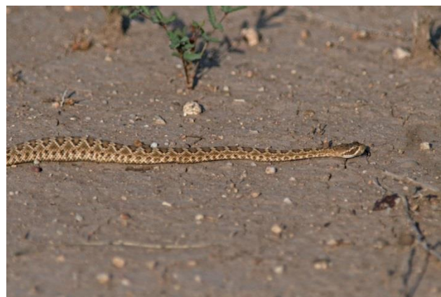
Diamondbacked rattlesnake, San Pedro House

bit norr utmed San Pedro River. Här ses ibland Green kingfisher i en av ponderna! Vi hittar ganska snart en Inca dove i ett träd (resans enda) och en ytterligare Say’s Phoebe . När vi går utmed stigen gör Janne mig uppmärksam på en mindre orm, som inte syns så väl mot gruset. Det visar sig vara en mindre variant av Diamondbacked rattlesnake ! (den vi såg igår var betydligt kraftigare)