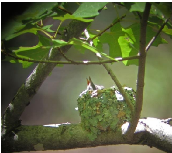
Violet-crowned hummingbird på bo, Ramsey canyon

Vi återvänder och försöker leta upp en häckning av Violet-crowned hummingbird på bo. Jodå, väl dolt under en trädgren finns ett vackert utsnidat bo!