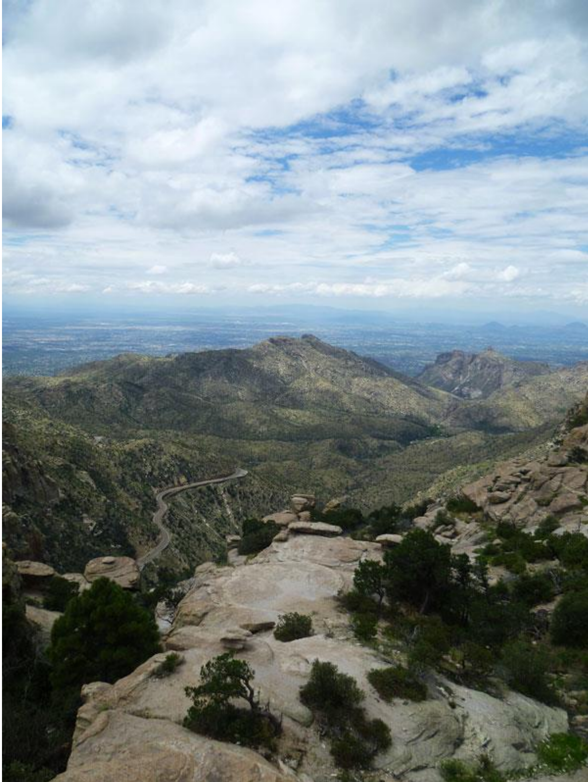
Mtn Lemon, vy mot Tucson

annan oturlig händelse vara att vägen till California Gulch, enda lokalen för Five-Striped Sparrow, var bortspolad. Svårt att förutspå och svårt att planera om, men några amerikaner påstod att skådningen där var en av resans höjdpunkter. Några svåra arter missade vi pga tidsbrist och ouppmärksamhet, vi hann helt enkelt inte lägga tillräcklig tid på alla arter. Madera Canyon och Santa Rita Mountains är ett mycket bra område som vi kanske borde ha lagt en dag till på.