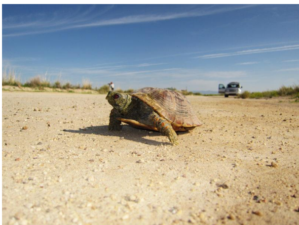
Ökensköldpadda, Cochine Lake, Willcox

Första anhalten idag är de stora vattendammarna vid Willcox. Här ska det finnas gott om vadare, och vi blir inte besvikna! De flesta av SE Arizonas änder, vadare och vitfågel kan ses rasta här. För att hitta Cochine Lake, som är den största och intressantaste dammen, följer man vägen mot Twin Golf Lake söder om Willcox. Utmed Rex Allen Jr. Drive hittar vi först 3 st Killdeer .