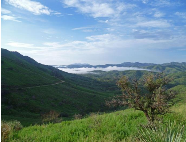
Ruby Rd, California Gulch

Tydiligen ska vägarna till California Gulch vara lynniga och ofta inte farbara utan fyrhjulsdraft. Det är en vacker morgon och vi gör några stopp utmed Ruby Rd. Vi är nära gränsen mot Mexiko så patrullerande Border Patrol ses regelbundet i området. En, eller möjligen två, Cassins Sparrow hörs sjunga från fälten. Lite längre fram springer plötsligt en Roadrunner över vägen, och försvinner spårlöst. Nöjda åker vi vidare! Landskapet är böljande vackert och i full blomning. En bit framöver möter vi en haltande och skadad ensam man på vägen, förmodligen en mexikansk flykting, som strax efteråt plockades upp av US Border Patrol. Vi kör vidare, men kommer inte allt för långt innan vägen helt plötsligt är bokstavligen bortspolad!!