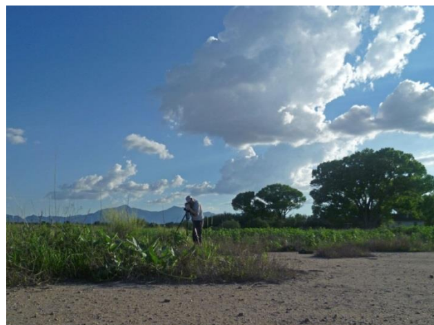
”Ormfotografen”, San Pedro House