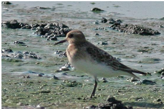
Killdeer, Semipalmated sandpiper