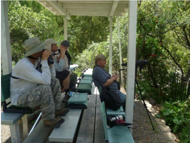
“Soft skådning” vid feeder, Miller Canyon