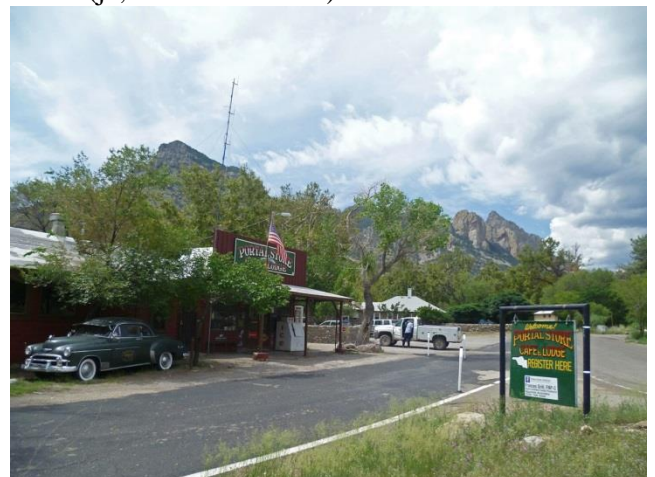
Cafét i Portal

Idag är dagen då vi verkligen ska se Elegant trogon . Vi har fått bra tips av vår värd var i South Fork Creek åtminstone en individ är sedd ganska regelbundet. Vi ger oss iväg i gryningen efter att snabbt ha kollat av trädgården vid ”hotellet” först. Vi letar länge och väl men trogonen gäcker oss idag också. Några Sulphur bellied flycatcher blir lite plåster på såren. Vi stöter på ett äldre par från Idaho? Som inte heller har sett någon Trogon . Från South Fork picnic area utgår en trail mot Sential Peak. Vi gör sällskap med paret från USA. Nu HÖR vi i alla fall en Trogon (eller var det innan?). Vi får hjälp att bestämma några arter som vi lokliserat via lätet, bl a Plumbeous vireo . Lite längre upp på den slingrande stigen stöter vi på en mindre ”birdwave” med ett 10-tal Blackthroated Grey warbler , 1 Redfaced warbler och inte minst en Mexican Chickadee . Det var oväntat! Nöjda vänder vi åter och tar ett stopp på stam Cafét i Portal (ja, det har blivit det).