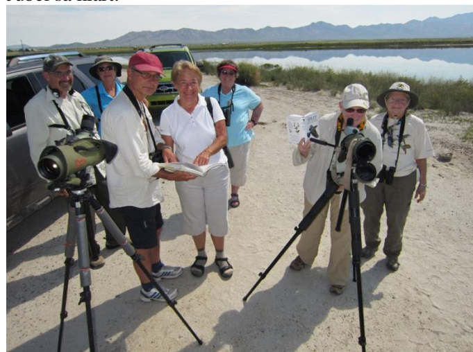
Cochine Lake, Willcox – Just upptäckt Stilt Sandpiper och glada miner

Väl framme vid dammen ”kokar” det av fågel. Totalt uppskattar vi antal Wilson's Plover till 500 ex!! Och den hade ingen av oss på liferslistan. En flock med ett 15-tal White-faced Ibis rastar. De orsakar lite bestämningsproblem eftersom en amerikansk skådare (fr. Minnesota) bestämt hävdar att det är Glossy Ibis . Vi blir osäkra, men Janne står på sig, dessutom är Glossy Ibis en extrem raritet i detta område! Vi botaniserar vidare bland vadare och änder och hittar bl a tvåsiffriga antal av både Black-necked Stilt och American Avocet . Tillsammans med ett sällskap fågelskådande damer gör vi en oväntad och trevlig upptäckt då vi hittar en Stilt Sandpiper ! Jubel så klart.