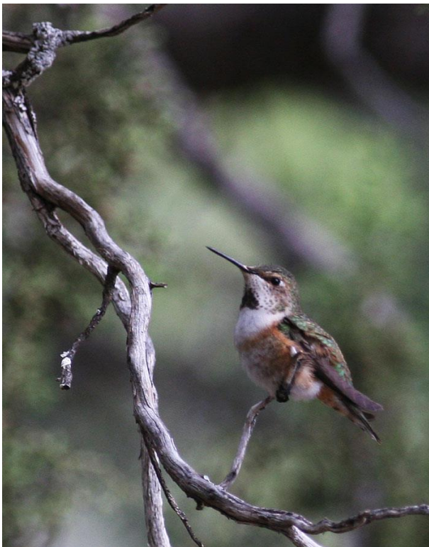
Rufous eller Allens?? Bestämd till Rufous (men inte mycket skiljer)

Vi tar sen Paradise rd mot Walkers place. Vi spanar och lyssnar intensivt utmed vägen och får till slut syn på en Black-chinned sparrow bland alla Black-crowned sparrow . Vid Walker House finns matning och ganska mycket fågel i rörelse, bl a hummingbirds , och bra fotolägen. Tre duvor flyger över, som visar sig vara Band-tailed Pigeon , kul. Minst två Juniper Titmouse födosöker och visar upp sig fint. Kul!!