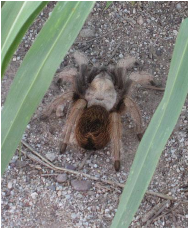
Tarantula, San Pedro House (San Pedro River)

Tarantula - Tarantula Hawk (Spider wasp) -