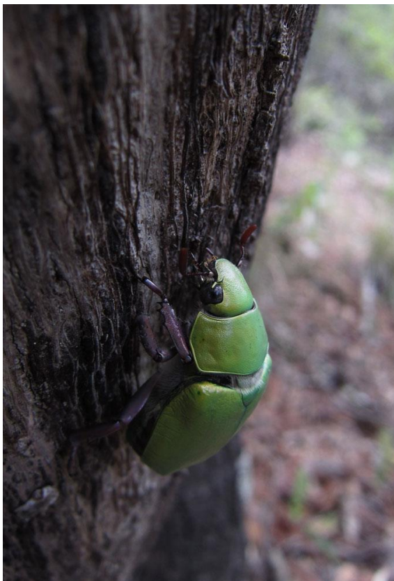
“Grön skalbagge”, Ramsey Canyon

Vi återvänder och försöker leta upp en häckning av Violet-crowned hummingbird på bo. Jodå, väl dolt under en trädgren finns ett vackert utsnidat bo!