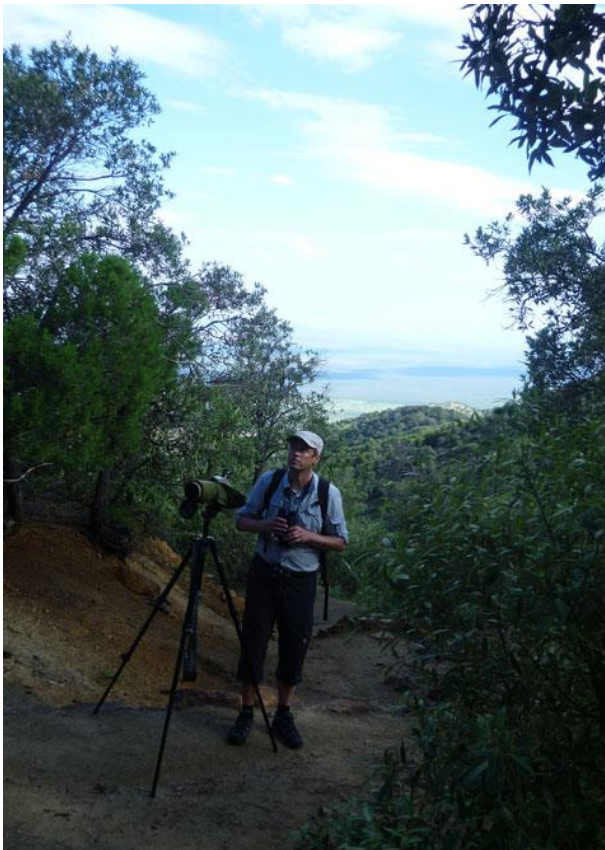
Madera Canyon, Old Baldy trail