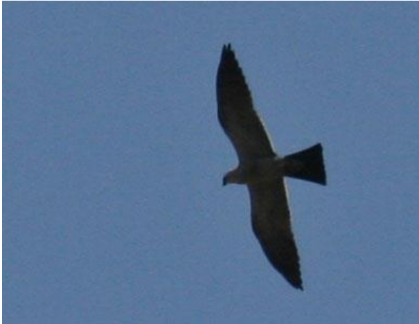
Mississippi kite, adult hanne

Mississippi Kite . Inte svårt att hitta dit, men var kan gladorna vara? Vi gör påmåfstopp vid bron och på de ställen som guideboken tipsar. Efter någon halvtimme börjar vi misströsta lite och tar stora vägen tillbaka. Och då ser jag i ögonvrån två misstänkta i skyn! Tvärnit och ur bilen. Javisst, två Mississippi kite segelflyger på ganska hög höjd.