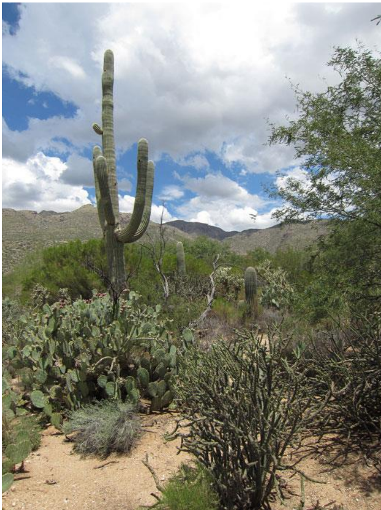
Saguarakaktus, unik för området SV USA och NV Mexiko