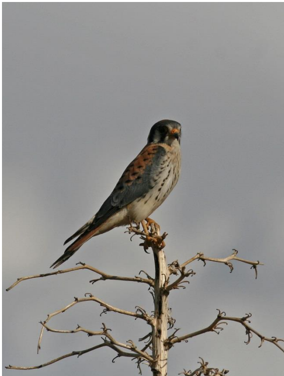
American Kestrel, Cooper's Hawk (t.h)