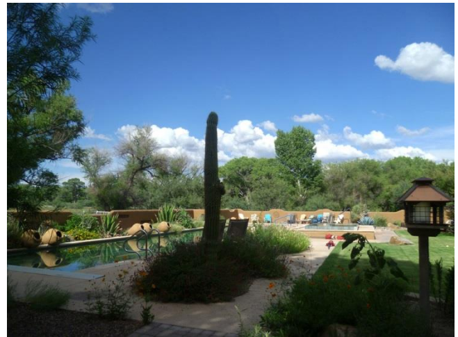
Casa de San Pedro

på olika feeders. Frukosten som vanligt en höjdpunkt!