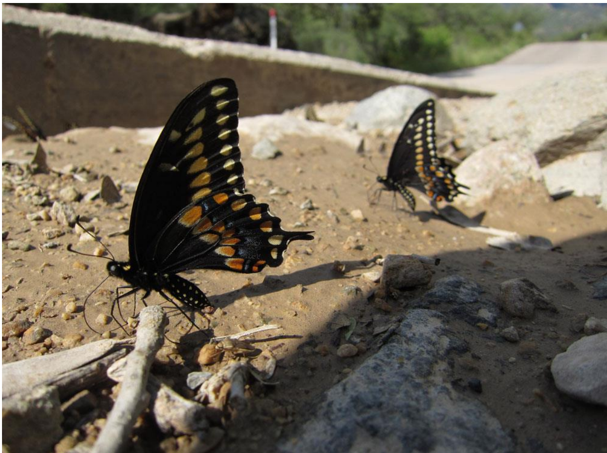
Black Swallowtail, Montosa canyon