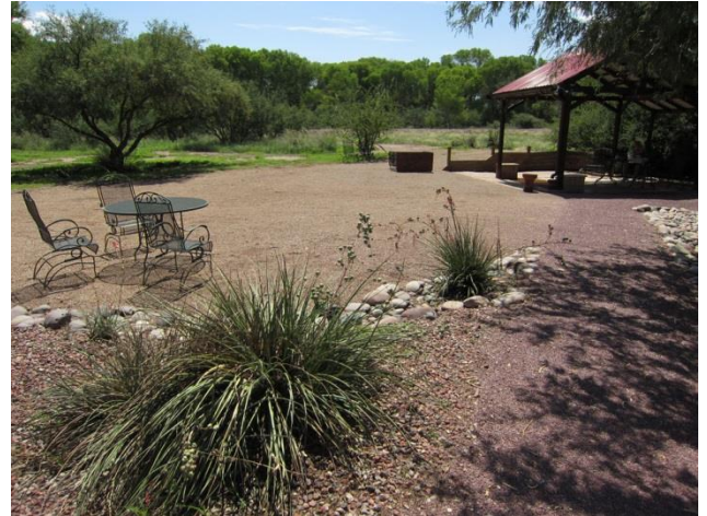
Casa de San Pedro, ängen bakom verandan häckar Tornuggla!! .

Har blivit lovade frukost vid 10-tiden, så vi hinner checka av den fina trädgården innan vi beger oss mot Hereford bridge i närheten. Ser lovande ut, men något nytt noteras inte. Vi har även tänkt prova Ash Canyon före frukost. Vi gör stopp på vägen och ser bl a en Bullock's Oriole .