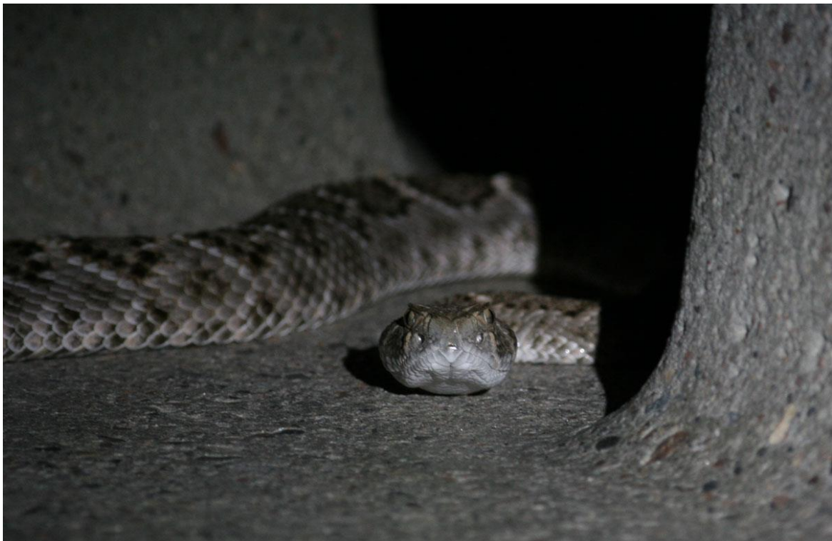
Diamondback Rattlesnake, "En stöddig bit", Hereford bridge