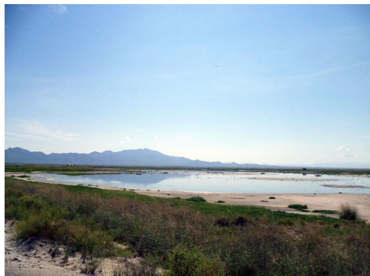
Cochine Lake, Willcox Playa

Väl framme vid dammen ”kokar” det av fågel. Totalt uppskattar vi antal Wilson's Plover till 500 ex!! Och den hade ingen av oss på liferslistan. En flock med ett 15-tal White-faced Ibis rastar. De orsakar lite bestämningsproblem eftersom en amerikansk skådare (fr. Minnesota) bestämt hävdar att det är Glossy Ibis . Vi blir osäkra, men Janne står på sig, dessutom är Glossy Ibis en extrem raritet i detta område! Vi botaniserar vidare bland vadare och änder och hittar bl a tvåsiffriga antal av både Black-necked Stilt och American Avocet . Tillsammans med ett sällskap fågelskådande damer gör vi en oväntad och trevlig upptäckt då vi hittar en Stilt Sandpiper ! Jubel så klart.