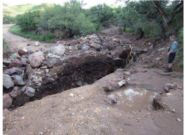
California Gulch, Bortspolad väg!!