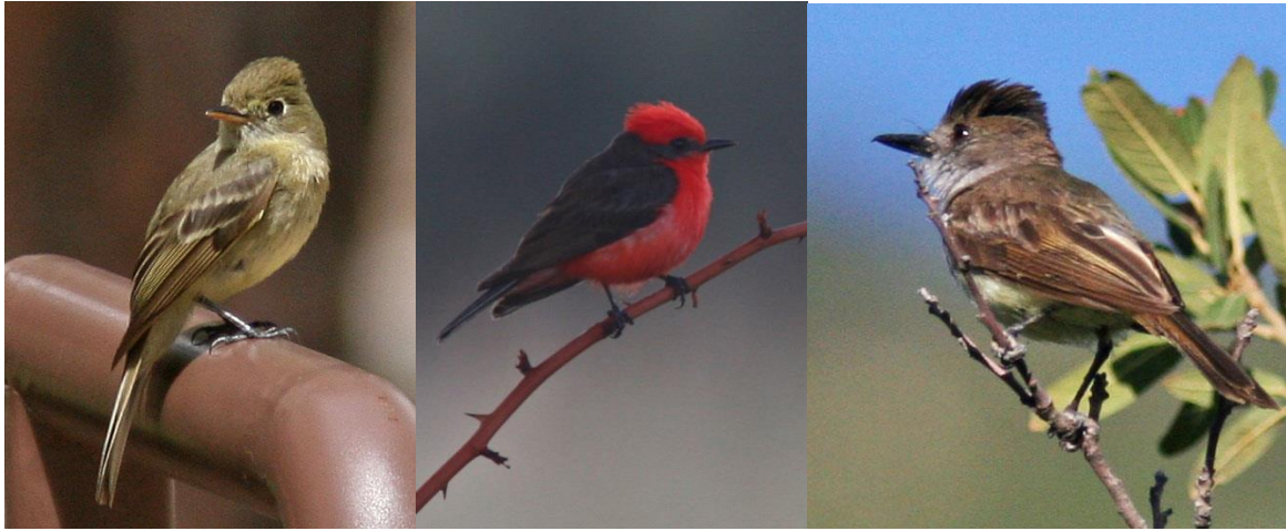
Cordillera Flycatcher, Vermilion Flycatcher och Dusky-Capped Flycatcher