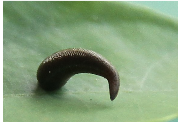
gott om blodiglar (små, ofarliga) Cat Tien