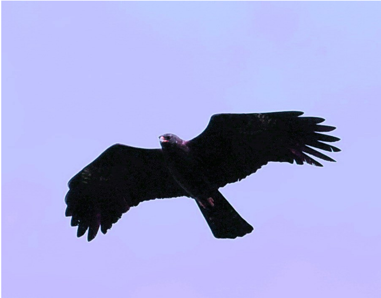
Black Eagle, Di Linh

Arter i RÖTT är endemer. Arter i BLÅTT är endemer för Indochina. DL= Di Linh. D= Dalat. G= Gian Ly. C= Cat Tien. S= Saigon R=Road...utefter vägen.