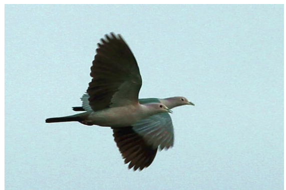
Green Imperial Pigeon.