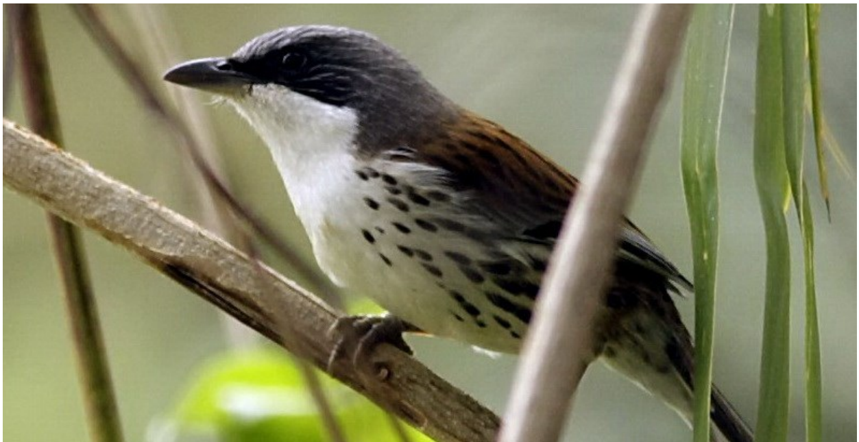
Ta Nueng är enda stället där man kan se den endemiska och utrotningshotade Crochian.