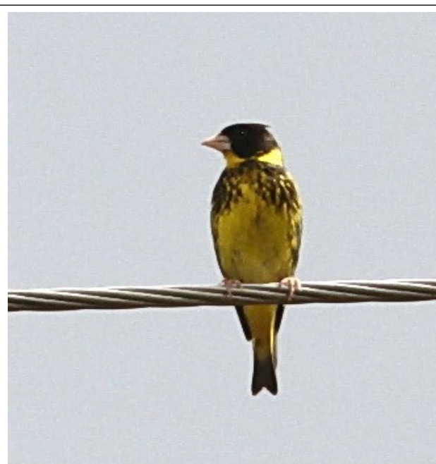
Vietnamese Greenfinch har blivit allt sällsyntare runt själva Dalat bl.a. p.g.a. fågelfångst. På landsbygden såg vi fortfarande mindre flockar.

Cat Tien. Vi tillbringade 4 nätter i denna Nationalpark, ca. 15 mil norr om Saigon. I parken kan man bl.a. se Germain's Peacock-Pheasant, Siamese Fireback Pheasant, Green Peafowl, Bar-bellied Pitta, Blue-rumped Pitta & Orange-necked Partridge (vi dippade de två sistnämnda - för tidigt på året! -)