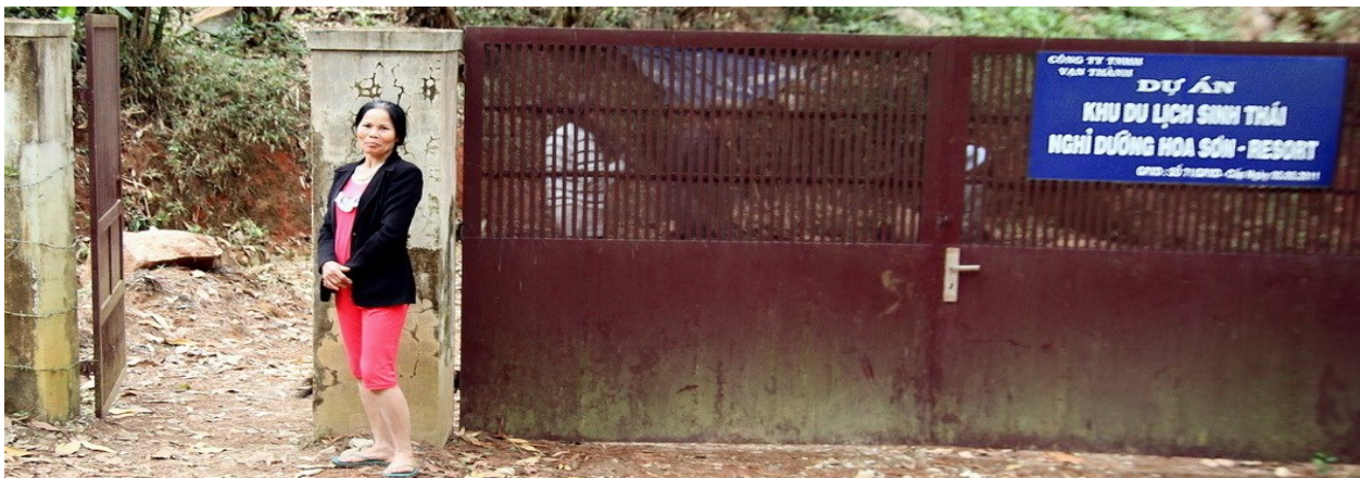
Entrén till Ta Nueng. Familjen som vaktar dalen ser till att ingen fågel-fångst sker här!

Dalat-området. Vi tillbringade ca. 4 dagar i denna gamla f.d. koloniala franska höglandsresort. Numer har denna stad blivit en tillflykt för välbärgade Saigonbor som flyr sommarhetta eller avgasmolnen från en av världens mest förorenade städer. Resorts och lyxvillor skjuter upp som svampar ur jorden. Det finns dock flera mycket bra områden runt staden; Di Linh ca. 5 mil söder ut, Giang Ly ca. 4 mil öster ut. Ho Tuyen Lam dammen ca. 5 km söder om stadskärnan (speciellt de nord-västra delarna där det fortfarande finns en del skog kvar)