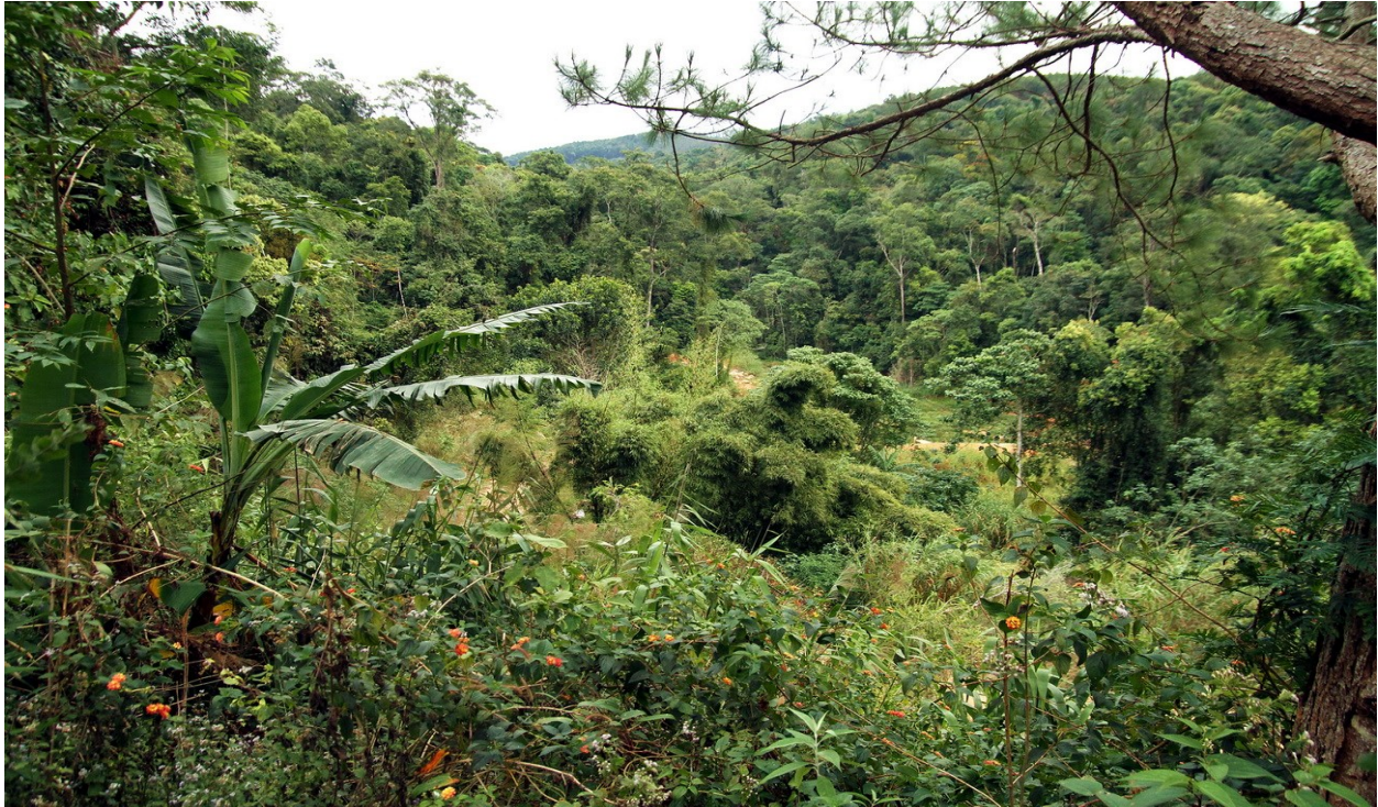
Vy över dalgången. Förutom Crochias ses många andra bra fåglar i denna dalgång.

Naturligtvis kan man inte besöka Dalat utan att ha tagit sig till den sägen-omspunna Ta Nueng-dalen precis utanför staden. Ett tag såg det ut som om denna privatägda paradisdalgång - den enda tillgängliga lokalen för Grey-crowned Crochias - skulle ge plats åt ett stort resortkomplex. Detta är nu temporärt satt på is (bristande finanser) och fåglarna kan känna sig trygga ännu ett tag. (Vi såg 5 respektive 2 fåglar där under 2 besök till dalen under detta besök.