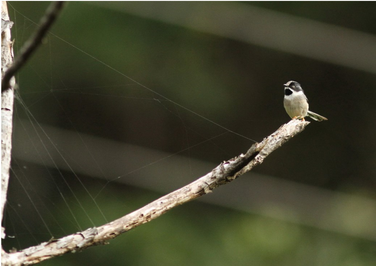
Grey-throated Tit, en split från Black-throated Tit. Di Linh Pass.

Dalat-området. Vi tillbringade ca. 4 dagar i denna gamla f.d. koloniala franska höglandsresort. Numer har denna stad blivit en tillflykt för välbärgade Saigonbor som flyr sommarhetta eller avgasmolnen från en av världens mest förorenade städer. Resorts och lyxvillor skjuter upp som svampar ur jorden. Det finns dock flera mycket bra områden runt staden; Di Linh ca. 5 mil söder ut, Giang Ly ca. 4 mil öster ut. Ho Tuyen Lam dammen ca. 5 km söder om stadskärnan (speciellt de nord-västra delarna där det fortfarande finns en del skog kvar)