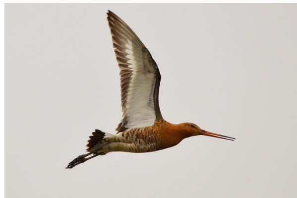
Isländsk rödspov är vanlig överallt. Fotolägena är många och bra.

Efter Borgarnes körde vi västerut ut på halvön Snæfellsnes. Vid sydkusten finns det lite våtmarker där man kunde se den vackra isländska rödspoven och mycket annat. Utsikten blev hela tiden finare ju närmare Snæfellsjökull vi kom. Hotel Hellnar låg nästan vid foten av bergets sydsida och nära havet, så allt var osannolikt vackert. Vi satt utanför i det vackra vädret och firade midsommarafton och drack Jim Beam Honey till artgenomgången. Middagen med den isländska ölen var god och första dagen hade uppfyllt förväntningarna med råge.