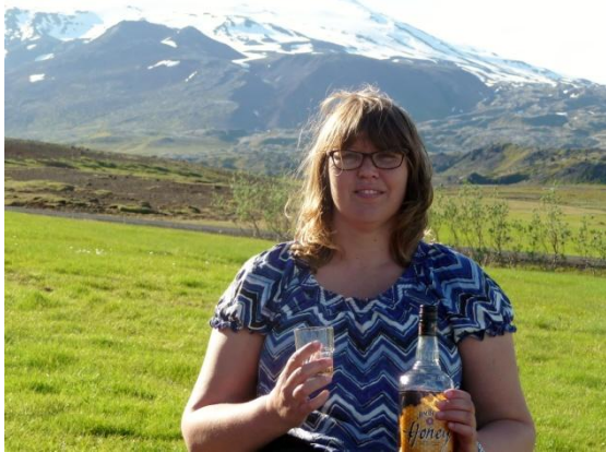
Mari firar midsommar vid foten av Snæfellsnes. Vädret var likvärdigt med Sverige.

Vi landade i Keflavik kl 9 på morgonen i soligt, stilla väder och +12 grader. Vi noterade några fåglar på flygplatsen och längs vägen in mot Reykjavik, men då vi hade en lång resa till första hotellet gjorde vi inga stopp. För att få en liten skymt av huvudstaden försökte vi ta oss ner i stadens norra delar, men vi kom in lite för långt norr ut, så det blev bara en liten bakåtblick på själva staden. Vi stannade vid en affär, BONUS , och provianterade och tog sedan lunchstoppet söder om Hvalfjörður, där vi såg våra första stormfåglar, en mycket vanlig fågel på alla bergskanter.