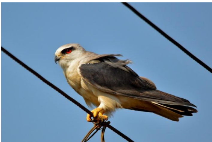
Black-shouldered Kite på Divar Island.