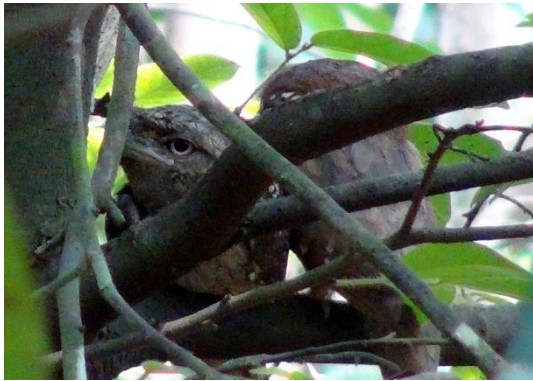
Sri Lanka Frogmouth, svår att hitta själv.

Eftermiddagen ägnades åt enskild och gemensam skådning i närområdet. Parakiter, Barbets, Woodpeckers och mycket annat sågs här. Två Sri Lanka Frogmouth på dagkvist visades upp fint av personalen som vet precis var de brukar sitta.