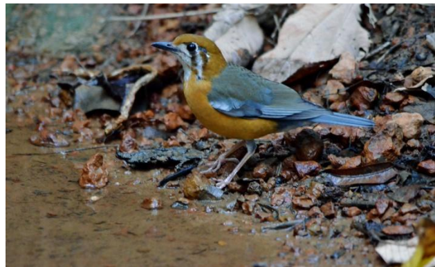
Tickell's Blue Flycatcher och Orange-headed Thrush dricker vatten i Pilerne Forest.

Idag lär det ha varit plus 38 i skuggan. Värmen är påfrestande och lokalt talar man om "Global Warming", eftersom dessa höga temperaturer inte brukar komma förrän april-maj. Vi svenskar har svårt att hålla tempot.