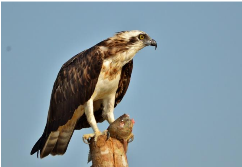
Osprey på Zuari River.