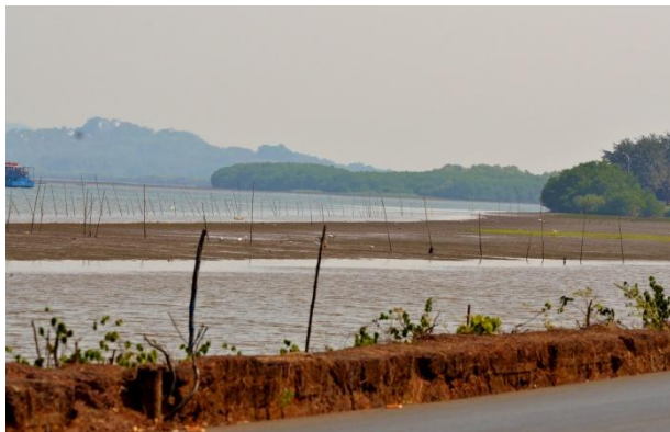
Sandbankar i floden på väg mot Old Goa, med bl a Terek Sandpiper.

Eftermiddagen ägnades åt sol, bad och lunch på den fina Baga Beach. 30 grader i vattnet och drygt 35 i luften. Sten drabbades av en mindre värmekollaps och vi tog oss hem med hjälp av en vänlig taxichaufför. Beslutades att undvika stranden fortsättningsvis och istället bada i poolen i hotellets skugga.