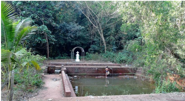
Saligao Zor, resans sista lokal med en källa. I ravinen nere till vänster hittades resans åttonde kungsfiskarart, Oriental Dwarf-Kingfisher