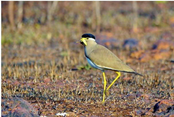
Dona Paula, vegetationsfri torrmarkslokal, med några snygga Yellow-wattled Lapwing.

Resten av dagen ägnades åt poolen och hotellet för att klara värmeböljan. Vår artlista ligger nu runt 240 arter och vi är mer än nöjda.