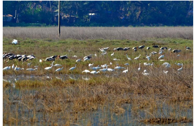
Santa Cruz, fin våtmarkslokal med Painted Stork och hägrar.