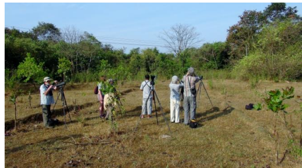
Morgonskådning intill Campen

Eftermiddagen ägnades åt enskild och gemensam skådning i närområdet. Parakiter, Barbets, Woodpeckers och mycket annat sågs här. Två Sri Lanka Frogmouth på dagkvist visades upp fint av personalen som vet precis var de brukar sitta.