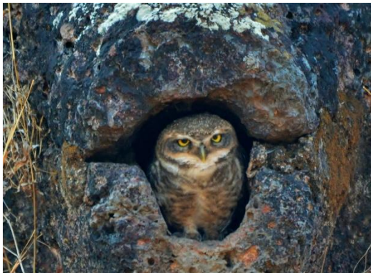
Spotted Owlet i muren på Fort Aguada.

Vi passerade stora bron över Mandovi River och åkte väg 4A mot Old Goa. Vägen är hårt trafikerad men på sandbankarna vid rätt ebb/flod ses massor med vadare. Vi såg bl a 4 Terek Sandpiper . Söder om vägen ligger ett område med sandiga fält och några saliner. Här kunde vi köra och skåda i lugn och ro. Malabar Crested Lark , Tawny Pipit och Richards Pipit sågs på nära håll och en hane Pallid Harrier flög över och skrämde upp alla vadare.