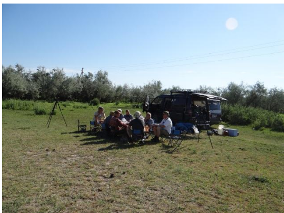
Lunch i fält vid Nurly.

Det blev alltså en mycket lång färdetapp denna dag, ända till Bishkek, huvudstaden i Kyrgyzstan, där vi dock inkvarterades på ett alldeles utmärkt hotell, resans i särklass bästa.