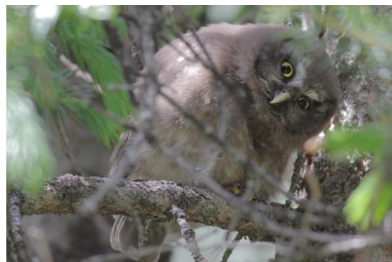
Ung pärluggla.

Efter lunch begav sig huvuddelen av gänget till de nedlagda fiskdammarna utanför Bishkek.