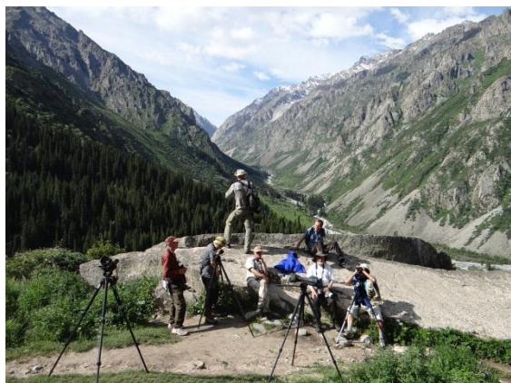
På väg mot violsångare och blek rosenfink.

Michael i alla fall en underbart vacker hanne, därtill på ganska nära håll. En stund senare syntes den ännu bättre.