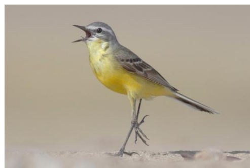
Yellow Wagtail ssp. beema .

163. Citrine Wagtail Citronärla Motacilla citreola citreola/calcarata