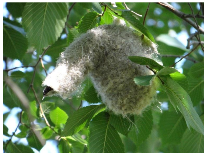
White-crowned Penduline Tit.

20 in the reeds outside Karazhar in Korgalzhyn NR June 3-6.