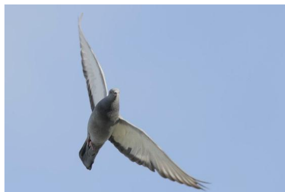
Yellow-eyed Stock Dove.

45 in Korgalzhyn NR June 3-5 and nine in southern Kazakhstan June 7 and 9.