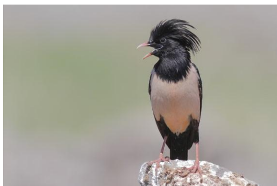
Rose-coloured Starling.

15 near Korgalzhyn NR June 3 and 6, locally very numerous - more than 10 000 seen - in southern Kazakhstan June 7-13, 100 around Bishkek June 19-20.