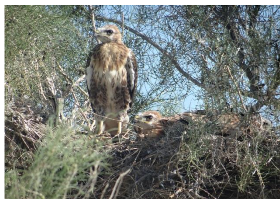
Juvenile Long-legged Buzzards on nest near Karaoi.

52. Marsh Harrier Brun kärrhök Circus aeruginosus aeruginosus