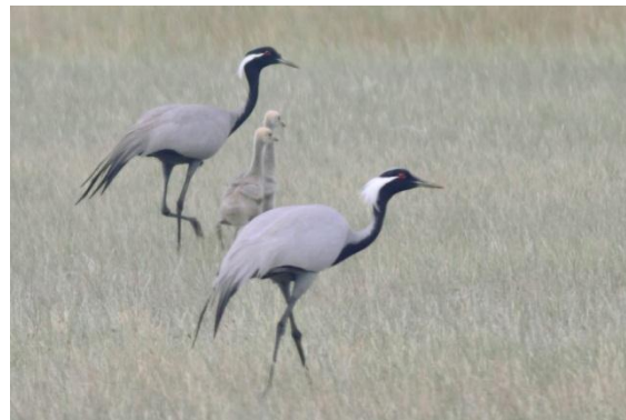
Jungfrutranor med ungar.

Transportsträckan till Astana gav inget nytt till listan, men däremot en mängd favoriter i repris - stäppörn , stäpphökar , aftonfalkar , rosenstarar m.m. Särskilt minnesvärt var ett par jungfrutranor med ungar som bjöd på fina obsar på fint fotoavstånd från bussen.