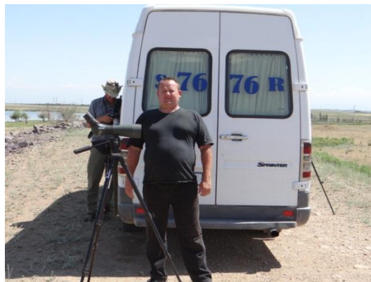
Vår muskulöse chaufför framför expeditionsbussen.

lagt in bilder och gjort layouten samt till alla trevliga reskamrater som i hög grad bidrog till resans goda utbyte!