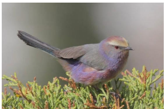
Violsångare.