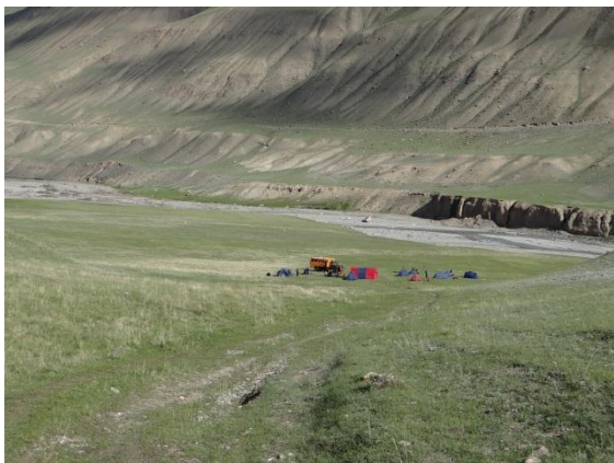
Lägret i May Saz.