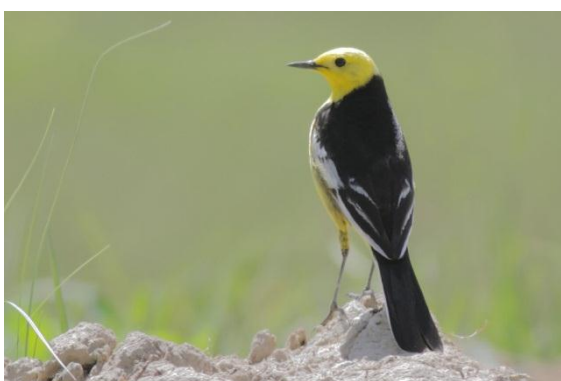
Citronärsla ssp. calcarata .