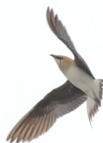
Black-winged Pratincole.

83. Little Ringed Plover Mindre strandpipare Charadrius dubius curonicus