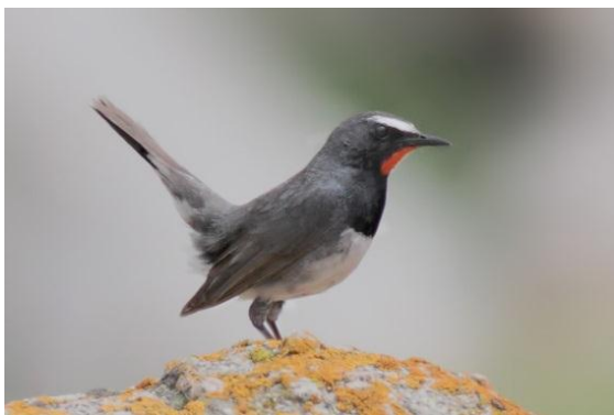
Svarthakad rubinnäktergal.

Vid det första stoppet med ibisnäbb fick vi också stifta bekantskap med en del fåglar i granskogens bryn - först och främst en makalöst vacker svarthakad rubinnäktergal men också svartstrupig järnsparv , altairödstart , blåhätta (bara hörd), bergstaigasångare och tujastenknäck . Dubbeltrastar var vanliga.