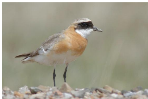
Lesser Sand Plover.

55 , most of them in a breeding colony, in Korgalzhyn NR June 4-5.