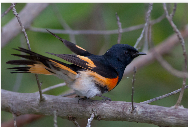
American redstart, Fort Lauderdale, 21/4 2012

Flyget går först på eftermiddagen, och med tanke på att det regnat av och till hela natten och morgonen borde det vara läge för rastande småfågel. I Pranty hittar vi en liten park alldeles vid havet i Fort Lauderdale som skulle kunna vara bra. Tyvärr visar det sig att parken med det behändiga namnet Hugh Taylor Birch State Recreation Area inte öppnar förrän en timme efter soluppgången, så vi får lite snopna köra omkring i stan, Floridas Venedig, en stund. Men, väl inne upplyser vakten om att det brukar vara bäst i norra delen under vårflyttningen. Och det är det – i buskarna på en parkeringsplats alldeles i änden på parken hittar vi sju olika arter skogssångare, varv två nya. De nya är American Redstart och Cape May Warbler , och de övriga är Black-and-White Warbler, Palm Warbler, Prairie Warbler, Northern Waterthrush och Common Yellowthroat. I elfte timmen fick vi till slut uppleva lite tryck vad gäller flyttande fåglar! Lite överraskande står dessutom plötsligt två Solitary Sandpiper i en pöl på gräsmattan bredvid parkeringen, och två förbiflygande Spotted Sandpiper i kanalen bredvid får markera en skön slutpunkt på resan.