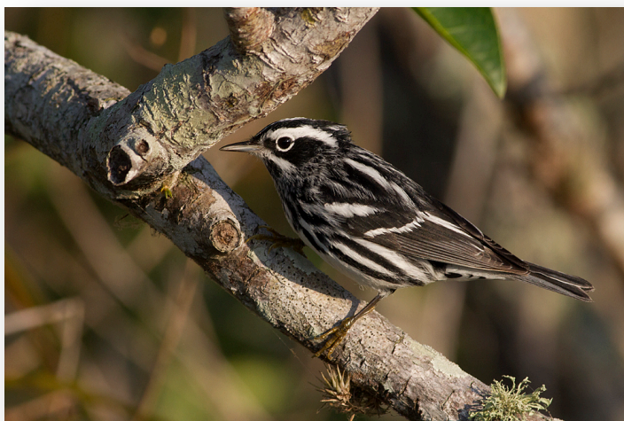
Black-and-white warbler, Anhinga trail 13 april 2012

Först Starbucks (en Americano fylld till \frac{3}{4} med vatten smakar faktiskt kaffe), sedan mot Everglades. Anhinga trail blir första stoppet. Purple Gallinule som vi trodde var svår, är i princip den första fågel vi ser (förutom Anhinga förstås), och tydligen är den lätt där, men ingen annanstans. Där är gott om de vanliga hägrarna, bland annat Green Heron , men roligare är att det rastar en del sångare längs boardwalken. Vi får in många Palm Warbler , flera Black-and-White Warbler och Common Yellowthroat och faktiskt även en Louisiana Waterthrush . Black Vulture sitter på staketet och är i princip tama, vilket även de allestädes närvarande American Alligator verkar vara, något som Kartläsaren dock inte är särskilt sugen att prova om det stämmer. Efter tips från lokal skådare beger vi oss till Research Road. Alldeles innan vi svänger in på vägen ser vi vår första Swallow-tailed Kite , i sanning långa stjärtspröt. Precis efter det att Research Road övergår till grusväg hittar vi en White-crowned Pigeon på närmre håll än vad som är brukligt, och även en Indigo Bunting ses hastigt.