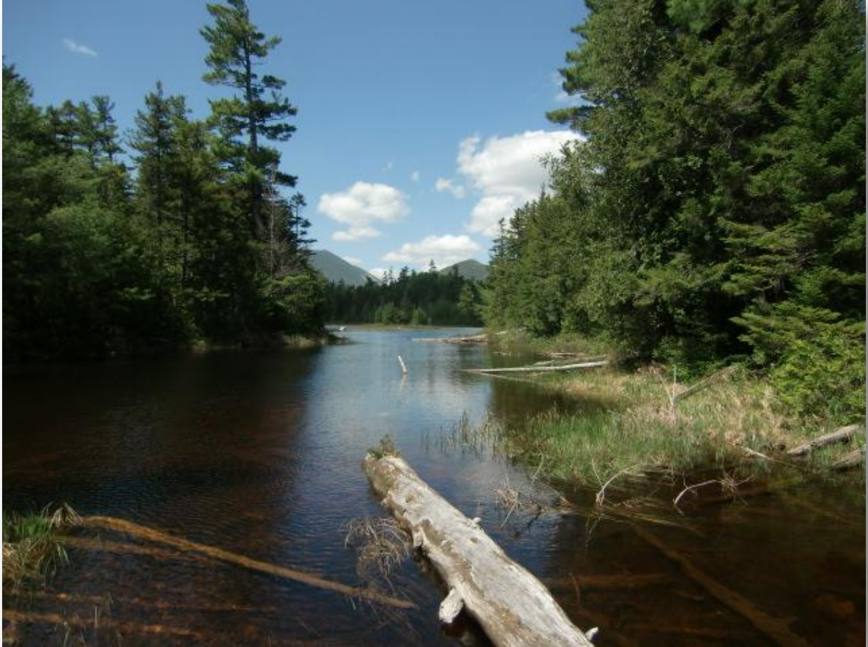
Baxter State Park