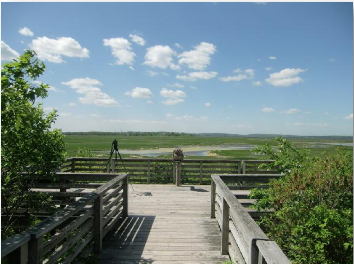
Parker River National Wildlife Refuge

Bra skådning på Plum Island, eller Parker River National Wildlife Refuge som det egentligen heter. Dessutom träffar jag två trevliga skådare och vi utbyter lite erfarenheter. Tillbringar hela dagen på Plum Island. Ön är långsträckt med stora sankängar, sanddynsfält, och kustskog. Fågellivet är mycket rikt och bjuder på en mängd arter framförallt pga de olika habitaterna, men även öns läge ger den stora kvalitéer som rastlokal. Vanligaste arten idag blev Yellow Warbler , gul skogssångare som fanns överallt, möjligen överträffad av Cedar Waxwing , indiansidensvans. Sannolikt befann dessa sig på flyttning norrut och laddade upp reserverna på Plum Island. På beachen som hade beträdnadsförbud, men ändå var lättskådad från olika plattformar, kunde man på ett bekvämt sätt kolla igenom vadarflockarna som rastade. Semipalmated Sandpiper , sandsnäppa var vanligast tillsammans med Dunlin , kärrensnäppa, Willet , willetsnäppa och Black-bellied Plover , kustpipare.