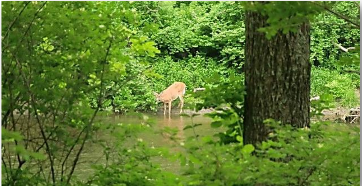
Housatonic River, Connecticut

stunder men de flesta lyckas jag inte artbestämma underifrån, när de är högt där uppe i lövverket. Lyckan är fullständig när jag hittar flera sjungande, vackra American Redstart , rødstjartskogssångare. Gamar av båda arterna, både Turkey Vulture , kalkongam och Black Vulture , korggam flyger längs vägen och jag ser även min första Wild Turkey , kalkon! (Den vilda varianten alltså!)