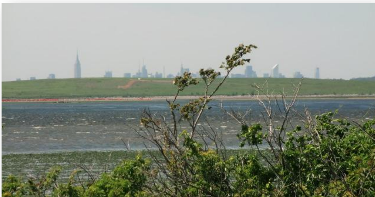
Jamaica Bay Wildlife Refuge, Manhattan i bakgrunden

Double-crested Cormorant örnskarv, Great Egrett ägretthäger, Snowy Egrett snöhäger, Black-crowned Night-heron natthäger, Glossy Ibis bronsibis, Mute Swan knölsvan, Canada Goose kanadagås, Brant prutgås, Mallard gräsand, Gadwall snatterand, Greater Scaup bergand, Bufflehead buffelhuvud, Red-breasted Merganser småskrake, Ruddy Duck amerikansk kopparand, Osprey fiskgjuse, American Coot amerikansk sothöna, American Oystercatcher amerikansk strandskata, Willet willetsnäppa, Laughing Gull sotvingad mås, American Herring Gull amerikansk gråtrut, Great Black-backed Gull havstrut, Foster's Tern kärrtärna, American Crow amerikansk kråka, Tree Swallow trädsvala, American Robin vandringsstrast, Gray Catbird grå kattfågel, Yellow Warbler gul skogssångare, Red-winged Blackbird rödvingetrupial, Common Grackle mindre båtstjärt, American Goldfinch guldsiska