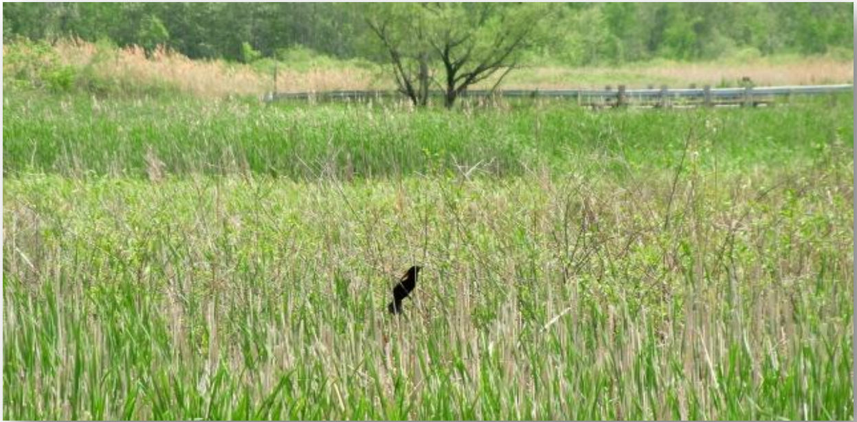
West Rutland Marsh, Red-winged Blackbird