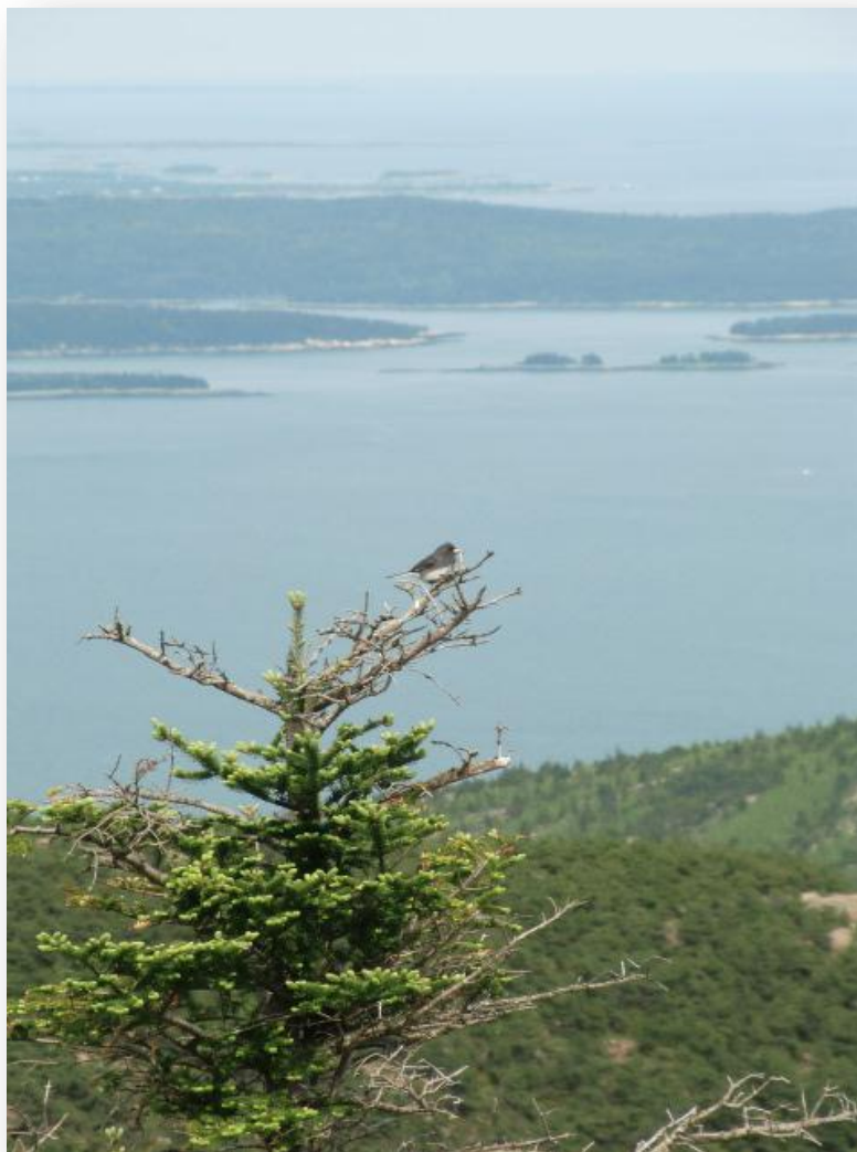
Acadia National Park, Dark-eyed Junco