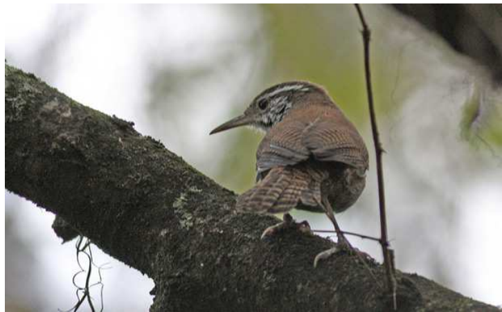
Gray-cheeked Thrush and Whooping Motmot (SH) samt Niceforo's Wren (Joakim Johansson).