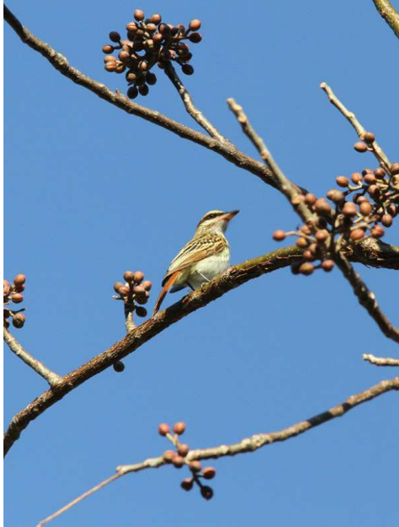
Streaked Flycatcher, Minca.