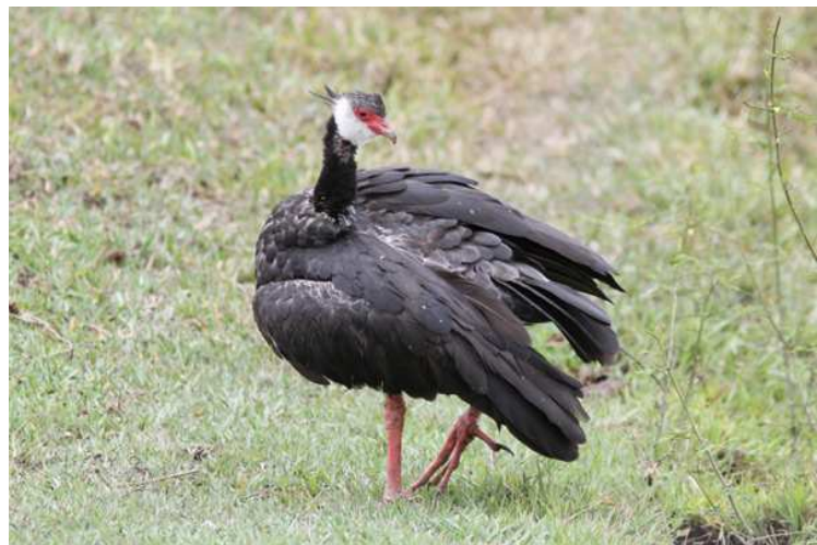
En helt obekymrad Northern Screamer!

tillbaka och göra oss redo för avfärd då "Elvis" och en ny chaufför var på plats i god tid. Klockan 07.26 tackade vi definitivt för oss och skumpade iväg ner mot Magdalenadalen . Som tur var kändes färden betydligt bekvämare än i förgår, trots samma usla väg till en början. Bilarna saknade oftast visuell kontakt, varför vi kom att stanna på lite olika ställen som såg giftiga ut. Tillsammans skrapade vi ihop en fin lista toppad av en Northern Screamer som stod snällt nära vägen, bland övriga arter kan nämnas Little Blue Heron, Fulvous Whistling-Duck, Savanna Hawk, Laughing Falcon, Purple Gallinule, Wattled Jacana, Solitary Sandpiper, Pale-vented Pigeon, Shining-green Hummingbird, Yellow-chinned Spinetail, White-headed Marsh-Tyrant, Fork-tailed Flycatcher, Cinereous Becard, drösvis med Bicolored Wrens, Black-chested Jay, Red-breasted Blackbird samt glasögonkajman. Bytet från jeepar till buss var högst välkommet, Jorge väntade vid en bensinmack där vi också kunde notera White-winged Swallow, Sand Martin och Yellow-rumped Cacique. Återstod gjorde nu en lång transport genom Medio Magdalena och uppför Cordillera Central till nästa ProAves-reservat. En del fåglar sågs utmed vägen, däribland Capped och Cocoi Herons, Whispering Ibis och Yellow-billed Tern, lunch intogs vid Puerto Araujo och dollars växlades till pesos i Puerto Berrío vid den mäktiga Magdalenafloden. Jorge körde på ordentligt, lite för bra ett tag så att reseledaren fick be honom att sänka hastigheten. Annars förflöt