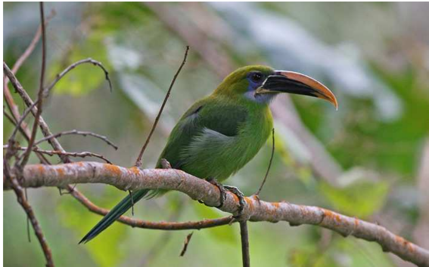
Yellow-billed Toucanet, El Dorado.

var knappast den bästa, och inte ens sparvugglevisslingar kunde frambringa mer än enstaka fåglar. Vi fick nöja oss med lite reprisar och sedan påbörja färden upp mot det hägrande El Dorado . På en allt sämre väg skumpade vi upp för Santa Martas sluttningar och stannade knappt innan vi nått omkring 1 300 meters höjd. Här letade vi i första hand efter kolibrier men fick "nöja oss" med fina obsar av Yellow-billed Toucanet, Black-chested Jay, Santa Marta Tapaculo, Santa Marta Brush-Finch och en