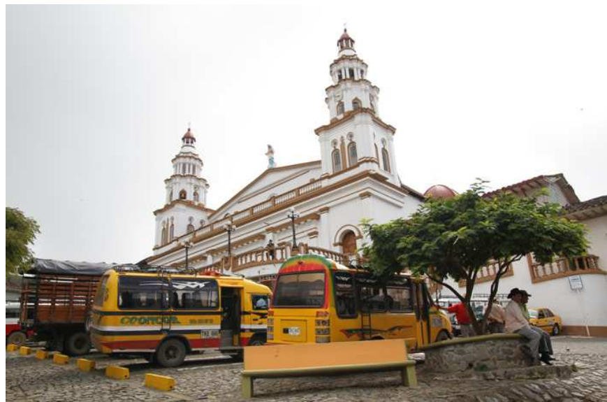
Heliangelus goes cultural: Concordia, Antioquia!