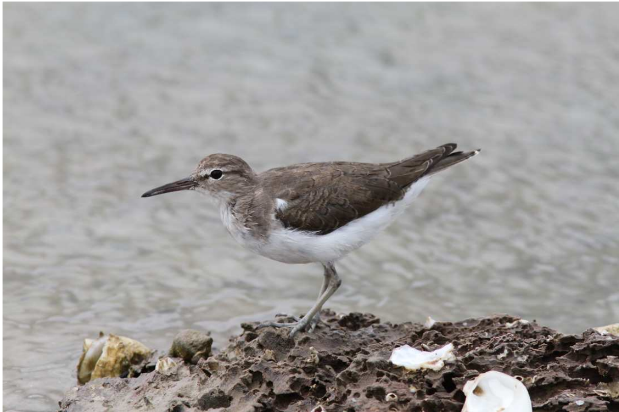
Spotted Sandpiper, Los Flamencos.