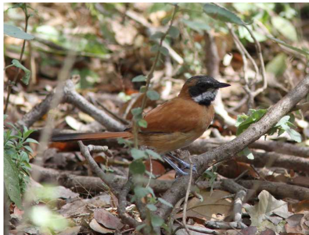
White Ibises och White-whiskered Spinetail.