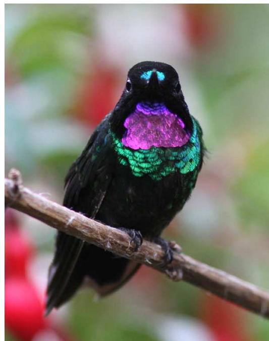
Heliangelus exortis – vilken fågel!

Resans utmaning var utlovad denna dag men det fanns också flera blytung Colombiaendemer att vänta sig i belöning. Vädret var som tur var utmärkt! Efter frukosten var det dags för utfodring av Colombias senast beskrivna art (x 2), Urrao/Fenwick's Antpitta, med en nyinventerad världspopulation på 33 par. Det var bara att bänka sig under en plastpresenning och vänta! Efter att ha lagt ut maskar på marken under ett litet tak av svart plast vislade Luis några gånger, och snart hoppade en antpitta fram sju meter framför oss. Den visade upp sig utmärkt och fick efter en stund sällskap av ytterligare en hungrig individ samt två Stripe-headed Brush-Finches. Excellence! Efter denna succé var det så dags för vandringen upp till páramon. Den första etappen var huvudsakligen en dryg transportsträcka, men vi fick in en del fåglar i form av t.ex. Tawny-breasted