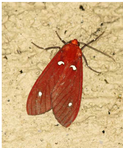
Tjusiga nattflyn vid Arrierito.