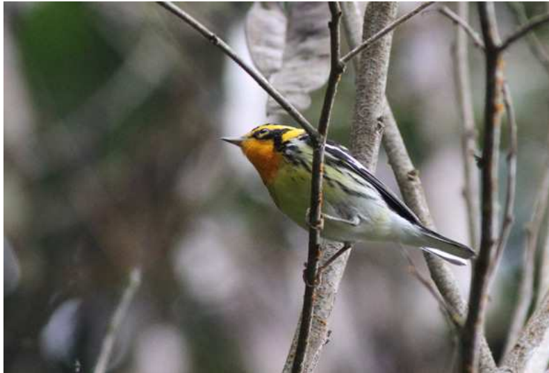
En av många vackra Blackburnian Warblers vid Reinita.

såsom Striped Cuckoo, Slaty Spinetail, Yellow-throated Vireo, Cerulean Warbler och Yellow-throated Brush-Finch. Vi åt en tidig lunch vid 11.30 och skulle åka iväg en timme senare, men på grund av strul med en av bilarna blev det en halvtimmes försening och en ny chaufför som utseendemässigt påminde en hel del om Elvis Presley. Färden till Nästa ProAves-reservat Pauxi pauxi tog bortåt två timmar och blev åter en skumpig historia. En Yellow-tufted Dacnis och några Ruddy-breasted Seedeaters sågs utmed vägen, annars körde vi i princip