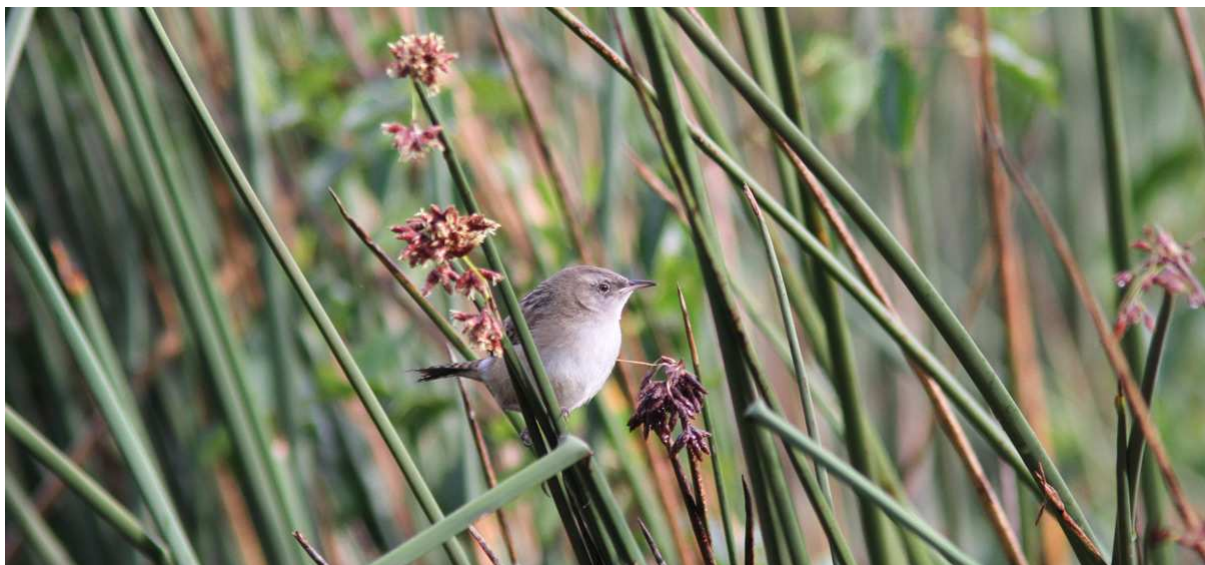
En av Colombias många hotade endemer: Apolinar's Wren vid Laguna de Fúquene.

NT = near-threatened EN = Endangered VU = Vulnerable CR = Critically Endangered