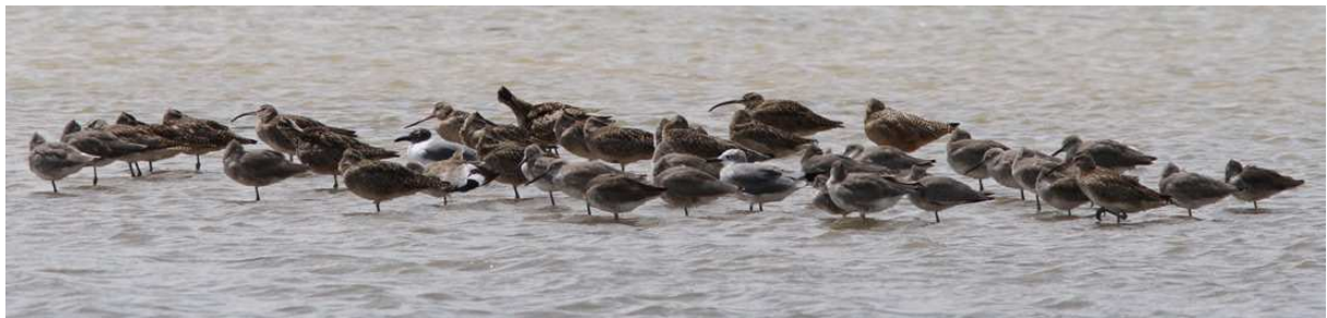
Snowy Egret och en mix av Willets, Whimbrels, Marbled Godwits och Laughing Gulls.