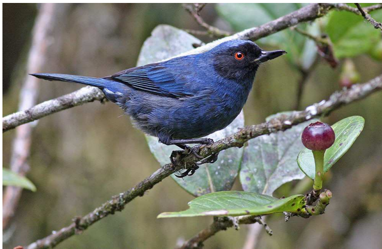
Masked Flowerpiercer och Black-headed Hemispingus.