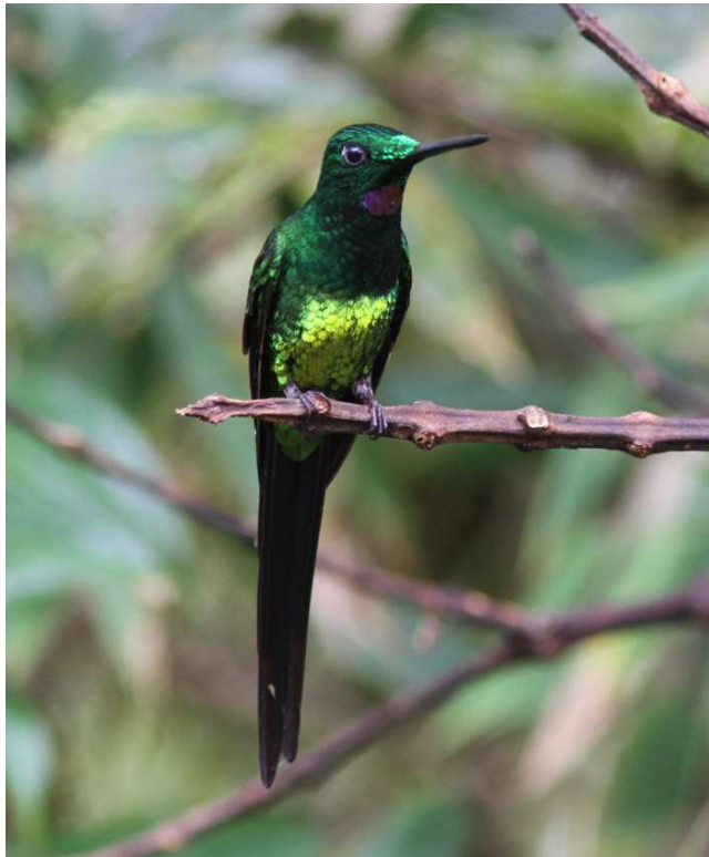
Empress Brilliant, Las Tangaras.