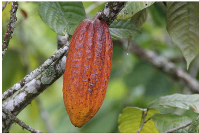
White-necked Jacobin och kakao, Pauxi pauxi.