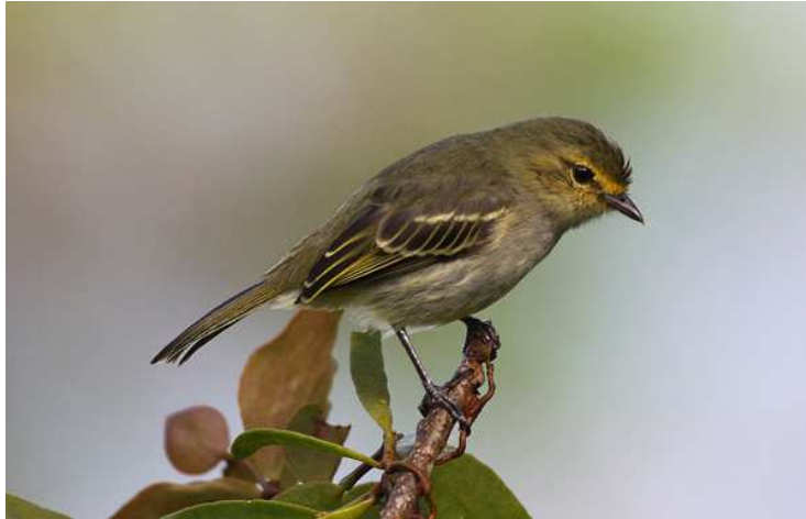
Golden-faced Tyrannulet vid Pauxi.

ämnesexperterna Erling och Ola. I skogsbrynet på nervägen sjöng både Sooty-headed (sedd) och Black-bellied Wrens. Under lunchen spanade vi på hummarna i trädgården där White-necked Jacobin och Brown Violetear dominerade och övriga arter innefattade bland andra Pale-bellied och Hairy Hermits, Black-throated Mango, White-vented Plumeleeter och Long-billed Starthroat. Hotande moln och viss trötthet gjorde att vi på eftermiddagen skippade ett nytt försök på Saffron-headed Parrot och istället vandrade en bit utmed vägen. Tyvärr lyckades vi inte hitta den