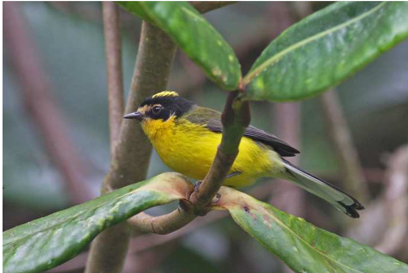
Yellow-crowned Whitestart.