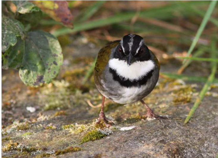
Den nysplittade Colombian Brush-Finch.