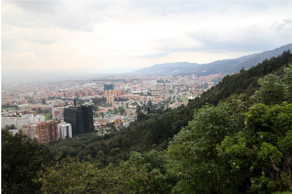
Vy över en liten del av norra Bogotá.

samt se White-tailed Kite, American Coot, Common Gallinule och Yellow-hooded Blackbird. Vid halv sex lämnade vi lokalen och någon timme senare var vi tillbaka på Hotel Emporium där middag och listgenomgång väntade. En god start på resan!