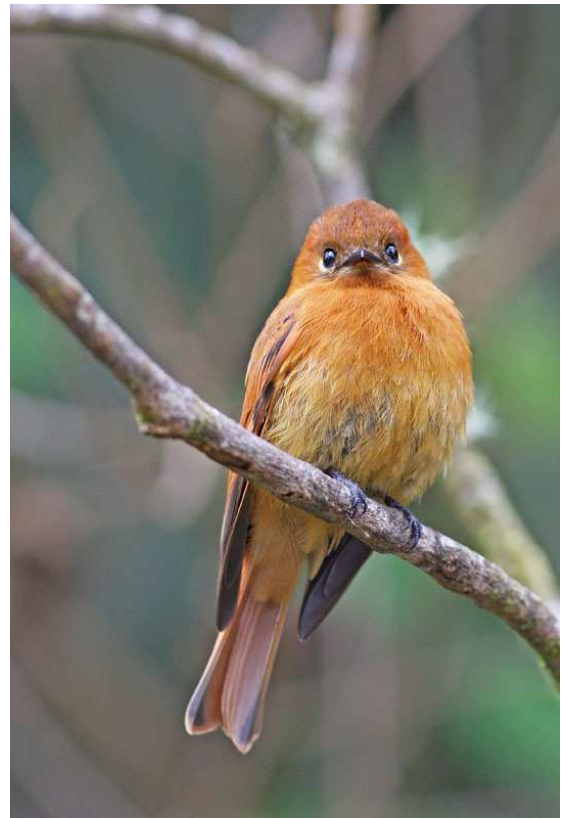
Cinnamon Flycatcher.

Eftersom vi redan hade sett alla höghöjdsarter föll valet denna morgon på att först göra ett försök att se Santa Marta Screech-Owl och sedan återvända för frukost och skådning på mellannivåerna. När det gäller ugglan lyckades vi höra hela fem individer varav två på nära håll, men vi lyckades inte se dem. Några engelsmän som anlät kvällen innan