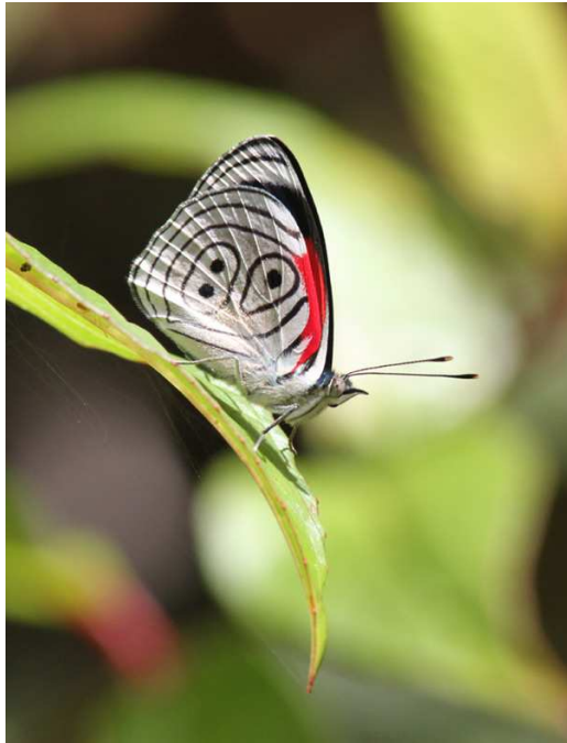
Neglected 88, orkidé och Masked Trogon.

winged Manakin och Black-and-gold Tanager innan vi tog jeeparna upp och gick in på gårdagens trail. Vi behövde bara komma in i skogen för att det skulle börja hända saker! Nya arter blev exempelvis Western Slaty-Antshrike, Rufous-rumped Antwren och en kvick Orange-breasted Fruiteater, det hördes även en Beautiful Jay på håll. Vi var tillbaka vid lodgen vid 11.30-tiden och påbörjade färden mot dagens slutdestination Jardin en stund senare. Den dalgång vi körde ner igenom på