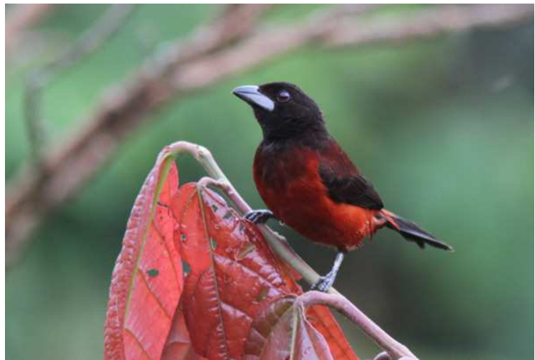
Black Inca och Crimson-backed Tanager.

Cerulean, Blackburnian och Black-and-white Warblers, Metallic-green Tanager och Blue-winged Mountain-Tanager. Vid El Talisman hade vi fin utsikt en kort stund innan bergsryggen till och från sveptes in i moln. Det spelades efter Colombian Mountain-Grackle flera gånger utan resultat, sedan blev det lunch vid 12.30 då en kille kom med med matlådor vars innehåll ännu inte kallnat. Suveränt! Vi fick nu gott om energi att påbörja nedfärden. Huvudaktiviteten blev en andra station med feeders som besöktes av samma arter som under morgonen plus Booted Racket-tail men med bättre fotomöjligheter. Sedan skulle vi göra ett försök på den sällsynta Recurve-billed Bushbird. Samtidigt som en White-mantled Barbet sjöng i slutningen högt ovanför positionerade vi oss strategiskt i skogskanten för ett playbackförsök, och det dröjde inte länge förrän vi fick svar! Fågeln satt dock alldeles för långt in och verkade inte vilja närma sig, så vi fick nöja oss med att höra denna verkliga raritet. De sista två timmarna med dagsljus ägnades åt skådning från verandan och fotografering, med arter som Indigo-capped Hummingbird, Bicolored Wren, Crimson-backed och Summer Tanagers, Yellow-tailed Oriole och Giant Cowbird. En mycket lyckad dag trots den missade bergsgrackeln!