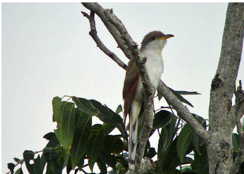
Yellow-billed Cuckoo, La Mancha.

Morgonexcursionen denna dag gick till La Mancha , där vi genast började spana av lagunen och stranden. Bland de sotvingade måsarna stod en ung Franklin's Gull och i övrigt kan nämnas Tricolored Heron, Semipalmated Plover, gott om Sandwich Terns samt Ringed Kingfisher. Vår promenad utmed vägen var fågelrik och gav Crane Hawk, Green Heron, 800 White-winged Doves, Yellow-billed Cuckoo, Black-headed Trogon (hörd), Scissor-tailed Flycatcher och ett 40-tal Dickcissels. Innan vi lämnade lokalen kunde vi dessutom hänga in Common Black-Hawk och Hook-billed Kite, den senare på flyttning indikerande att det nu var hög tid att bege sig till Cardel och hotelltaket! Idag var det