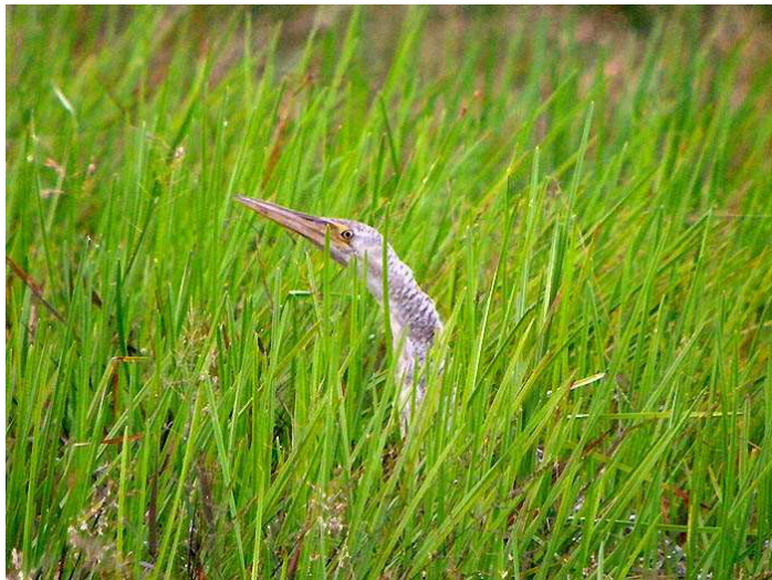
Pinnated Bittern.