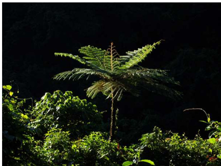
Ormbunksträd vid Valle Nacional.

Denna vår sista morgon i Valle Nacional och delstaten Oaxaca ägnades åt regnskogen på de lägre slutningarna av Sierra de Juarez. Vi gav oss ut i så pass god tid att ledarbilen stötte en eller två Pauraques på vägen och framme vid Km 58 dröjde det ett tag innan fåglarna kom igång. Snart hade vi dock fullt upp med flera stora flockar och annat smått och gott! Särskilt noterbara arter var White Hawk, Gartered och Collared Trogons, Blue-diademed Motmot, Keel-billed Toucan, Smoky-brown Woodpecker, Plain Xenops, Tawny-winged (hörd) och Ivory-billed Woodcreepers, Barred Antshrike, Yellow-bellied Tyrannulet, en rätt så kvick hane White-collared Manakin, Long-billed Gnatwren, Green Shrike-Vireo, Lesser Greenlet, Black-and-white Warbler, White-winged Tanager, Red-throated Ant-Tanager samt en Tayra som sprang över vägen. Nöjda åkte vi till hotellet vid 11.50-tiden, duschade, packade och fortsatte sedan resan mot Tuxtepec och Cordoba . Färden gick helt problemfritt, vi passade rentav på att få den smutsiga ledarbilen tvättad till det löjligt låga priset 30 pesos (grabbarna fick behålla växeln på