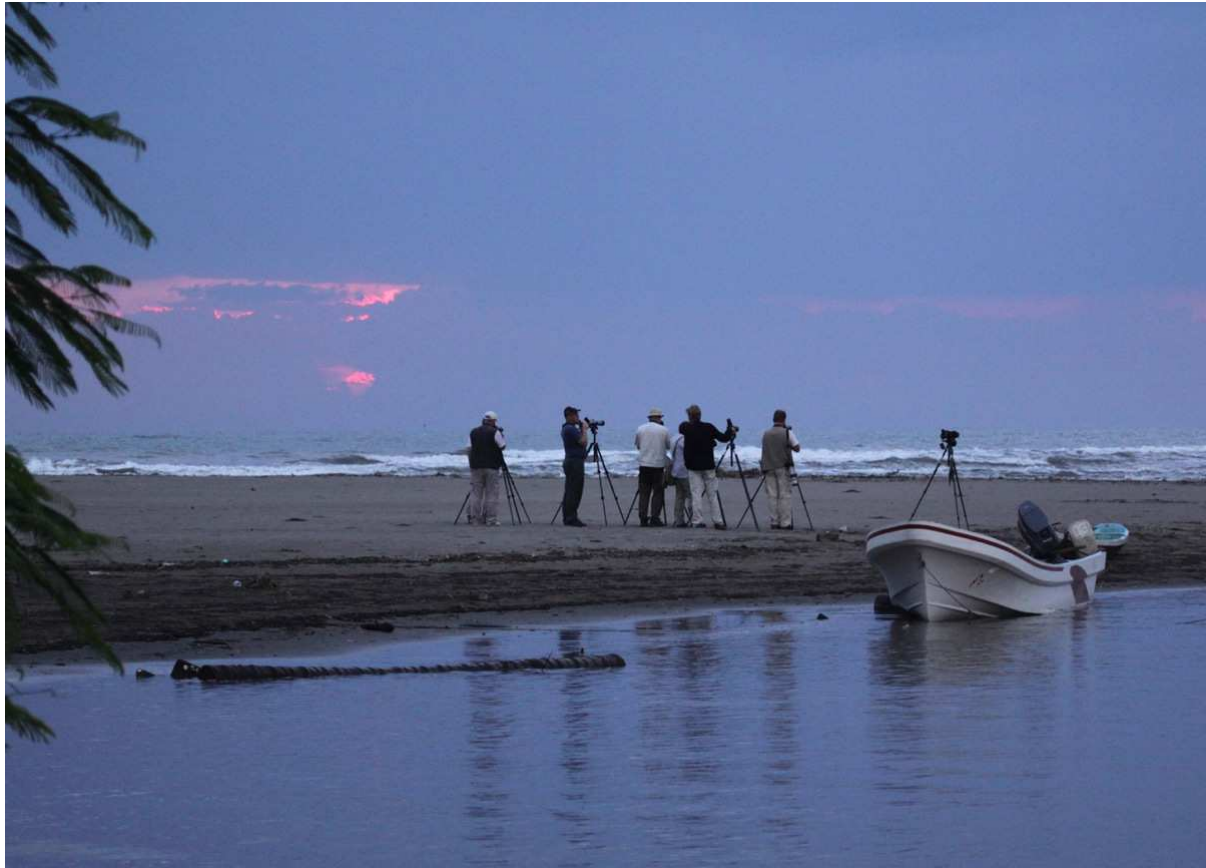
Morgonskådning vid La Mancha.