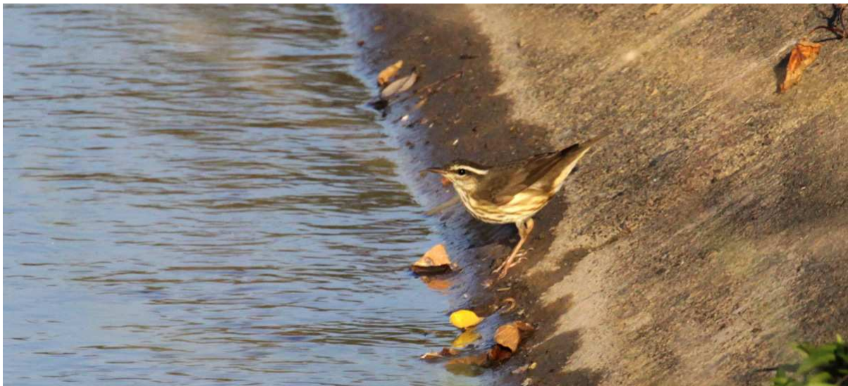
Scrub Euphonia och Louisiana Waterthrush.