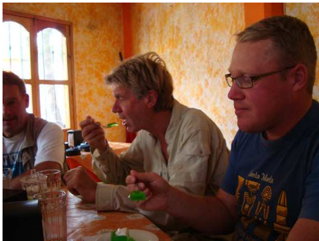
Grön jello till efterrätt i Coatepec. Mums! Till höger Cascada de Texolo.

lokalbefolkningen utmed vägen, men slutligen rullade vi nerför en kullerstensväg mot det berömda Cascada de Texolo . Vattenfallet och de omgivande ravinerna var verkligen imponerande, och här fanns också gott om fågel även om vi tidvis stördes av regn. Flera flockar med White-crowned Parrots passerade mycket fint! Cecilia vandrade iväg en sväng på egen hand och hittade på så sätt fruktbarande fikonträd och sykamorer som kokade av orioler, sångare, tangaror och smärre antal av exempelvis Masked Tityra och Crested Guan (endast Cecilia). Även Rufous-capped Warbler, Gray-crowned Yellowthroat och Lesser Goldfinch noterades innan det blev dags att gå mot bilarna för transport mot Cardel. Vi återvände i rättan tid, för snart regnade det ganska ordentligt vilket inte var helt fel med tanke hur bedräglig ledarbilen fortfarande såg ut. Åter i Coatepec hade regnet upphört, men att hitta rätt väg mot Xalapa var som förgjort utan att fråga om rätt riktning ett par gånger. Sedan gick allt som smort och vi var "hemma" vid Hotel Bienvenido vid 19.30-tiden.