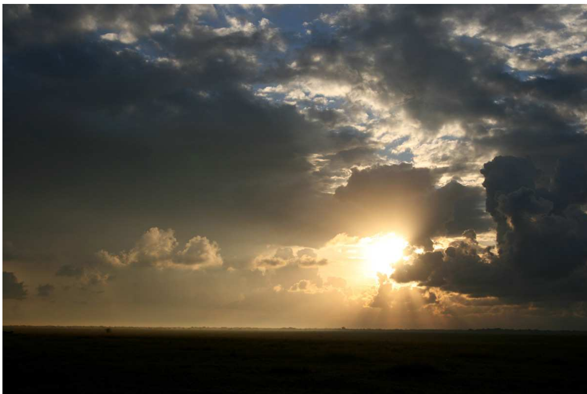
Soluppgång vid Las Barrancas.