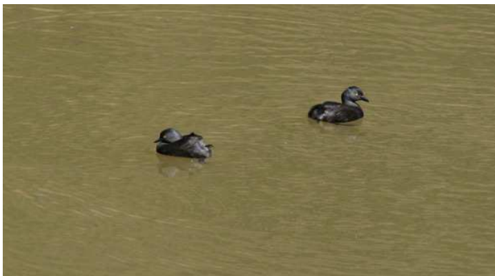
Least Grebes. Ovan: Inhandlande av bonad.