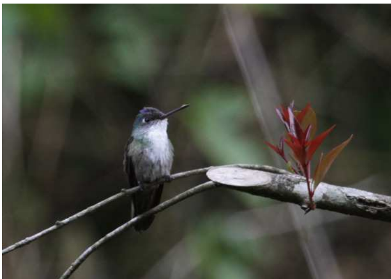
Azure-crowned Hummingbird, Macuiltepetl.

restauranger. Slutligen hittade vi ändå ett hyfsat ställe och maten smakade riktigt bra! Nästa mål var höglandsöken och pinyon-juniper-habitat vid Los Humeros . Ett stopp för Canyon Towhee och Say's Phoebe fick oss att inse att det var riktigt kyligt och ganska blåsigt uppe på platån. När vi stod där och huttrade kom en säkerhetsvakt från en närliggande anläggning fram och undrade vad vi höll på med; han nöjde sig med en förklaring och att anteckna några passuppgifter. Resten av eftermiddagen var en kamp mot klockan, men vi lyckade se en hel del roliga arter såsom pilgrimsfalk, Blue-throated Hummingbird, Western Scrub-Jay, Bewick's Wren, Curve-billed Thrasher, Loggerhead Shrike, Virginia's och Black-throated Gray Warblers, Black-chinned Sparrow och House Finch samt en hel del vackra blommor. Återfärden gick raka vägen mot Xalapa så när som på ett misslyckat bluebirdstopp. Trots denna lilla missberäkning var alla nöjda efter en fin dag i fält och vi avslutade med middag på vårt mysiga hotell.