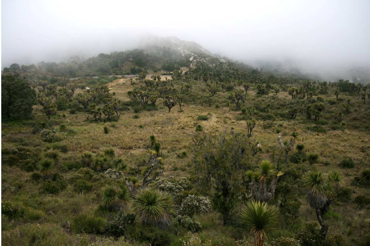
Yucca, pinyon-juniper och rikligt med blommor vid Los Humeros.

restauranger. Slutligen hittade vi ändå ett hyfsat ställe och maten smakade riktigt bra! Nästa mål var höglandsöken och pinyon-juniper-habitat vid Los Humeros . Ett stopp för Canyon Towhee och Say's Phoebe fick oss att inse att det var riktigt kyligt och ganska blåsigt uppe på platån. När vi stod där och huttrade kom en säkerhetsvakt från en närliggande anläggning fram och undrade vad vi höll på med; han nöjde sig med en förklaring och att anteckna några passuppgifter. Resten av eftermiddagen var en kamp mot klockan, men vi lyckade se en hel del roliga arter såsom pilgrimsfalk, Blue-throated Hummingbird, Western Scrub-Jay, Bewick's Wren, Curve-billed Thrasher, Loggerhead Shrike, Virginia's och Black-throated Gray Warblers, Black-chinned Sparrow och House Finch samt en hel del vackra blommor. Återfärden gick raka vägen mot Xalapa så när som på ett misslyckat bluebirdstopp. Trots denna lilla missberäkning var alla nöjda efter en fin dag i fält och vi avslutade med middag på vårt mysiga hotell.