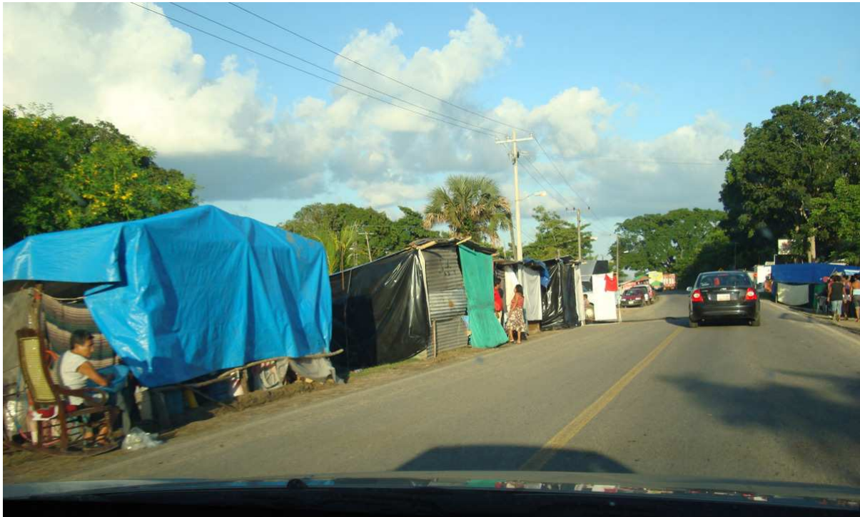
På väg genom översvämningsområdet.