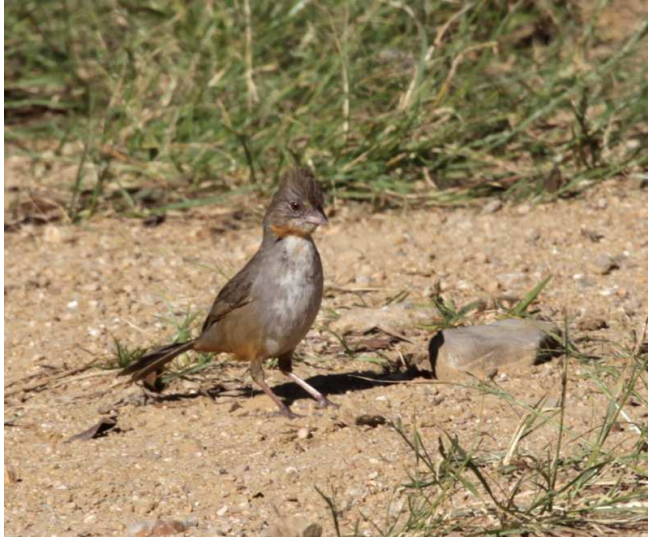
White-throated Towhee.