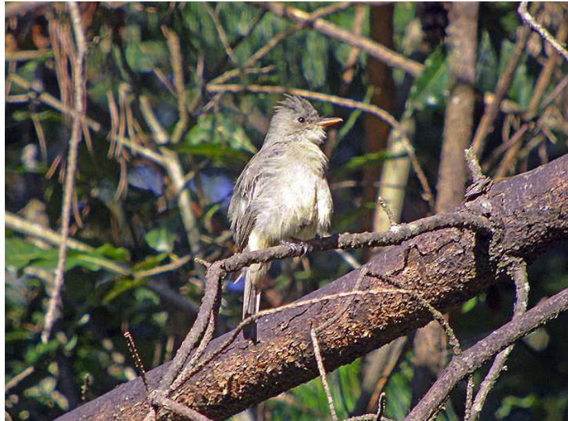
Gray Silky-Flycatcher och Greater Pewee.

Minas en bit högre upp. Vid bilarna stod ett par poliser och väntade på oss. De förklarade vänligt att de ville ha koll på vilka vi var och att folk hade blivit rånade i området vid några tillfällen. Vi hade som tur var inte stött på något misstänkt och man försäkrade oss om att Las Minas var ett säkert område. Gott så! Reseledaren prioriterade i detta läge molnskogen, så längs vägen blev det bara ett stopp för Lark Sparrow medan en Eastern Bluebird passerades i tron att den skulle bli enkel att se på tillbaka-vägen. Flytet fortsatte! Den otvivelaktigt mest uppskattade fågeln blev en underbar Red Warbler, men Garnet-throated och Amethyst-throated Hummingbirds, Black Thrush, Brown-backed Solitaire, Steller's Jay och många fler skämdes inte heller för sig. Vid 12-tiden började molnen välla upp genom dalen och en stilla dimma lägga sig i skogen. Ett försök att spela fram Striped Sparrow och Hooded Yellowthroat misslyckades, dock fick vi se en Hammond's Flycatcher innan vi styrde kosan mot Perote uppe på kanten av den mexikanska högplatån. Vid bluebirdfälten låg dimman tät! Perote hade gott om höga topes och fula hus men få attraktiva