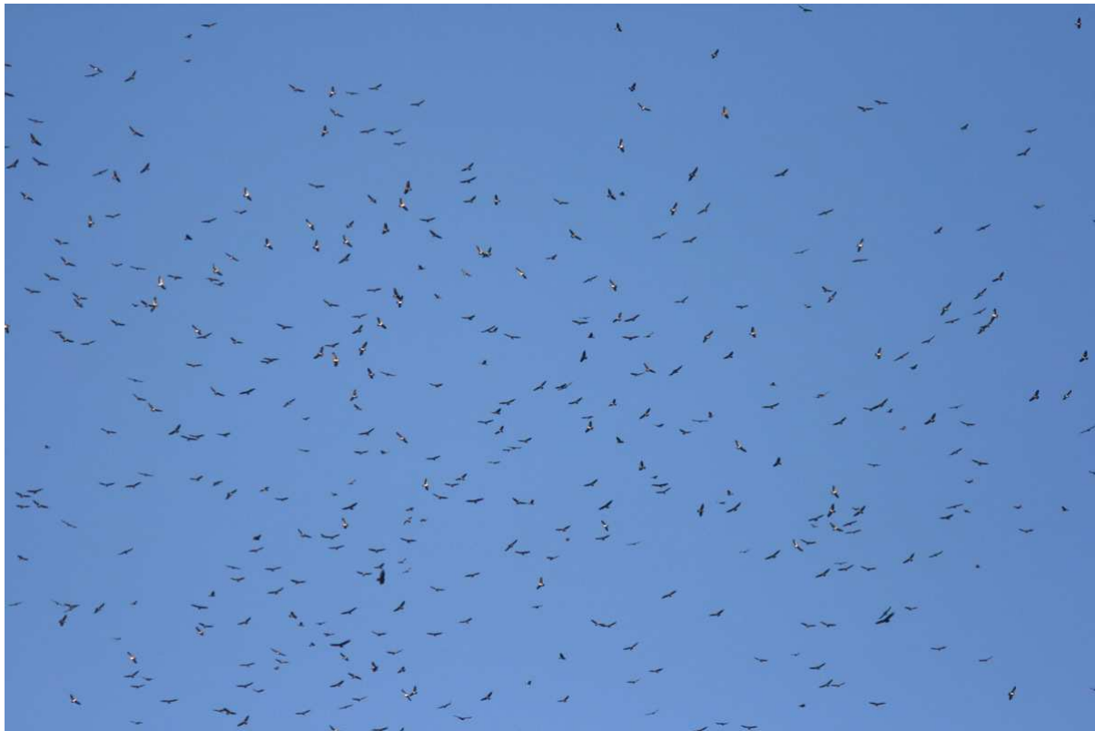
Swainson's Hawks och några TV:s vid Chichicaxtle. Vilket drag!