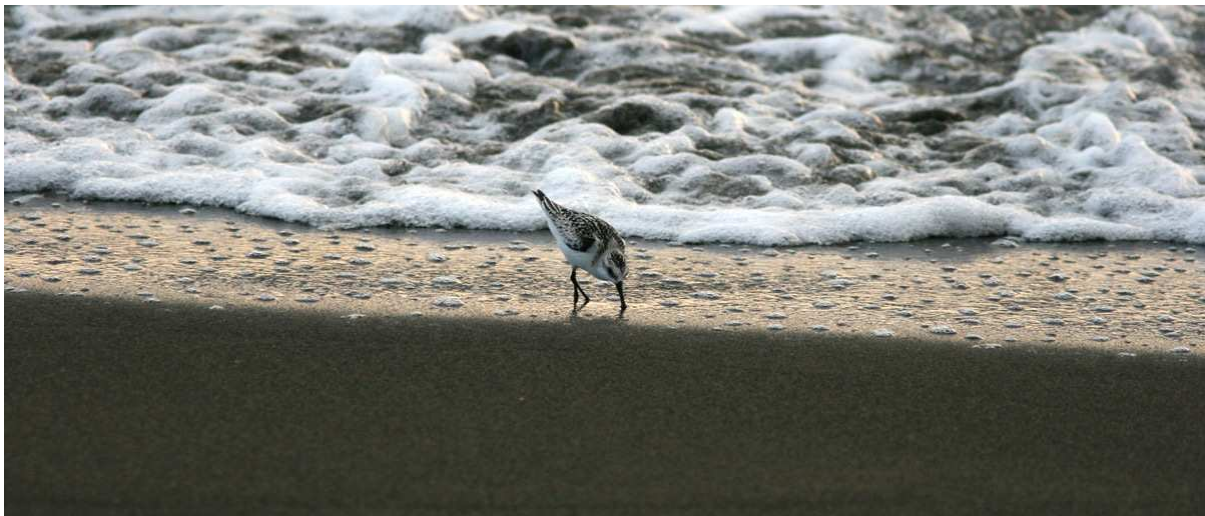
Sandlöpare vid Playa Juan Angel.

Whistling-Duck, Northern Caracara, Gray Plover, Greater Yellowlegs, Semipalmated Sandpiper (tåflikarna sågs utmärkt) och 140 sandlöpare. Vi återvände till Cardel vid 09.30-tiden och höll tummarna. Från taket fick vi sedan under ett par timmar bevittna ett fint sträck med 20 000 Swainson och minst lika många Turkey samt 3 Hook-billed Kites. Redan vid 12-tiden började det att blåsa upp, så en timme senare parkerade vi oss vid Chichicaxtle för resten av dagen. På plats fanns även Discovery Channel med tillhörande helikopter! Det var ordentligt drag med endast kortare pauser i sträcket, när det var som allra bäst haglade superlativen omkring oss!: "Göta Petter!". "Hur är det möjligt!?" Några lines med Swainson var verkligen grymma och mot slutet, när bil två hade återvänt till Cardel, pumpade det på med otroliga mängder Turkey Vultures. Slutresultatet för dagen hamnade på 198 989 fåglar varav 105 219 Swainson och 92 993 Turkey och rätt många pilgrimsfalkar plus ett par tusen Wood Storks, men detta speglar knappast verkligheten vad gäller Turkey Vulture; bara mellan 17.00–17.50 sträckte nämligen över 40 000 individer enligt protokollet och totalsiffran torde