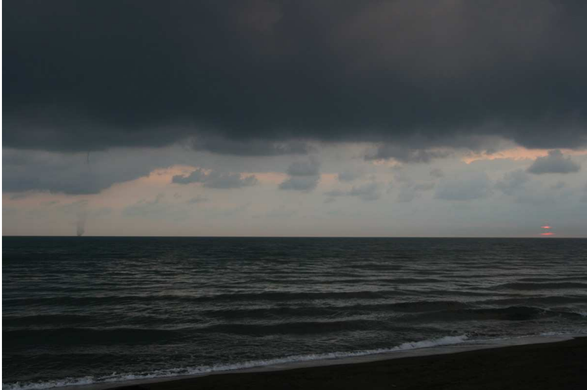
Morgondramatik vid Playa Juan Angel. Samtidigt som solen steg upp ur havet kom en tromb ner (till vänster)!