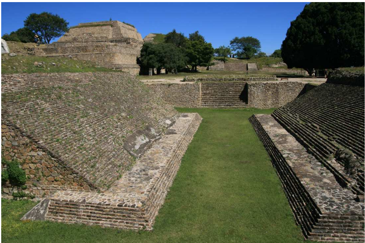
Vy från Monte Albáns pelotearena.

Vi började dagen med en sovmorgon till 06.30, sedan åt vi frukost några kvarter bort. Tro det eller ej, men ledarbilen hade fått genomlida en ny massiv attack från övernattande gracklar, så när vi vid ett tillfälle missade skyltningen på väg mot Monte Albán passade vi på att få rutorna tvättade vid en bensinmack. Att ta sig till Monte Albán, en av södra Mexikos viktigaste fornlämningar, visade sig betydligt mer tålamodsprövande än väntat. Två av tre broar över Río Atoyac var ur funktion och att ta sig över den tredje tog ungefär en halvtimme på grund av en totalt ihoptjorvad trafiksituation. Via lite bakvägar kom vi slutligen på rätt kurs och när vi äntligen nådde fram till målet var klockan nästan nio. Skådningen kring Monte Albán kom i huvudsak att koncentreras till blommande träd och omgivande buskmarker. Ruby-throated, Berylline och Magnificent Hummingbirds sågs utmärkt vid upprepade tillfällen, men varken Beautiful eller Dusky Hummingbird behagade visa upp sig. Av ett