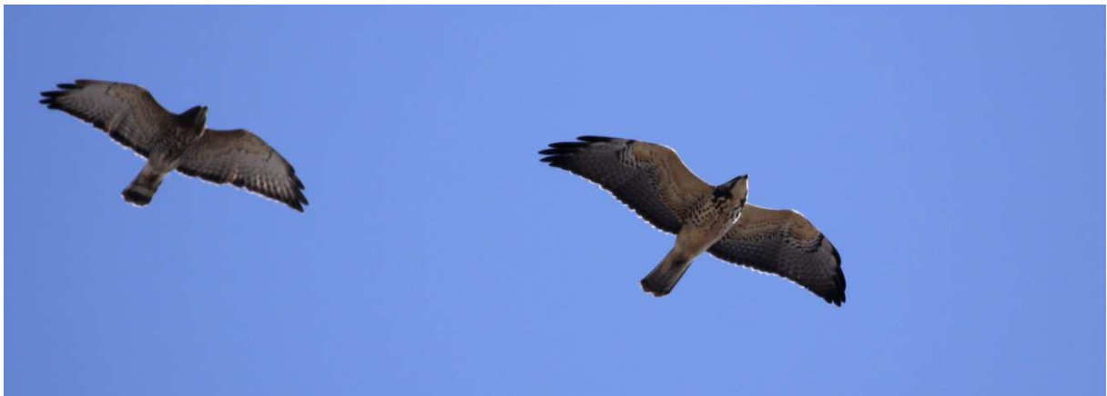
Broad-winged och Swainson's Hawk från Hotel Bienvenido.