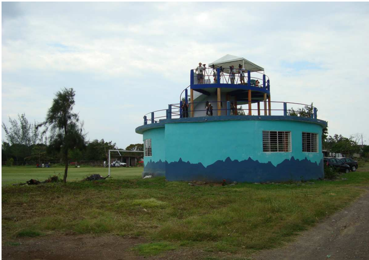
Spaning vid den berömda fotbollsplanen i Chichicaxtle.