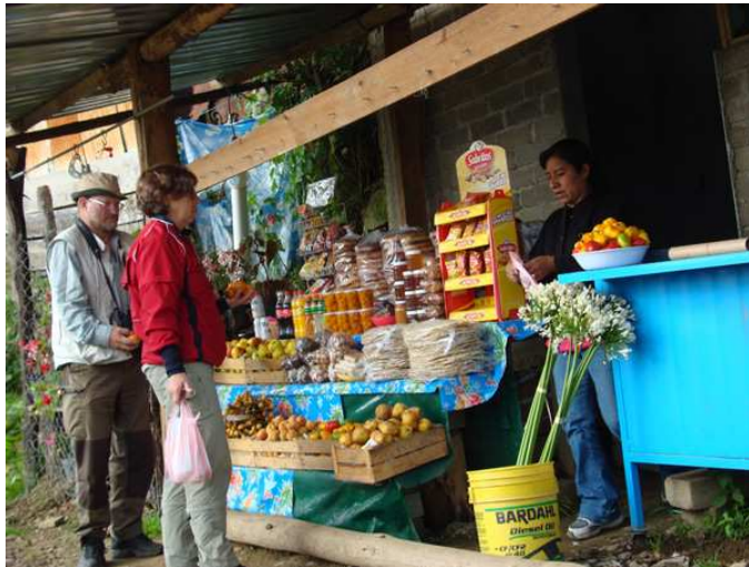
Fruktköp till mexikansk dansbandsmusik.

och hann stanna till i två områden med lite olika karaktär. Än en gång svek Oaxacaspecialarna och vi fick nöja oss med gott om Yellow-rumped Warblers ( auduboni ) inklusive en fartfylld jaktscen, Olive-sided Flycatcher, Western Scrub-Jay, Spotted (ovanligt svårsedda) och White-throated Towhees, Clay-colored och Chipping Sparrows samt Black-headed Grosbeak. Som vanligt utmed denna väg rann tiden iväg alldeles för fort. Vi kåkade lunch uppe i pine-oak-zonen och kunde förutom vällagad pollo även avnjuta nya dansbandslåtar på tv-kanalen Bandamax – den visuella upplevelsen var minst lika underhållande som den akustiska och blev därmed en svårslagen kombination! Våra försök att hitta Dwarf Jay och Gray-barred Wren misslyckades kapitalt, vi fick däremot se arter som White-eared Hummingbird, Grace's och Hermit Warblers, Mexican Chickadee och Red Crossbill. Cecilia lyckades dessutom få en skymt av den huvudsakligen nattaktiva tvättbjörnsläktingen Cacomistle. Utsikten från El Mirador denna eftermiddag var mycket vacker! Efter lite skådning nedanför passet körde vi nonstop till Valle Nacional dit vi anlände vid 19.15-tiden. Några gick ut och åt tacos etc. medan några stannade på hotellet och vilade upp sig efter ytterligare en lång dag i fält och på krokiga vägar.