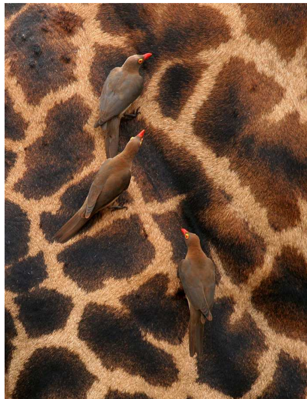
Red-billed Oxpeckers på giraff.

Frukostbuffé serverades 05.30 och en dryg halvtimme senare tog vi plats i bilarna för att köra bort mot Crater Lake Game Sanctuary . Först stannade vi dock till vid Lake Oleidon där det fanns ett par tusen storskarvar, en del Lesser Flamingos, African Spoonbill, Hottentot och Cape Teals, gott om vadare inklusive dammsnäppa, mosnäppa och många Kittlitz's Plovers samt en ropande Red-chested Cuckoo. Längs de sista fem kilometrarna började det dyka upp giraffer, zebbor, impalor och Thomson's Gazelles och bland nya fåglar kan