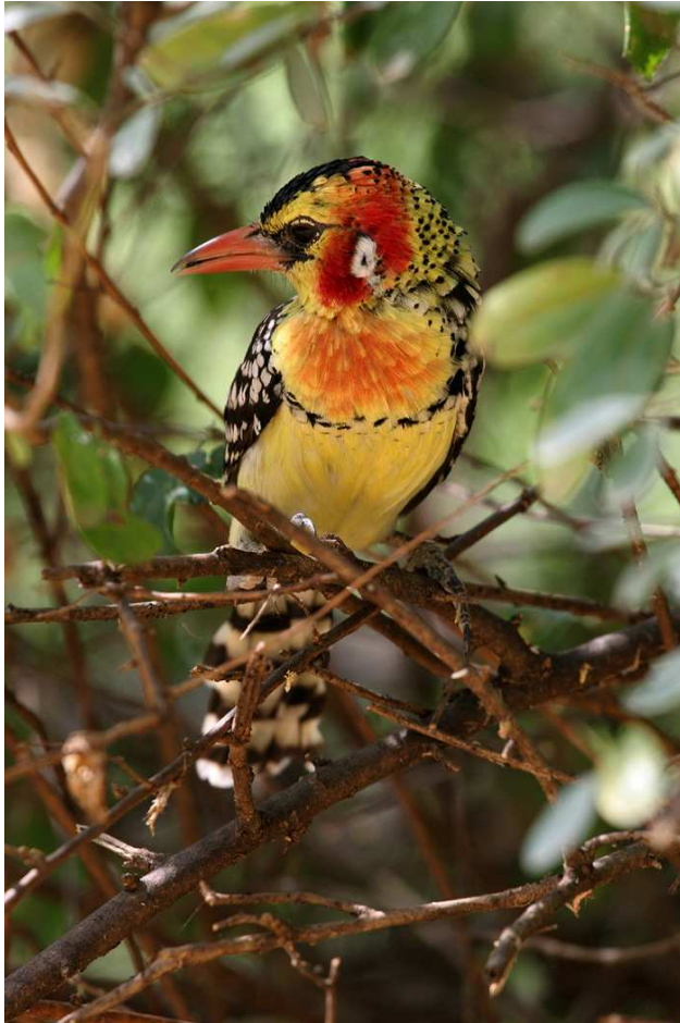
Red-and-yellow Barbet.

Squirrel. Efter denna mycket lyckade dag i fält kändes det gott att få duscha och äta middag till den även idag behagliga sjöbrisen. Dagstotalen landade på 119 arter.