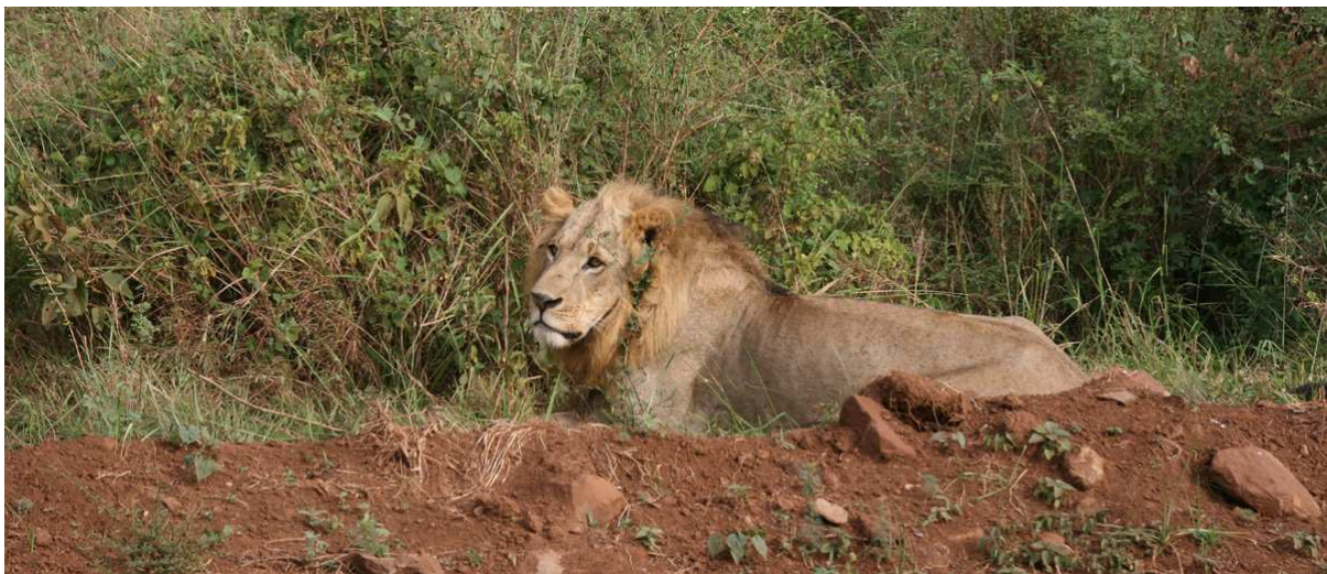
Ett av åtta lejon i Nairobi NP, nästan på klappavstånd!