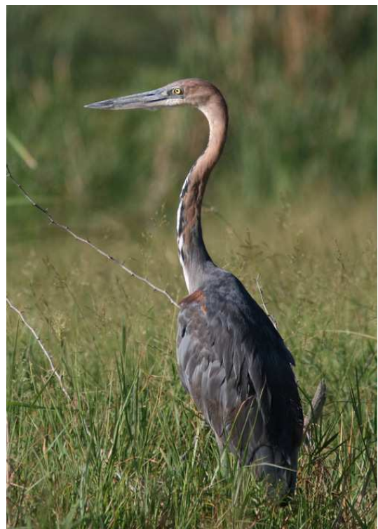
En läcker Baringotrio: Northern Masked Weaver, Carmine Bee-eater och Goliath Heron.