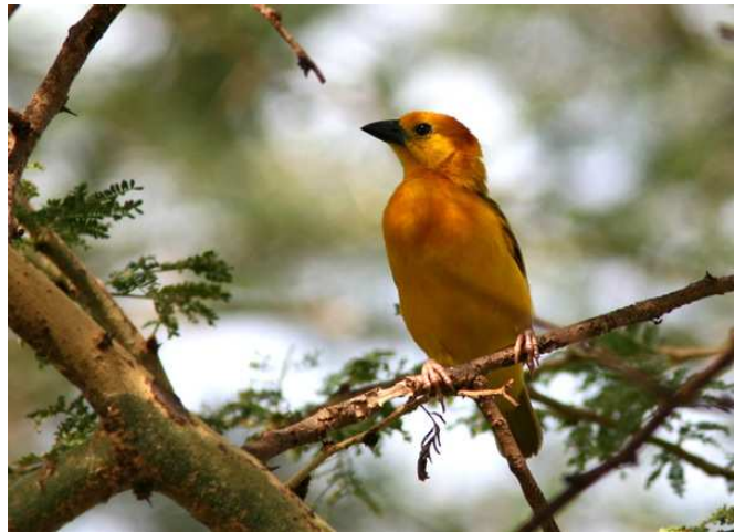
Taveta Golden Weaver.

huvudmål var Lake Jipe fem mil från entrén kunde vi inte stanna allt för ofta och länge, men det gav ändå mycket trevligt i form av Hartlaub's och Black-bellied Bustards, en hel del Black-faced Sandgrouses, Red-winged, Foxy och Flappet Larks, Golden Pipit (vilken fågel!), Chestnut Weaver, giraffer, zebbor, koantiloper och en hel del elefanter. Nästan framme vid sjön skapade reseledaren lite förvirring, men istället för den felaktigt bestämda kaspiska piparen fick vi se fyra lika välkomna Double-banded Coursers. Lake Jipe mitt på gränsen mellan Kenya och