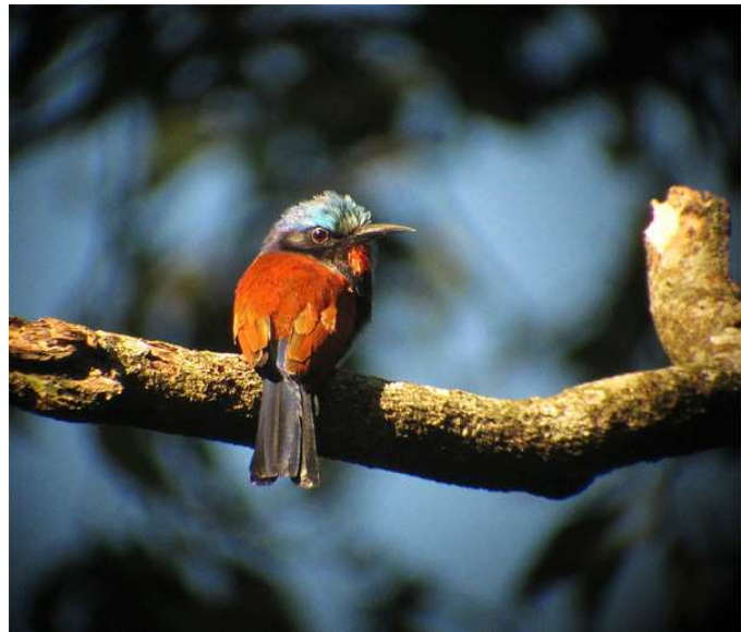
Blue-headed Bee-eater .