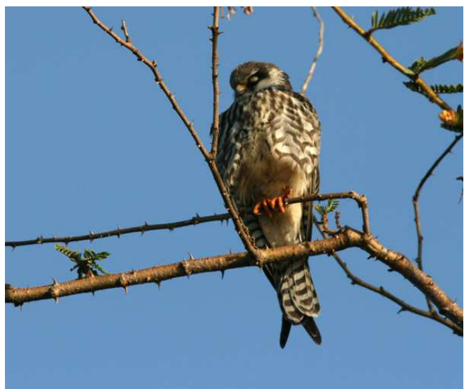
Amur Falcon, trött efter flygningen från Ostasien.

En enkel frukost serverades vid 05.30 och en halvtimme senare åkte vi iväg till Hippo Point för en båttur på Victoriasjön. Liksom vid Baringo färdades vi i två båtar, och vi kom nära många fåglar såsom Black-crowned Night-Heron, Hamerkop, en oväntad och uppenbart trött Amur Falcon, African Jacana, Water Thick-knee, Gull-billed Tern, Blue-headed Coucal, Spot-flanked