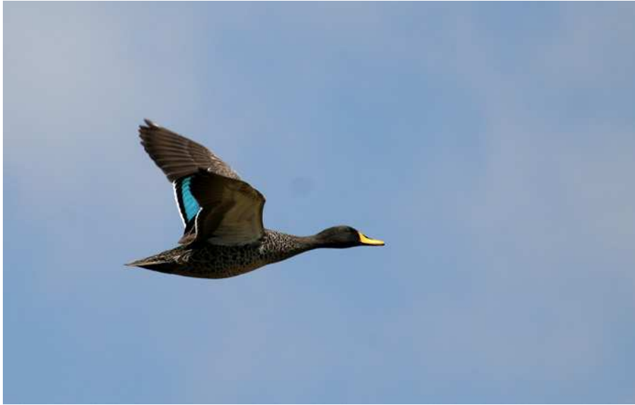
Yellow-billed Duck, Nyahururu.

Owl etc. Här stod ugglegurun Paul och väntade på oss, men att hitta själva ugglan krävde bara ett lyft av kikaren – den satt på en klipphylla på synnerligen bekvämt avstånd! Paul berättade om sitt uggleprojekt som pågått i 16 år, han hade till och med blivit intervjuad i en av Kenyas största dagstidningar nyligen. När alla var nöjda tackade vi för oss och åkte vidare. Utmed vägen sågs Black-