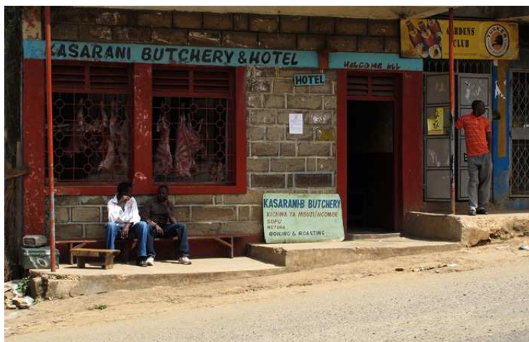
En intressant kombinationsverksamhet utmed vägen.