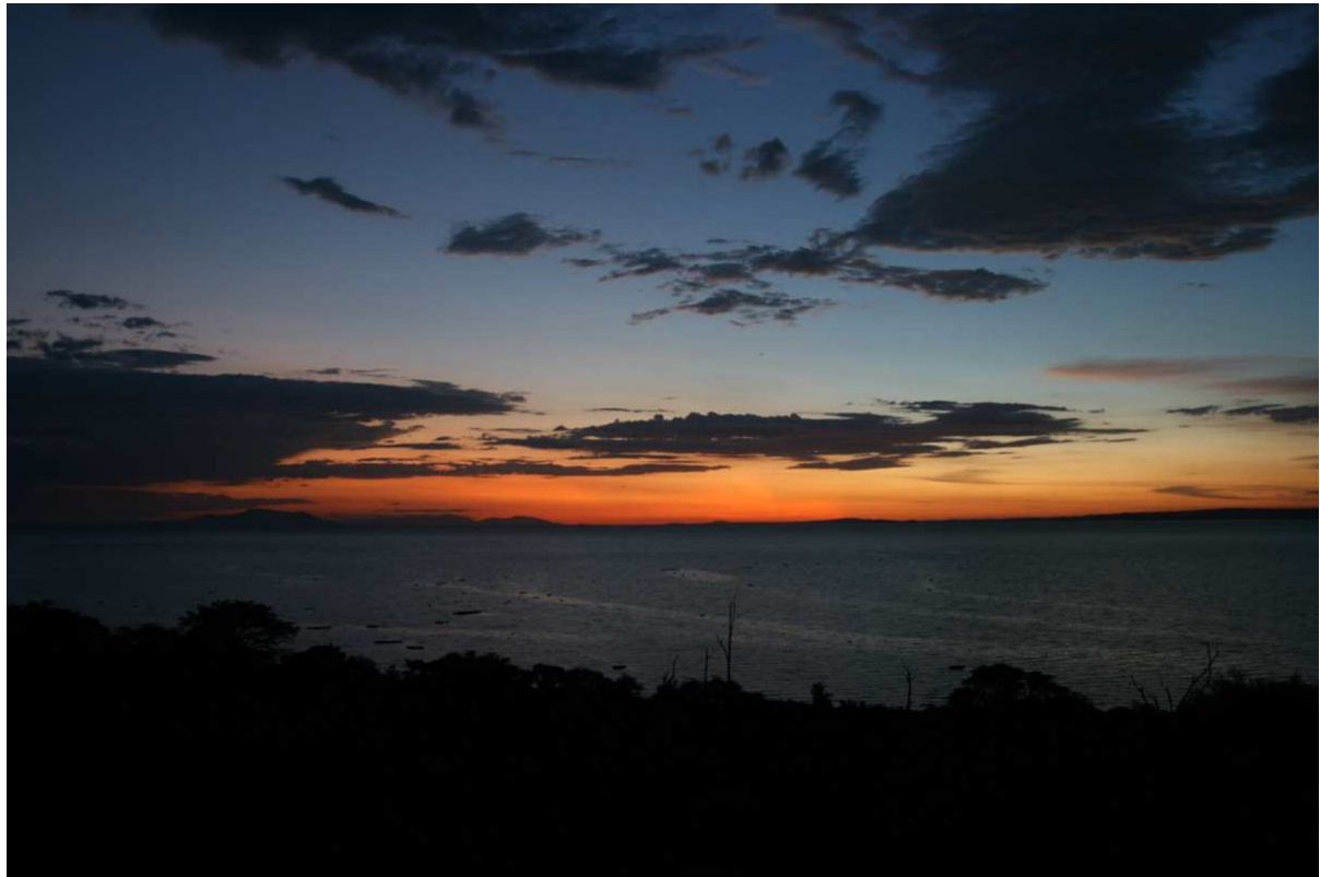
Strax efter solnedgången vid Victoriasjön.