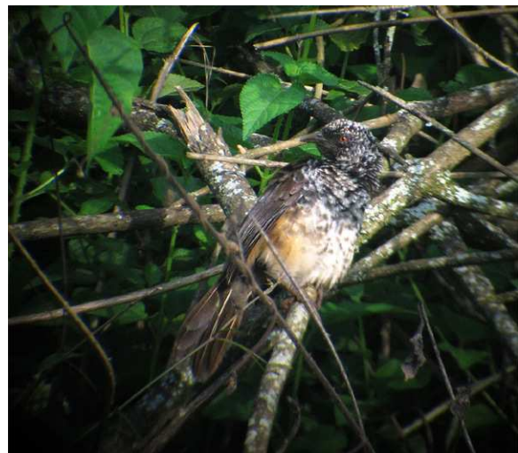
Hinde's Babbler.