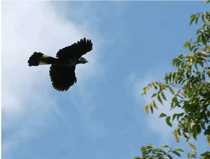
Great Blue Turaco!