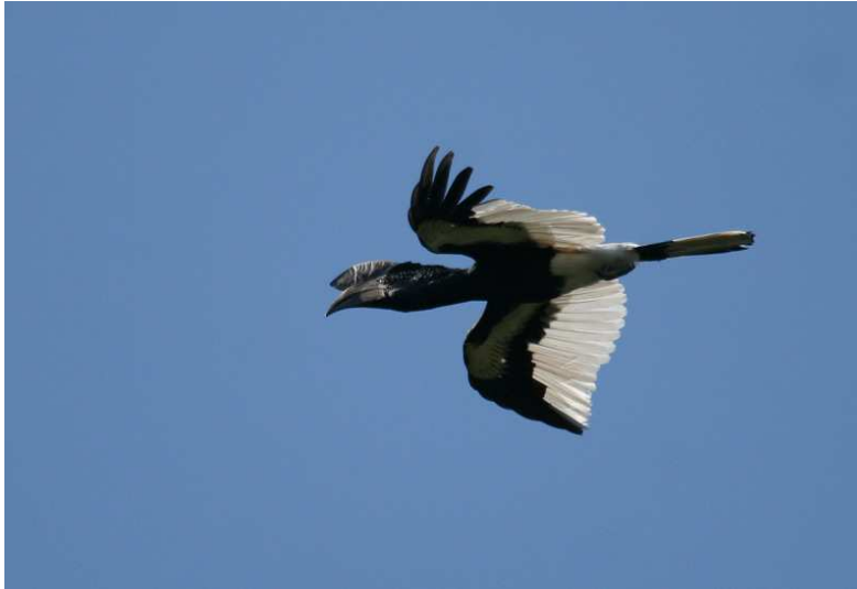
Grey-cheeked Hornbill .

Negrofinch medan de flesta fick korn på Black-faced Rufous Warbler, Jameson's Wattle-eye och Great Blue Turaco. Vi avslutade med att gå en ny sväng ute på vägen och kunde bland annat notera Green-throated, Copper och Green Sunbirds samt en sjakal av något oklar arttillhörighet (Side-striped eller Golden). Dagen kunde utan tvekan sammanfattas som en succé när vi framåt skymningen återvände för en skön dusch och god middag.