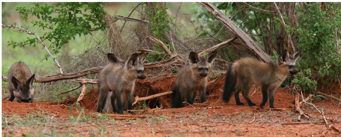
Bat-eared Foxes vid sin lya! Nedan: Black-faced Sandgrouse.

Chestnut-headed och Chestnut-backed Sparrow-Larks samt Fischer's Starling. Lunchen åts i bilarna och de sista fem milen (av totalt 93 km) speedade vi på lite för att vara ute ur parken före 15.30. Utanför Sala gate passade vi på att gå ner till Sabaki River där vi såg Water Thick-knee, Three-banded Plover, Golden Palm Weaver och tre vildsinta krokodiler av respektingivande storlek – tur att ingen gick för nära vattnet! Återstod gjorde nu drygt tio mil grusväg av mestadels tvättbrädekaraktär. Överallt utmed vägen fanns det folk, även i rena bushen, och det vinkades från och till otaliga exalterade ungar; några av dem fick ta emot ett överblivet lunchpaket. Vi nådde fram till Malindi vid