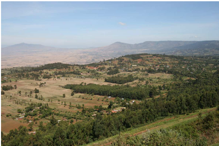
Utsikt över Rift Valley.