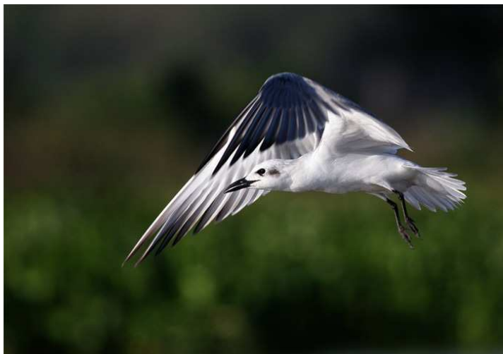
Gull-billed Tern, Dunga.

och Double-toothed Barbets, Greater Swamp Warbler, Swamp Flycatcher samt Slender-billed och Northern Brown-throated Weavers. Papyrus Gonolek hördes vid ett enda tillfälle. Jag hade tänkt mig en längre båtfärd, men det gick lite för långsamt överlag för att vi skulle hinna med att åka till "nästa" område och tyvärr behagade inte heller några African Skimmers visa upp sig. Klockan 09.30 steg vi i land i Dunga och påbörjade snart en lång transportsträcka österut. En bit bortom Kisumu stannade vi till i ett område med våta risfält och kunde där beskåda African Openbill, Long-toed Lapwing, Black-tailed Godwit, Blue-cheeked Bee-