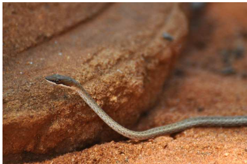
Link-marked Sand Snake, Sagala.

Huvudmålet denna dag var ett besök till Taita Hills med avfärd 04.45. Trots den tidiga timmen var gryningen inte långt borta och vägen var bitvis riktigt usel innan vi svängde av uppåt de grönklädda granitbergen som mycket liknade West Usambaras på andra sidan gränsen i Tanzania. Nästan all naturlig skog var borta, anledningen till att