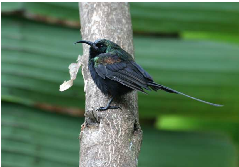
White-spotted Flufftail och Bronze Sunbird.

tailed Drongo och försärla. Morgonpassets sista stopp gjordes vid en bäck där fåglarna var få men människor desto fler. Såväl barn som vuxna kvinnor bar hem tunga lass med ved medan andra hämtade vatten; snacka om olika livsvillkor oss emellan! Samuel tog en tidig lunch för att kunna åka in till Kakamega stad och förhoppningsvis en gång för alla kunna ta ut pengar för resten av resan. Utfallet blev inte det önskade trots försök på tre olika banker men slutligen blev åtminstone 40 000 shillings säkrade från en av Barclays bankomater.