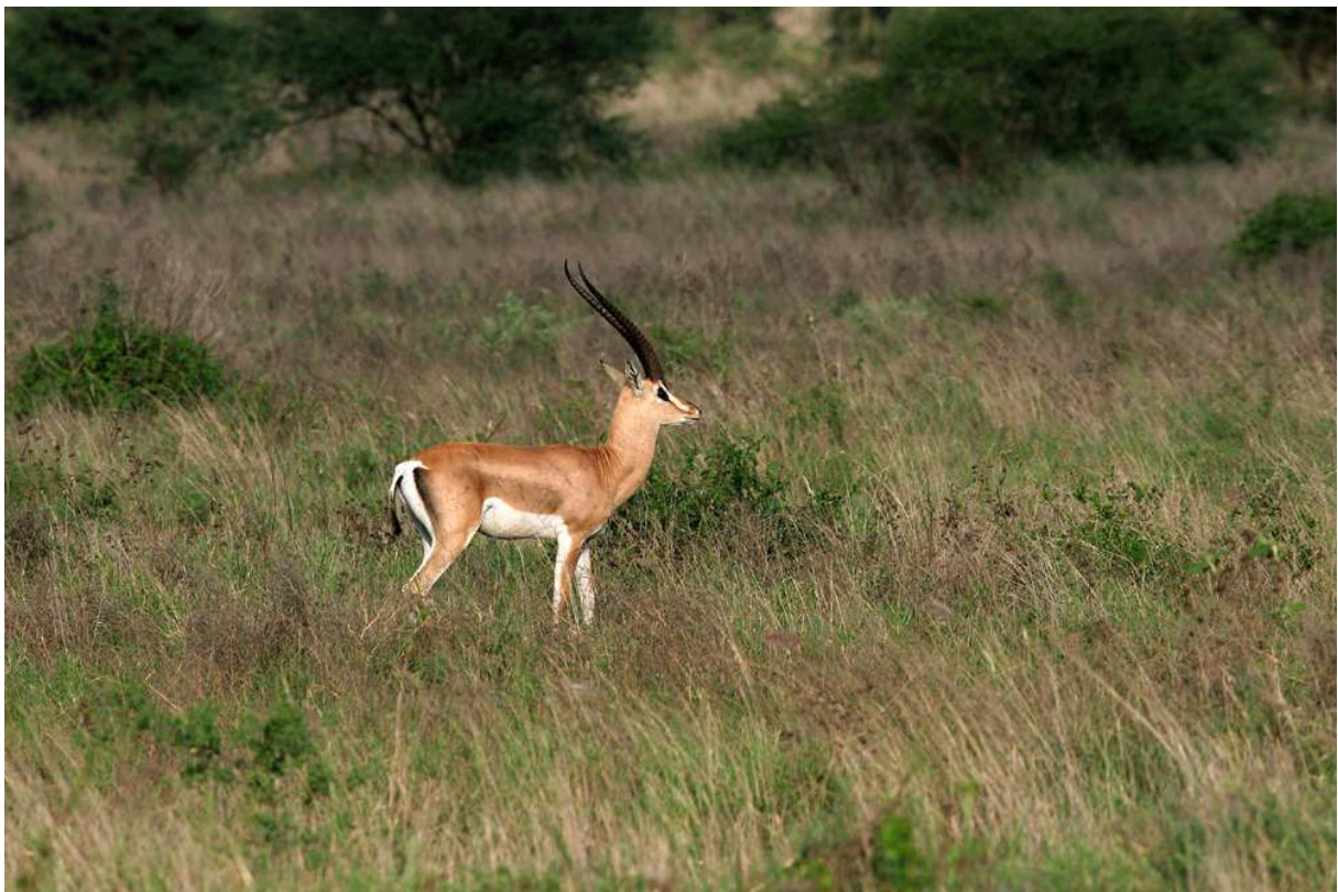
Otroligt elegant – Grant's Gazelle i Tsavo West NP.

Plötsligt dök en Wahlberg's Eagle upp från ingenstans och gjorde ett utfall mot närmsta ugglan, omedelbart efter kom en mörk Gabar Goshawk och gav sig på örnen. Båda fåglarna gjorde ytterligare varsitt utfall mot ugglorna innan de gav sig iväg och allt kunde studeras på 15 meters avstånd! Efter denna fartfyllda inledning var det tämligen lugnt (inte ett spår av Pringle's Puffback) tills vi hittade en grupp fåglar som mobbade en förmodad orm. Golden-breasted Starlings var modigast och ihärdigast, men andra fåglar som sågs fint på 7 meters avstånd var bland andra Grey Wren-Warbler, Eastern Olivaceous Warbler och Grey-headed Bush-Shrike. Snart var ännu en lyckad dag till ända.