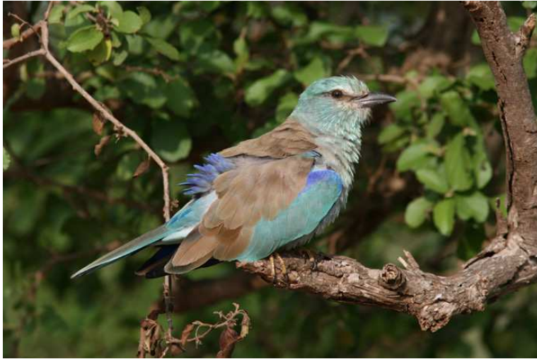
En av många europeiska blåkråkor i Tsavoregionen.