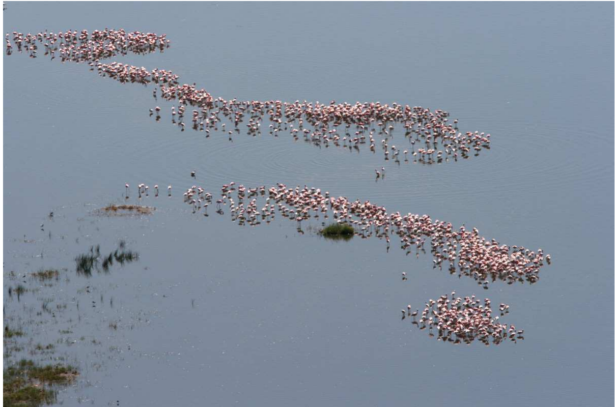
Lesser Flamingos och Golden-breasted Bunting.

brushane och småsnäppa. Andra arter i sjön och dess närhet var exempelvis Eared Grebe, African Spoonbill, Yellow-billed Stork, Cape Teal, Grey Crowned Crane, Marsh Sandpiper, Kittlitz's och Lesser Ringed Plovers, Grey-hooded Gull, Gull-billed och Whiskered Terns, White-fronted Bee-eater, Red-capped Lark, Red-throated Pipit (hörd), Common Rock-Thrush, Zitting Cisticola och Common Whitethroat. Från Baboon Cliffs gavs vackra vyer, och härifrån samt i skogen nedanför kunde vi beskåda Steppe Eagle, Chin-spot Batis, Mocking Cliff-Chat, Lesser Rock-Thrush,