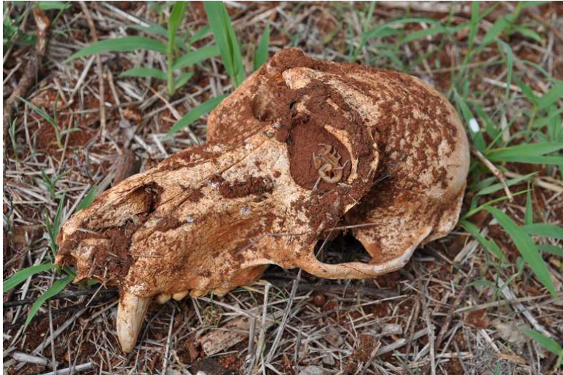
Skorpion i babianskalle, helt oarrangerat!

eyed Thrush, Bare-eyed Babbler, Hunter's och Tsavo Purple-banded Sunbirds, Slate-colored Boubou, Vitelline Masked Weaver, Red-billed Buffalo-Weaver, Green-winged Pytilia, European Oriole och Eastern Paradise-Whydah. Tack vare mycket moln hölls temperaturen nere. En kursändring tog oss till fin Commiphora -skog, men snart var förmiddagsvärmen ifatt oss och fågelaktiviteten avtog markant. Vi kunde dock notera Wahlberg's Eagle, Von der Decken's Hornbill och Marsh Warbler innan vi vände för att