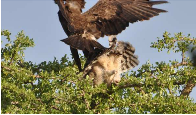
Wahlberg's Eagle attackerar Spotted Eagle-Owl!

naped Ravens. Innan vi lämnade den behagliga bergsluften hann vi också se Brown-hooded Kingfisher och en African Hobby med slagen tätting (Taita Apalis :(?). Efter en shoppingsväng till Vois illaluktande centrum var vi tillbaka till Sagala vid 16-tiden och en halvtimme senare begav sig de flesta ut på en kortare kvällspromenad. Det mest spännande inträffade dock innan vi lämnat trädgården och började med att vi stötte en Spotted Eagle-Owl. I försök att se ugglan sittande stöttes ytterligare tre ugglor som satte sig högt upp i en akacia.