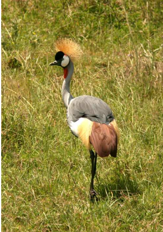
Grey Crowned Crane, Nairobi NP.