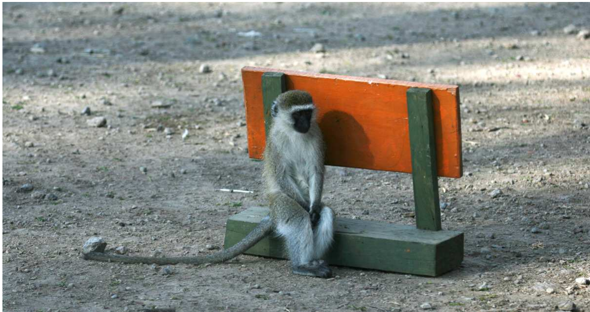
Det krävs tålamod för att bli insläppt i Lake Nakuru NP, något denna Vervet Monkey förstått .

ofrånkomlig kamp på liv och död. Andra arter som noterades var African Openbill, Greater Flamingo, Southern Pochard och Northern Shoveler (förmodligen hundratals) samt avlägsna däggdjur som Hippo, Waterbuck och Warthog. Nöjda kunde vi snart återvända till Crayfish Camp där en välkommen buffé väntade. Slutresultatet blev även denna dag 127 arter!