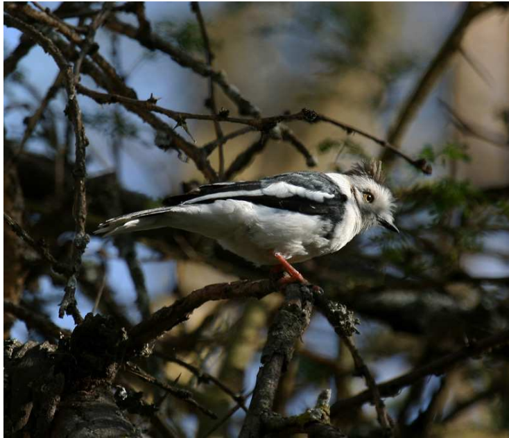
Grey-crested Helmet-Shrike .

Grey-crested Helmet-Shrike. Vår vandring gav Mottled, Nyanza och White-rumped Swifts, African Grey Flycatcher och African Golden-breasted Bunting, när vi sedan tog bilarna och gjorde ett sista försök i akaciaskogen hörde Moses något misstänkt. Jojomen, där var de! Alla fick fina obsar på denna Serengetiendem, och säkert togs det också ett och annat hyfsat foto. Dagens avslutande skådarinsats gjordes vid Lake Oleidon, och nu fanns här betydligt fler fåglar än under morgonen i ett perfekt kvällsljus. En fin flock med Lesser Flamingos stod relativt nära och hundratals White-winged Terns dansade runt över vattenytan. En African Fish-Eagle slog en storskarv vilket ledde till en segdragen men