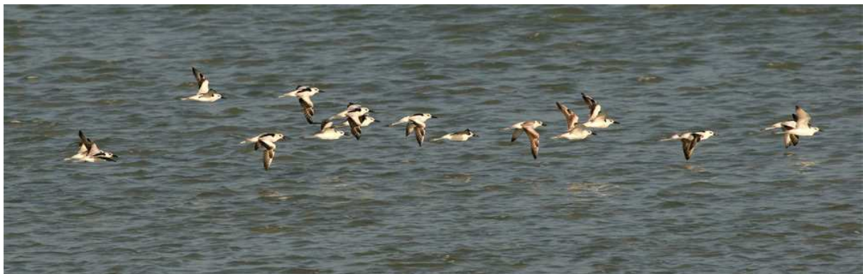
Greater Sandplover och Crab Plovers vid Mida Creek.