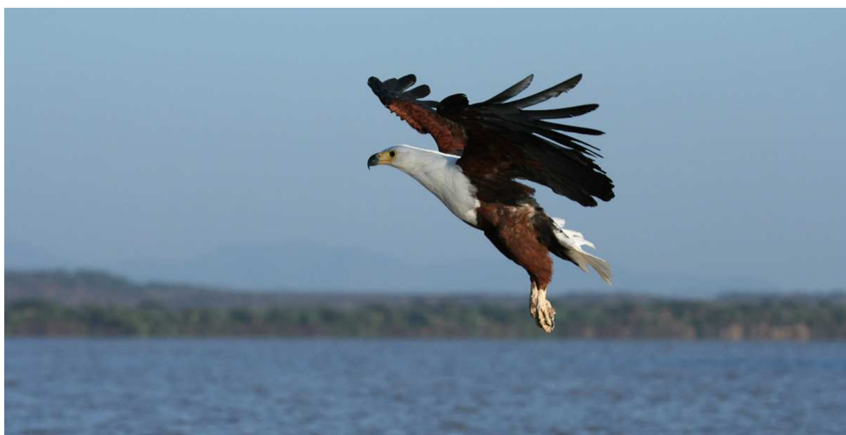
... med fantastiska obsar på African Fish-Eagles!

Denna vår första morgon vid Lake Baringo började med en båttur på sjön (i två båtar) med avfärd klockan 06.15. Temperaturen var mycket behaglig, ljuset perfekt, vyerna vackra och fåglarna många. Kort sagt var det en mycket trevlig exkursion! Häftigast var utan tvekan utfodringen av två par African Fish-Eagle, en show som jag själv inte var medveten om i förhand. Efter att några fiskar inhandlats av män som paddlade runt i små kanoter härmade Moses fiskörnens läte för att väcka fåglarnas uppmärksamhet, sedan slängde han iväg en fisk som snabbt snappades upp från vattenytan. Fotografierna gavs fantastiska fotomöjligheter, om man hann med i svängarna vill säga! Bland många andra trevliga arter som vi fick se och fotografera på nära håll bör nämnas African Darter, Goliath Heron, många Squacco Herons, Black Crake, Senegal Thick-knee, Malachite och Pied Kingfishers,