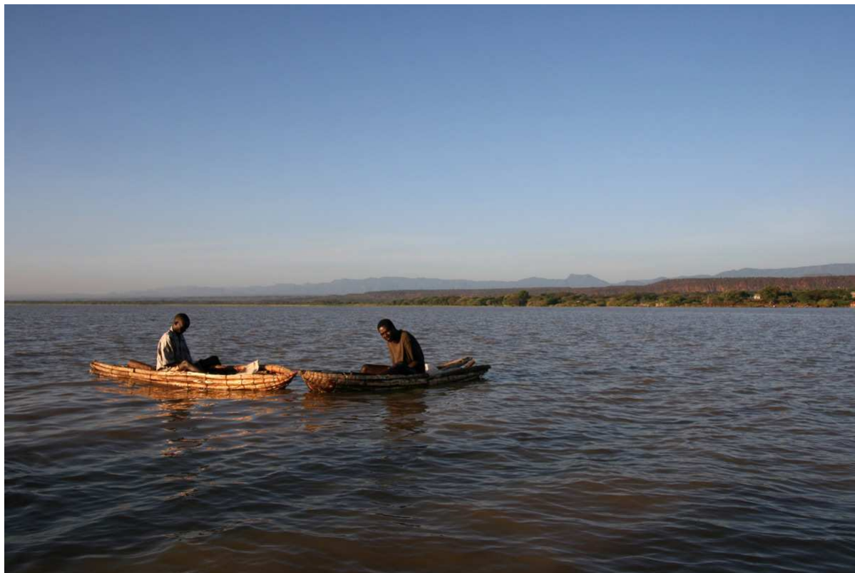
Båtturen på Lake Baringo var en riktig höjdare ...