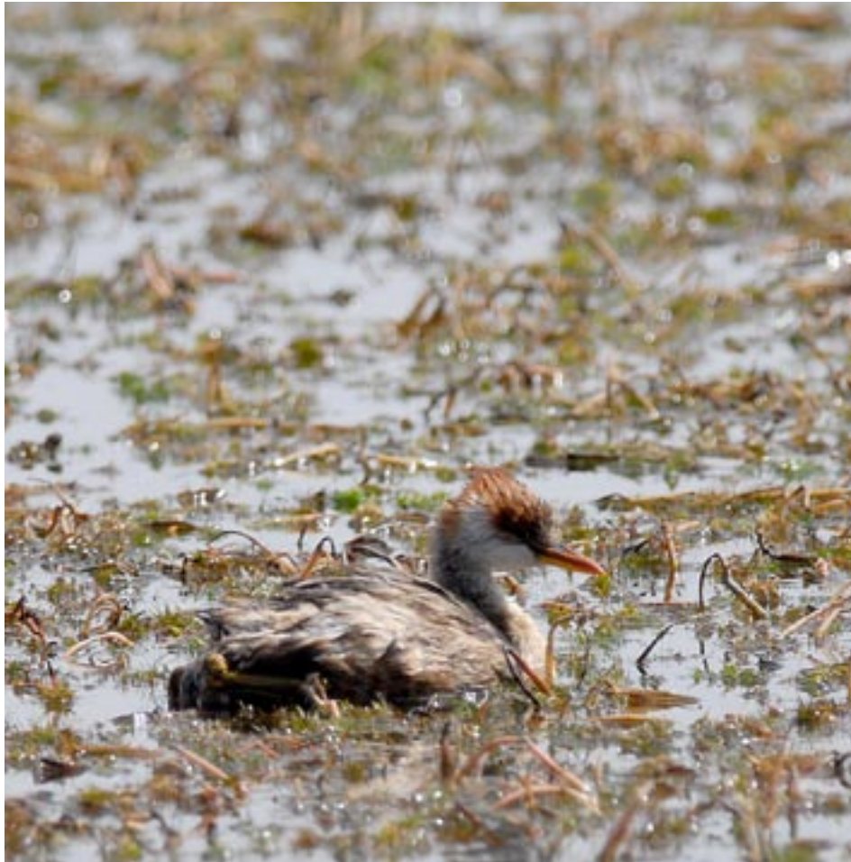
Titicaca Flightless Grebe