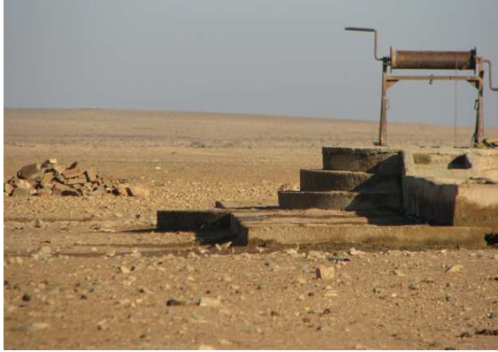
Ökenlokal (läckande brunn) söder om Guelmim

Öknens ca 35 km S Guelmim: En stor flack dalgång som odlas under våta årstiden. Vi hade mycket bra lärkskådning vid en läckande brunn i norra delen, väster om vägen. Dessutom en del rovfågel i området. Om man kör vidare några kilometer söderut kommer man till en till en wadi (Oued Bouissafene) söder om de odlade markerna. Vi skådade här väster om bron, hade en hel del fågel i de höga buskarna.