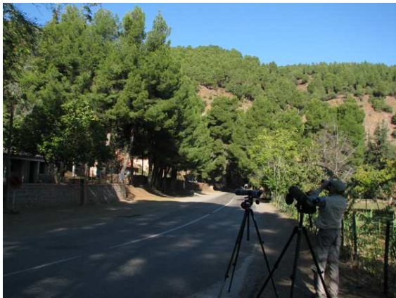
Lokal för atlasgröngöling vid Toufliath

Toufliath: Lokal för atlasgröngöling, by i Atlasbergen längs vägen mellan Ouarzazate och Marrakech. Vi hade två gröngölingar i lövträden vid "Poste de Toufliath" (rosa stenhus med gröna dörrar/fönster) och skogsvakarhuset strax S om byn i kanten av gammal barrskog. Dessutom bl.a. koboltmes, brandkronad kungsfågel och mindre korsnäbbar av atlasrasen i området. Det tar ca 3 timmar att köra från Ouarzazate till denna lokal.