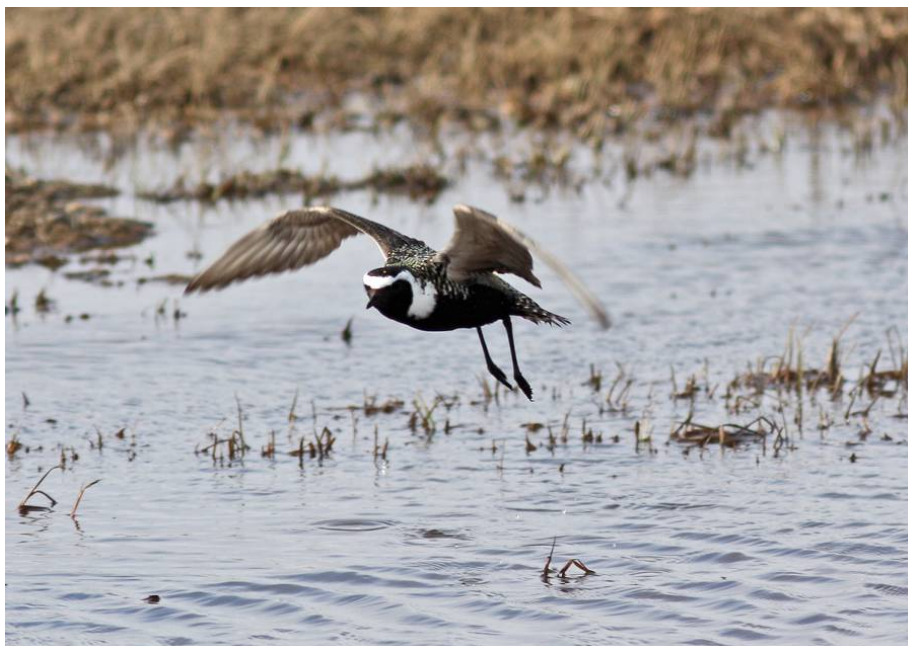
American Golden Plover

69. American Golden Plover (Amerikansk tundrapipare) Pluvialis dominica Allmän på tundran kring Barrow 12-15/6. Dessutom sammanlagt ca åtta ex. kring Nome 3-6/6 och ett ex. i Denali NP 11/6.