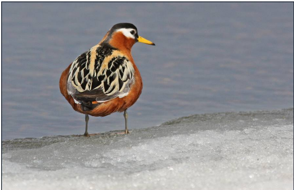
Red Phalarope

Under rekturen kunde vi konstatera att de vanligaste vadarna var Semipalmated Sandpiper , Pectoral Sandpiper , Red Phalarope , Red-necked Phalarope samt American Golden Plover som alla var mycket talrika. Sedan följde Dunlin och Long-billed Dowitcher . Fyra Black-bellied Plovers stod vid Freshwater Lake och längs Gaswell Road upptäcktes, ganska oväntat, ett par Buff-breasted Sandpipers , en art som vi trodde skulle bli ganska svår att finna. Tundra Swans och gäss (Ca 20 Greater White-fronted , ca tio Black Brant och fem Snow ) stod utposterade och av änder var Pintail och Long-tailed Duck vanligast. En Steller's Eider , hane, upptäcktes också. Vi kunde tyvärr konstatera att fjolårets lämmelår som väntat inte hade upprepats och av lämmelätare såg vi bara en Pomarine Jaeger . En Sabine's Gull förtjänar också att nämnas.