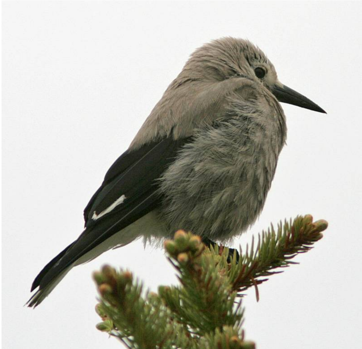
Clark's Nutcracker

Ett annat stopp längre ned gav ca fem Vaux's Swifts , en Red-tailed Hawk och en Band-tailed Pigeon innan vi definitivt var tvungna att lämna området med kurs mot Seattle.