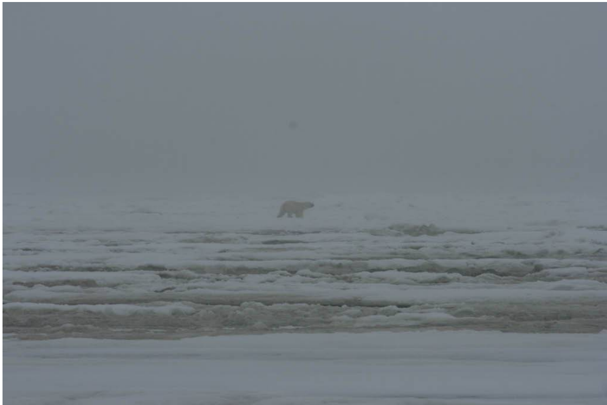
Polar Bear, foto: Urpo Könnömäki

När resten av gruppen fick höra om våra upplevelser lyckades vi snabbt arrangera så att alla som ville, ytterligare sju personer, kunde köras ut, först fem personer per omgående, sedan de sista två. Det roliga var att alla fick se en Polar Bear , men helt uppenbarligen var det fråga om tre olika individer!