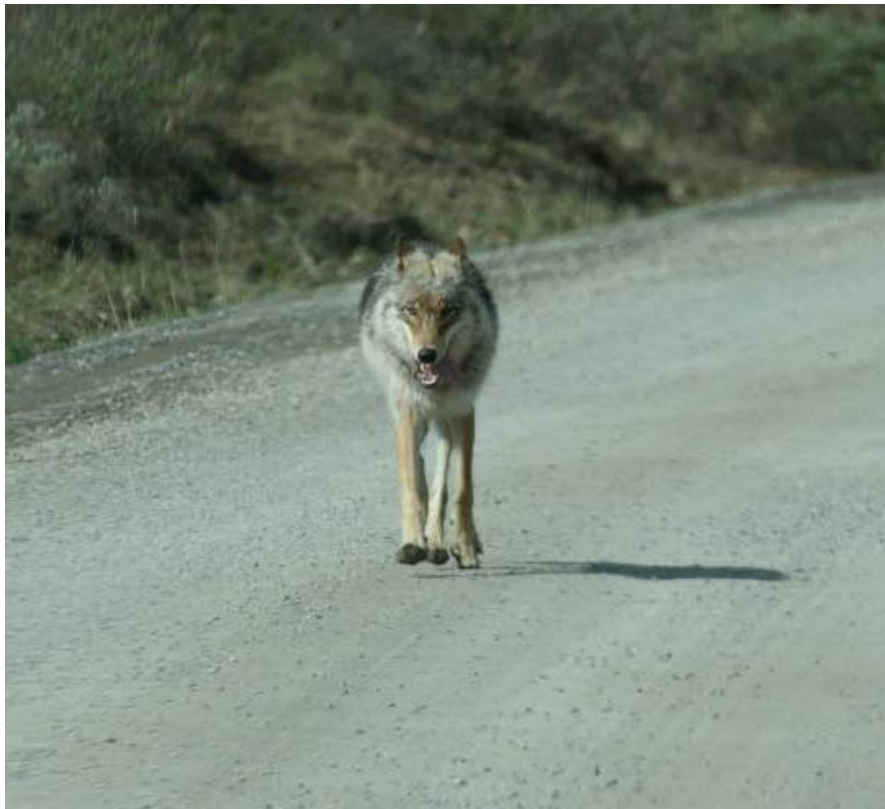
Gray Wolf

Totalt fyra ex. i Denali NP, samtliga i området mellan Polychrome Pass och Eielson Visitor Center – ett ex. som passerade bussen på ett par meters avstånd 8/6, ett ex. vid lyan på ca 150 meters håll samma dag, en hanne på vägen med renkalvhuvud i käften 9/6 samt en hona vid lyan samma dag. De två sistnämnda var försedda med radiosändare.