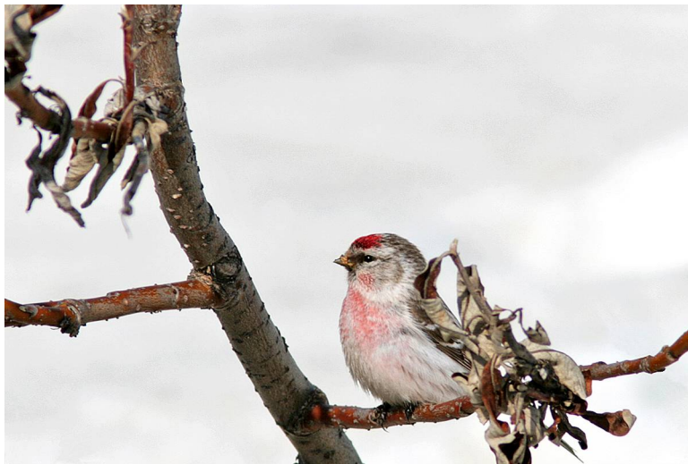
Hoary Redpoll

178. Hoary Redpoll (Snösiska) Carduelis hornemanni Tämligen allmän på tundran kring Nome och Barrow.