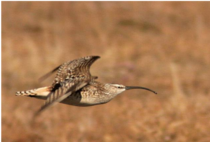
Bristle-thighed Curlew, foto: Magnus Renmyr

3-5 ex. vid Coffee Dome, Kougarok Rd, Nome, 4/6. Dessutom ett ex. över Aurora Inn (!), Nome, 2/6 och 4/6.