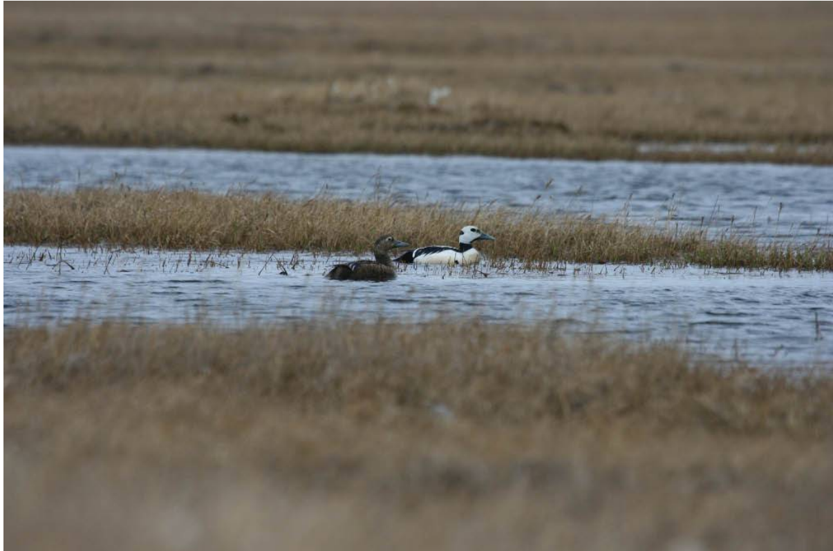
Steller's Eiders, foto: Urpo Könnömäki