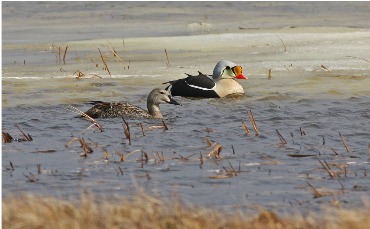
King Eiders

Återigen hade vi alla fyra ejderarterna, nu bl.a. 10-12 Spectacled och ca 20 King . En rejäl flock om 17 rastande Snow Geese samt ca 85 förbisträckande Black Brants var lite oväntade. Av nya vadare hittade vi 3-4 White-rumped Sandpipers , en Red-necked Stint samt ett par Killdeers . Vi hade nu också minst tre par Baird's samt fem par Buff-breasted Sandpipers . De sistnämnda lärde vi oss att lätt upptäcka eftersom de hade ett lustigt spel på marken – hannarna vinkade ivrigt med ena vingen, vars vita undersida då blinkade på långt håll. Flyktspellet var minst lika märkligt – paret flög rätt upp tillsammans och drev sedan baklänges i vinden. En annan art med ett minnesvärt spel var Pectoral Sandpiper , som blåste upp bröstet och flög runt med ett pumpande läte, som ett litet ånglok!