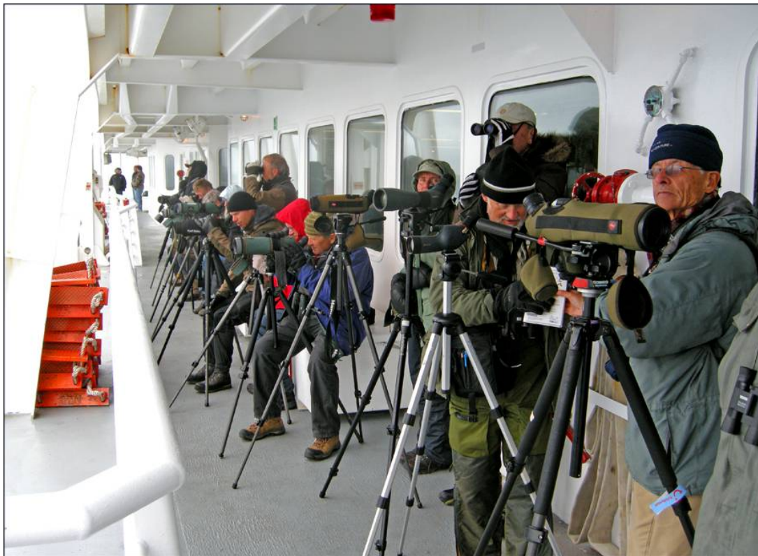
Havsfågelspan från M/S Kennicot