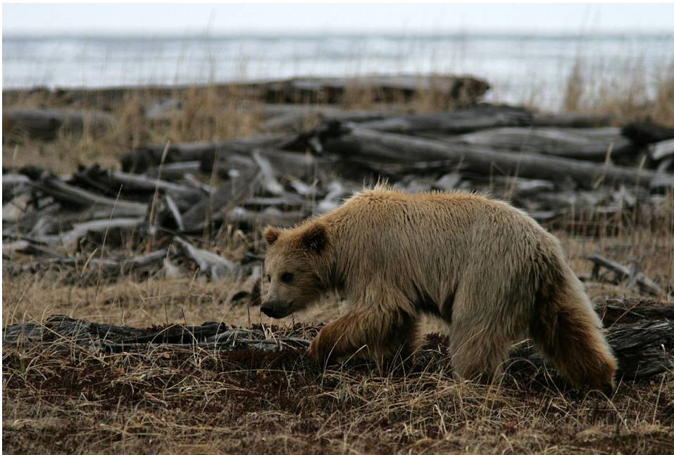
Brown Bear

De på Kenai anses av vissa auktoriteter vara av rasen middendorffi och de vid Nome och i Denali av rasen horribilis – ”Grizzly Bear”. Genom tiderna har dessa raser ömsom ansetts vara egna arter, ömsom enbart former av arten arctos .