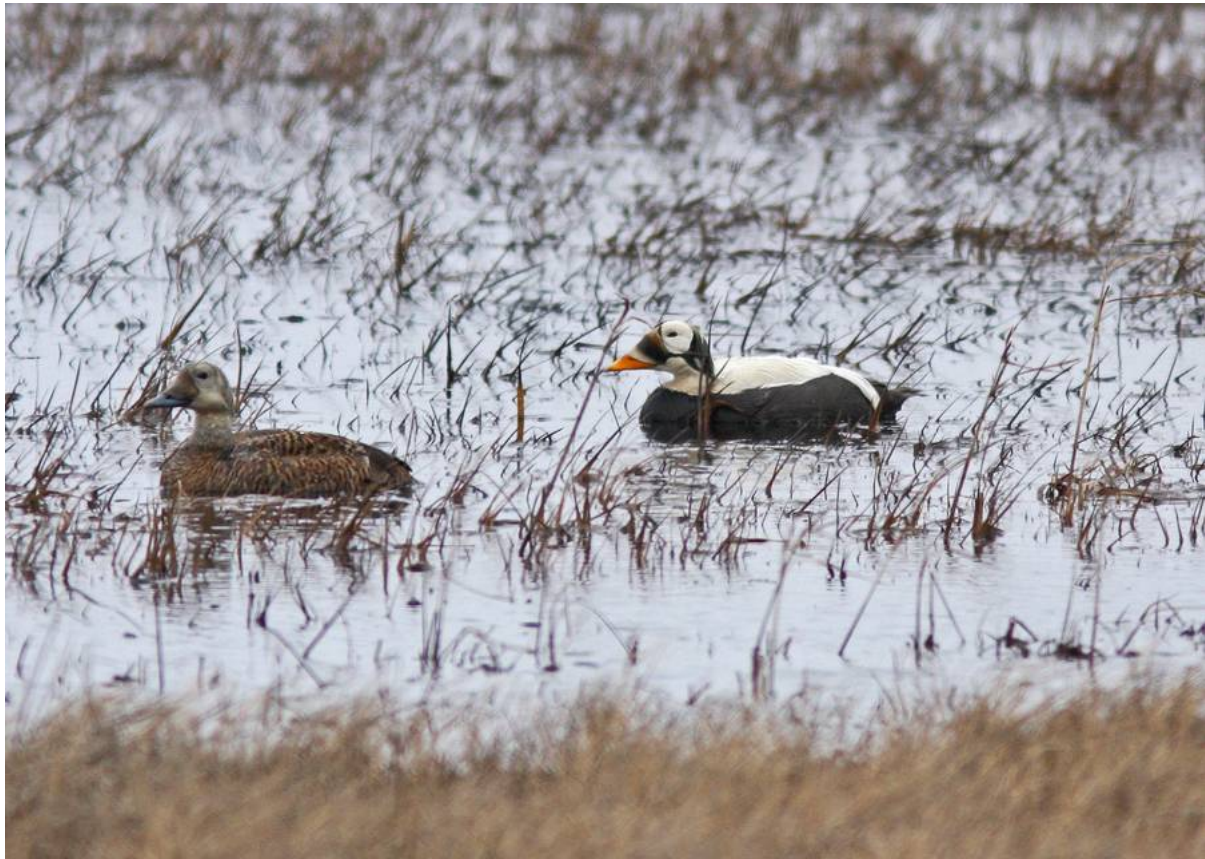
Spectacled Eiders

Dagens målarter var främst ejdarna och vi fick nu se världens samliga fyra arter av det släktet. Tre Spectacled på lite håll och sedan ett par i en pöl nära vägen väckte berättigat jubel och i övrigt noterade vi två par Steller's , ca 10 King och en Common , den senare i en vak i havsisen.