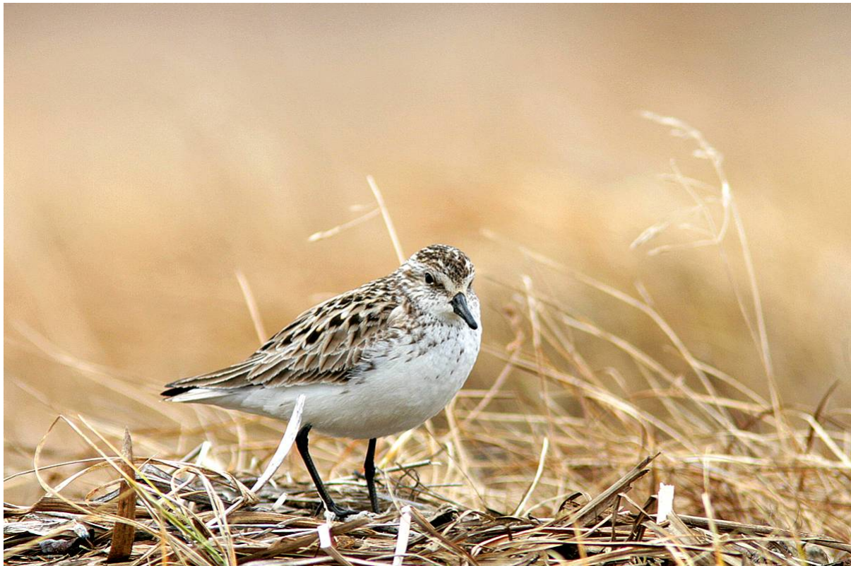
Semipalmated Sandpiper

Vi fick något av en sovmorgon eftersom flyget till Nome inte skulle avgå förrän kl. 11 på förmiddagen. Planet kom som vanligt iväg i tid, men när vi nalkades Nome meddelade piloten att vädret hastigt hade försämrats och att det första landningsförsöket hade avbrutits.