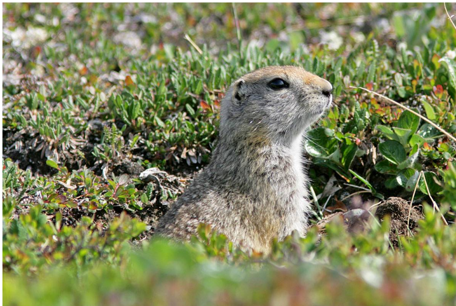
Arctic Ground Squirrel

Allmän på tundran kring Nome, i Denali NP och längs Denali Hwy.