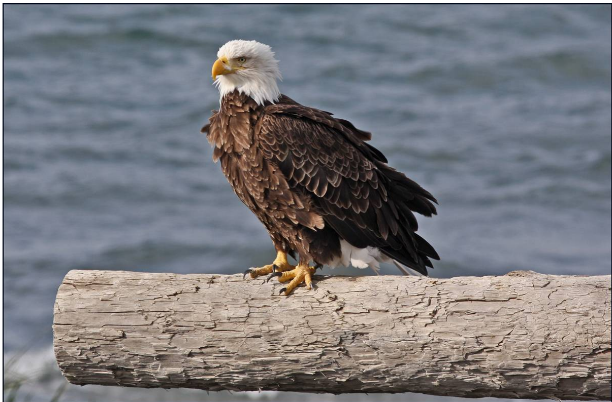
Bald Eagle, foto: Christer Brostam

Gruppen sammanstrålade på Arlanda kl 08.00 på morgonen och efter en lång flygning med byte och sex timmars väntan i Chicago anlände vi till Anchorage ca kl 22.00 LT, d.v.s nästan exakt 24 timmar senare. Våra två bokade 15-personers minibussar hämtades snabbt, och i den ljusa vårnatten satte vi kurs söderut mot Homer på Kenai-halvön. Till att börja med regnade det lätt, men detta väder upphörde efter några timmar. Eftersom såväl förarna som de flesta av deltagarna sovit hyfsat på planet gick resan förvånansvärt smärtfritt. Under första delen av den över 30 mil långa etappen for vi mellan höga snöklädda berg, men när det ljusnade var vi nere i ett lågland med granskog. Flera stora Mooses syntes i de väl röjda vägranterna.