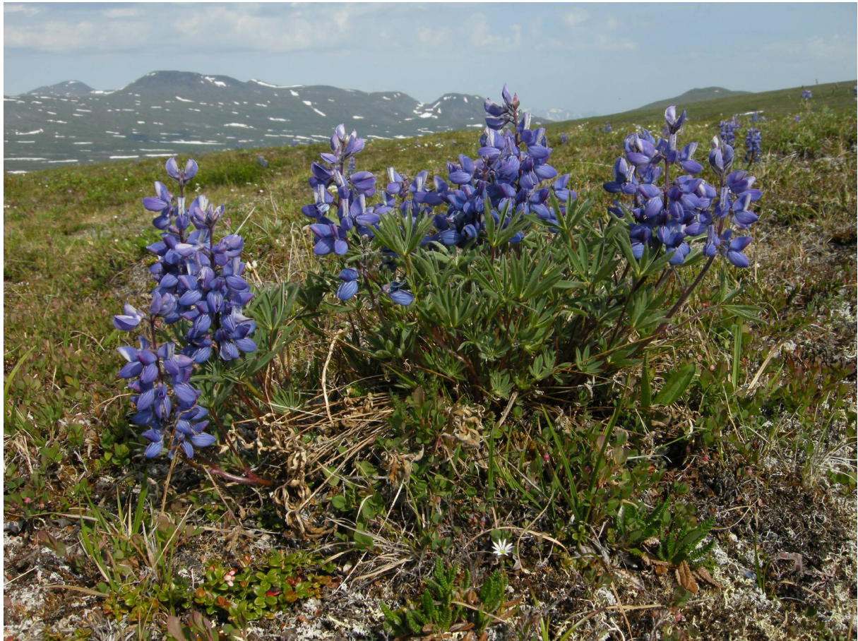
Denali, foto: Magnus von Krusenstierna

18/6 I Köpenhamn kl.13.15. Från Köpenhamn kl.14.20 På Stockholm/Arlanda kl.15.30.