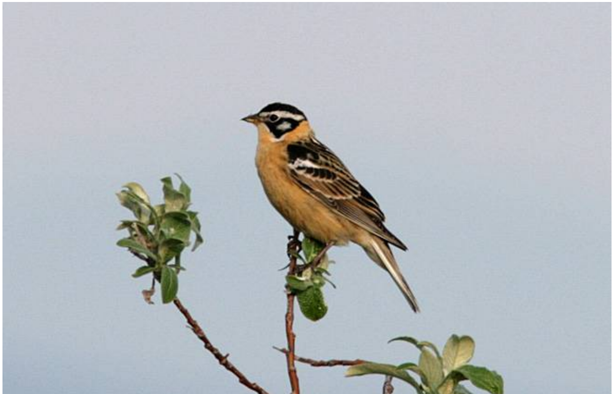
Smith's Longspur

På lodgen hade vi fått två stake-outs för Smith's Longspur och framkomna på plats vid det första stället dröjde det inte länge förrän Henrik W.s skarpa hörsel hade inregistrerat en sjungande Smith's . Snart hade vi lockat in den på närhåll och låtit kameror smattra och videokameror surra. I närheten hördes resan tredje Arctic Warbler – de började nu tydligen så sakta strömma in efter sin långa flyttning från Sydostasien.