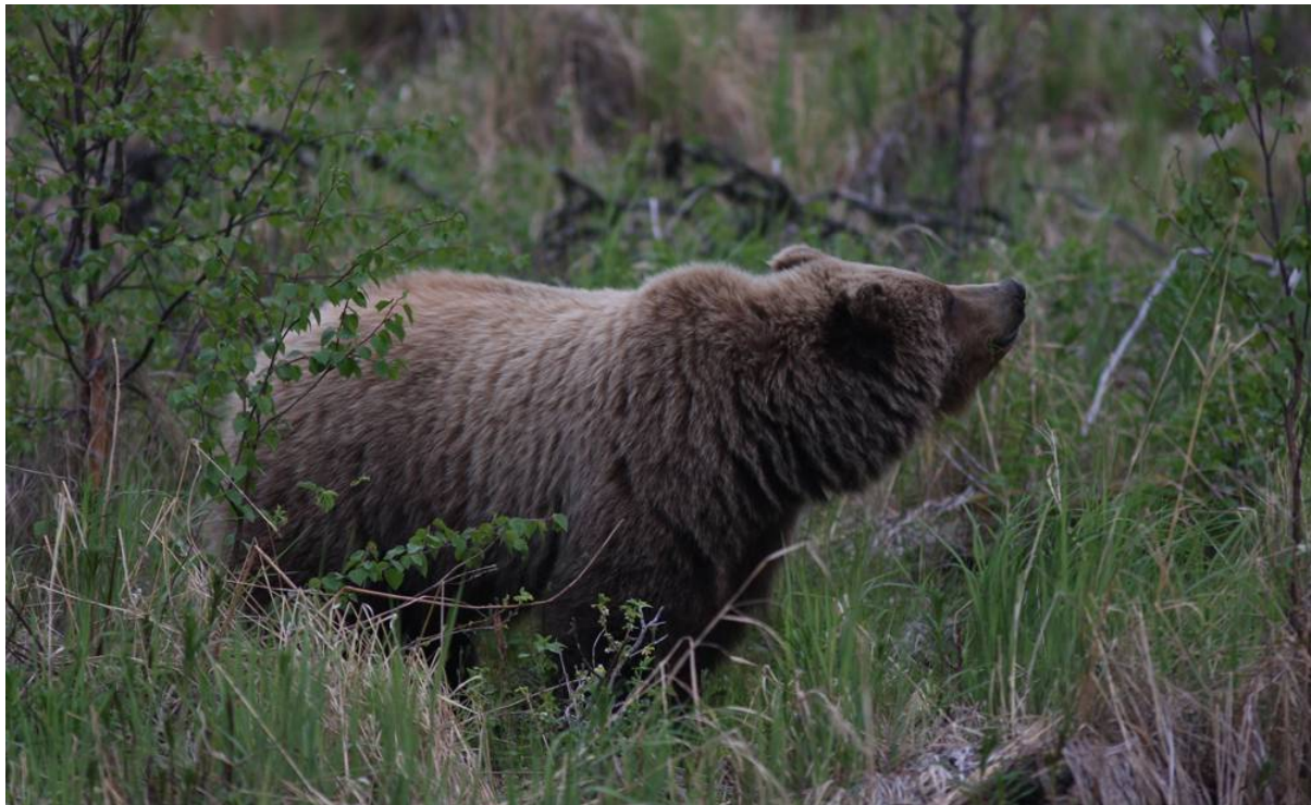
Brown Bear

Utanför Cooper Landing upptäcktes en stor Brown Bear , fridfullt betande alldeles intill vägen. Det blev många fina bilder för både stillbilds- och videofotograferna. Därefter började vi söka efter våra förbokade stugor. De låg inte riktigt där vi trodde, men hittades så småningom och visade sig vara väldigt stora och fina.