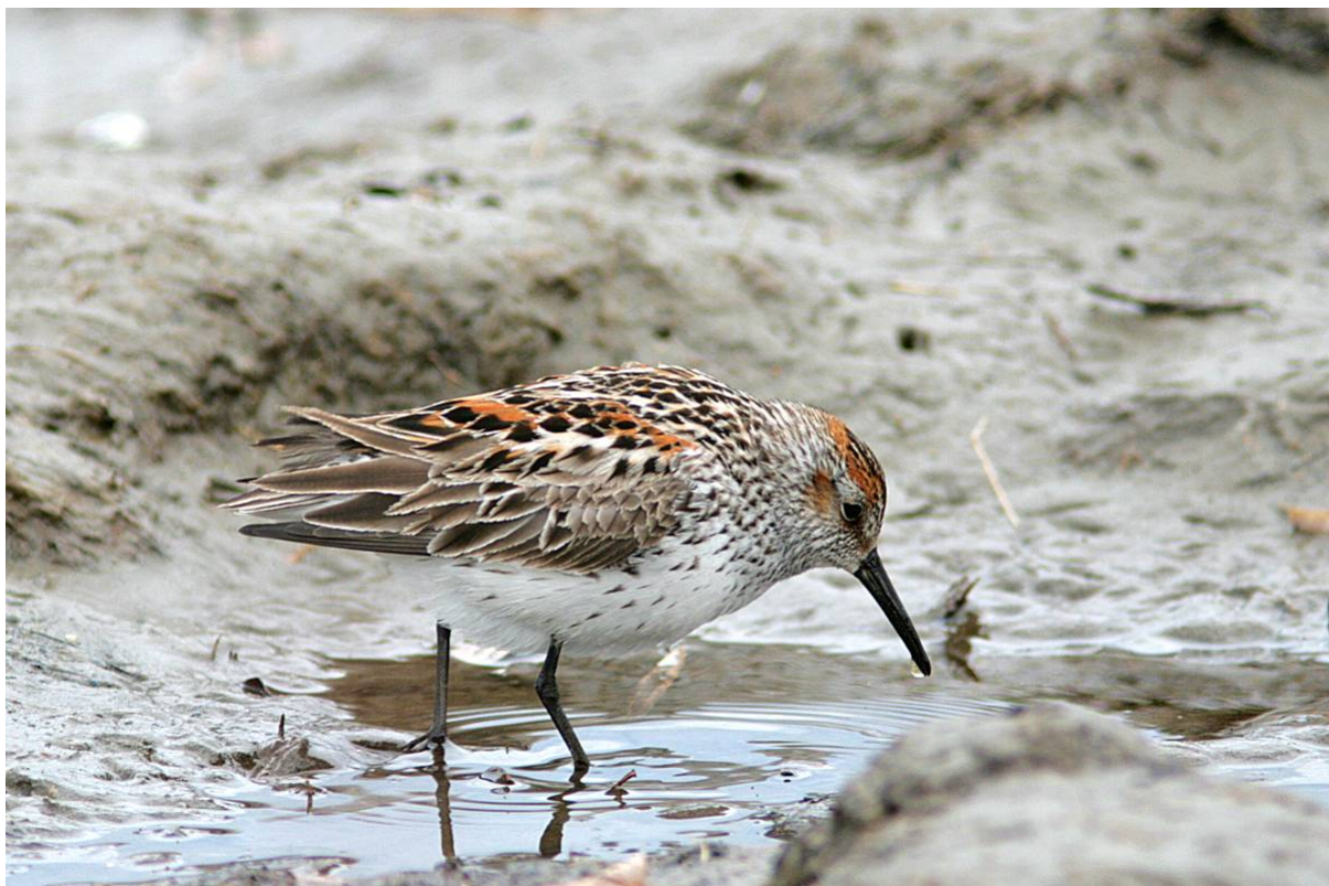
Western Sandpiper

Nära Teller stötte vi på hjordar om sammanlagt minst hundra muskoxen och här sjöng också en Bluethroat samt visade sig flera Eastern Yellow Wagtails , båda eurasiatiska arter som här når sin östgräns. Resans första Western Sandpiper höll till i ett litet surdråg.