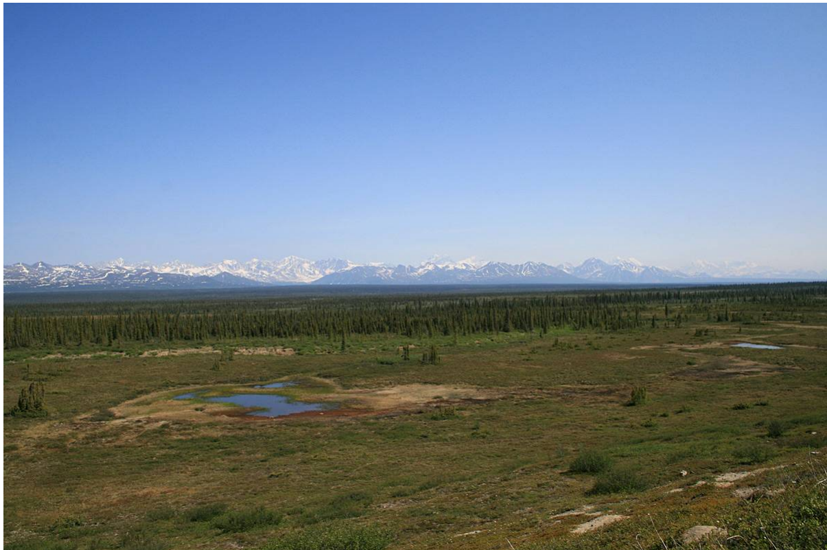
Denali Hwy, foto: Magnus Renmyr

låg fjällets topp och fick ännu fler Horned Larks , en överflygande American Pipit samt en bedövande utsikt och blomprakt som belöning.