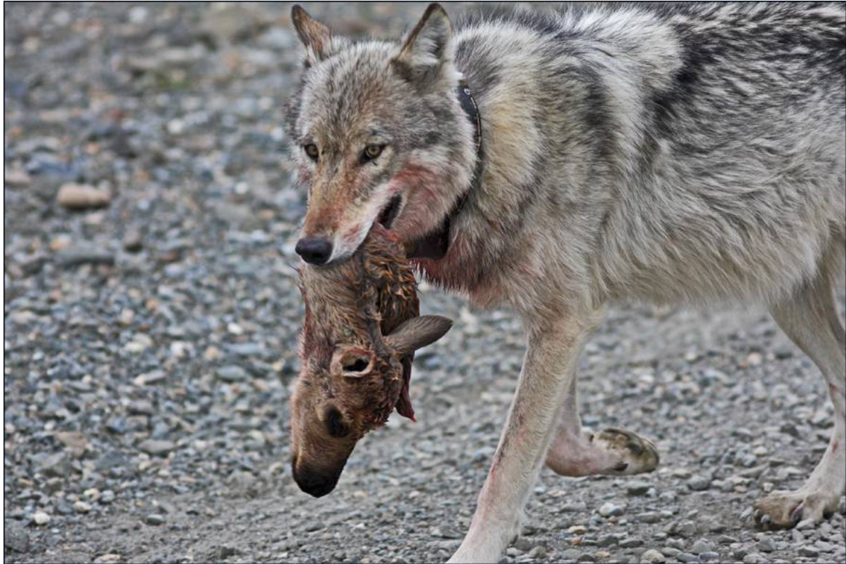
Gray Wolf

Av fåglar syntes under vägen bl.a. ca tio Golden Eagles , fem Northern Harriers och tre Merlins . Vid de små sjöarna nära Wonder Lake fanns en del vattenfågel – en flock om tio Greater White-fronted Geese , en Horned Grebe samt American Wigeons , Northern Shovelers , Green-winged Teals , Lesser Scaups , Long-tailed Ducks samt en Barrow's Goldeneye .