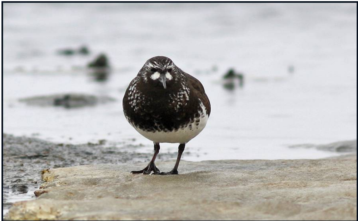
Black Turnstone

Denna dag var vädret åter sämre med ett, till en början med, ihållande duggregn. Vi beslöt att helt satsa på Council Road. Bortanför stenbrottet på Cape Nome såg vi en jagande Peregrine Falcon . Planen, långt innan denna observation, var att först raskt köra till en falkhäckning som Richard, vår huvudförare, kände till. När vi kom fram hit såg vi omgående och på nästan chockartat nära håll en mörk fågel ligga på ett gammalt korpbo. Det var en Gyr Falcon av mörk fas! I det rådande vädret hade det varit extra allvarligt att störa fågeln, så vi begav oss snabbt från platsen, tillbaka mot Safety Lagoon. Vid de gamla rostande ångloken, "Train to nowhere", gjorde vi ett första spanarstopp på kusttundran. Vädret höll nu på att snabbt förbättras. Här upptäckte vi ganska snart två par av Black Turnstone , en art som vi såg ytterligare minst tre par av senare under dagen.