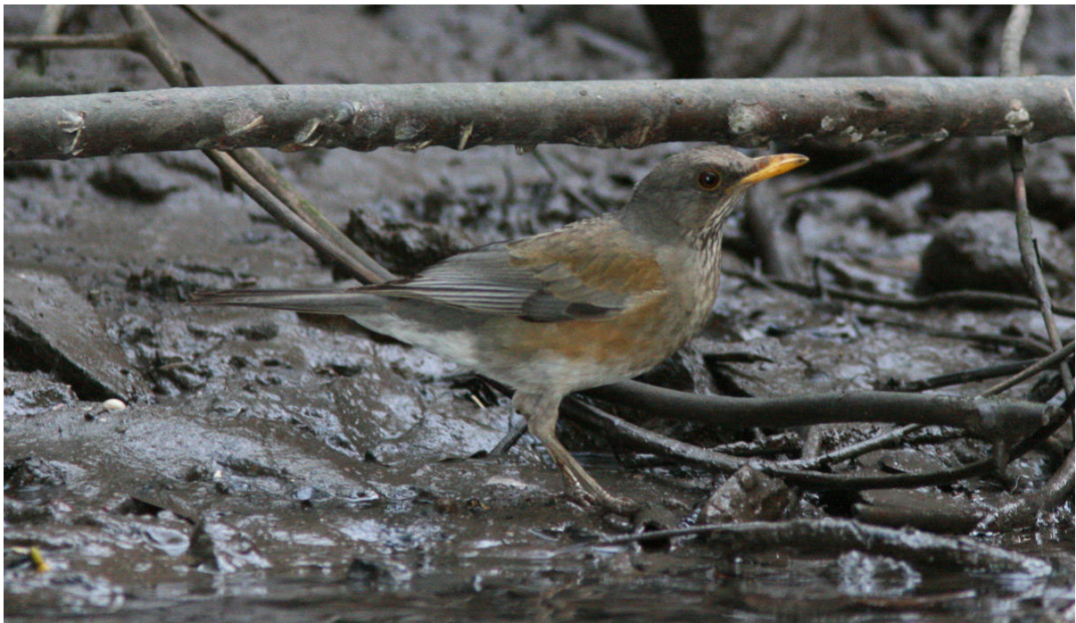
Grayson's Thrush häckar på ögruppen Tres Marias och tycks övervintra på fastlandet nära San Blas. Rasen anses av vissa utgöra en god art medan andra hävdar att det bara rör sig om en typiskt blek öform.

Happy Wren Sinaloa Wren Black-capped Gnatcatcher Russet Nightingale-Thrush Rufous-backed Thrush Grayson's Thrush Aztec Thrush Blue Mockingbird Slaty Vireo Dwarf Vireo Golden Vireo Red Warbler Godman's Euphonia Red-headed Tanager Orange-breasted Bunting Rufous-capped Brush-Finch Green-striped Brush-Finch Rusty-crowned Ground-Sparrow Cinnamon-rumped Seedeater Striped Sparrow Black-chested Sparrow