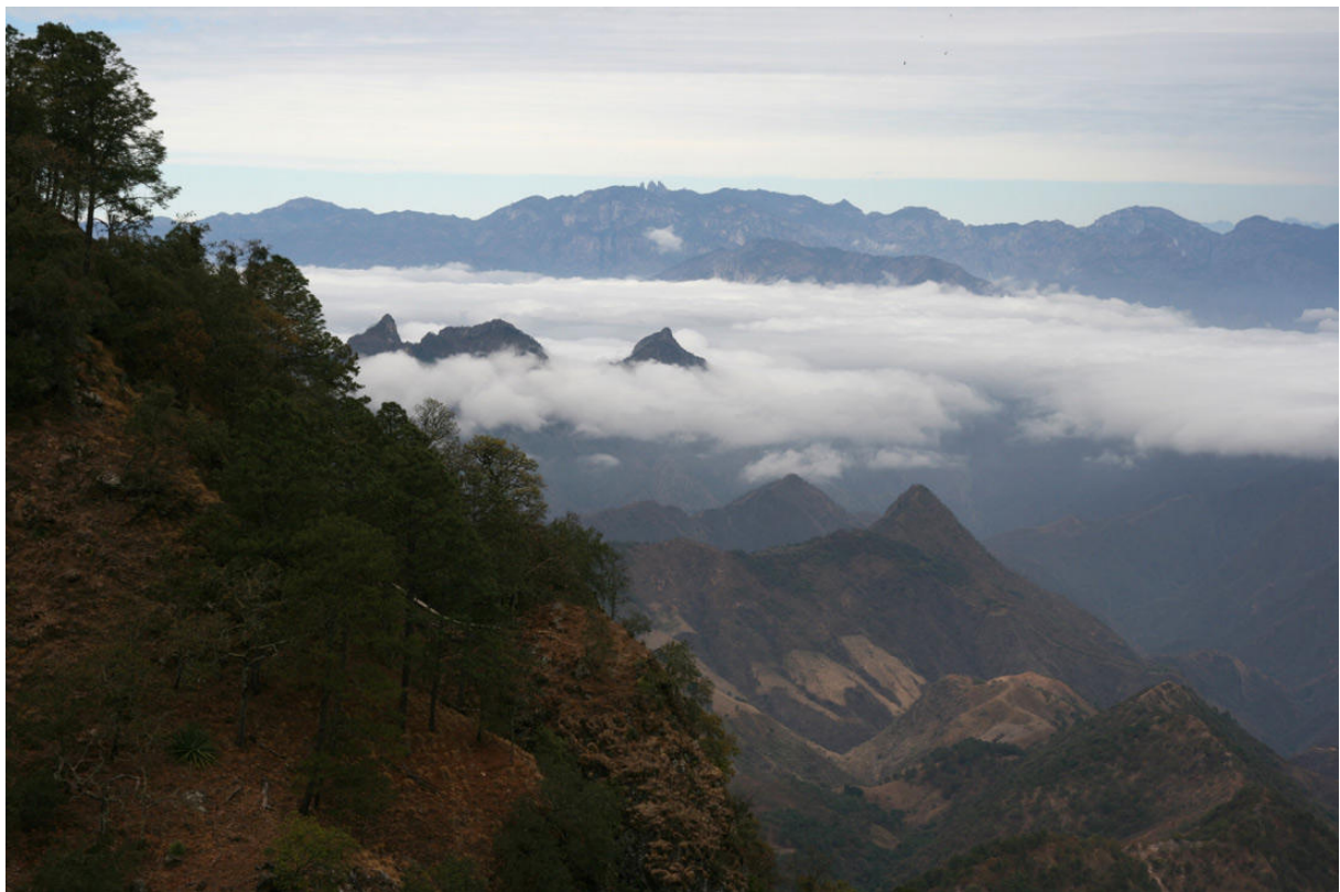
En av många spektakulära vyer utmed Durango Highway.

Det serverades frukost klockan sex även denna dag. Aktiviteten kändes genast något dämpad och det berodde säkerligen på att det var lite molnigt. Dalgångarna nedanför oss var helt fyllda med vackra vita moln! Vi betalade och tackade så mycket för matlagningen och vistelsen i Tufted Jay Preserve men gick först en runda i omgivningarna innan den långa färden mot Durango påbörjades. Alla fick nu se den läckra Red-headed Tanager samt bland andra Grace's och Olive Warblers. Bortanför Palmito försökte vi få kontakt med Eared Quetzal genom spaning och playback, men endast Mountain Trogons var i farten. En Canyon Wren spelades dock fram till samtligas förtjusning. Korta stopp gjordes här och var för att spana och njuta av de spektakulära vyerna; bl.a. kunde Steller's Jay och en adult kungsörn adderas till reslistan. Förutom några småläskiga möten med långa lastbilar gick allt problemfritt! När vi slutgiltigt hade passerat vattendelaren och kommit över på östsluttningen av Sierra Madre