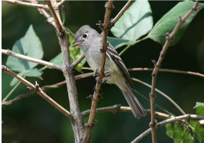
Hammond's Flycatcher vid Laguna La Maria.