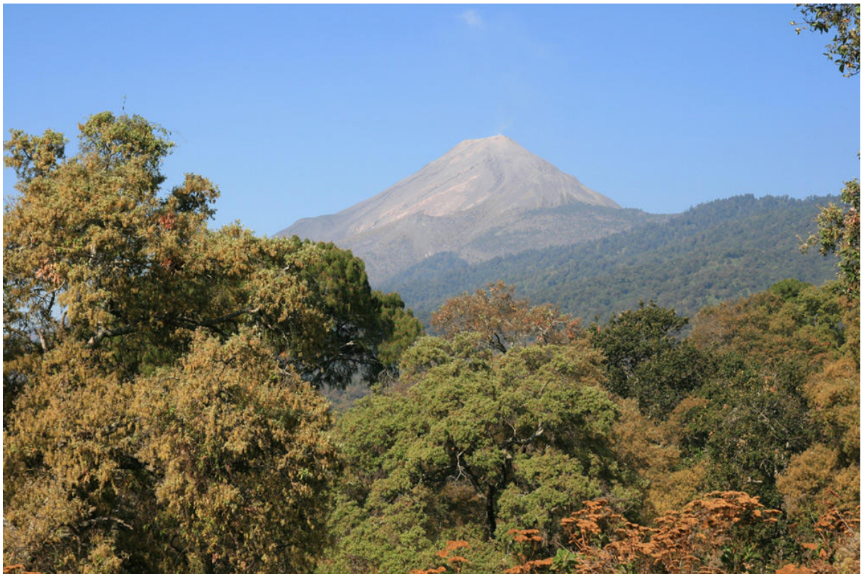
Volcán de Fuego från öster. Ingen större aktivitet märktes i år heller.