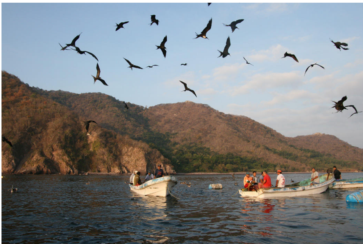
Havets fågelpirater tar för sig av morgonens fiskrens nära La Boquita.

Idag var det äntligen dags för båtturen på Stilla havet till klippön Piedra Blanca! Vi skulle bli mötta på hotellet vid 06.30 men tiden gick utan att någon dök upp. Tämligen besvärande, och jag hade inte tänkt på att ta med något telefonnummer eftersom allt fungerade prickfritt förra året. När klockan var 07.10 beslutade jag att vi skulle satsa på Playa de Oro Road istället. Det skulle säkert fixa sig med båtturen till imorgon. Just när alla hade hämtat tubkikare och/eller ställt om sig för en annan typ av skådning kom en kille körande i en minivan. Det var "vår man" som hade väntat på oss vid en viss affär som aldrig hade varit på tal och som jag inte ens visste var den låg! Dock, slutet gott allting gott.