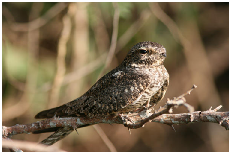
Lesser Nighthawk vid Manzanillo Airport.

omger den. Under kvällen såg vi Little Blue och Tricolored Herons, Yellow-crowned Night-Heron, gott om White Ibis, Roseate Spoonbill, Snail Kite, Crane och Cooper's Hawks, stenfalk, Purple Gallinule, Sora, Lesser Nighthawk på närhåll, Ringed Kingfisher, Golden-cheeked Woodpecker, White-throated Flycatcher, Rufous-backed Thrush, Ruddy-breasted Seedeater och Orchard Oriole. Samuel såg ensam en Gray Catbird, en extremt sällsynt gäst i västra Mexiko men helt omisskännlig. I skymningen kom myggen igång rejält och i norr svärmade en jätteflock med minst