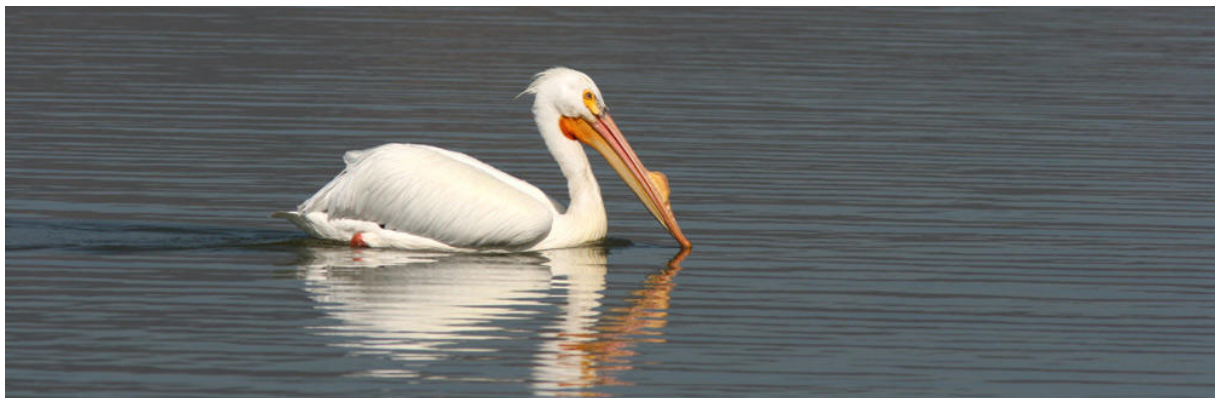
American White Pelican vid Laguna Zapotlan.