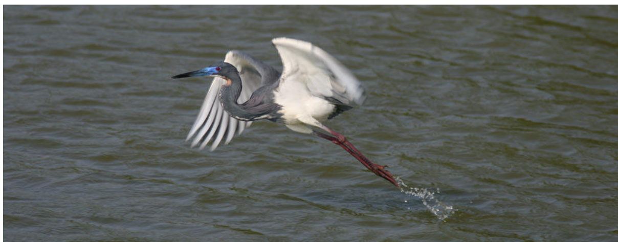
Ovanligt färgad Tricolored Heron med blå näbb!