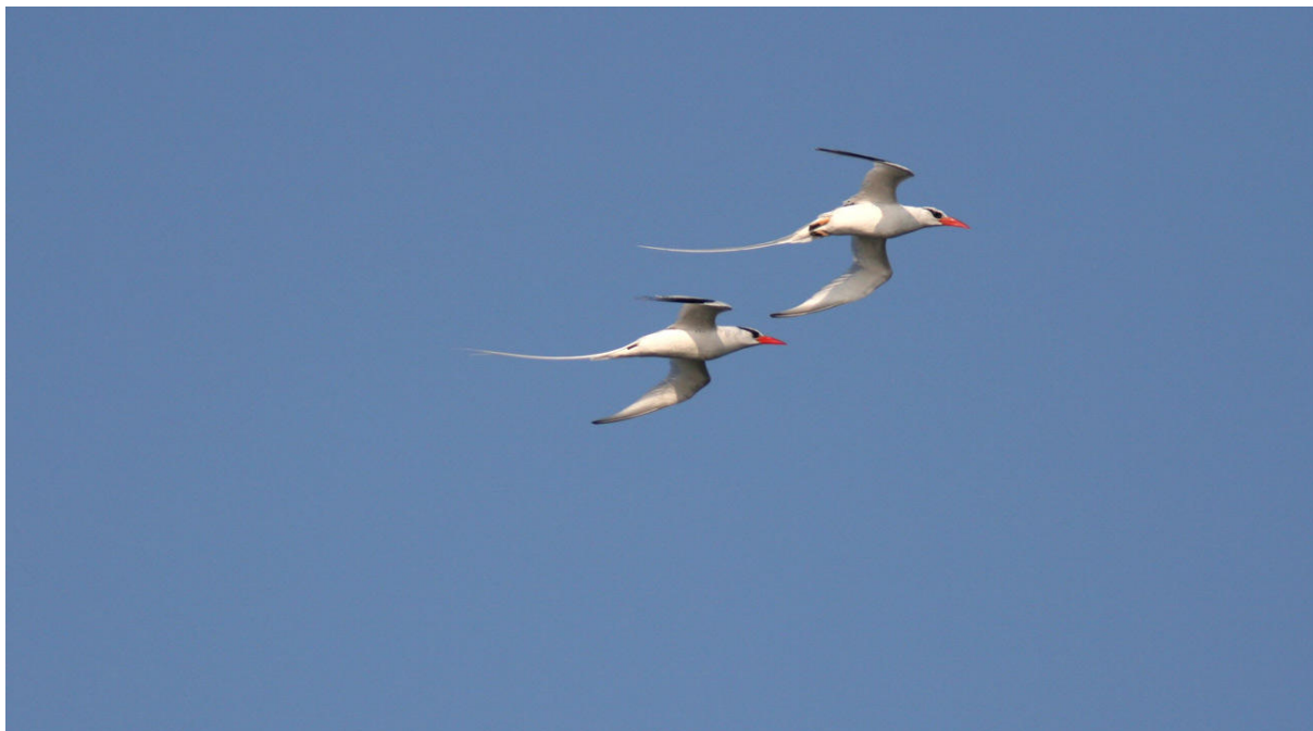
Ett riktigt lucky shot! Red-billed Tropicbirds i parflykt.