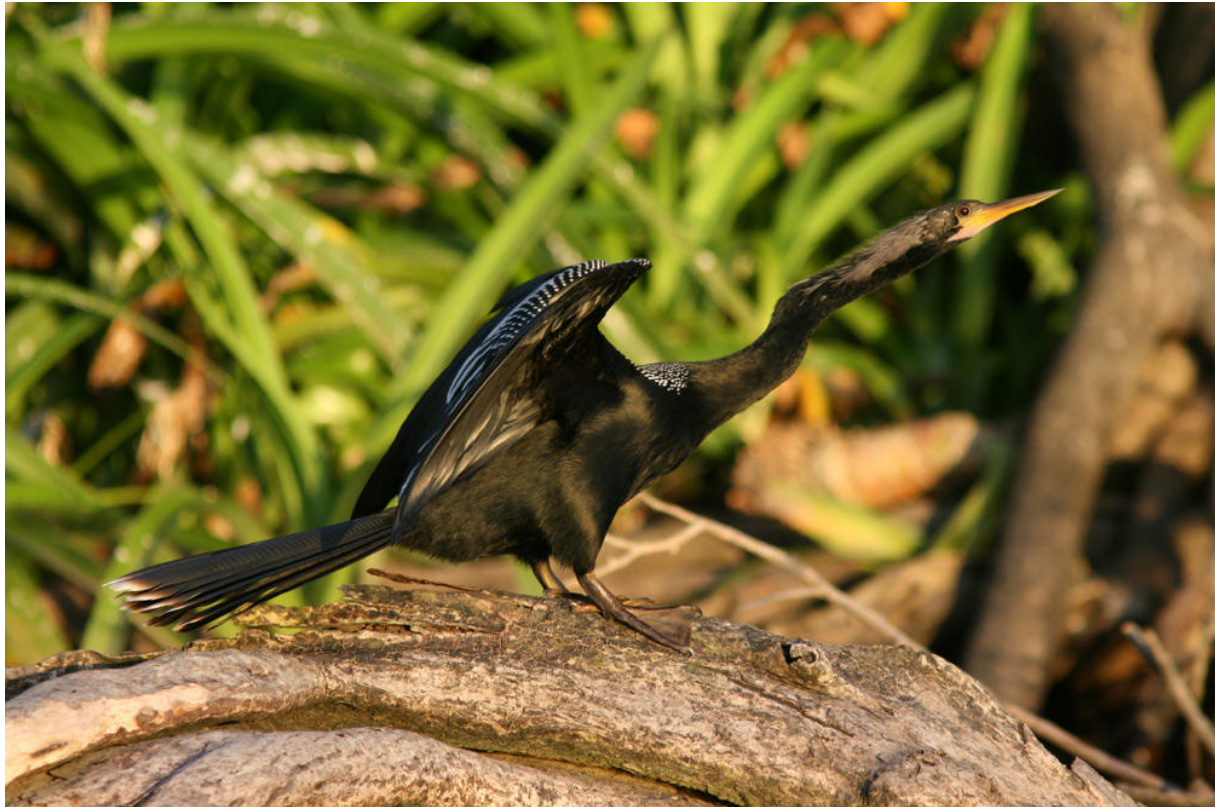
Flera Anhingas sågs mycket fint utmed Río Tovara.