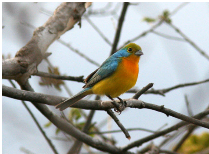
Den superläckra Orange-breasted Bunting!