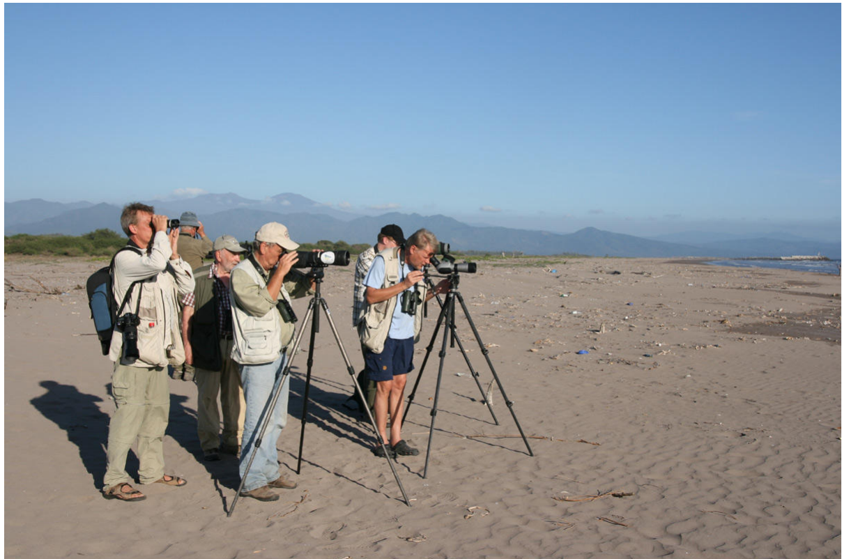
Hela gruppen aktivt spanande från Peso Island, San Blas.

Ingen var akut hungrig denna kväll så vi for till en Mini Super och inhandlade lite individuell kvällsmat och frukost. I brist på Oxxo fanns det som tur var en kaffekokare på vårt rum för alla coffee addicts. Lång artlista!