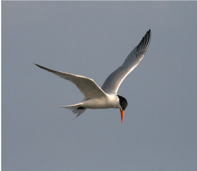
Royal Tern vid Manzanillos oljekraftverk.

Short-billed och Long-billed Dowitchers tillsammans (vilket definitivt inte tillhör det vanligaste!) samt Mangrove Swallow fick särskild uppmärksamhet. Här efter körde vi igenom Manzanillos ruffiga centrum för att ta oss till varmvattenutsläppet till stadens stora oljekraftverk. Mängder med fåglar kunde studeras och fotograferas på nära håll även om det inte erbjöds särskilt många nyheter.