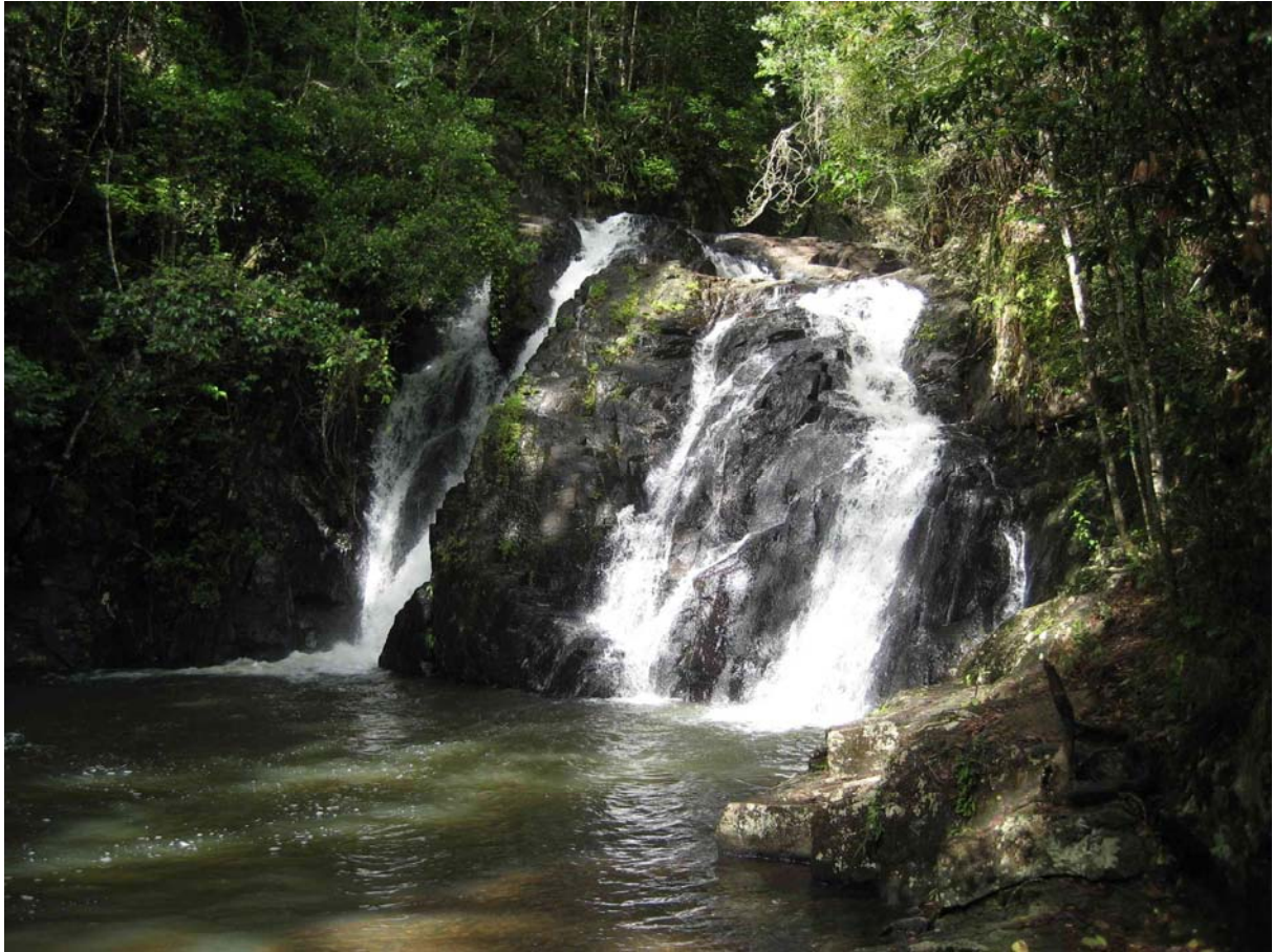
Vattenfall vid The Crater