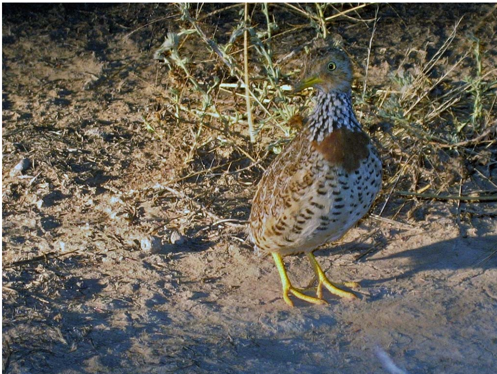
Och där satt den!