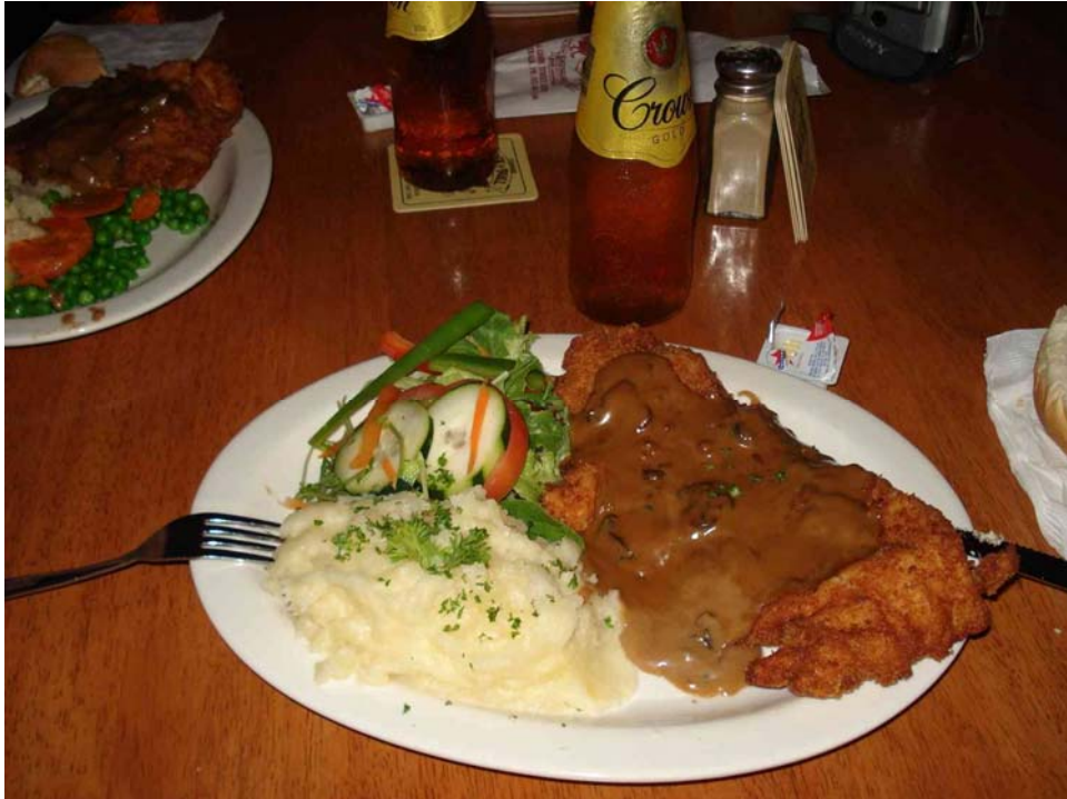
Hellre äta krokodil än tvärtom...

Vädret hade vi verkligen maximal tur med. Veckan innan vi anlände var det ca 40 grader i Adelaide och ett riktigt busväder med cyklon och översvämningar i Cairns. Vi hade dock behagliga 20 till 30 grader i söder och något varmare i norr men knappast något regn alls. När vi lämnade Australien bröt helvetet ut med 47 grader i söder följt av ett antal bränder och störtregn med nya översvämningar i norr.