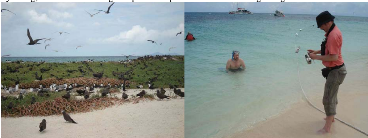
Michaelmas Key bjöd på fina fågelupplevelser och snorkling

Middagen intogs på en finare restaurang där vi käkade panerad krokodil(påminde lite om kyckling). Sedan var det dags att packa ihop våra saker inför morgondagens hemresa.