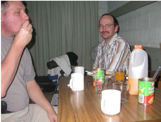
Måltid på ett hotellrum

Måltidernas innehåll varierade starkt med bl.a. hamburgare, sea food, känguru, krokodil och sedvanliga vita bönor på burk.