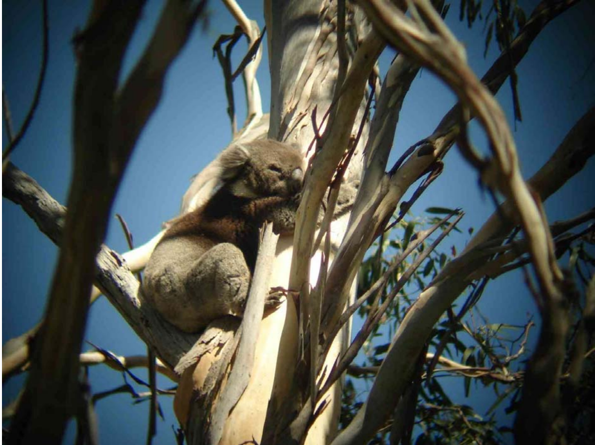
Trädkramare i Belair NP.

Eftersom vi hade svarat ärligt på inreseformuläret om att vi hade med värden för över 1000 ausdollar så blev vi noggrant utfrågade och kollade i tullen. Men när den pärsen väl var avklarad kunde vi äntligen hämta ut vår förbeställda bil, en Toyota Camry hos Thrifty. Sedan bar det snabbt av till Belair NP som ligger i östra utkanterna av Adelaide där vi skådade några timmar och bla såg Koala. Därefter körde vi söderut till Victor harbour där vi käkade en hamburgare till lunch och hängde in några arter till. Sedan skådade vi oss fram till Pinnaroo där vi tankade upp bilen och checkade in på vårt förbokade rum på Pinnaroo motell. Somnade in ganska lätt vid 22-tiden. Körsträcka idag blev ca 450 km.