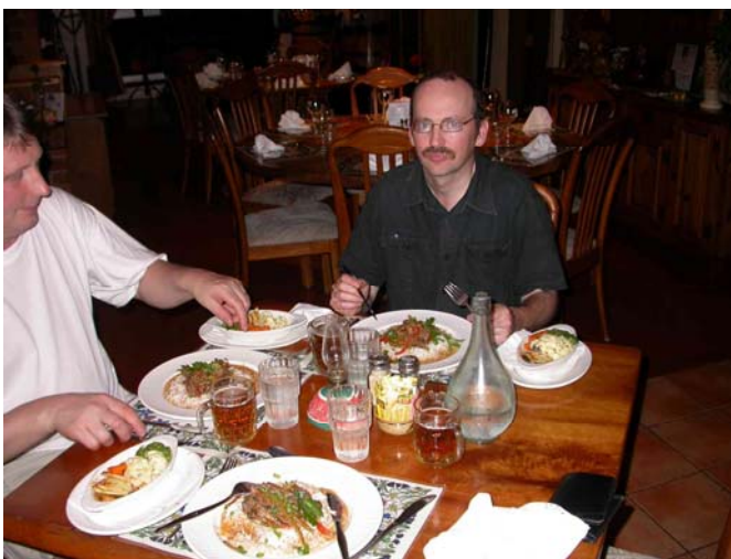
Kängurustroganoff fick tummen upp