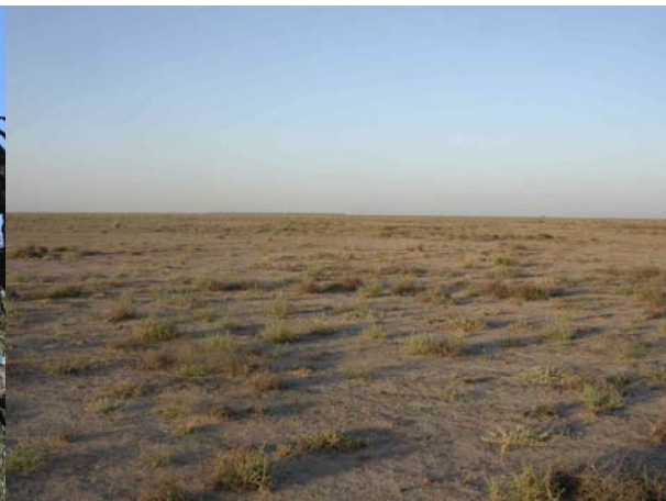
Hemmaplan för Plains-wanderer