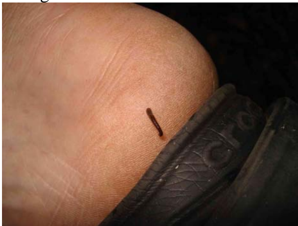
The Igel has landed...

Några "farliga" djur såg vi inte heller förutom ett par pytonormar och lite blodiglar.