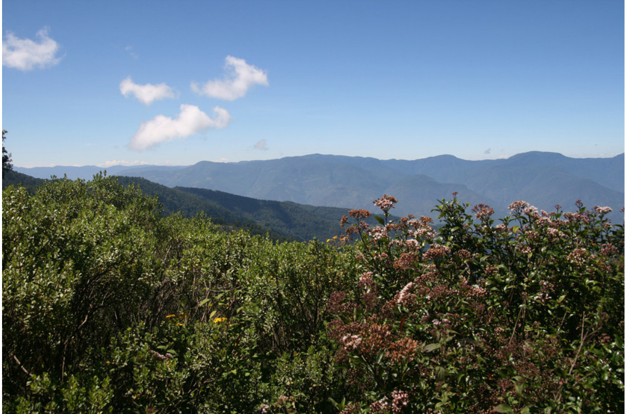
Utsikt från El Mirador, Oaxaca.

men lyckade inte klämma ur sig det på ett begripligt sätt. Under resten av morgonen utforskade vi därför en sidoväg som hade rätt så gott om fågel och fjärilar, däribland Short-tailed och Gray Hawks, Orchard Oriole, Yellow-throated Vireo, Long-billed Gnatwren (hörd) plus ett par Mexican Black Agoutis. Vi åkte sedermera in till Valle Nacional för lunch och siesta. Under tiden funderade jag på olika lösningar för att göra det bästa av situationen. När vi sedan gav oss ut för eftermiddagsskådning såg vi alla en stor skylt över vägen det det klart och tydligt stod OAXACA och en pil till vänster. Aningen pinsamt men ändå en jättestor lättnad! Således åkte vi en mil upp för den riktiga vägen och skådade oss ner. Fåglarna var måttligt samarbetsvilliga, men vi kunde bland annat addera White-tailed Hawk, Golden-hooded och Crimson-collared Tanagers, Red-legged och Green (SH) Honeycreepers samt Black-cowled (KLN) och Bullock's Orioles till reselistan. Trevlig middag och rent av en Magnum för SH avslutade denna något märkliga dag.