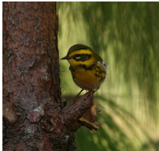
Townsend's Warbler, La Joya.

Mitt inne i Xalapa ligger den utslocknade vulkanen Macuiltépetl, och dit begav vi oss idag. Det visade sig vara både bekvämt och relativt fågelrikt. Morgonjoggare sprang regelbundet slalom mellan oss trots att vi försökte hålla oss till endera kanten av vägen medan vi spanade in bland grönskan. Bland de arter vi kunde studera väl kan nämnas Wedge-tailed Sabrewing, Azure-crowned Hummingbird, Green Jay, Blue Mockingbird (helt grå ungfågel), MacGillivray's Warbler, Rusty Sparrow och Altamira Oriole. Innan klockan slog halv elva var vi på väg ut från staden för en längre transport österut till Catemaco vid Los Tuxtlas. Efter en god lunch i närheten av Las Barrancas