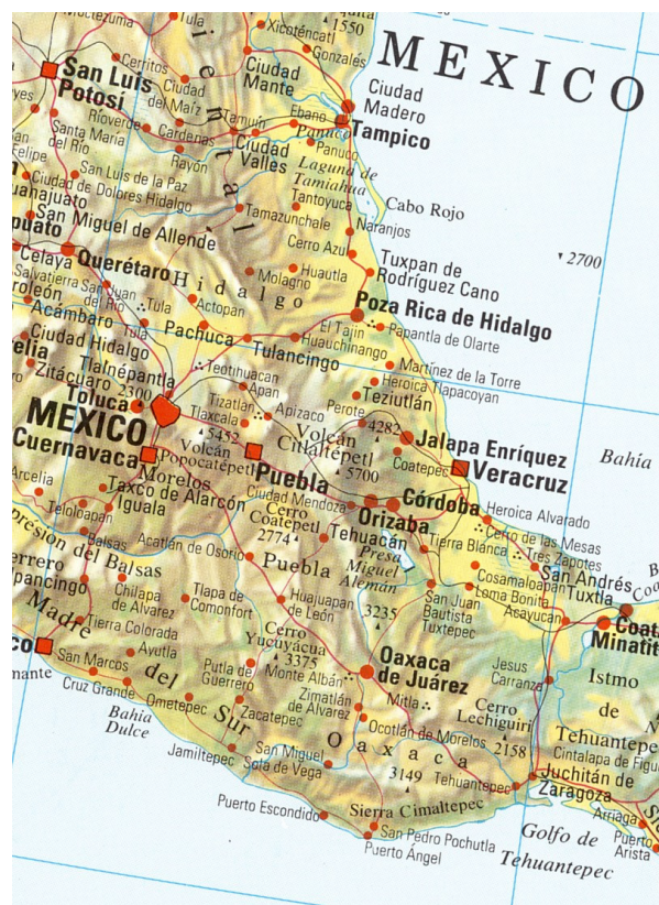
Översiktskarta. De flesta större orter utefter resrutten finns med. Cardel ligger strax nordväst om Veracruz och Valle Nacional en bit sydväst om (San Juan Bautista) Tuxtepec. Xalapa heter här Jalapa Enriquez

Ett säregt ökenlandskap utkastat i en stor jordbruksbygd på den Mexikanska högplatån nära Perote. Här finns ett antal arter typiska halvökenarter att beskåda, däribland Curve-billed Thrasher, Black-chinned och Rufous-crowned Sparrows, Bewick's Wren samt Scott's Oriole.