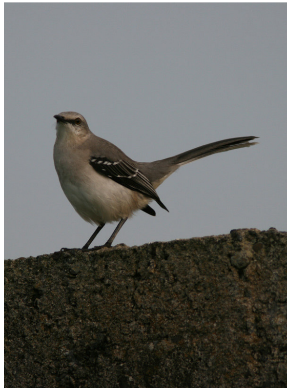
Fork-tailed Flycatcher och Tropical Mockingbird vid Las Barrancas.