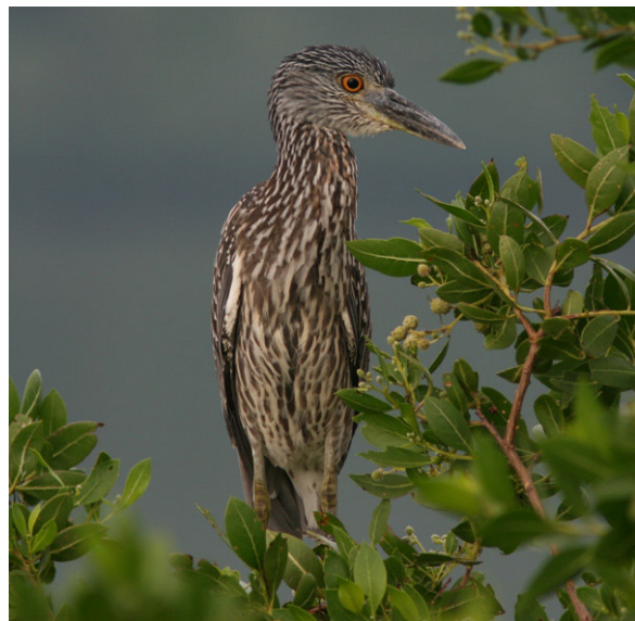
Yellow-crowned Night-Heron, La Mancha.