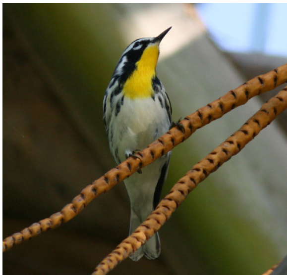
Yellow-throated Warbler, La Mancha.

Willet, Black Tern och Amazon Kingfisher. Vi var tillbaka på taket i Cardel innan elva, men tyvärr blev detta en mellandag med ”endast” 41 833 rovfåglar. Minst 2 200 hornpelikaner drog förbi i imponerande flockar, men de flesta av de prärievråkar som sträckte kom senare på kvällen när vi istället tagit oss till La Mancha. Vid La Mancha var det dock fint drag med massor av Magnificent Frigatebirds, kentska tärnor, kungstärnor och sotvingade måsar. En ung bredstjärtad labb rörde överraskande till bland alla vitfåglar, dock utan synbar framgång. En Yellow-throated Warbler sågs utomordentligt fint, Masked Tityra var ny för resan och både sparvfalk och pilgrimsfalk ställde upp för fotografering. Sammantaget blev detta ytterligare en mycket trevlig dag med fina fågel- och naturupplevelser!