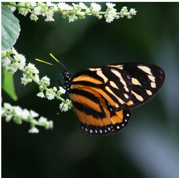
Tiger Mimic-Queen, Quiahuixtlán.