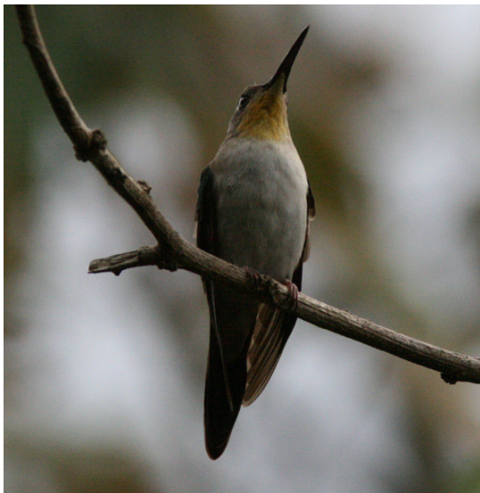
Wedge-tailed Sabrewing, Macuiltépetl.