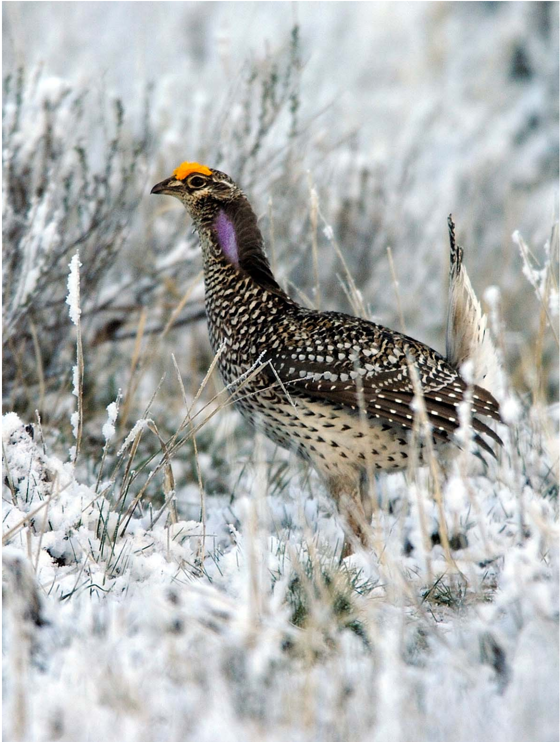
Sharp-tailed Grouse, Hayden, Rocky Mountain