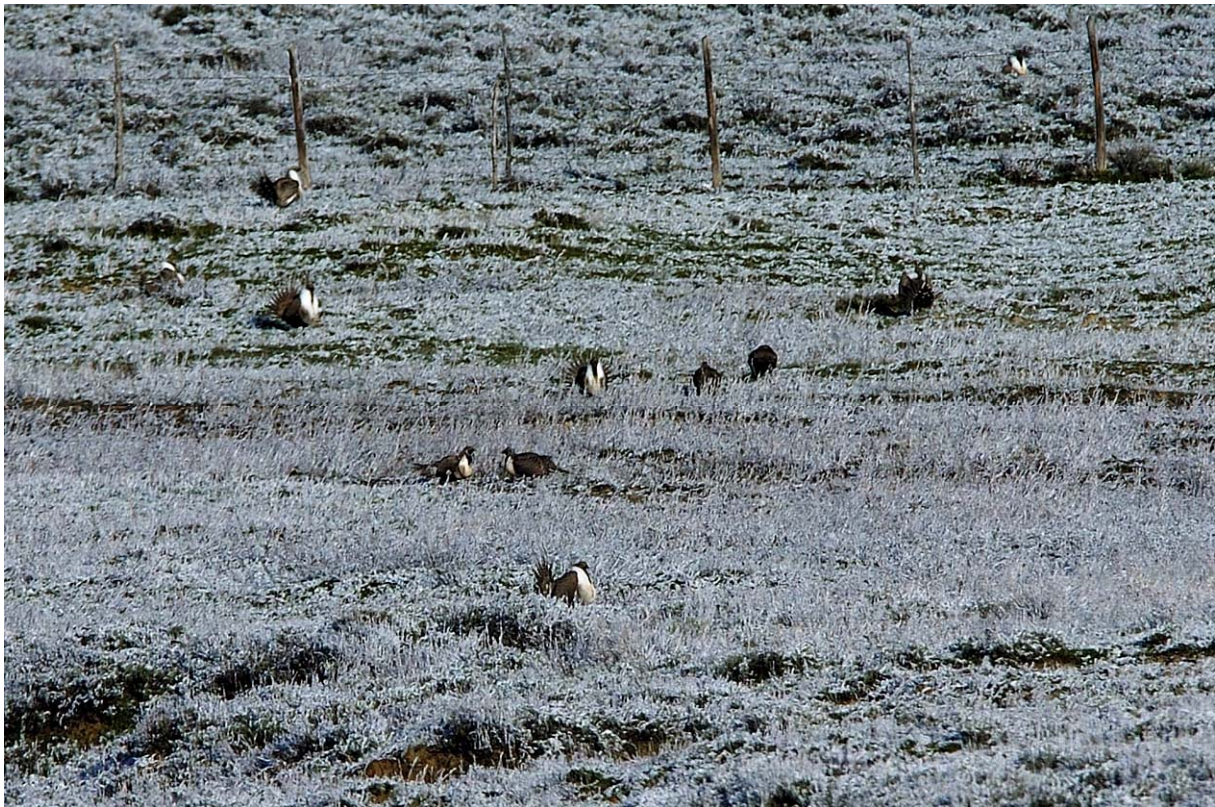
Greater Sage Grouse