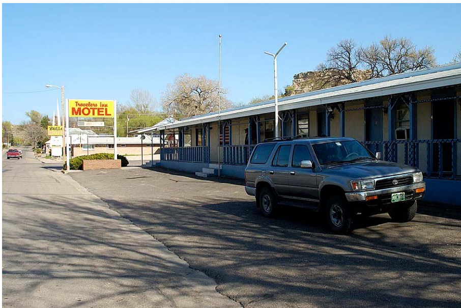
Motel Traveller's Inn, Wray

Övernattningarna skedde på motel längs vår rutt, där första natten var förbokad från Sverige.