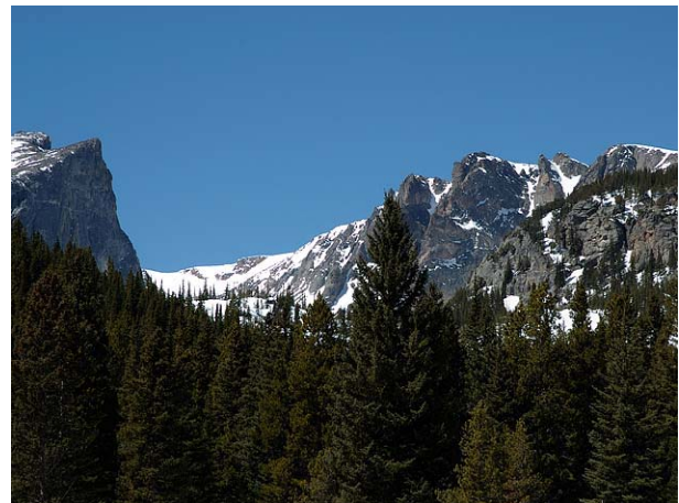
Bear Lake, Rocky Mountain NP