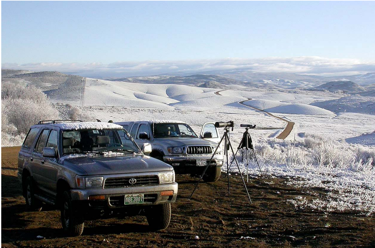
Hayden, Rocky Mountain