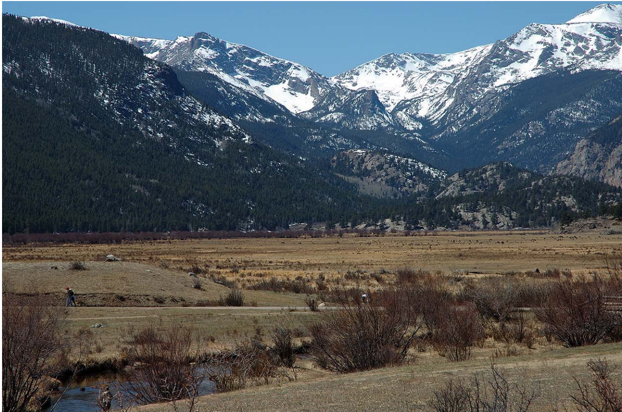
Estes Park, Rocky Mountain

Vädrets makter var verkligen med oss denna vecka, då det dagarna innan vår ankomst samt strax efter vår hemfärd, var betydande snöoväder. Under vår vistelse var solen med oss i stort sett hela tiden. Endast en eftermiddag och kväll drabbades vi av ett mindre snöoväder. Detta störde dock inte resan, då det skedde under transporten till Steamboat Springs.