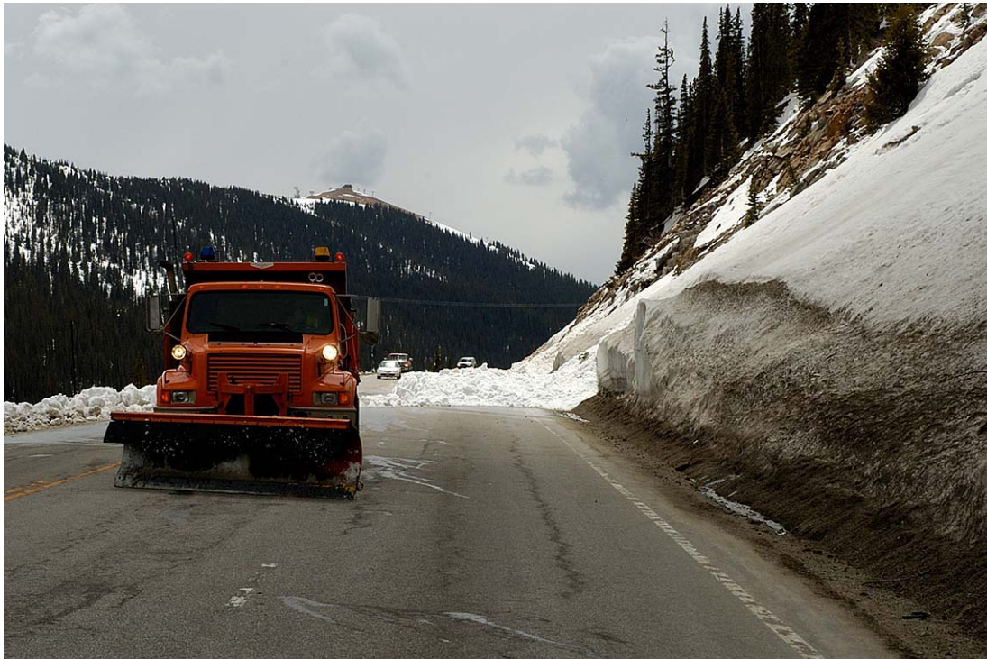
Loveland, Rocky Mountain

ganska fjantiga. I stället för att ploga bort metervis med snö från vägarna, så stänger man helt sonika av de flesta vägarna i bergen vintertid. Endast de största och betydelsefullaste vägarna hålls öppna, men deras dragning över bergskedjan passerar sällan "hot-spotsen".