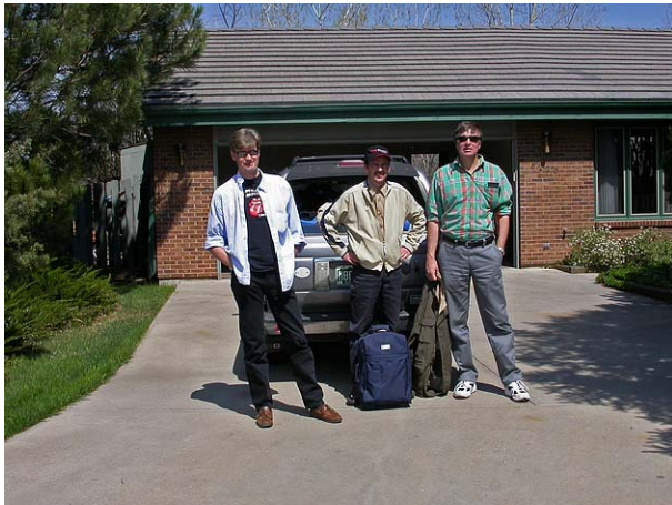
Team Chicken Race

För den som önskar ta del av fler bilder från resan, finns ett urval att beskåda på Oscar's hemsida www.osqar.se , under "Fåglar, utland – Colorado".