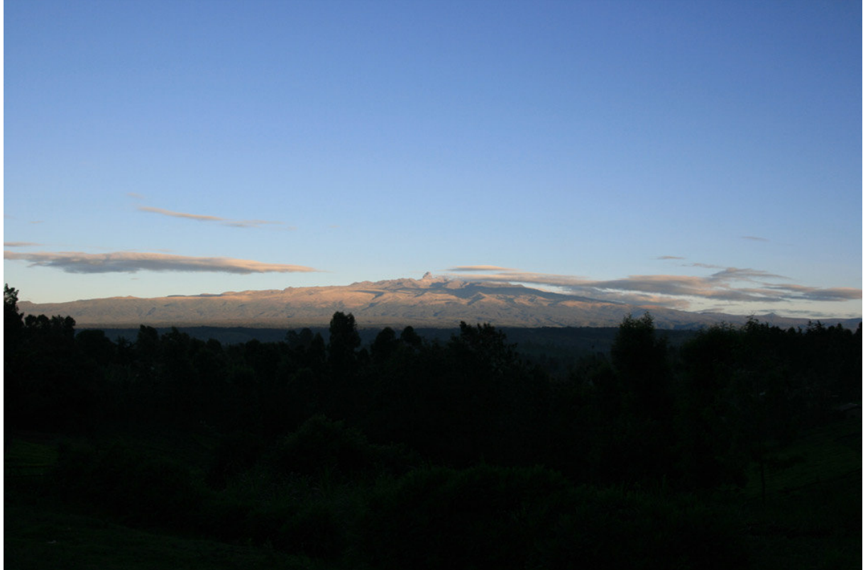
Mount Kenya från söder, strax efter soluppgången.