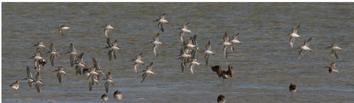
Tereksnäppor flyger in för landning i Mida Creek.