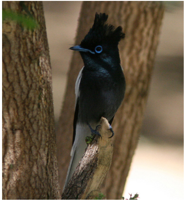
Northern White-faced Owl and African Paradise-Flycatcher vid Lake Baringo.

förmån. På eftermiddagen rullade mörka moln in österifrån medan vi åkte iväg till West Bay för att försöka se Lichtenstein's Sandgrouse m.fl. Det blev inte så många fåglar sedda innan regnet kom, men några nya i form av Black-headed Lapwing och Hunter's Sunbird. Vi gjorde ett fruktlöst försök att spana av stranden, som inte existerade eftersom vattnet gick ända in i skogen, och vi hade ett helt följ med smågrabbar som sprang efter bilen även i regnet. Snart gav vi upp och fick på så sätt en lite tidigare kväll med trevlig middagsgemenskap tillsammans.