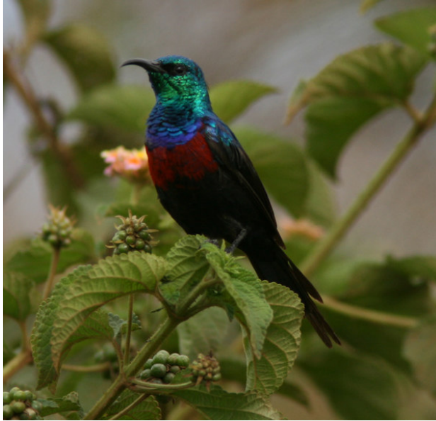
Red-chested Sunbird och African Skimmers, Dunga.

Brown-throated Weaver, Carruthers's Cisticola, Blue-headed Coucal och Water Thick-knee. Sedan flög det förbi ett exemplar vardera av Eastern Grey Plantain-eater och Bare-faced Go-away-bird, märkligt nog tillsammans. En av två flodhästar orsakade lite tumult när vi oavsiktligt lyckades driva upp den på land, farligt nära bebyggelsen. Det hela avlöpte dock väl. Papyrus Gonolek hördes men ville inte visa sig, Greater Swamp-Warbler däremot reagerade på play-back och satte sig relativt välexponerat vid några tillfällen. Woodland och Malachite Kingfishers sågs utmärkt, och African Jacanas fanns i goda antal (dock ingen Lesser). En stor pytonorm som låg i vattnet visade sig vara död (förolyckad i fisknät), och luktade dessutom pyton. Vi fick en bensträckare på en torr holme, och härifrån såg jag som hastigast en dubbelbeckasin i flykten. På tillbakavägen kom de efterlänkade afrikanska saxnäbbarna, en flock på fem individer som bjöd på en mycket fin uppvisning.