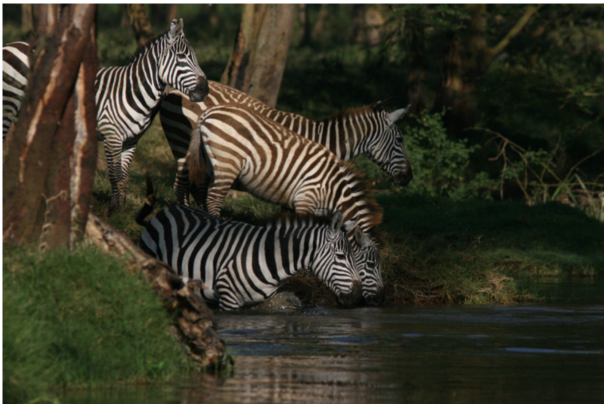
Fulländad skönhet – zebror vid Lake Nakuru.