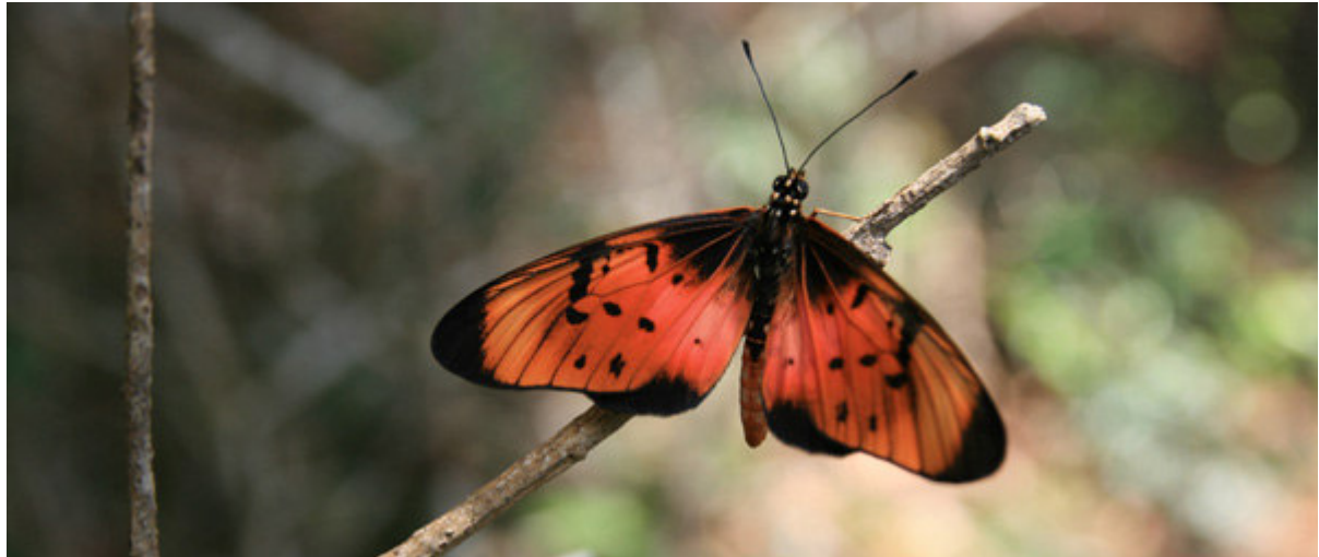
En av många vackra fjärilar i Arabuko-Sokoke Forest.