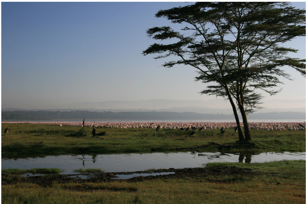
Lake Nakuru och dess många Lesser Flamingos!

För att ta oss till Lake Nakuru i hyfsad tid åkte vi iväg vid 5-tiden. På grund av vägarbeten fick vi ta många alternativa rutter och det var skumpigt värre under större delen av den över två timmar långa färden (nästa gång kommer det att gå på halva tiden!). När vi väl kom fram och alla administrativa detaljer var överstökade dröjde det inte länge förrän vi stod vid Lake Nakurus strand och njöt av de fantastiska vyerna som mötte oss. Det var tjockt med Lesser Flamingos i sjön, bufflar och zebror betade i omgivningarna och det fanns massor med fåglar i övrigt. Vi hade fullt upp med att suga in oss alla intryck och dokumentera med kamerorna. En förbiflygande krontrana gav ett utmärkt fotoläge och ett gäng zebror som drack/simmade över en bäck utgjorde ett absolut förstklassigt motiv. En Spotted Hyena lunkade i strandkanten och skrämde upp flamingos i sin väg. Tiden rann snabbt iväg. Planen var att vi skulle bege oss till Baboon Cliffs innan det blev allt för varmt, men hela tiden fick vi stanna