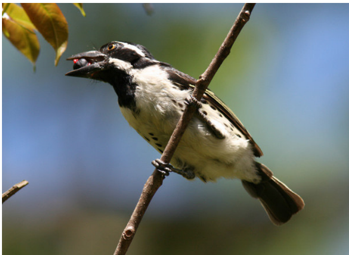
Spot-flanked Barbet, Thika.