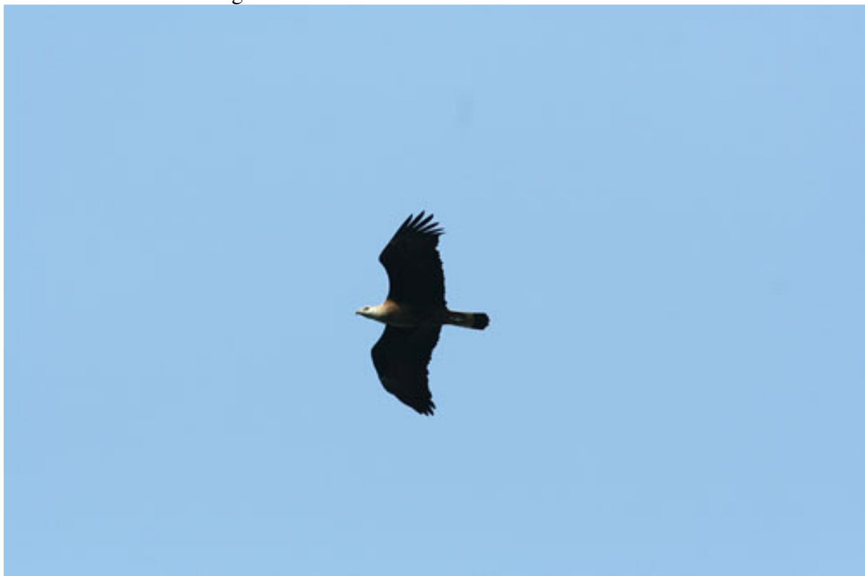
Pallas's Fish Eagle

Skådningen i Corbett sker nästan uteslutande från fordon, vi hade en öppen liten indisk jeep (Maruti Gypsy) som erbjöd fri sikt åt alla håll där vi stod på flaket. På vissa ställen får man gå ur bilen och skåda och på något ställe finns ett fågeltorn. Till stor del är parken täckt av tät skog (Sal-träd) och i skogen kommer ofta fåglarna i grupper med varierande sammansättning, men märkligt ofta är ett hackspett och en nötväcka med mesarna, sångarna, minivetterna mm. Corbett är tack vare sommarens monsun stängd fram till mitten av november men nu i början av december var det riktigt torrt.