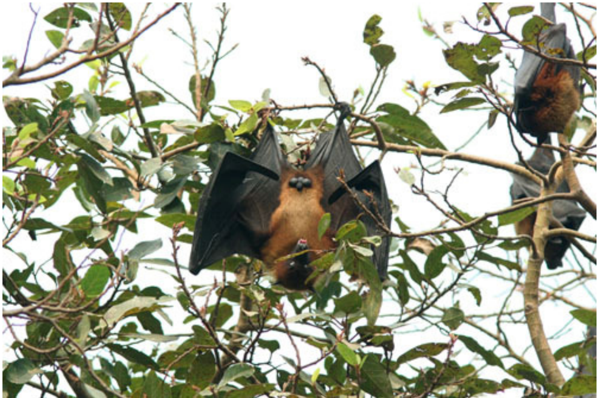
Indian Flying Fox