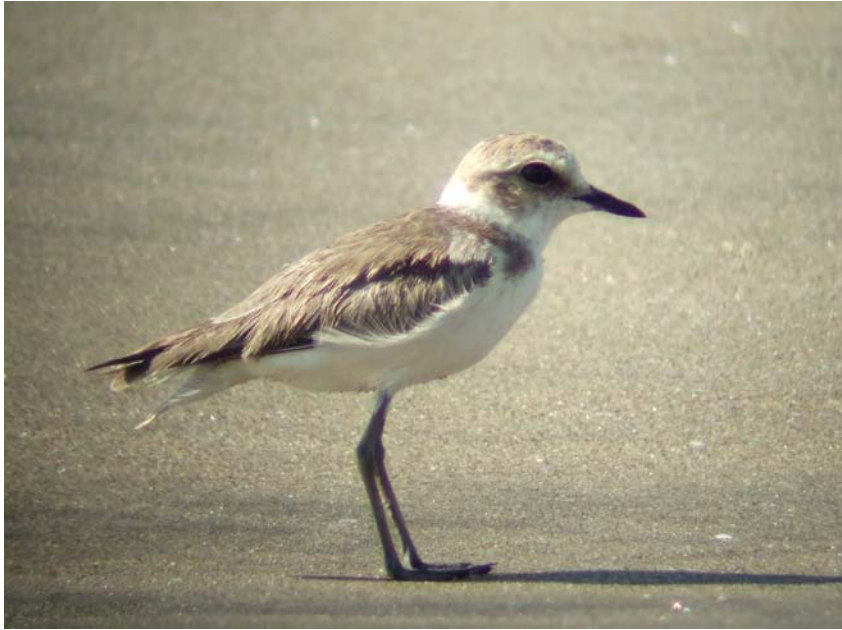
Lesser Sandplover Charadrius mongolus

15 ex vid bron över Chapora river, ca 300 ex Morjim Beach 28/12, 20 ex Morjim 30/12