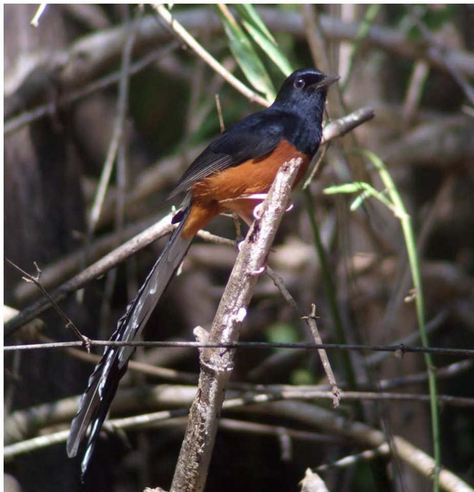
White-rumped Shama. Bondla