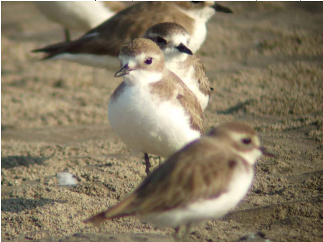
Greater Sandplover Charadrius leschenaultii

15 ex vid bron över Chapora river, ca 300 ex Morjim Beach 28/12, 20 ex Morjim 30/12