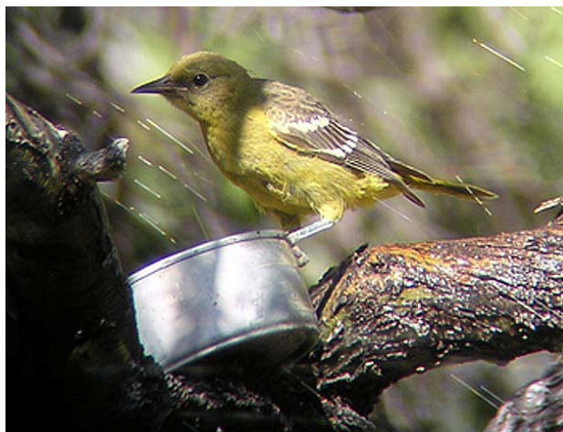
Scotts trupial, Ash Canyon, 050630