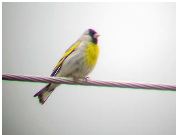
Kaliforniensiska, Mines Road, 050619

Så är det äntligen dags att utforska den spännande fågelfaunan i Diablo Range. Tidigt på morgonen kör vi mot Mines Road, och vi har inte hunnit köra mer än ett par meter in på Mines Road i utkanten av Livermore innan endemen gulnäbbad skata enkelt kan hängas in – den står vid vägkanten! Naturen längs med vägen är bedårande med ek- och buskskogar och gräsmarker. Vid MP 8.38 stiftar vi bekantskap med en rad nya arter, t ex västlig pivi , västlig gråmes , chaparral-spett och svart silkesflugsnappare . Vid den klassiska lokalen för kaliforniensiska , d v s brandstationen i närheten av MP 5.0, lyckas vi till vår stora glädje få in en hanne och en hona av målarten! Efter att ha fikats en stund på kaféet vid MP 5.0, bestämmer vi oss för att gå en stund söderut på San Antonio Road. Belöningen för ansträngningen kommer snart – vi får njutobsar av tre kråkspettar som födosöker på för hackspettar högst otypiskt sätt.