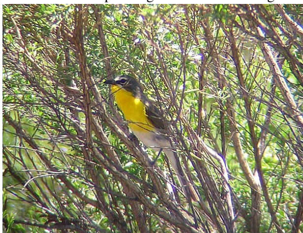
Trastskogssångare, Lake Hodges, 050623