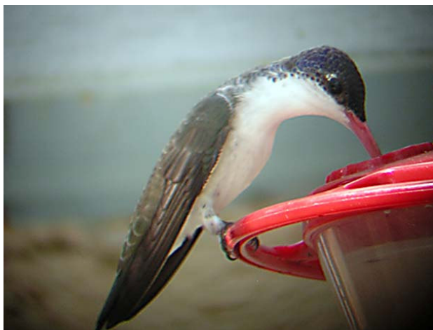
Vitbröstad kolibri, Paton home, 050628

Eftersom vi upplevde Kino Springs som en spännande lokal börjar vi dagen med att slita där. Vid den första dammen sitter en rödbrun fibi och i ett träd sitter en gråvråk fint. Vid Kino Springs Golfcourse är det gott om fågel, men enda nya researten är gul skogssångare . Härifrån kör vi vidare till den klassiska lokalen Patagonia Roadside Rest Area . Eftersom