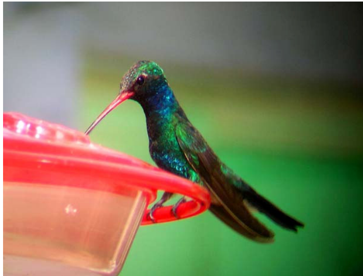
Brednäbbad kolibri, Paton home, 050628