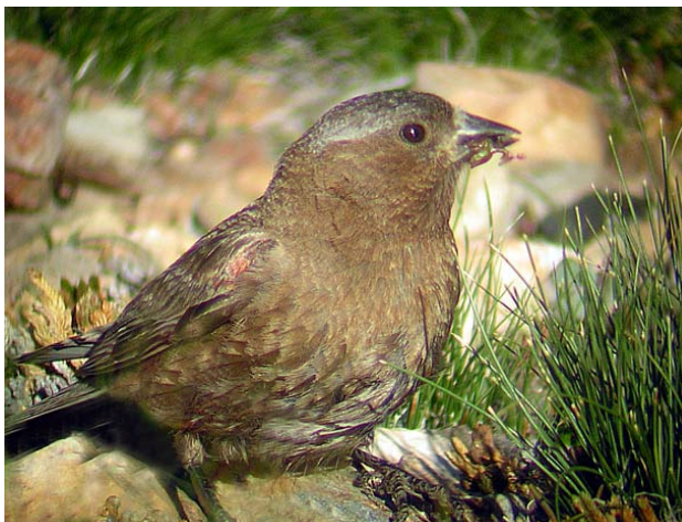
Gränackad alpfinck, Tioga Lake, 050707

Den sista sträckan in mot stängda White Wolf Campground är spärrad, så det är bara att parkera bilen och gå längs med den asfalterade vägen. Detta ska vara den säkraste lokalen i hela Yosemite för tallbit , men vi lyckas inte se några sådana. Besöket är ändå lyckat för här får vi in bl a eremitskogssångare och rödhuvad savspett . Dagen avslutar vi i glaciärurgröpta Yosemite Valley. Vi parkerar i Yosemite Village och går den korta sträckan till området nedanför Yosemite Fall där vi i skymningen får möjlighet att studera svarta seglare som kretsar ovanför vattenfallet – fantastiskt! Eftersom det är förbjudet att övernatta i bil inne i nationalparken tillbringar vi natten sovande i bilen strax väster om Big Oak Flat Entrance.