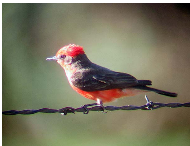
Rubintyrann, Rio Rico, 050626

Från campingplatsen utgår en stig, Bog Springs Trail , och vi börjar dagen med att gå denna. Inledningsvis är det väldigt fågeltomt – det enda vi ser är några sonoratofsmesar . Efter en halvtimmes vandring hör vi dock något som får oss bägge att reagera starkt – vi hör en ropande kopparstjärtstrogon ! Ropet kommer närmare och försvinner igen, och det dröjer en lång stund innan vi äntligen får se arten – vilken skönhet! Sedan följer ytterligare en halvtimmes vandring utan något nytt. När vi börjar närma oss källan smäller det dock plötsligt till, överallt runt oss finns det fåglar, och vi får stifta flera