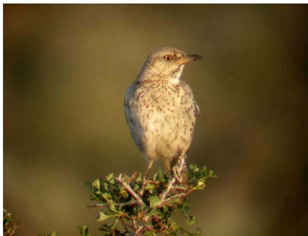
Buskhärmtrast, Sagehen Summit, 050705

För att vara på plats när Bodie State Historic Park öppnar klockan åtta lämnar vi övernattningsplatsen tidigt. Målsättningen med detta besök är att få se strålstjærtshöna , en art som enligt litteraturen är möjlig att se här tidigt på morgonen innan turisthorderna skrämt iväg dem. Några minuter efter öppningsdags är vi på plats. Själva spökstaden med sina välbevarade byggnader