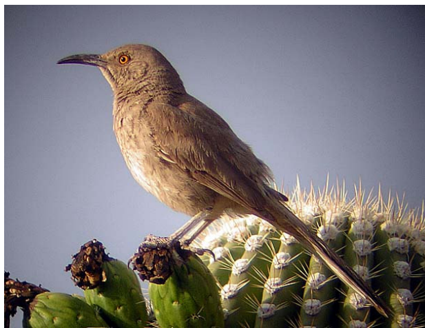
Bågnäbbad härmtrast, Shannon Road, 050625

Efter några felkörningar lyckas vi så småningom hitta till korsningen mellan Broadway och Shannon Road i Tucsons utkanter. I de lugna villakvarteren går vi runt i någon timme och hänger in nya arter på löpande band: cassins kungstyrann , bronskostare , ökenkardinal