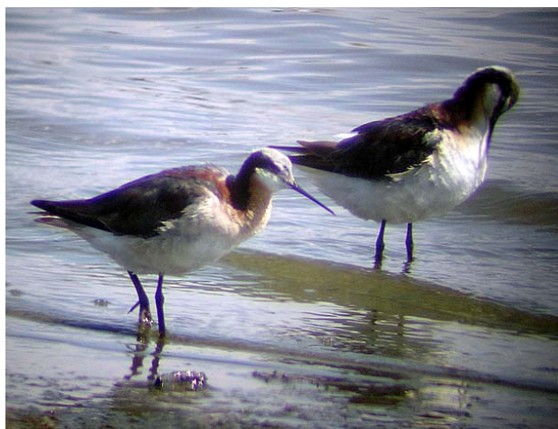
Wilsonsimsnäppa, Cochise Lake, 050702