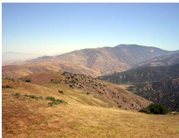
Utsikt från Los Padres National Forest Sign, 050621

Efter att ha "avnjutit" motellfrukosten, d v s blaskigt kaffe, vattmig juice och fettdrypande donuts, påbörjar vi körningen mot Mt Pinos. Strax efter det att vi svängt av från Hwy 166 in på Cerro Noroeste Road gör vi ett första skådarstopp vid något så unikt som ängsmarker i detta i övrigt så ökenartade landskap. Här ser vi bl a några västliga ängstrupialer och en prärievråk . Efter ytterligare några kilometer stannar vi vid Los Padres