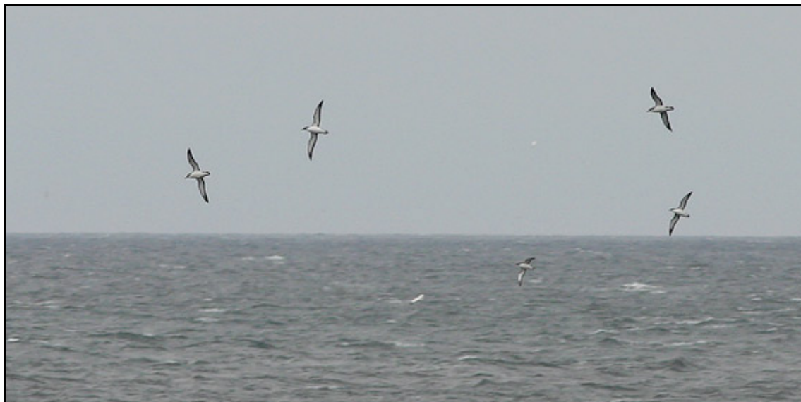
Mindre liror i bågflykt vid Gardskagi

Några 2K vittrutar visade pedagogiskt upp de individuella dräktvariationerna. Trädmåsen som funnits i området såg vi dock inte skymten av.