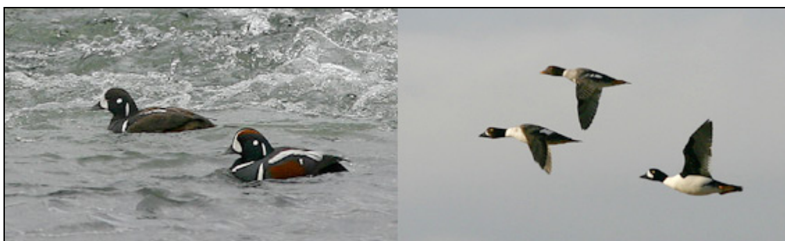
Strömand (2K och adult hane) och islandsknipa (2K hane, hona och adult hane) ses mycket bra i Laxáälven

Vid Godafoss, någon mil innan Mývatn, såg vi runt 100 spetsbergsgäss och en del grågäss som betade på en åker. I vackert kvällsljus nådde vi fram till Laxáälven vid Mývatn. Att få se 10-20 strömander och lika många islandsknipor på bara ett 20-tal meter i strömmande vatten var ett magiskt ögonblick! Tiden stod stilla, solen värmdes och vi bara njöt.