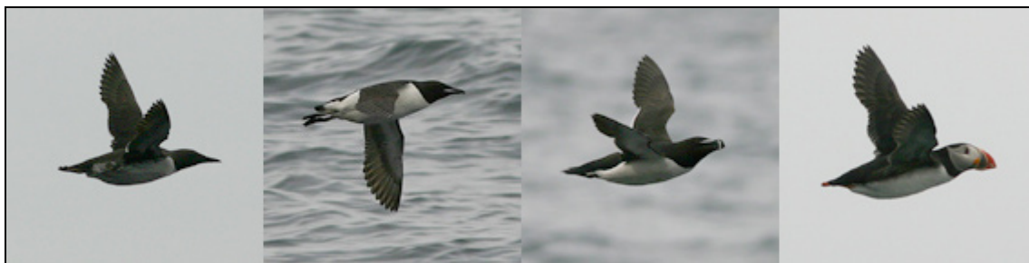
Fyrtal i alkor vid Raudinúpur

Efter lunch begav vi oss till fågelberget Raudinúpur på nordvästspetsen av Mellrakkasletta. Fortfarande rådde dimma, som ena stunden lättade, för att i nästa tätna, igen. Stigen från Núpsskatl (där man parkerar bilen) till Raudinúpur är belägen på en ås längs med kustlinjen. Denna ås visade sig vara rena motorvägen för tretåig mås och en del stormfåglar, på väg till eller från fågelberget. På klipphyllorna i berget trängdes tordmular, sill- och spetsbergsgriissor tillsammans med tretåiga.