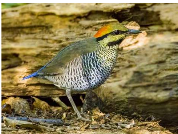
Blue Pitta – Hydrornis cyaneus (Blå juveltrast)

En hona vid gömsle Di Linh 27/1.