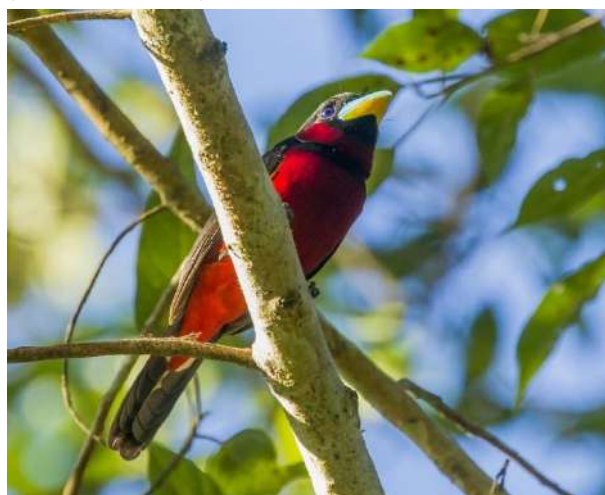
Black-and-red Broadbill – Cymbirhynchus macrorhynchos (Svartröd brednäbb)

Observerad i Cat Tien NP; 1 ex hörd 23/1, 2 ex sågs 24/1 samt 1 ex sågs 25/1.