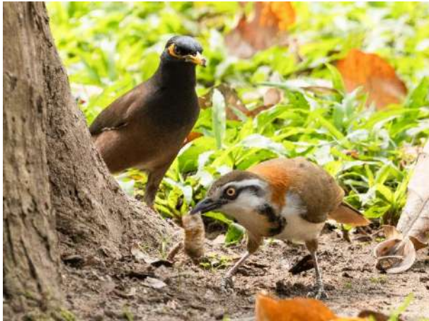
Lesser Necklaced Laughingthrush – Garrulax monileger (Mindre halsbandsfnittertrast)

1 ex sågs första dagen 20/1, nära vårt hotell, på gräsmattan i parken vid Dinh Dôc Lâp. Common Myna – Acridotheres tristis i bakgrunden.