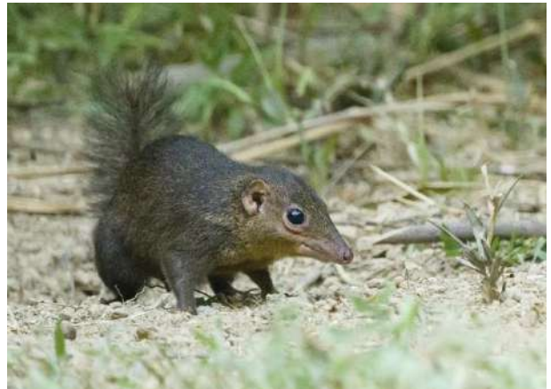
En däggdjursart som igår i familjen spetsekorrar. Främst sedd från gömslen, vid matningar.