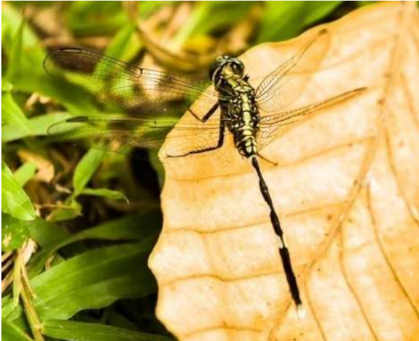
Självständighetspalatsparken, Saigon 20/1.