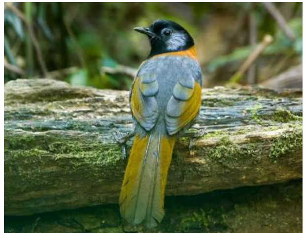
Collared laughingthrush – Trochalopteron yersini (Rostkragad fnittertrast)

En av många vackra fnittertrastar. 5 ex Da Lat 28/1.