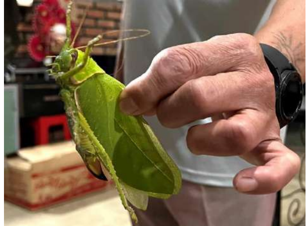
Ngoch Linh 4/2. En av världens största vårtbitare med en vingdiameter bortåt 25 cm.