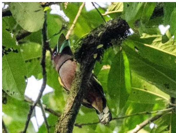
Banded Broadbill – Eurylaimus javanicus (Bandad brednäbb)

1 ex Cat Tien NP 25/1.