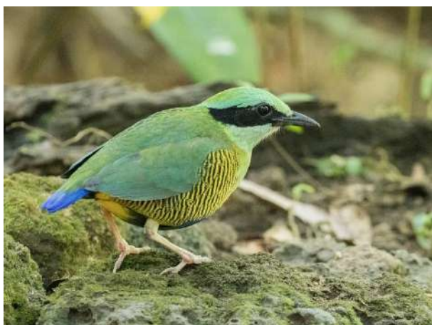
Bar-bellied Pitta – Hydrornis elliotii (Smaragdjuveltrast)

3 ex Cat Tien NP 24/1.