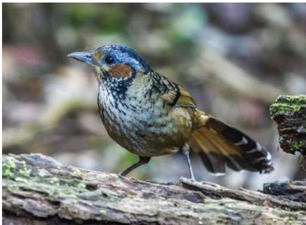
Chestnut-eared Laughingthrush – Lanthocincla konkakinensis (Konkakinfnittertrast)

Black-hooded laughingthrush – Garrulax milleti (Svarthuvad fnittertrast); 10 ex i ljudlig flock i skogen, Mang Den 3/2.