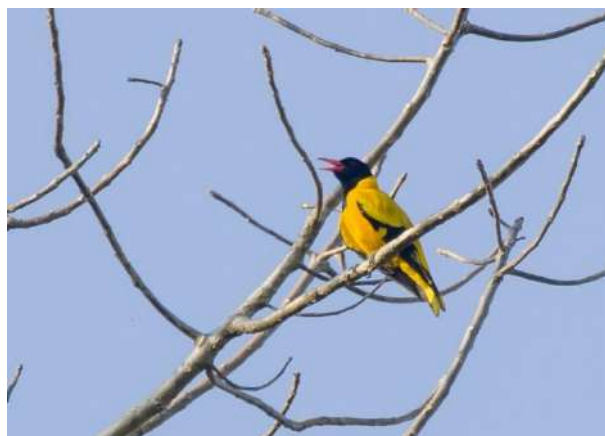
Black-hooded Oriole – Oriolus xanthornus (Orientgylling)

6 obs-dagar, totalt 14 ex, med de flesta sedda i Cat Tien NP 23 - 26/1.