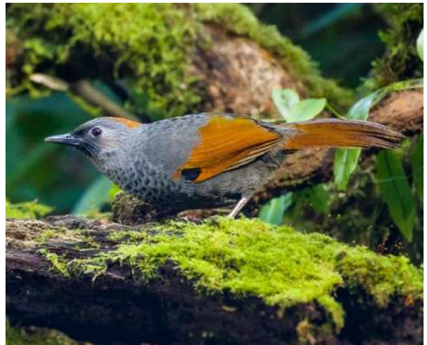
Golden-winged Laughingthrush – Trochalopteron ngoclinhense (Gråryggig fnittertrast)

Vacker endem som inte var given på resan. 1 ex sågs fint från gömsle Mang Ri 5/2.