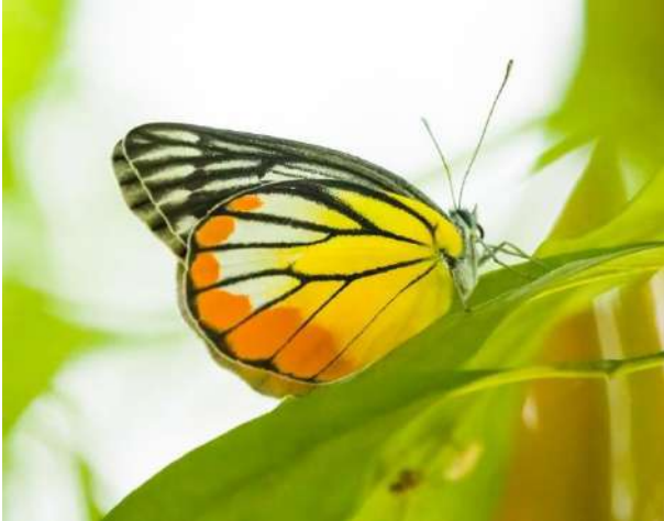
Saigon Zoo 21/1.