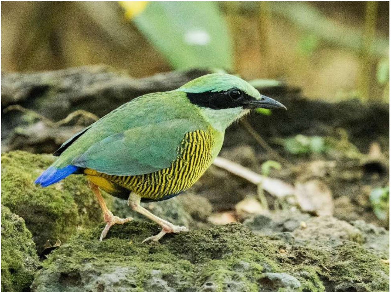
Bar-bellied Pitta – Hydornis elliotii (Smaragdjuveltrast)