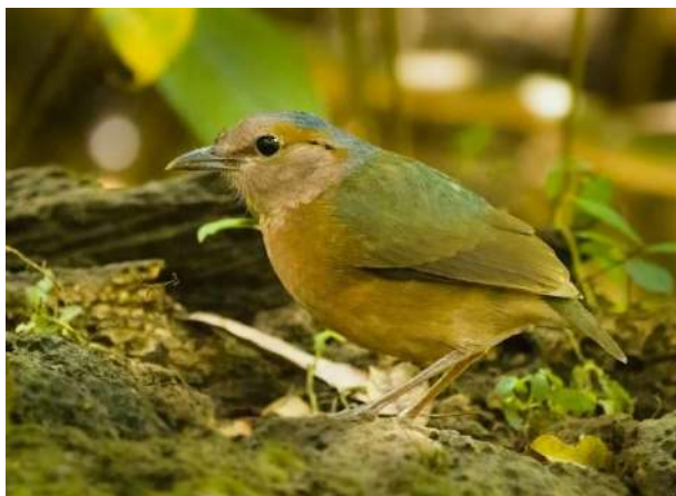
Blue-rumped Pitta – Hydrornis soror (Blågumpad juveltrast)

Ett par (hane och hona) sågs i Cat Tien NP 24/1.