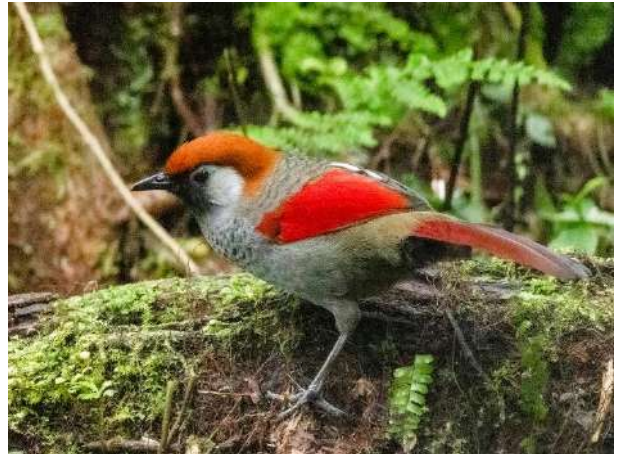
Red-tailed Laughingthrush – Trochalopteron milnei (Rödstjärtad fnittertrast)

White-cheeked Laughingthrush – Pterorhinus vassali (Vitkindad fnittertrast); 10 ex nära ett gömsle i Da Lat 28/1.