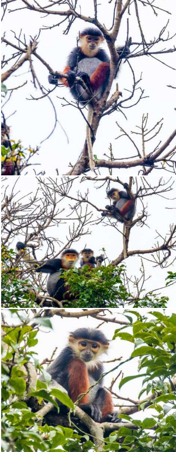
7 ex Son Tra Peninsula, Da Nang 7/2.