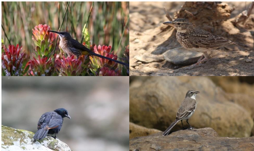
Cape Sugarbird, Large Billed Lark, Redwinged Starling, Cape Wagtail