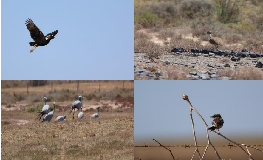
Southern Black Korhaan, Karoo Korhaan, Blue Crane, African Stonechat