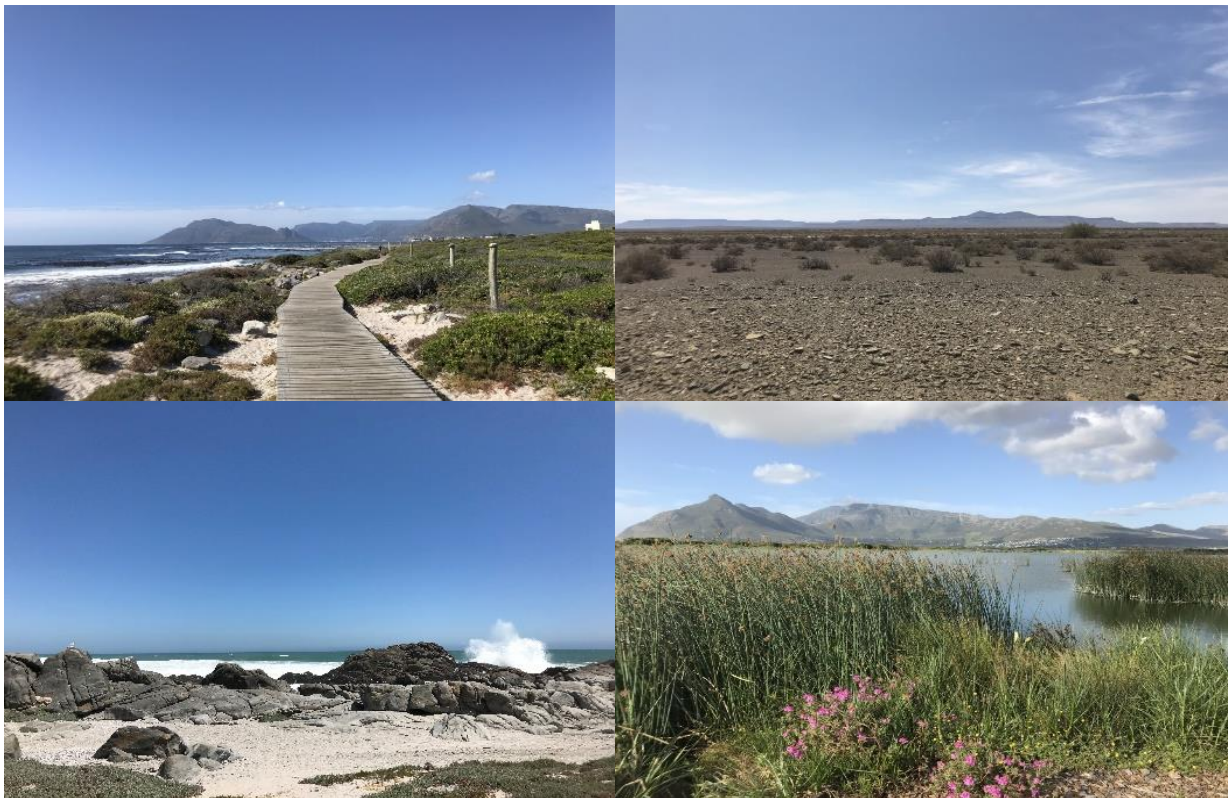
Kommetjie, Karoo, Tsaarbank, Wildevoëlvlei

Den sydafrikanska randen kostade 64 öre/rand så boende, bilhyra, bränsle och mat var billigt när vi var där. Landet är vackert och människorna är trevliga och hjälpsamma. Åk till Kapprovinsen, du blir inte besviken!