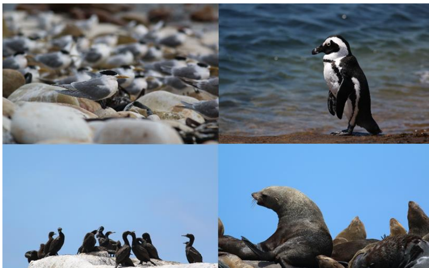
Crested Tern, African Penguin, blandning av Bank och Cape Cormorants, South African Fur Seal.